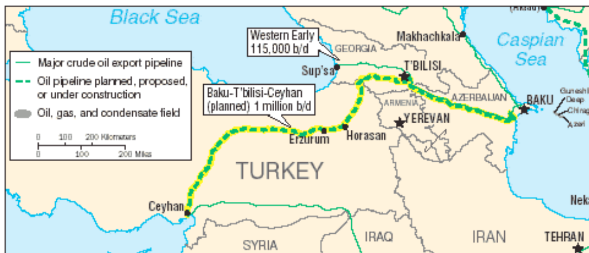
1. ábra Olajvezetékek Azerbajdzsánból