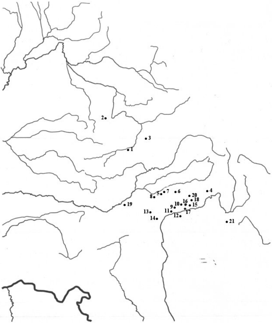
A kádárinasok származási helye (1582–1665) 1046

1046 1. Kolozsvár 6 fő. 2. Debren (Közép-Szolnok vm) 1 fő. 3. Cég (Doboka vm) 1 fő. 4. Kaca/Katzenorf (Kóhalomszék) 1 fő. 5. Szászegerbég/Arbegen (Medgyesszék) 1 fő. 6. Berethalom/Birtheim (Medgyesszék) 2 fő. 7. Muzsna (Medgyesszék) 2 fő. 8. Kisselyk/ Klein Schelken (Medgyesszék) 1 fő. 9. Újegyház/Leschkirch (Újegyházsék) 3 fő. 10. Kürpöd/Kirchberg (Újegyházsék) 4 fő. 11. Holczmány/Holzmengen (Újegyházsék) 1 fő. 12. Kerc/Kertz (Szebenszék) 2 fő. 13. Omlás/Hamlesch (Szebenszék) 1 fő. 14. Nagydisznód/Helthau (Szebenszék) 1 fő. 15. Nagysink/ Gross Schenk (Nagysinkszék) 5 fő. 16. Rozsonda/Rosslen (Nagysinkszék) 2 fő. 17. Mártonhegy/Matrelsborg (Nagysinkszék) 1 fő. 18. Neustadt/Újváros (Nagysinkszék) 1 fő. 19. Szászsebes/Müllenbach (Szászsebeszék) 1 fő. 20. Neidhausen/Netus (Segesvárszék) 1 fő. 21. Prázsmár/Tartlen (Brassóvidék) 1 fő.