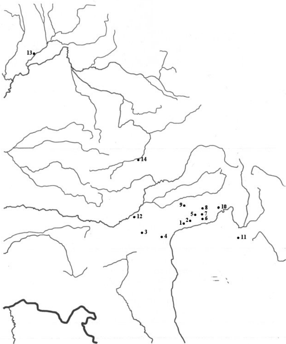
A kerekésinasok származási helye (1600–1642) 1047

1047 1. Újegyház/Leschkirch (Újegyházszerék) 4 fő. 2. Kürpöd/Kirchberg (Újegyházszerék) 1 fő. 3. Szászorbó (Szerdahelyszerék) 1 fő. 4. Szeben (Szebenszerék) 2 fő. 5. Apátfalva/Apesdorf (Szebenszerék) 1 fő. 6. Nagysink/Gross Schenk (Nagysinkszerék) 5 fő. 7. Morgonda (Nagysinkszerék) 2 fő. 8. Báránykút/Brekolten (Nagysink szerék) 2 fő. 9. Berethalom/ Birtelm (Medgyesszerék) 1 fő. 10. Kóhalom/Reps (Kóhalomszerék) 1 fő. 11. Prázsmár/Tartlen (Brassóvidék) 3 fő. 12. Alvinc (Alsó-Fehér vm) 1 fő. 13. Sárospatak (Zemplén vm) 1 fő. 14. Kolozsvár 11 fő.