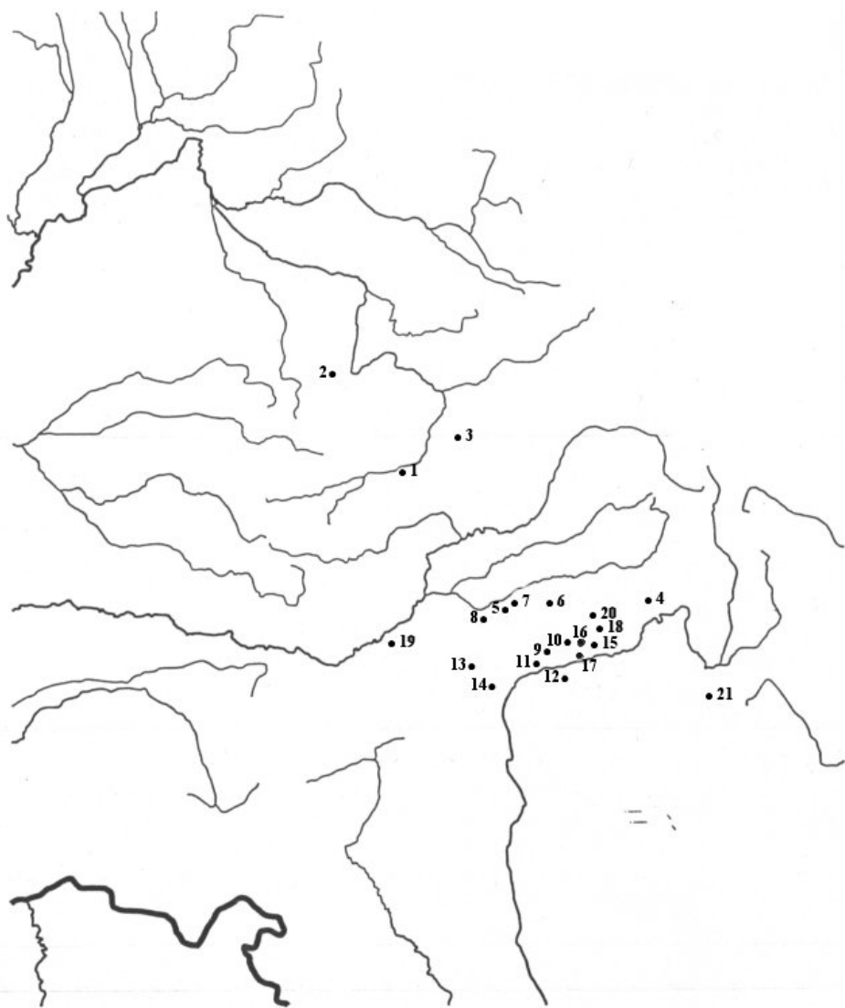
A kádárinasok származási helye (1582–1665) 1046