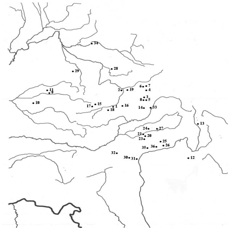
A polgárkönyvben szereplő iparosok származási helye (1587–1614) 1045