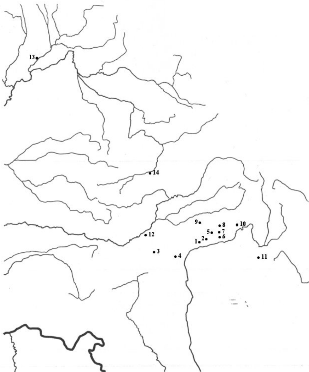
A kerekésinasok származási helye (1600–1642) 1047