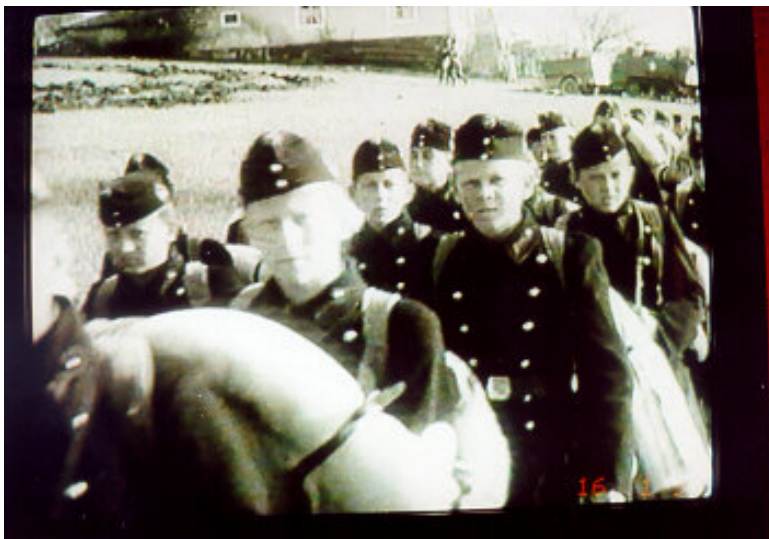
Az alsósok amerikai hadifogságban USA haditudósítók felvétele, 1945