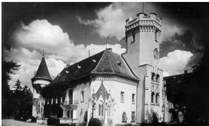
A kastély a kápolna felől