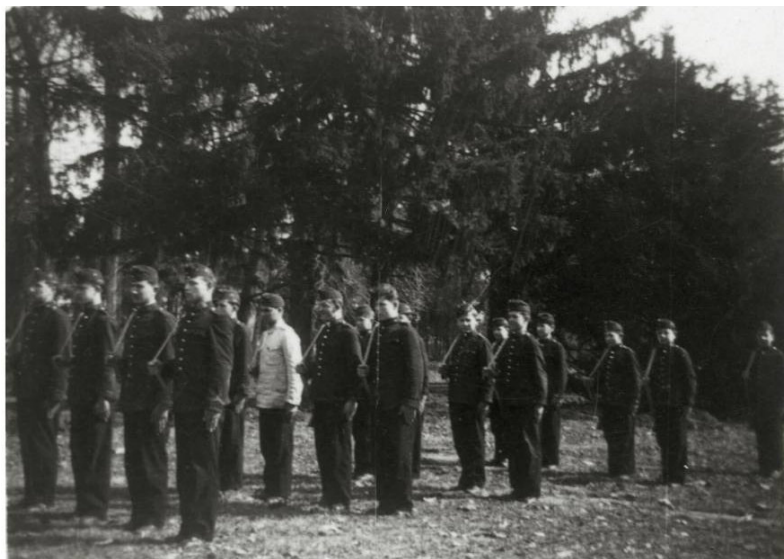
Török szaki szavaival: a vigyorgó szakasz