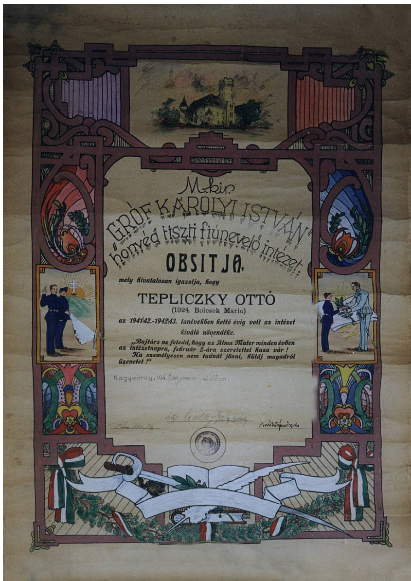
Tepliczky Ottó obsitja 1943-ból Tervezte és rajzolta: Czelnai Lajos Rudolf (akkor 11 éves) és Tornai István (akkor 12 éves)