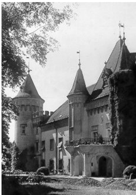
A kastély főbejárata