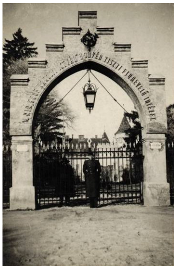
Az Intézet főbejárata