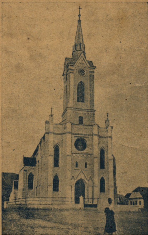
A szépvízi 3 tizedes kath. templom.