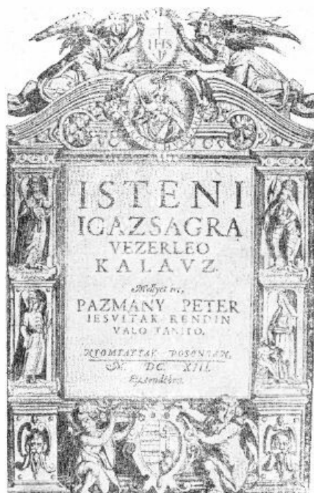
Pázmány Péter «Igazságra vezető Kalauz» című műve első kiadásának címlapja.

zókben adja elő: «A cenzurát Magyarországon nem lehetett elismerni. Egy ügyben nem a hivatott forum, a magyar országgyűlés, hanem I. Ferdinánd császár önhatalmilag intézkedett, midőn az 1529-iki birodalmi gyűlés elnapolása után elrendelte, hogy minden nyomtatvány, kinevezett értelmes férfiak által megvizsgáltassék s azokból a hiányos tételek kitörültesse. A visszaélés megvolt s az alattvalók elősmervén