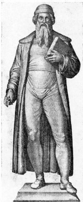
Gutenberg János mainzi szobra.