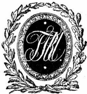
Az egyetemi nyomda nyomda-jegye 1824-ből.

Közben, 1777-ben, áthelyezték a nagyszombati egyetemi nyomdát Budára, mely «M. kir. egyetemi nyomda» név alatt még ma is fennáll s hazánk tekintélyesebb nyomdái közé tartozik. A nyomdát mindjárt kezdetben Mária Terézia a legmesszebbmenő szabadalmakkal ruházta fel és csakhamar irányadó tényezője lett a magyar könyvnyomtatásnak. — A budai egyetemi nyomda már abban az időben birt saját betűöntődével és csinos metszésű betűivel számos vidéki nyomdát is ellátott.