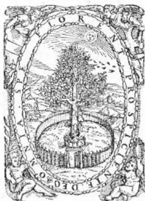
Hoffhalter Ráfáel nyomdajegye.

Felsőmagyarország egyik nagyfontosságú kereskedelmi és politikai városában, Bártfán, 1578-ban Gutgeszell Dávid állított fel nyomdát, melyből 1599-ig számos latin és német nyelvű könyv került ki. Bártfa akkori könyvnyomtatásáról a «Vasárnapi Ujság» 1870. évi 22. számában Eötvös Lajos tollából a következő érdekes sorokat olvassuk: «Gutgeszell Dávid bizo-