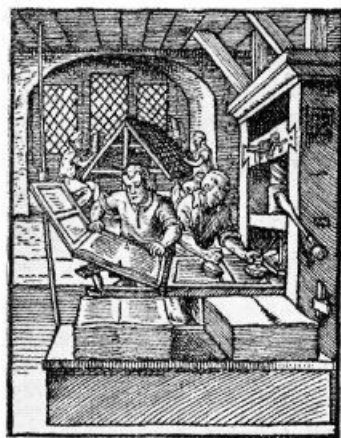
Egy XV. századbeli nyomda belseje.