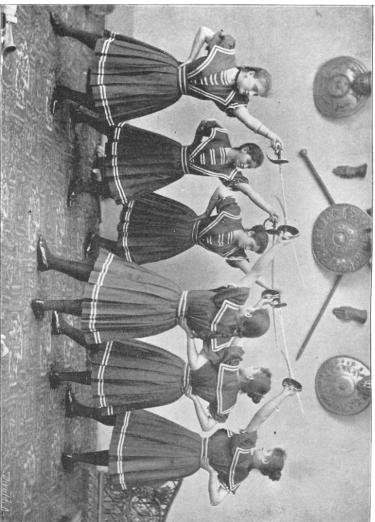
Bal kézzeli gyakorlatok.