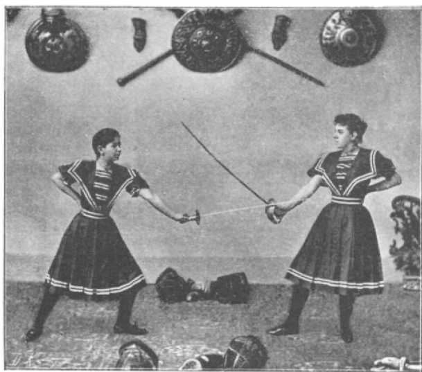
Bal kéz jobb ellen.

Nőtanítványaim különben, a kik a vívótanfolyamot jó sikerrel bevégezték, vezetésem és felügyeiletem alatt készek lesznek bármikor esetleg otthon, a háznál is nemcsak a hölgy-közönségnek, de a leánynövendékeknek is úgy a buzogány-gyakorlatokból, mint a kardvivásból alapos és rendszeres oktatást adni,