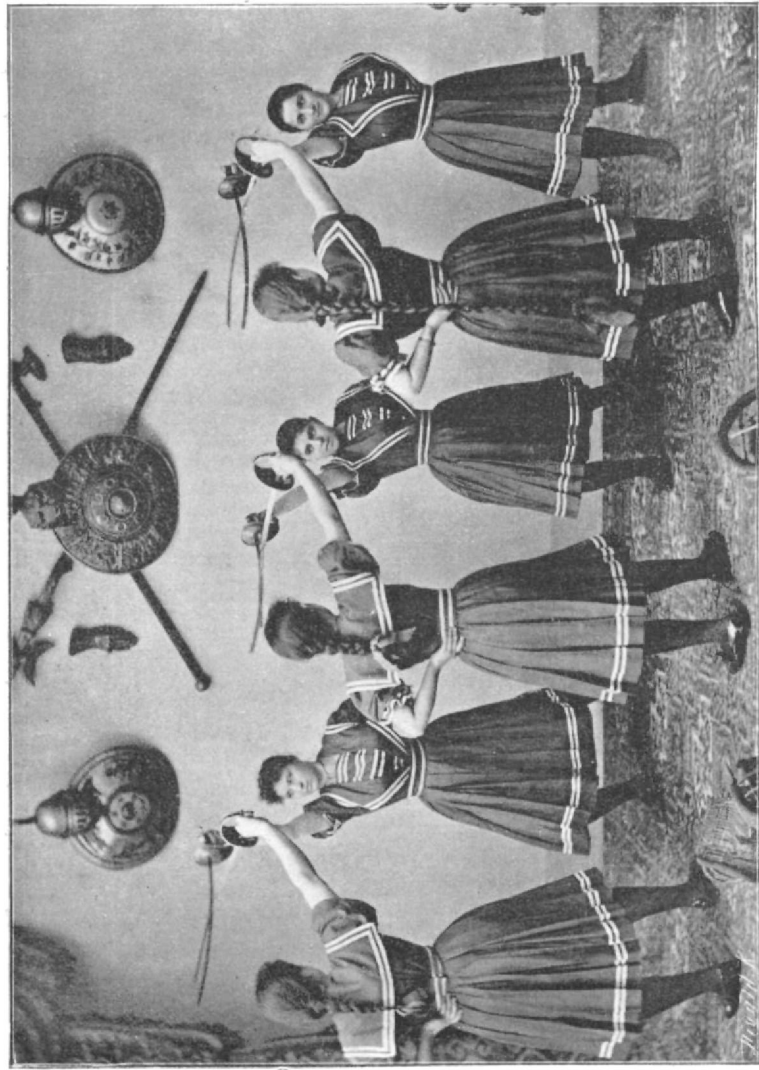
Jobb kézzeli gyakorlatok.