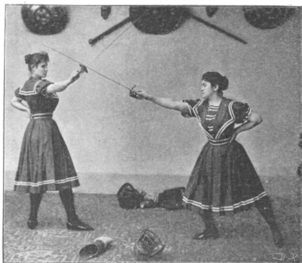
Külső arcvágás és védés.