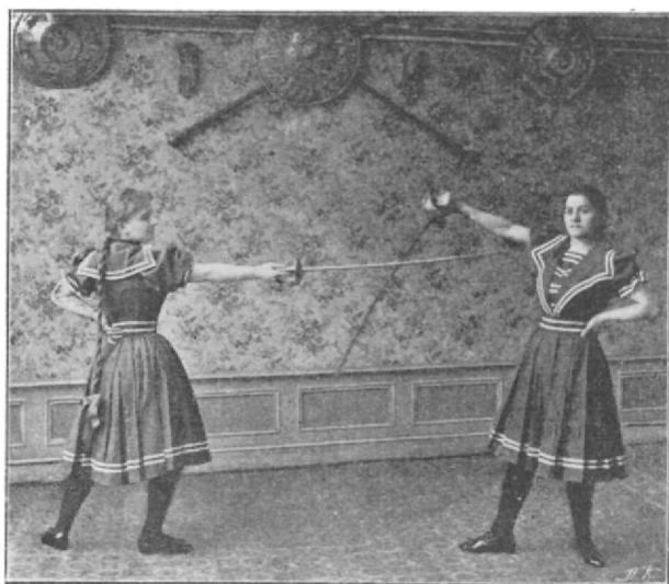
Mellvágás és védés.