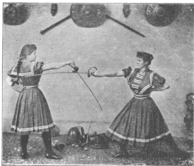
Alsó karvágás és védés.