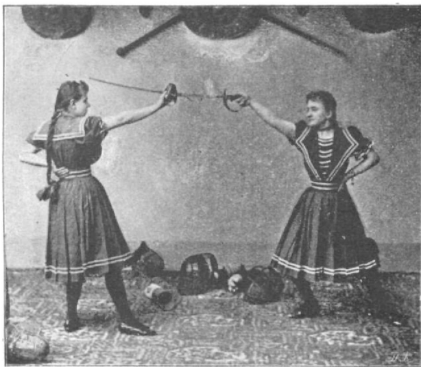
Fejvágás és védés.

Az én nőtanítványaim nemcsak elméletileg , de önmaguk által gyakorlatilag is megmutatták, hogy miként lehetne és miként kellene a magyar kardvívást a női testgyakorlás szempontjából oktatni és tanulni az iskolákban!