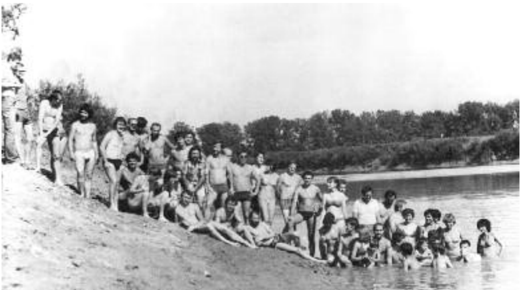
Kerékpártúra a Tisza partján 1981-ben