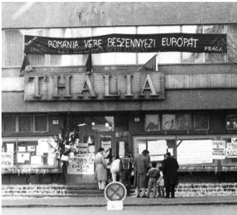
A Thália 1989-ben