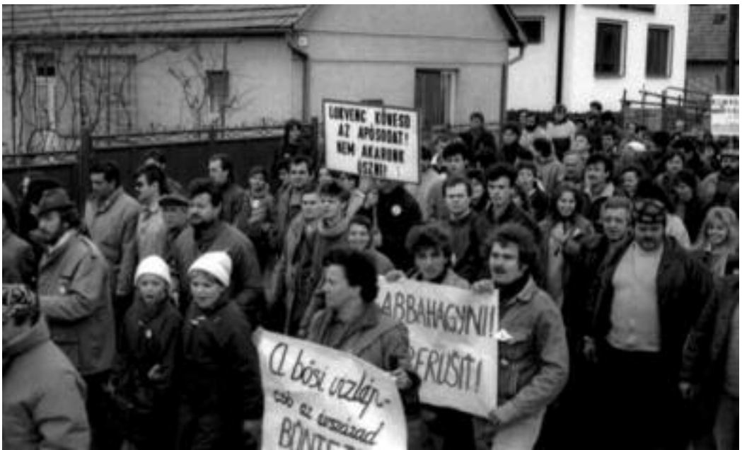
Tiltakozás a bösi vízlépcső ellen