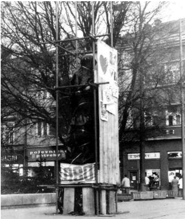
A kassai Gottwald-szobor 1989-ben