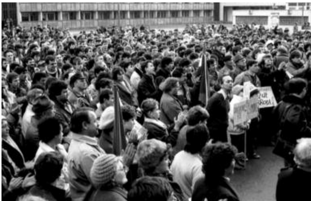
Tüntetés Dunaszerdahelyen 1989 novemberében