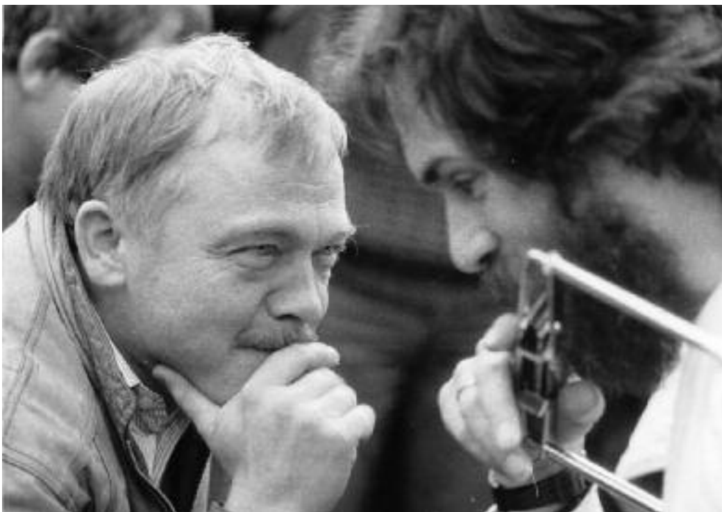
Karel Kryl és Ivan Hoffman