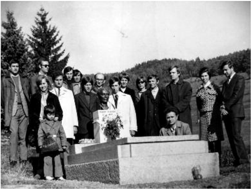
Klubtalálkozó Stószon 1973-ban