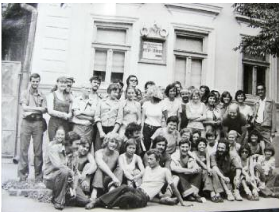
A kerékpártúra megállója Rimaszombatban 1977-ben