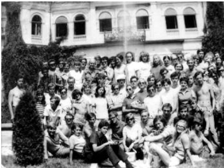
Nyári Ifjúsági Tábor a Szorsok alatt 1971-ben