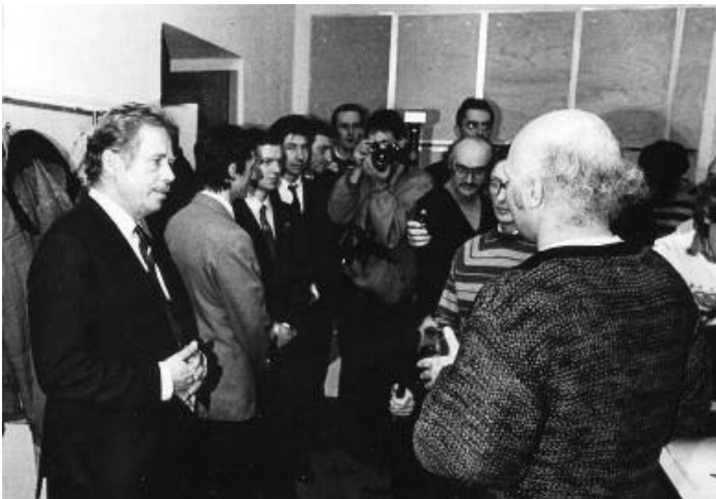
Grendel Lajos Václav Havellel a Nap szerkesztőségében 1990-ben