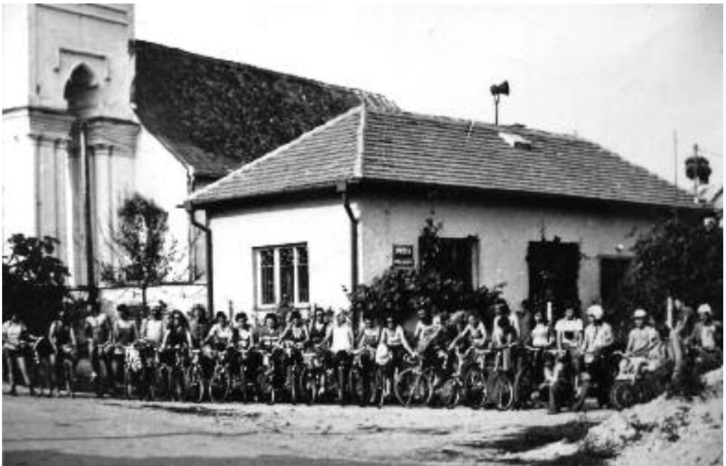
Kerékpártúra Simonyiban (1977)