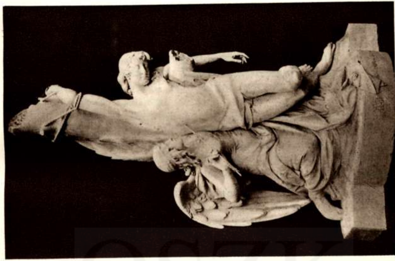
Szent Sebestyén. (Zumbusch-iskola).