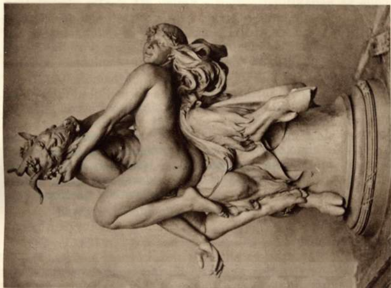
A megszorult Faun.