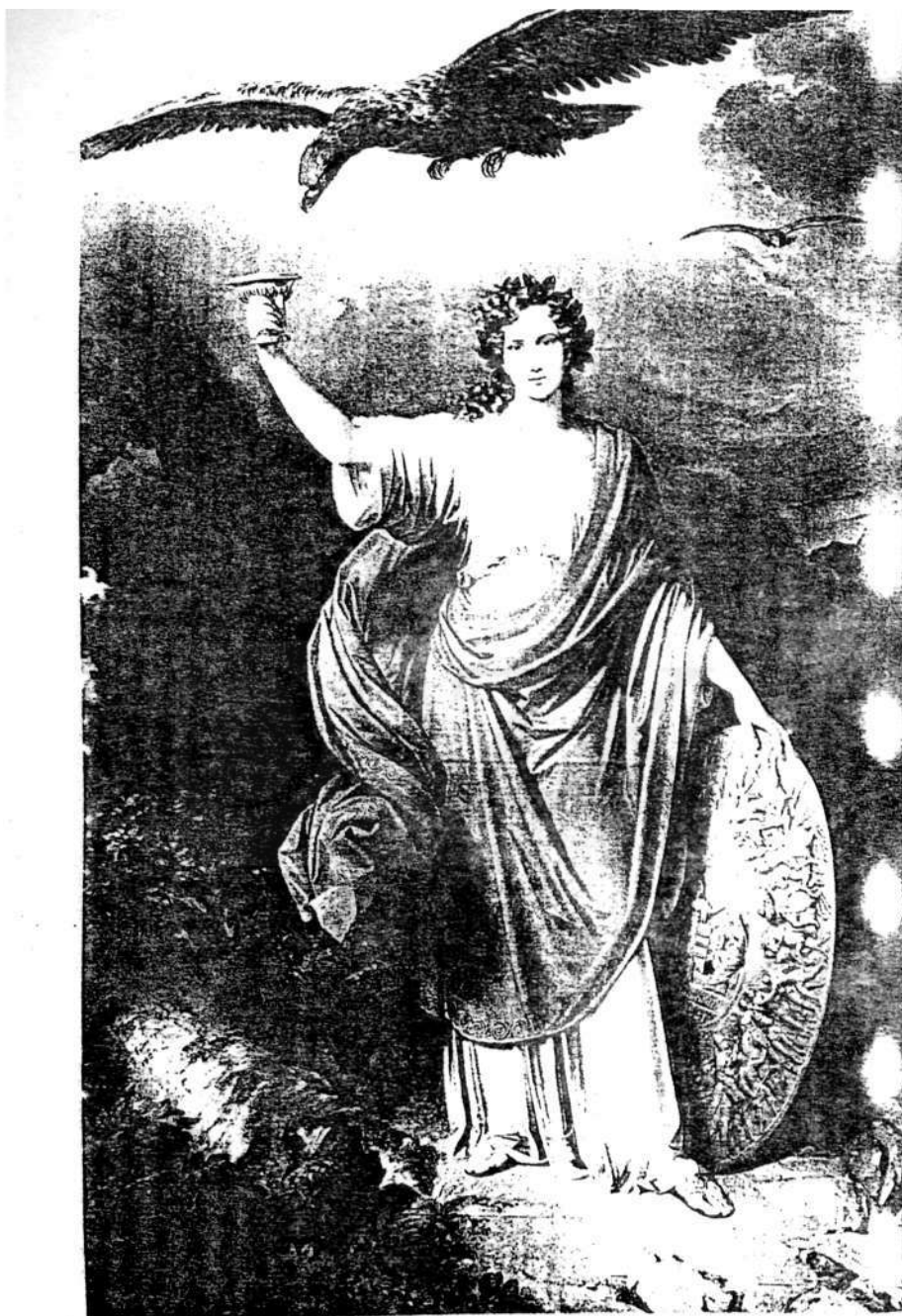
A Magyar Tudományos Akadémia allegóriája, 1831