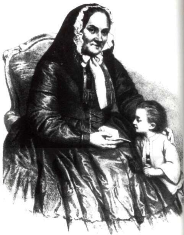
Az idős Brunszvik Teréz (Barabás Tibor rajza)