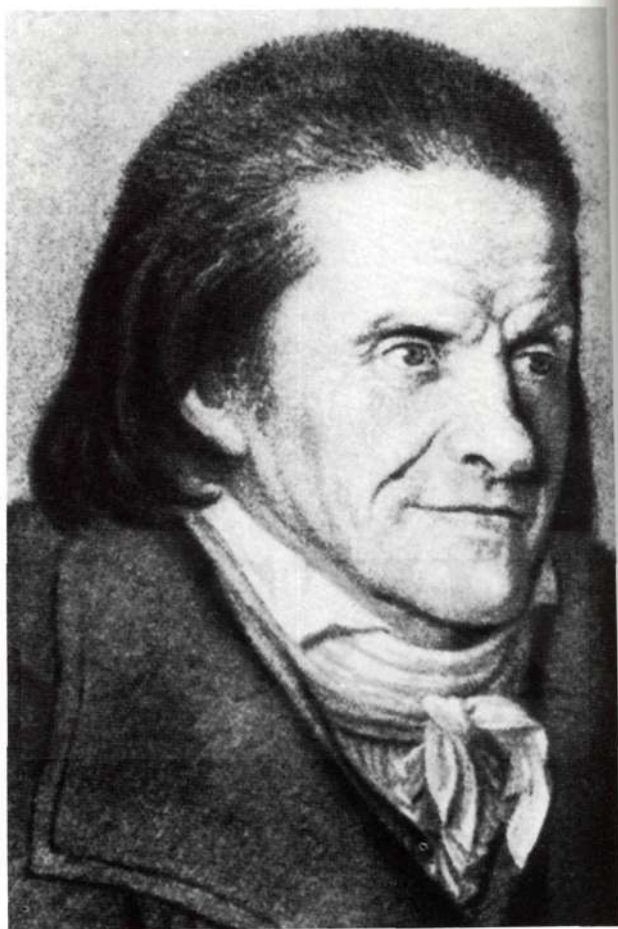
Johann Heinrich Pestalozzi