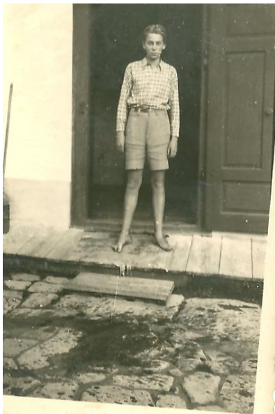
Bandi öcsém a Bede-pusztai „Otthon” előtt

Elgondolkozva ballagtam, mondhatom, hogy elkeseredve. Milyen árva vagyok. Itt megyek egyedül, egy lélek sincs a közelemben, aki a borús gondolataimat elterelné, és megvigasztalna. Egyedül járom az élet útját. És még most ez is: miért kellett megismernem? Miért kellett találkoznunk? Az eredménye mindkettőnknek csak szenvedés és gyötrelem. Mégis: a gyötrődés, ez a fájdalom olyan édes érzés.