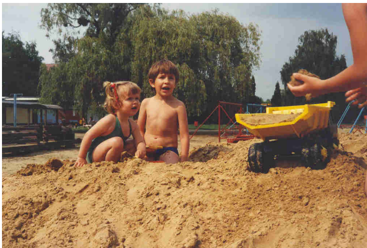
Jó játszani a nedves homokban