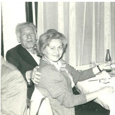
Hévízen - korabeli kép

Életem regényét nagyrészt korabeli naplóim felhasználásá- val, folyamatosan 2002. évtől állítottam össze, a 11. fejezetet elektronikus kiadásra 2010-ben készítettem elő.