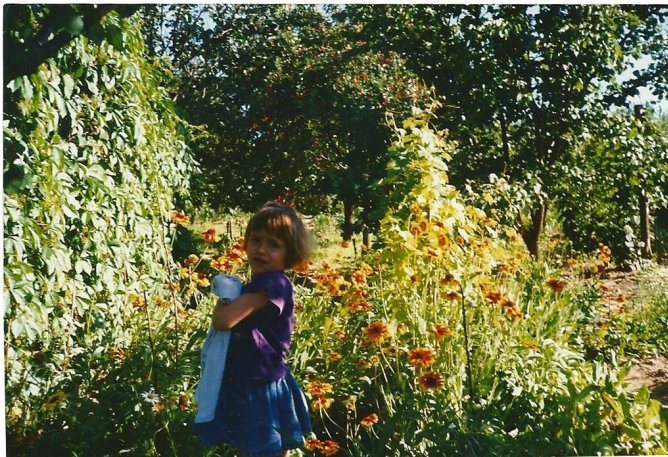
Emese kerti virágok közt

kereket. Nemes facsemetéket hozattam neves kertészetekből. Nemsokára termőre váltak a bokrok és fák, utána sok örömet leltünk a saját termésű gyümölcsökben. A kert tavasztól késő őszig ellátta családunkat mindenféle gyümölccsel.