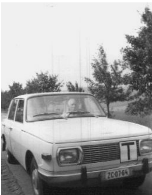
Warbicsek – a fehér Wartburgunk

Budapesten autózva haladtunk a zsúfolt, többsávos Rákóczi úton, mikor megszólal férjürem, hogy térjek át a szélső sávba, mert ott jobbra fordulunk. Kitettem az irányjelzőt, de csak hömpölygött a sok kocsi, egyik se adott elsőbbséget, maradtam hát a helyemen. A férjem meg: – mondtam, hogy fordulnunk kell, miért nem mentél át a másik sávba? Mire én csendesen megjegyeztem: – Máskor hamarabb szólj, mert csak azért, ha bekap- csolom az irány- jelzőt, az én ked- vemért Budapest forgalmát nem fogják leállítani!