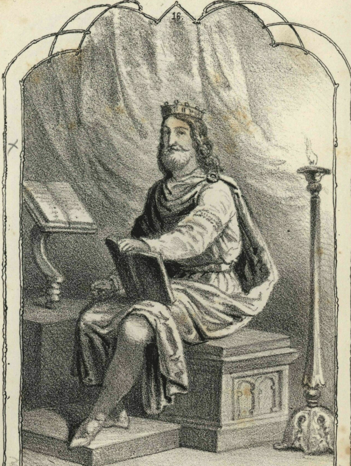
1095. Kálmán 1114†