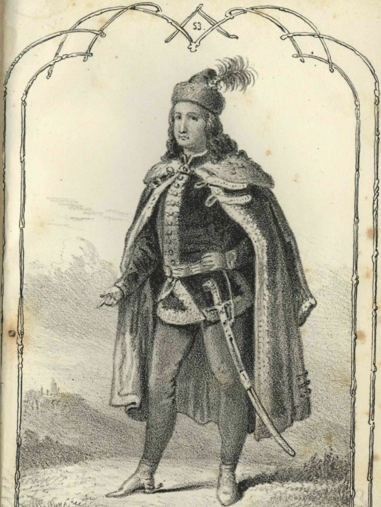
1705 I. József 1711