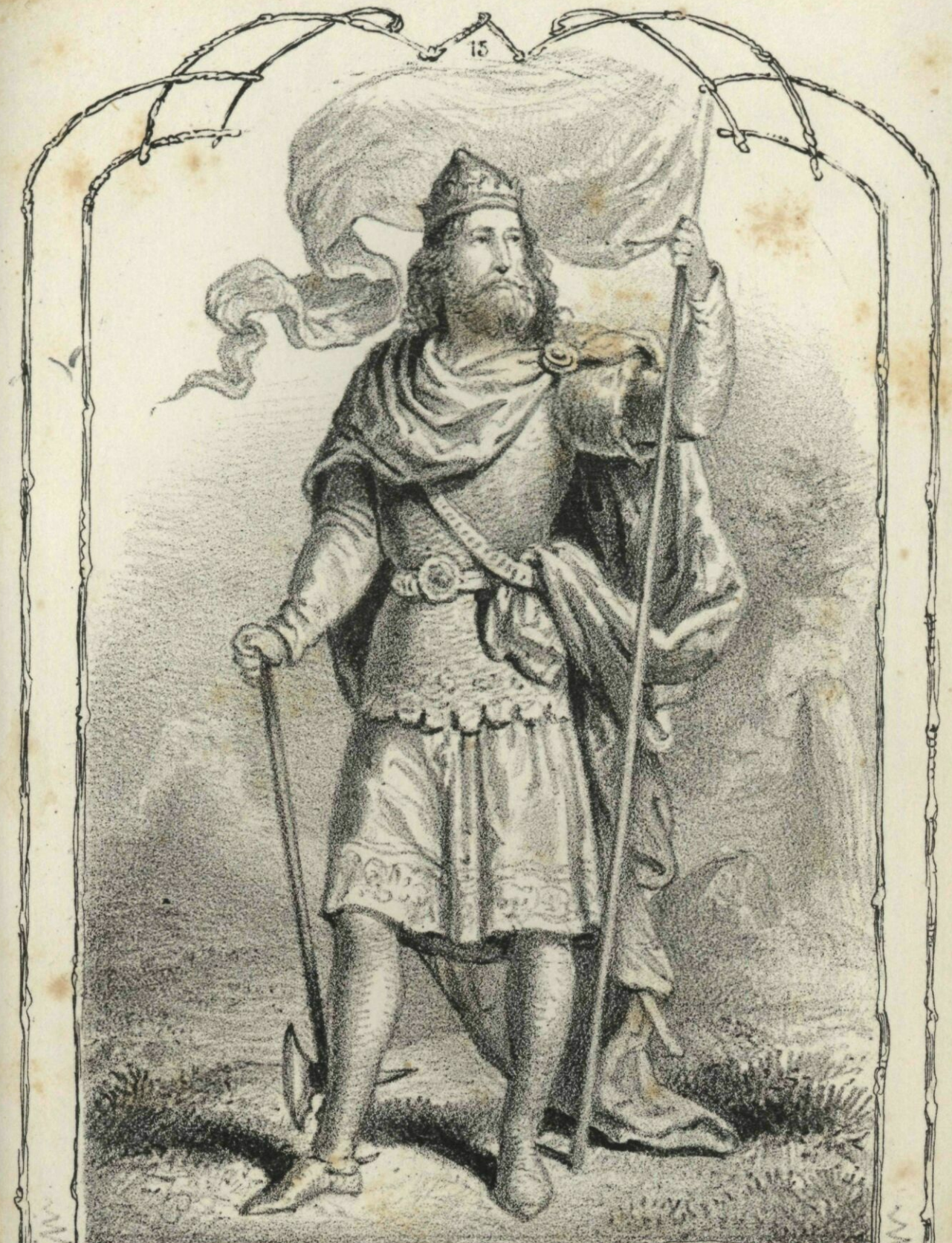
1077. I. sz. László. 1095