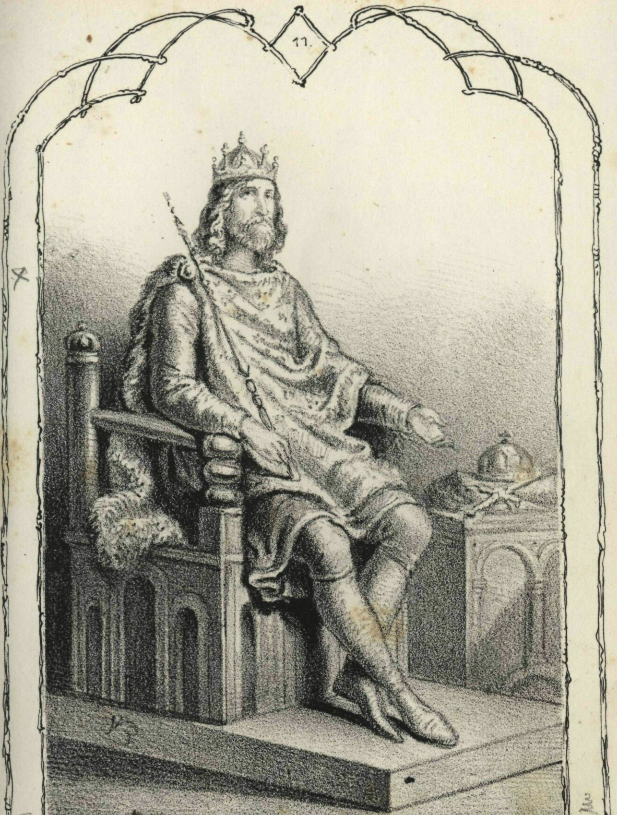
1046. I. Endre. 1061+