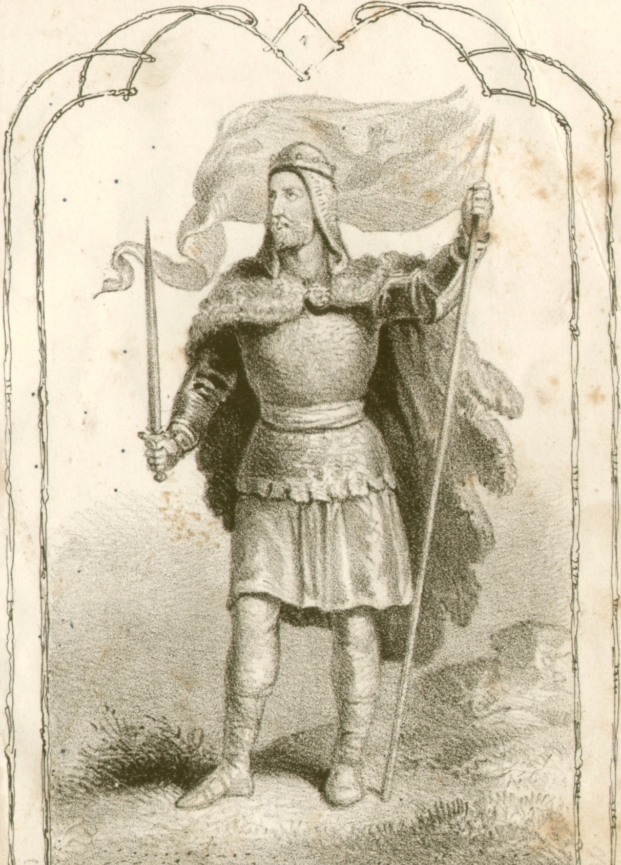
434. Attila. 454.