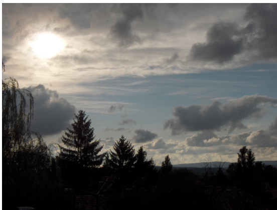
Felhő alkonyatban

Szépérzéke tanúskodik arról is, hogy állandóan rajzol. Főleg filctollal dolgozik. Aprólékos vonalakkal készülnek a képei. Előszedi a könyvszekrényről a Magyar művészet c. nagyméretű színes kiadványt, azt lapozgatja, s kiválaszt belőle egy-egy képet, egy vázát, egy virágszálat, egy tájképet... Ha meglát a TV-ben valamit, azt is lerajzolja, színezi. Aztán kezdi elkészíteni az ő csodálatos látásmódjával, előbb a körvonalat, majd aprólékosan kidolgozza, fáradságot nem kímélve készíti el új, különleges alkotását.