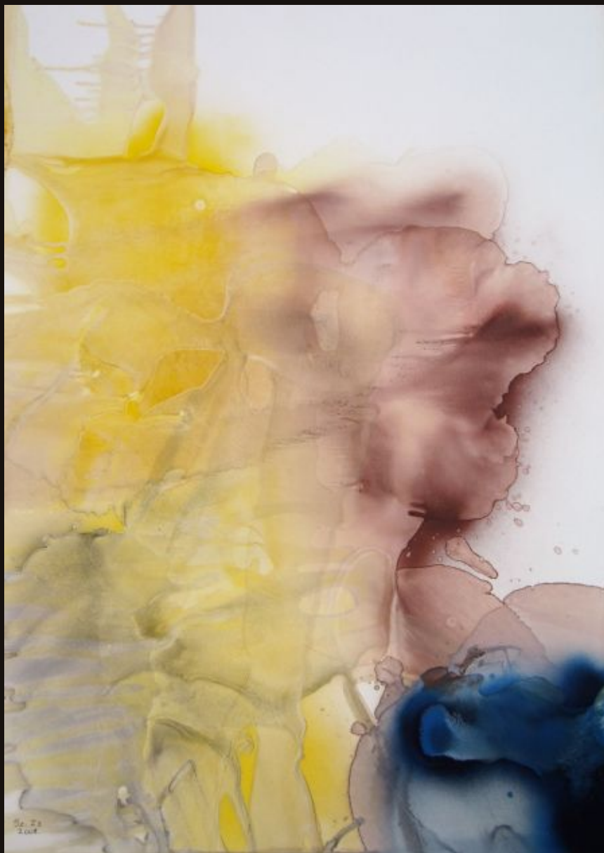
Galvanizált et dök