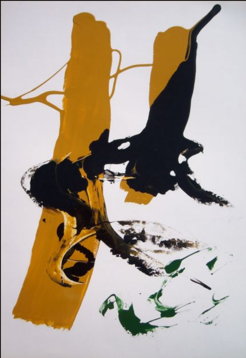
Yin-Yang I .