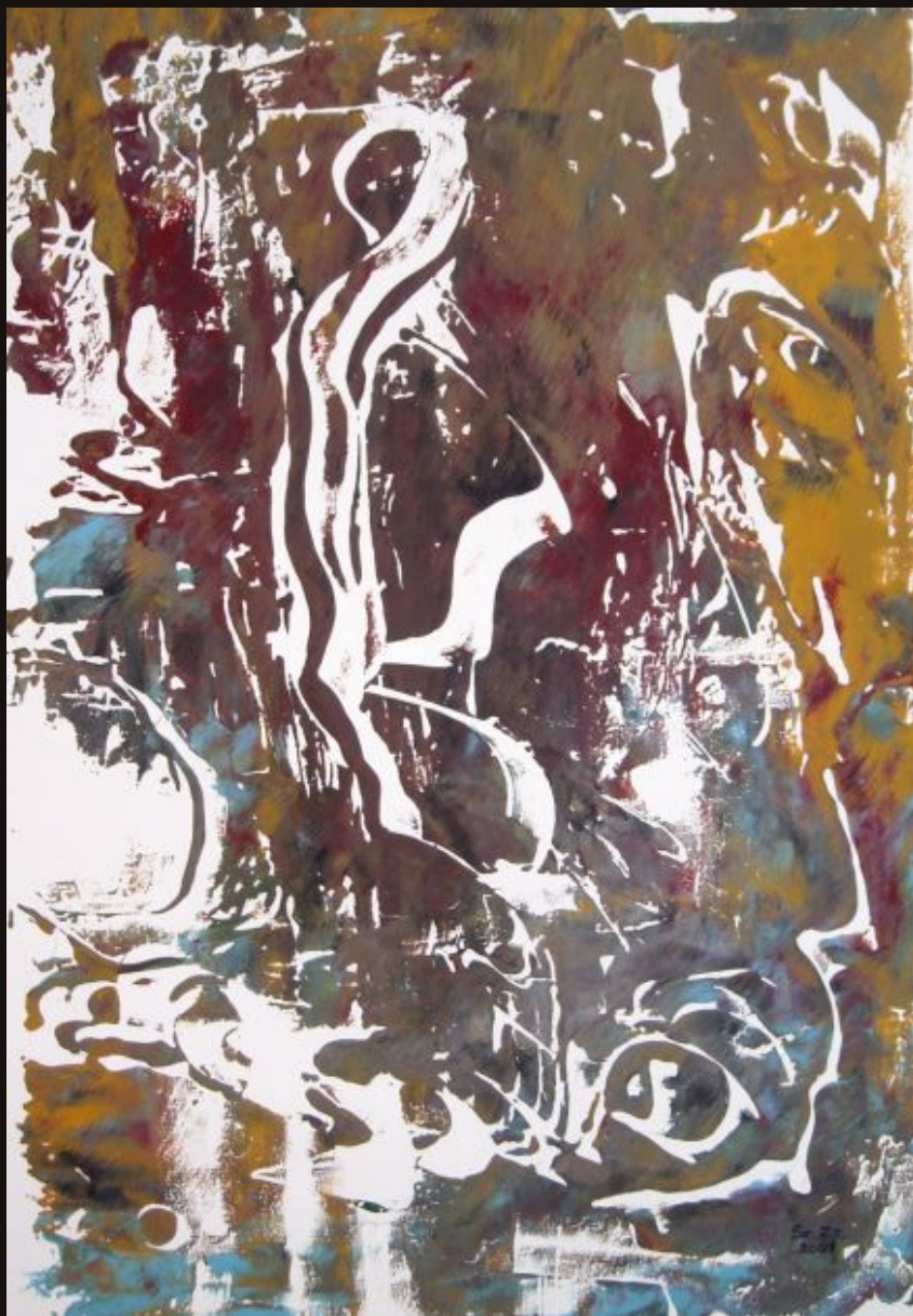
Az Altair 4-en