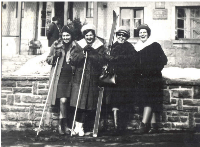
Vidáman - sí-felszereléssel

Kipirulva, éhesen érkeztünk vissza, jóízűen fogyasztottuk el a finom ebédet.