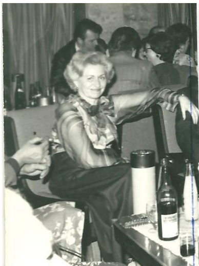
A szerző: Hévízen - társaságban

Az a kötet lett volna az első, hagyományos módon kiadott könyvem, azonban anyagi gondok miatt le kellett róla mondanom, ezért csak ebben az évben, elektronikus úton került fel a mek.oszk.hu oldalra, s ott olvasható a többi kötetem között.