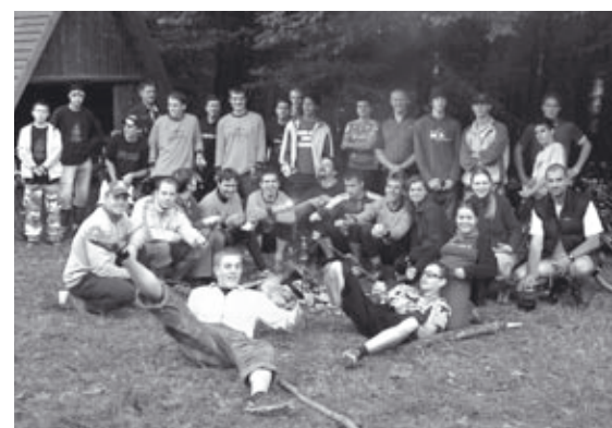
Szezonzáró a Büdös-kúton