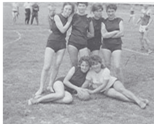
A női kézilabda csapat