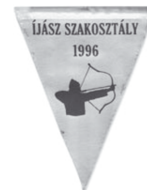
Íjász szakosztály zászlója