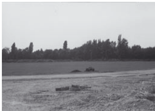
Az új pálya építésének kezdete