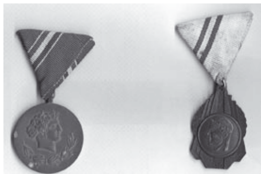
Sportérmek 1967, Enyingből