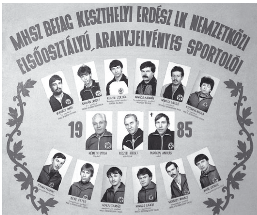
Tabló a BEFAG lővészeiről 1985-ből