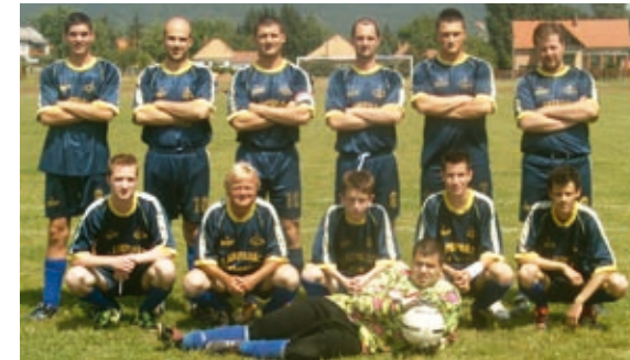
2006-os tartalék labdarúgó csapat