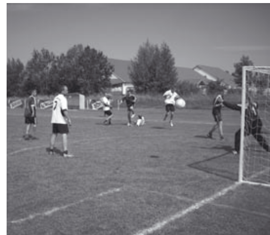
A játék volt a főszereplő a Szabó Ferenc emléktornán

– Elégedett voltam a tornával. – Halász László főszervező – Sok csapat indult és színvonalas mérkőzéseket játszottak. A megvalósításban sokan munkájukkal segítettek, mások anyagi támogatást is tudtak adni. A közös összefogást a szponzorok, szakácsok, játéktekvezetők, kiszolgálók közös összefogását is ünnepelhetjük a díjkiosztón.