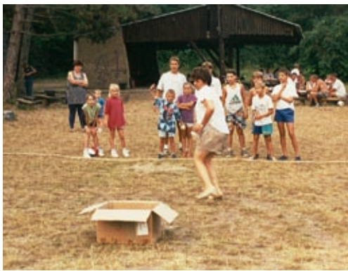
Játékos sportvetélkedő a Nagymezőn