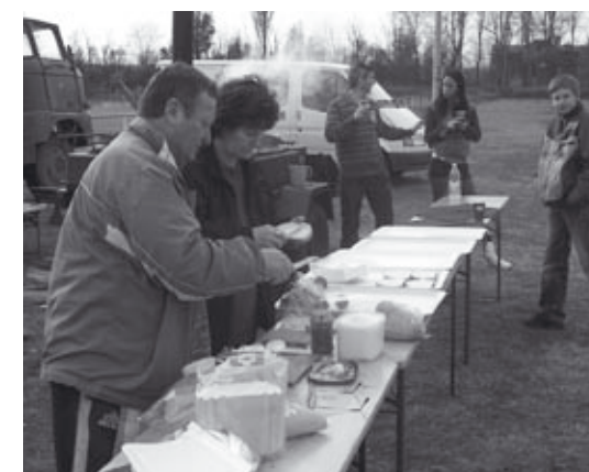
Készülődés a közös sporteseményre