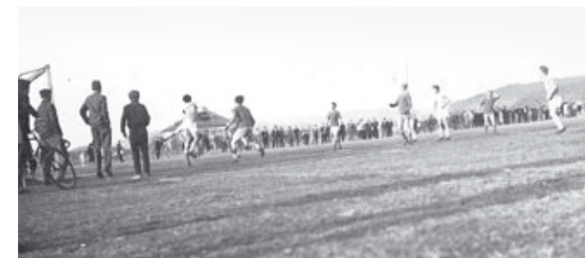
Küzdelem a kapu előtt a labdáért

A mérkőzést követően visszalépett a megyei labdarúgó bajnokság további küzdelmeitől a Hévízi KSK. Átigazolások, továbbtanulás, katonai bevonulás miatt nem kevesebb, mint 12 első csapatbeli játékost veszítette el ebben az esztendőben a kis egyesület labdarúgó szakosztálya.