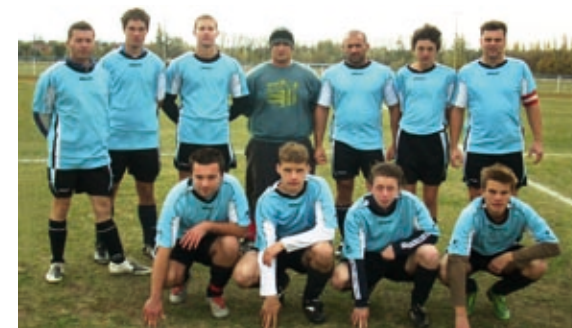
2008-as tartalék labdarúgó csapat