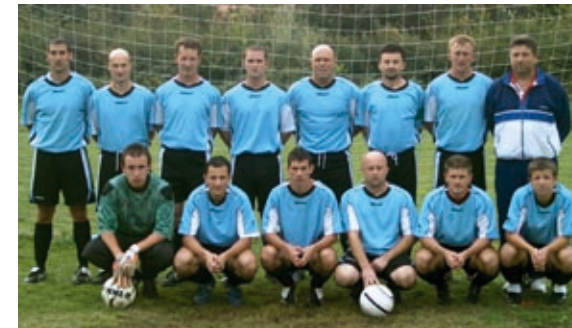
2007-es első labdarúgó csapat