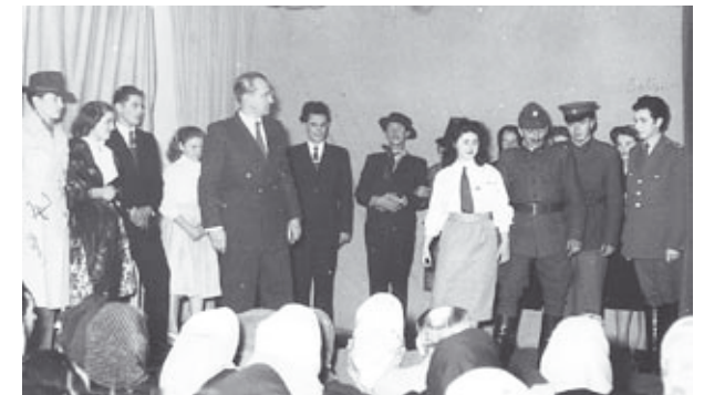
Népszínmű a Tulipán Étteremben