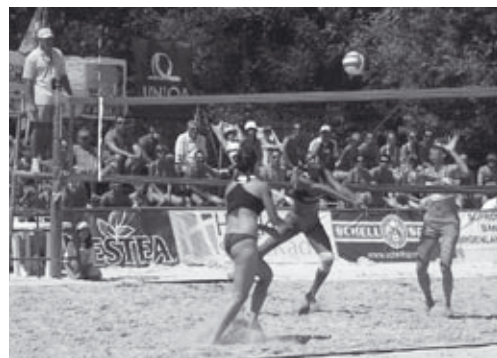
A strandröplabda női döntője