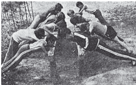
Gyakorlás a tornapályán

Keszthelyi kezdeményezésre épült és 1976. május 1-jével került átadásra az erdei tornapálya Gyenesdiáson a Nagymezőn. A páratlan természeti környezetben a pihenni vágyó felnőttek és a játszani szerető gyerekek szórakozását biztosító létesítmény azóta is szolgája az ide látogatókat.