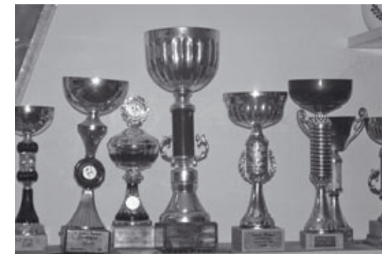
Szabó Ferenc Emléktornák kupái