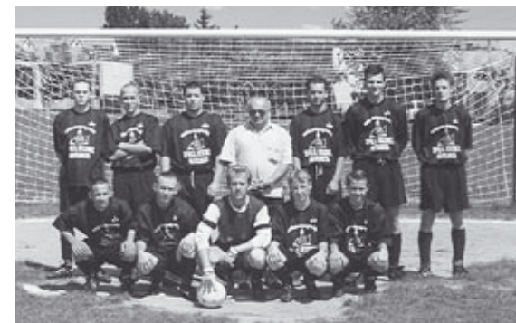
Az ifi csapat tagjai