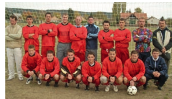
2008-as első labdarúgó csapat