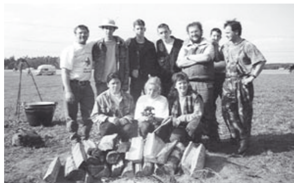
Az íjász csapat tagjai