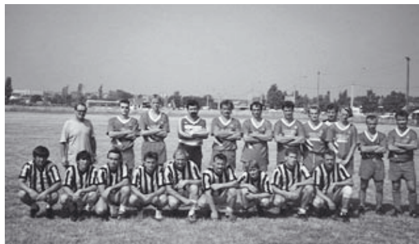
Gyenesdiás és az Öregfiúk csapatai