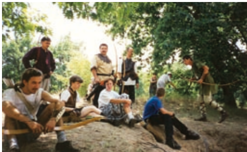
Az íjász szakosztály 1997-ből