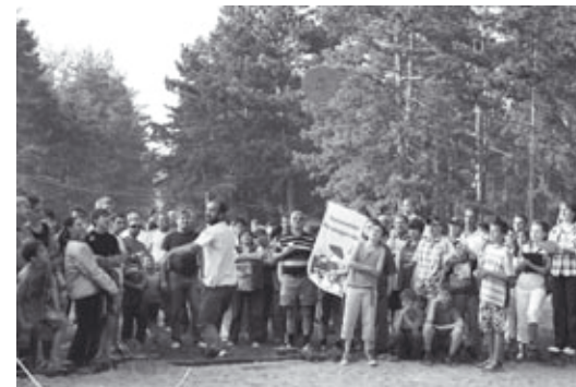
Kőhajítás a Nagymezőn napjainkban

Gyenesdiás versenyek házigazdjaként mégis egészen korán bekapcsolódott a sportéletbe. A kedvező hatások ellenére, érthető okokból, az emberek nem kezdtek el azonnal a századforduló tornamozgalmai mögött csapatostól felsorakozni. A mindennapok kemény fizikai munkája hosszú időn keresztül biztosította a testmozgást a faluban élőknek, nem található táptalajt a korszakra jellemző német mintájú tornamozgalom sem. Játékos vetélkedések, birkózás, tánc és labdajátékok, népi játékok segítették a mindennapi feszültség levezetését. Keveseknek adatott meg a sportolás öröme. Darnay Dornyai Bélától úgy tudjuk, a középkortól kezdődően általános rendszerességgel dobtak köveket a fiatalok játék és testgyakorlás céljából. A kődobást a rúdhányáshoz és gerelydobáshoz hasonlítja, aminek szokását a Forrásvíz Természetbarát Egyesület is felelevenítette 1998 óta megrendezésre kerülő Rügyfakadás Tavaszünnep rendezvénye keretében, ahol a férfiak kődobáson a hölgyek sodrófahajtásban mérhetik össze erejüket, ápolva a hagyományokat.