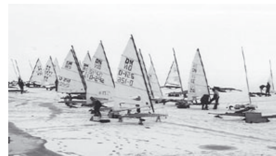
Jégvitorlások startra készen

Gyenesdiás 18 ország 198 jégvitorlázóját látta vendégül a Balatonon megrendezett EB és VB alkalmából. Az eredetileg Balatonfüredre tervezett verseny félbeszakadt a keleti-medencében kialakult enyhe időjárás következtében. Nálunk a tükörsima jég lehetővé tette, hogy január 20-25. között házigazdái legyünk a rangos nemzetközi versenynek.