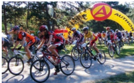
III: Dynamo maratón 2006.