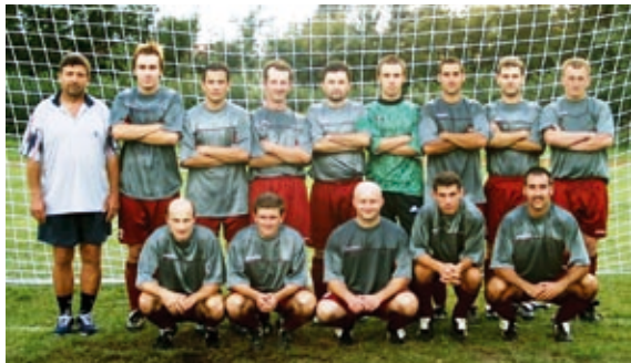
2006-os első csapat