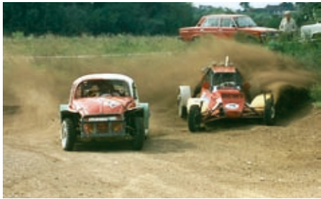
Roncs derbi a '90-es években