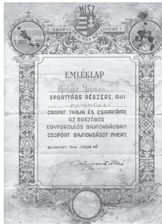
Mezőtlás Bajnokság emléklapja