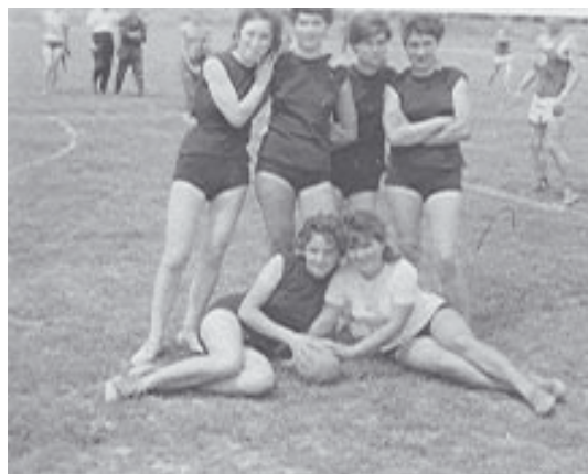
A női kézilabda csapat