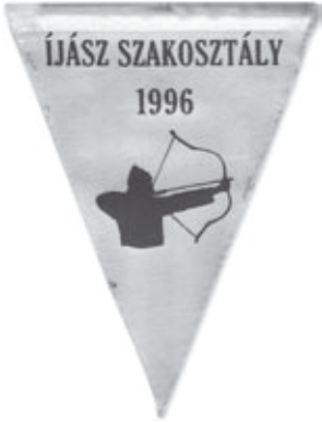
Íjász szakosztály zászlója