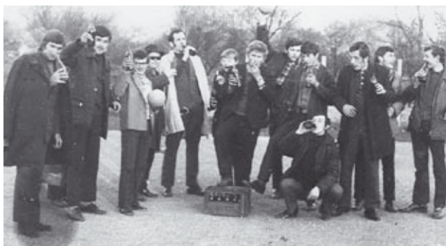
A férfi kézilabda csapat