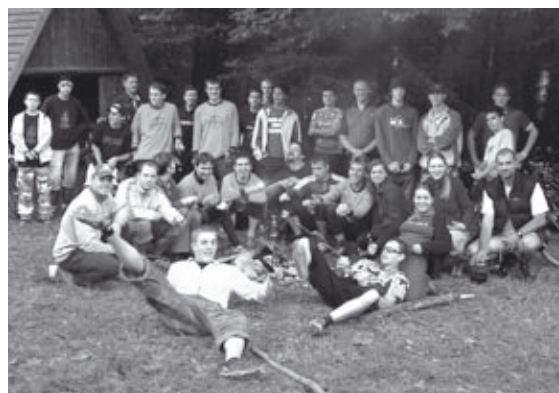
Szezonzáró a Büdös-kúton