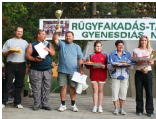
A Nagymező bajnokai