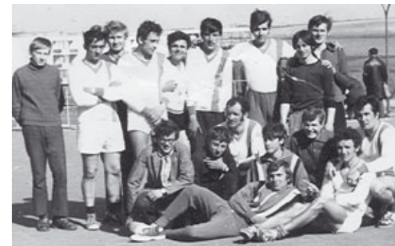
A fűzfői mérkőzés után