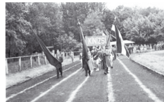
Az ÉDOSZ dolgozók felvonulása a keszthelyi pályán spartakiadjuk megnyitóján

Keszthely járás labdarúgó-bajnokságában a Kinizsi eredményeiből: Rezi – K. Kinizsi 0-6, Hévíz – K. Spartacus 1-2, K. Kinizsi – Hévíz 3-1, Vonyarcvashegy – K. Spartacus 1-4. A bajnokságot a K. Kinizsi nyerte. Tizenkét győzelmet szereztek és csak egy döntetlent az imponáló 55: 4-es gólaránnyal, 25 ponttal. 2. K. Spartacus 21, 3. K. Vasas 20, 4. Hévíz 16 ponttal.