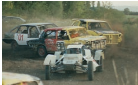
Roncs derbi a '90-es években