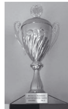
A 2000/2001-es bajnokság legsportszerűbb csapatának járó kupa a Kinizsié lett.