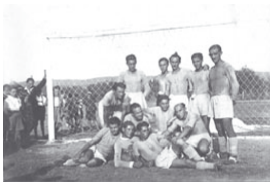
Rákóczi TC 1950-ben

legmagasabb ellenféllel is. Játéka közben feltűnően érdekes, szórakoztató viselkedésével sok szurkolónak okozott kellemes perceket. Apró termete, örökké kócos haja, nagy orra bizarr jelenségnek számított, saját magán ironizáló, szerény természetével jó barát volt. Tudása nem, szeretete annál nagyobbak bizonyult a labdarúgás iránt. Mindenre lehetett kapni, ami kapcsolódott a labdarúgáshoz. Pályamunkát is végzett és gyakran anyagi áldozatot is vállalt a közösségért. Az ötvenes évektől húsz éven át, tevékenykedett mindenki kedves „Pepikéje”.