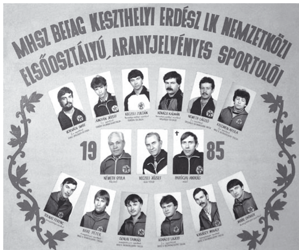
Tabló a BEFAG lövészeiről 1985-ből