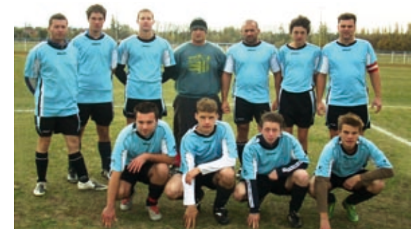
2008-as tartalék labdarúgó csapat