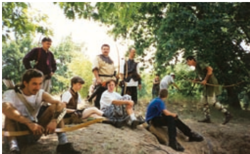
Az íjász szakosztály 1997-ből