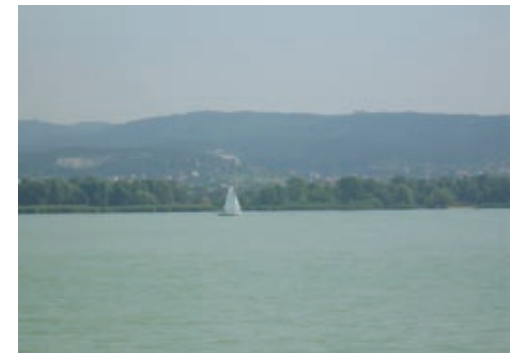
Gyenesdiás a Balatonról