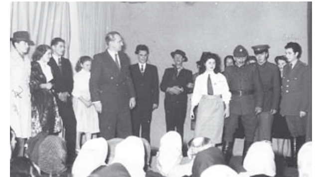
Népszínmű a Tulipán Étteremben