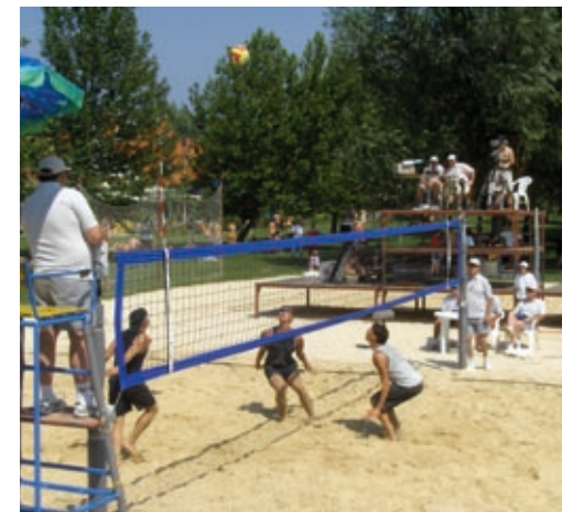
Lipton Országos Strandröplabda Bajnokság 2004 férfi döntő