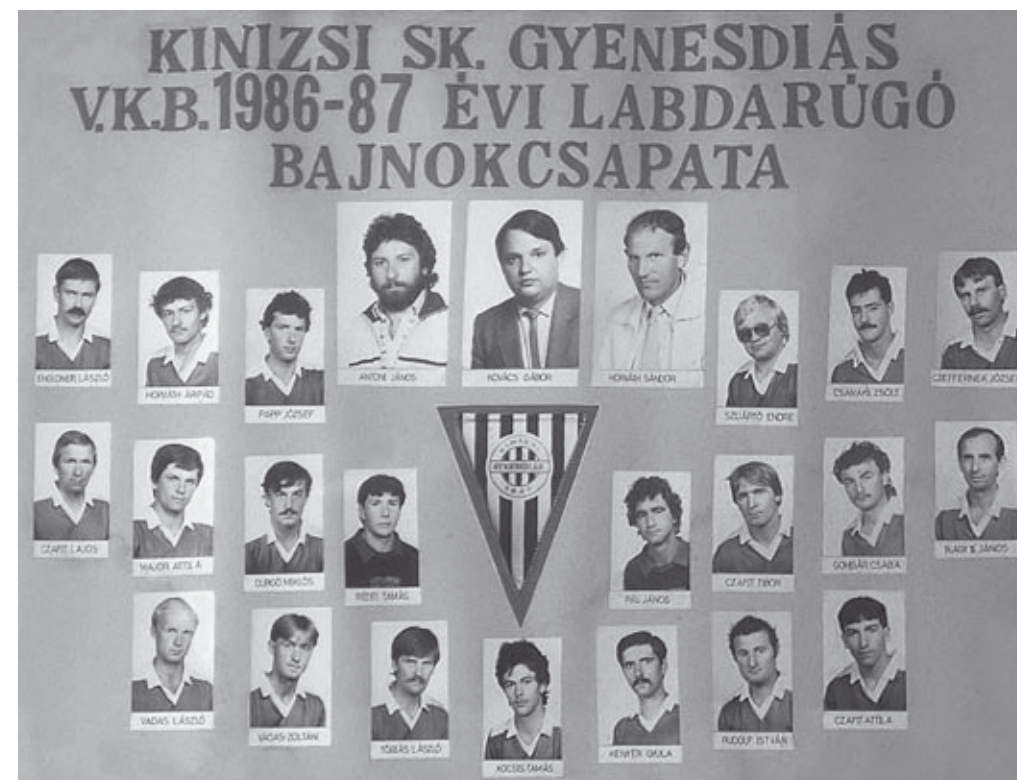
Az 1986/87-es év városkörnyéki bajnokság bajnokcsapata

abban a bajnokságban Te voltál a legjobb. 1986-87-ben mi, gyenesdiások voltunk a legjobbak a városkörnyéki bajnokságban. Itt lettem először bajnok, nekem nagyon nagy élményt jelent még akkor is, ha utána másik csapatokkal kétszer átélhettem a bajnoki cím megszerzését.