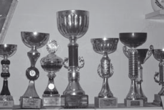
Szabó Ferenc Emléktornák kupái