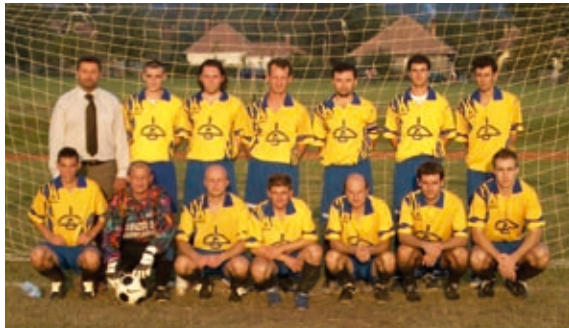
2005-ös labdarúgó csapat