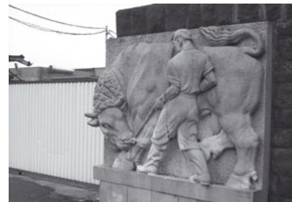
A Húsüzem éveken át a város egyik legjobb labdarúgó csapatával rendelkezett

Szükségük lett volna egy társadalmi munkában dolgozó szakoktatóra, amit nem tudtak biztosítani. Két komplett felszerelésre, mert a játékosok saját pénzüket adták össze a felszerelésük pótlására. Utazni is a megyében egyedül álló módon zsúfolt teherkocsin tudtak