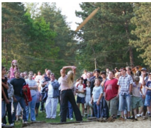
Sodrófahajítás a Nagymezőn