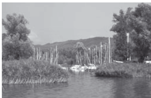
A Yacht kikötő bejárata