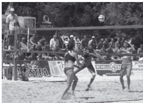
A strandröplabda női döntője