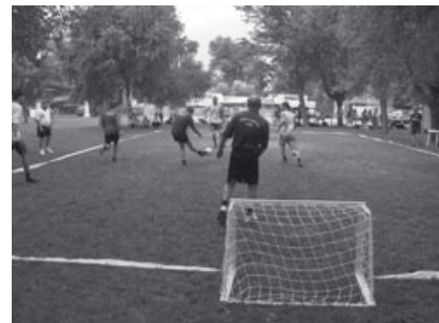
Pillanatkép a „Mozdulj Balaton”-ról

túrált és igényes sportolási lehetőségéhez. A Kék Zászlóval jutalmazott Diási strandun- kon animátorok segítségével lehetett kosárlabdázni, focizni, asztaliteniszezni, röplabdáz- ni, vízilabdázni és petangot játszani. A lehetőséggel többen is éltek és voltak olyanok,