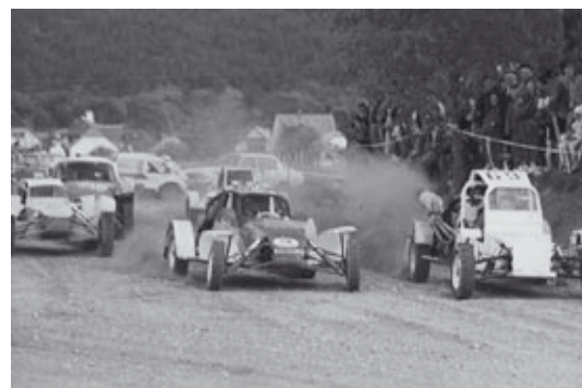
Rajtolnak az épített csövázások