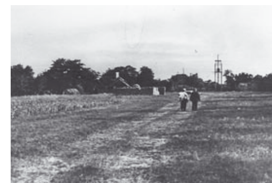
Itt épült fel az iskola

A huszadik század első felében a nagyobb lehetőségekkel rendelkező Keszthelynek is nagy gondot jelent a leventék számára a pályák biztosítása. Lövészetre Gyenesdiáson a Vadlánlikhoz közeli bányát használták és az itt kialakított grundon fociztak az ifjak egymással és a vonyarci fiúkkal. A diási templom mellett a mai buszmegállóban és az iskola helyén, egy magánbirtokon is gyakran játszottak, rúgták a labdát a legények. Nagyobb ünnepeken megmérkőztek egymással Gyenes és Diás, a falu alsó és felső részén élők. Alakultak csapatok nősközből és nőtlenekből, soványakból és kövérekből. Vendégül látták a szomszéd falvak hasonló korú és lelkületű csapatait nagyobb ünnepek hangulatának emelésére. Eljöttek Vonyarcvashegy, Balatongyörök, Balatonederics, Alsópáhok, Balatonszentgyörgy és Keszthely csapatai.