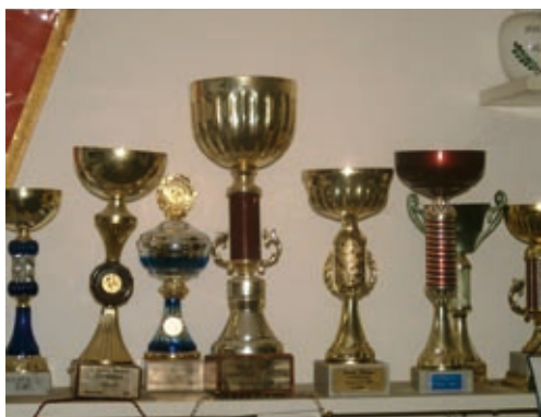
A labdarugók trófeái