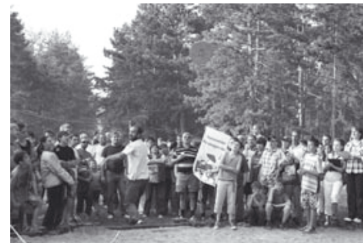
Kőhajítás a Nagymezőn napjainkban