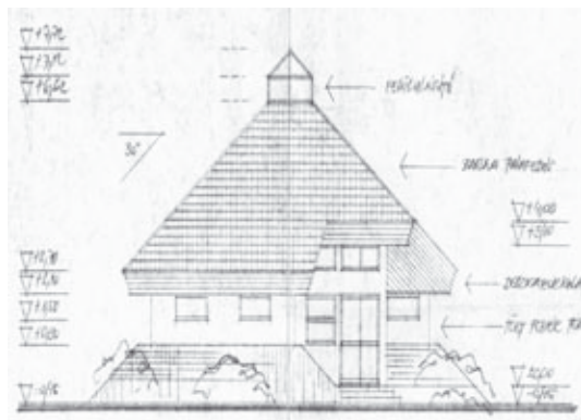
Az öltöző épületének homlokzati rajza

A közösségi szellem nem csak a pályán érvényesült, hanem azon kívül is, a kalákában épített házak a vállalt társadalmi munkák ékes bizonyítékai ennek.