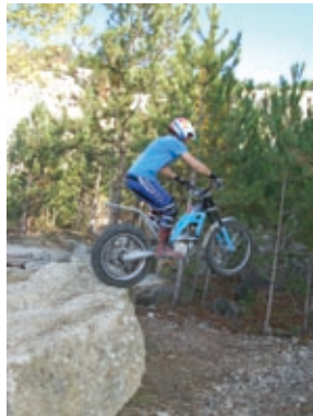
First Section Trial Team versenye, 2008.