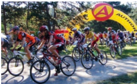
III: Dynamo maratón 2006.