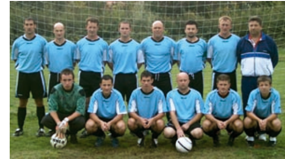
2007-es első labdarúgó csapat