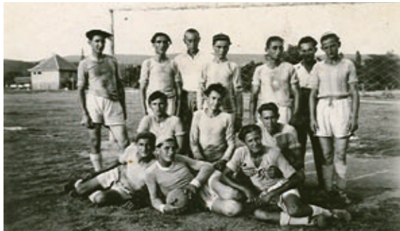
1950-es labdarúgó csapat