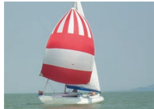
Pelso-Line Kupa 2008