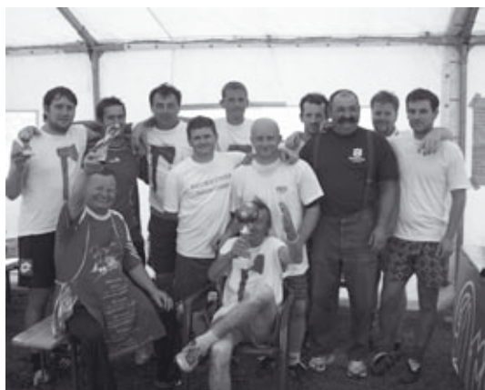
A torna győztesei