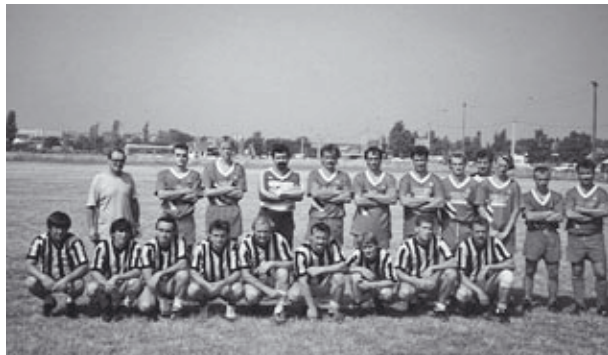
Gyenesdiás és az Öregfiúk csapatai