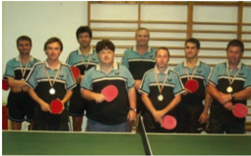
2008 őszétől NB II-es férfi asztalitenisz csapat tagjai