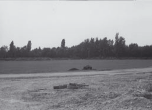
Az új pálya építésének kezdete