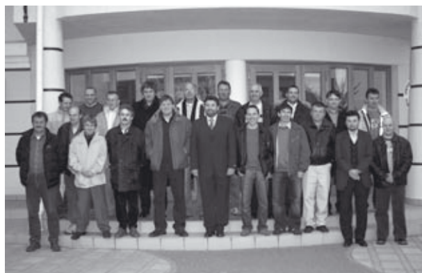
A húszéves találkozó résztvevői