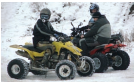
Az Összkerék Autó Motor Szakosztály quadosai 2007.