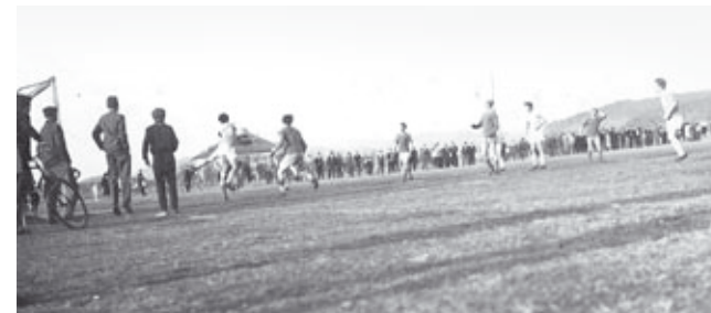
Küzdelem a kapu előtt a labdáért

A mérkőzést követően visszalépett a megyei labdarúgó bajnokság további küzdelmeitől a Hévízi KSK. Átigazolások, továbbtanulás, katonai bevonulás miatt nem kevesebb, mint 12 első csapatbeli játékost veszttette el ebben az esztendőben a kis egyesület labdarúgó szakosztálya.