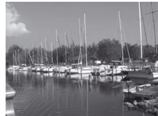
A yacht kikötő

Amatőr: 1. Lonka – Cseh-Bodnár Zsanett, 2. Zsó – Wéber Antal.