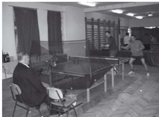
Edzés az adogatógéppel

A Gyenesdiási Turisztikai Egyesület szervezésében június 30. és július 2. között a diási strandon rendezték a 2006. évi Strandröplabda Országos Mester Bajnokság 2. fordulóját, a röplabda szövetség országos bajnoksága keretében. A pontszerző fordulót az esős idő nem fogadta kegyeibe. A helyi rendezők felkészültsége azonban elhárított minden akadályt és a jó minőségű pályákon magas színvonalú, látványos mérkőzéseket vívtak a résztvevők. Az extraligás játékosok többsége a korábbi versenyek alkalmával már megfordultak a Balaton-parti