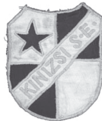
A Kinizsi SE címere

Néhány eredmény: Zalaszentő – K. Kinizsi 0-1, Vonyarcvashegy – K. Kinizsi 0-9, K. DÉDÁSZ Vasas – K. Kinizsi 1-0. Megővta a Kinizsi a Sármellék elleni 1-5-ös vereséggel végződött mérkőzést, és végül 0-0-al megkapta a két pontot. A tizedik forduló után ötödik a Kinizsi 23:14-es gólaránnyal és 12 ponttal, akár csak a következő Gyenesdiás. A bajnokságot tavasszal a harmadik helyen zárták, kilenc győzelem mellett három döntetlennel és vereséggel, 32:14-es gólaránnyal.