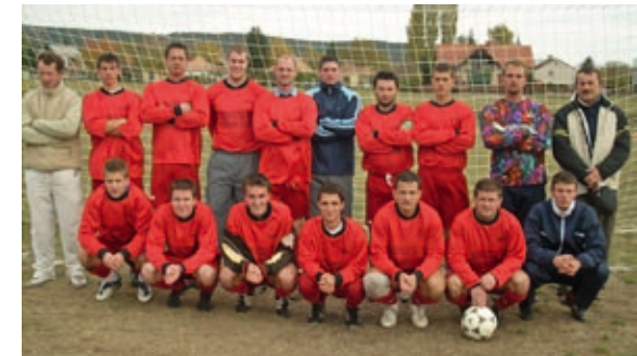
2008-as első labdarúgó csapat