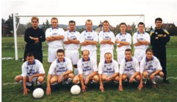
1999-es labdarúgó csapat