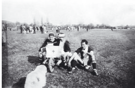
Elsősegély a pályán

Amikor nem fociztak a fiatalok, továbbra is marhalegelőnek használta a falu a területet. A tehenek nem figyeltek a felrajzolt vonalakra, gyakran helyeztek el „aknákat” a fűben és a hétvégi mérkőzéseken nem számított kellemes érzésnek mezítláb belelépni ezekbe.