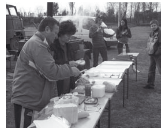
Készülődés a közös sporteseményre

A 45. percben beértek a hazai támadások, Major baloldali szögletét Séllei középről a lécs alá fejté, 1-0. 58. percben újabb hazai szöglet következett, ahol ismételték a házigazdák, Major beívelését ismét Séllei fejté mesterien a hálóba, 2-0.