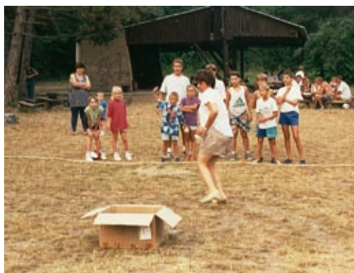
Játékos sportvetélkedő a Nagymezőn