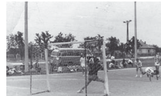
Hazai mérkőzés az iskola udvarán

A tizenegy csapatból tizedik a Gyenesdiás, azonban ha a feljutást nem befolyásoló tartalék csapatok eredményét nem vesszük figyelembe a végső sorrend alakulásában, akkor hetedik Gyenesdiás 14 1 0 13 197:367 2 ponttal.