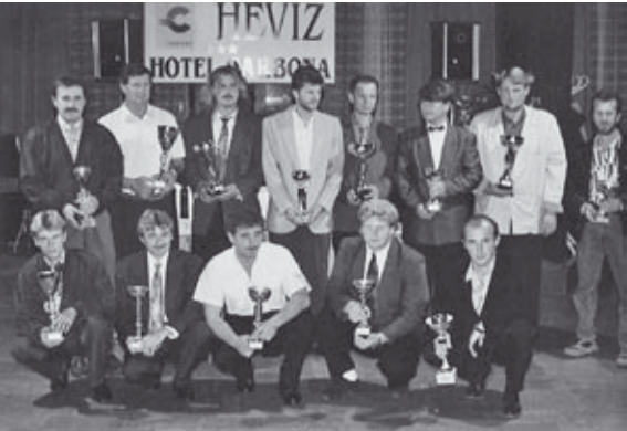
Ünnepel az autó szakosztály