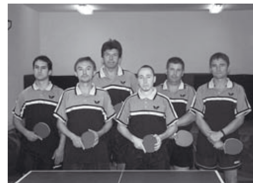
Az asztalitenisz csapat

Féjérvíz – Fetévszer SE – Gyenesdiási ASE 18-0. A sérülések következtében tartalékosan felálló Gyenesdiási nem tudta elkerülni a vereséget.