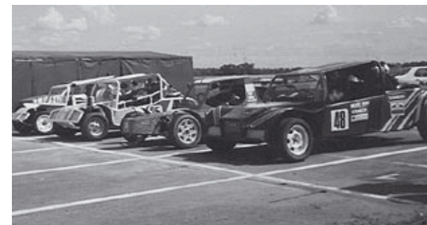
Rally Cross rajt

Ma már csak a TV-ben nézem a sportot, a jó rendezvényeket nagyon szeretem és értékelem azokat, akik meg tudták valósítani. Büszke vagyok magamra, hogy amikor lehetett mi is csináltuk a magunk módján. Nagyon nagy tartást és önfegyelmet adott mindnyájunknak a sportolás. Megtanultuk tisztelni a másik erőfeszítését és élveztük a közösség összetartó erejét, és a benne rejlő lehetőségeket. Egymásért dolgoztunk.