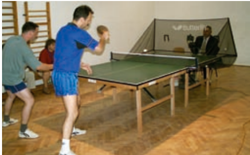
Asztalitenisz edzés az adogató géppel 2006 nyarán