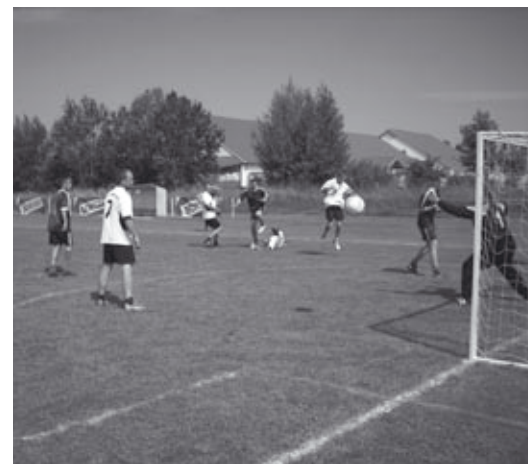
A játék volt a főszereplő a Szabó Ferenc emléktornán