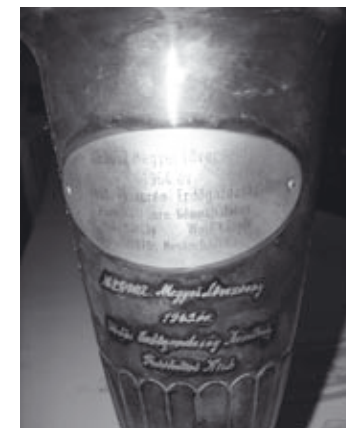
1965. MEDOSZ kupa

A következő évtől országosan elősegítették a vadász számok fejlődését, érthető okokból ezek az erdészeti vállalatoknál honosodtak meg. Az 50 m hosszú pálya, 10 m-es nyiladékkal ekkor már létezett. Kezdetben futó őz, majd szarvas és az 1970-es évektől vaddisznó ábrázoló célra lőttek.