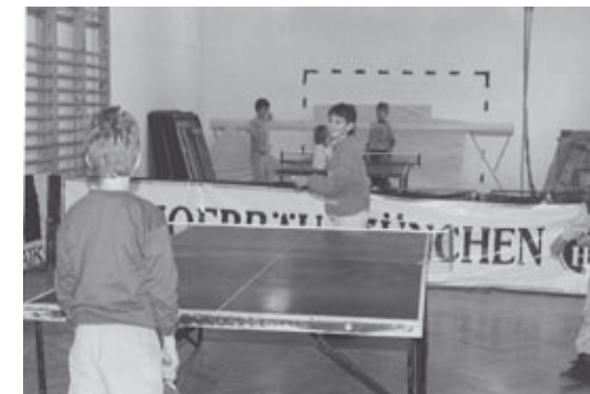
Sportélet a tornaszobában

Az asztaliteniszezők serdülő I., serdülő II., és felnőtt csapata a megyei I. osztályban játszottak. Immár öt éve tevékenykedtek az iskolában és klubkönyvtárban. A spontán játékból szerveződött szakosztály az osztályozó megnyerése után 1984-ben, a megyei