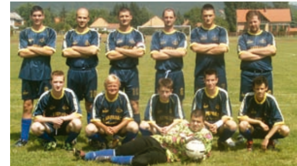
2006-os tartalék labdarúgó csapat