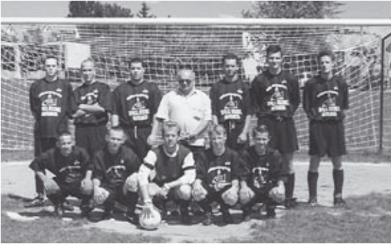
Az ifi csapat tagjai