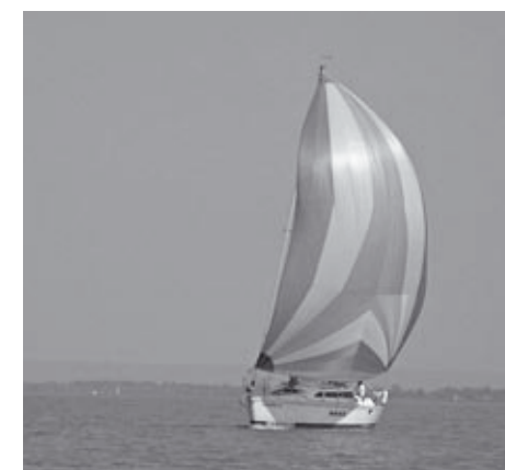
Pelso-Line Kupa résztvevője