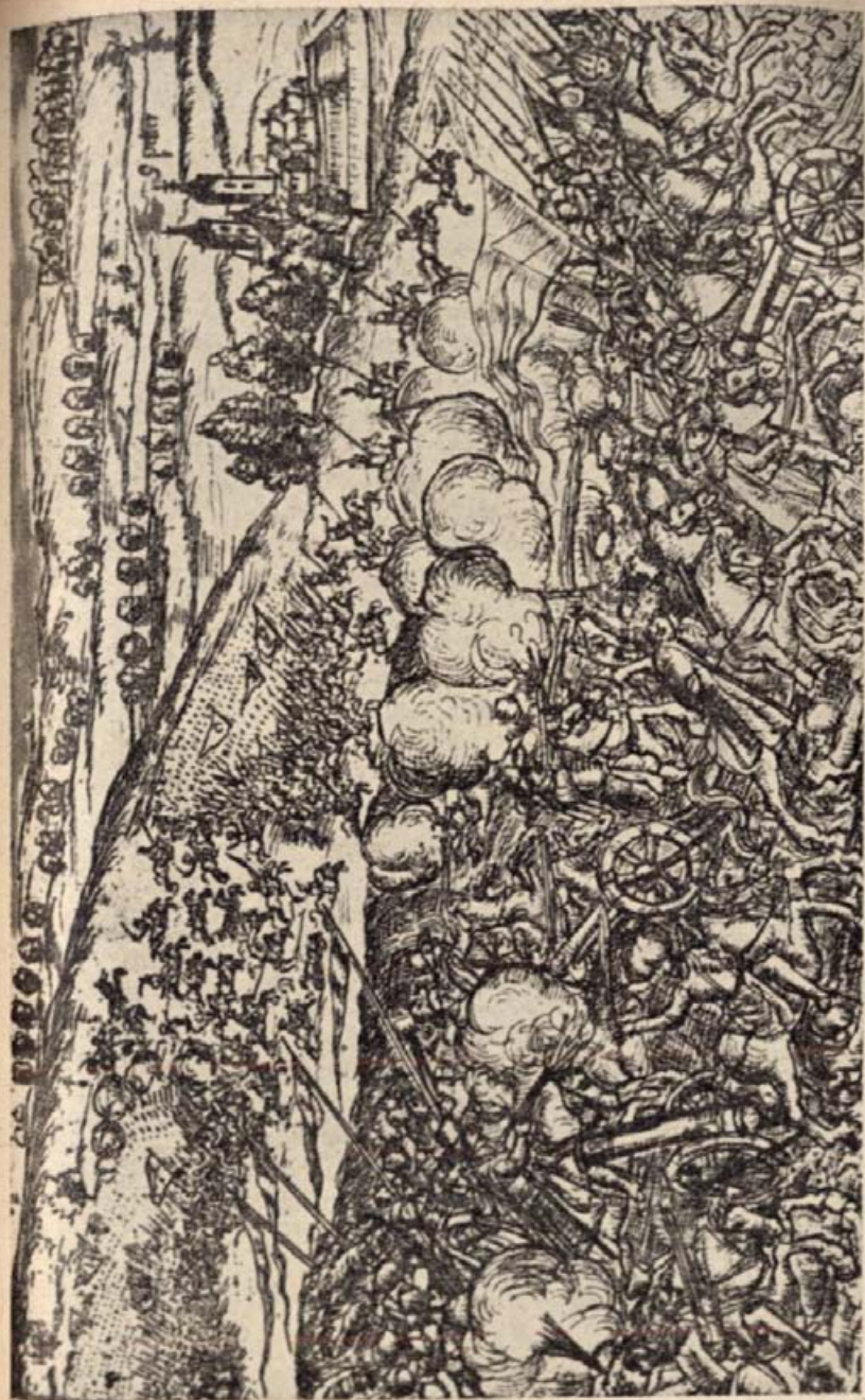
13. Az edelényi csata. (Egykorú rézmetszet.)