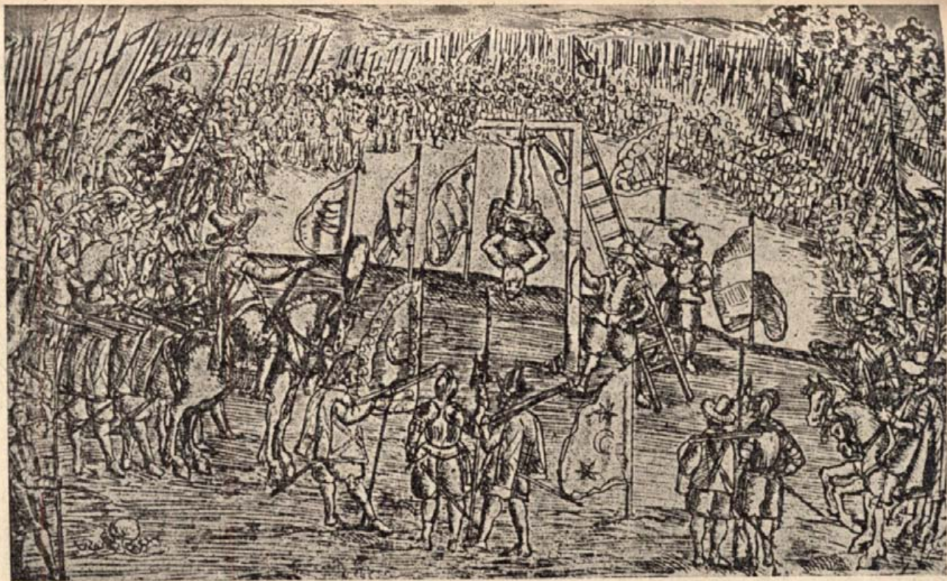
19. Németi Balázst lábánál akasztalja fel Básta. (Egykorú rézmetszel.)