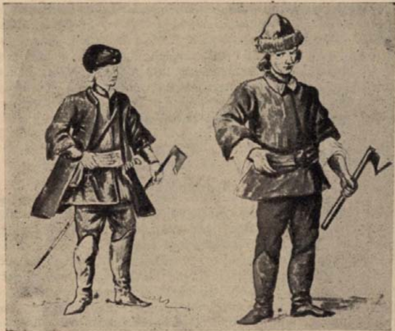
4. Székely harcos.

A székelyek azonban már fel voltak bujtva, nem tudtak eligazodni, veszedelmükbe rohantak. Előbb ugyanis elhatározták, azután ki is hirdették a háborút; mind siettek és egymást noszogatták — s amint népi zendülésnél szokott lenni — sem igaz vagy határozott