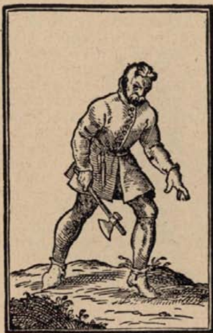
17. Magyar jobbágy vagy parasztács. (Fametszet 1600-ból.)

De akkor az ács nagy-erősen remél, Isten dolgáról csak magában beszél, Nem árt őnéki hirtelen jutott szél: Az isten véle — s leeséstől nem fél.