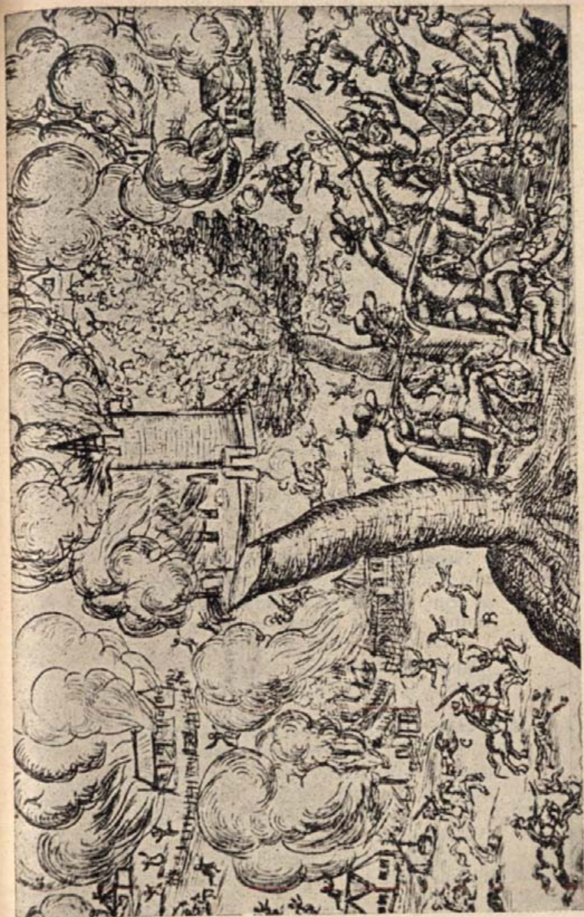
14. Ötszáz paraszthajdú pusztulása egy faluban. (Egykorú rézmetszet.)