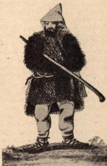
10. Erdélyi román juhásztor. (Vízfestmény a 17. századból.)