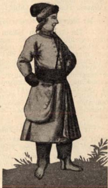
7. Vándorló magyar mesterlegény. (Vízfestmény a 17. századból.)

Gyulafehérvárott Ötves Péter így vallott: