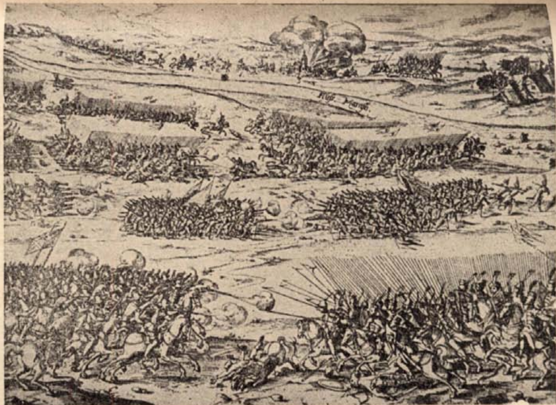
11. A miriszlói csata. (Egykorú rézmetszet.)