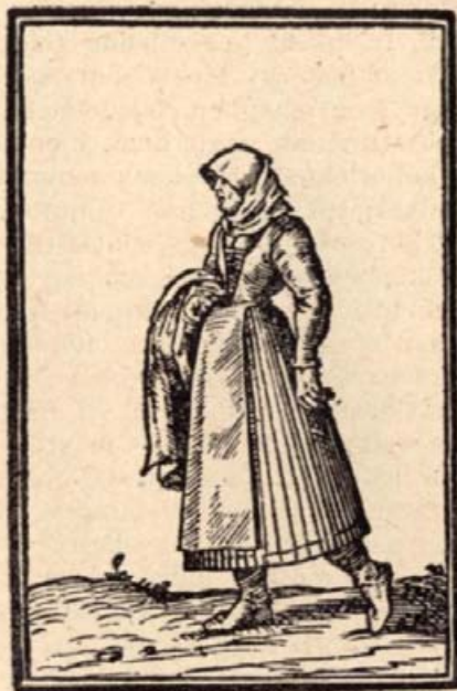
2. Magyar jobbágyasszony. (Fametszet 1600-ból.)

Mikor írának ez új esztendőben, ezeröttszázban immár negyvenötben, fösvénységről költék Tállyán ezt énekben, Horvát András hagyá ezt egy jókedvében, hogy tanácsot adna mindeneknek ezben.