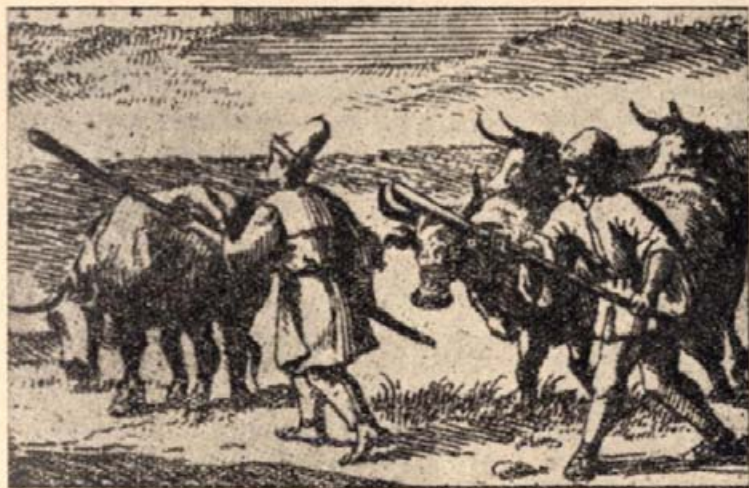
3. Ökröket terelő magyar parasztok. (Rézmetszet 1696-ból.)

— Ihol a bor ára. Majd elég pénzt esik. Ezennel elérköznek szép gyermeklovokkal és kevér ökrökkel : ezeket patvarkodásból vöttem a jobbágyokon: mert megbírságotam őket. A gyermeklovak közül válaszd