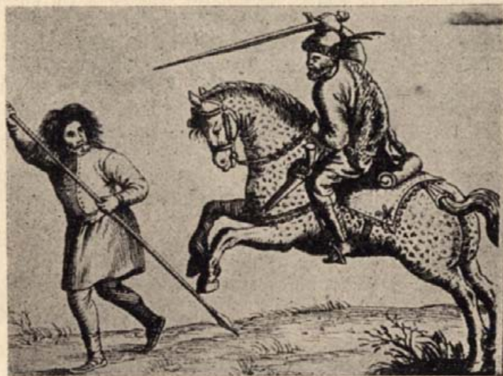
15. Parasztharcost üldöző erdélyi lovaskatona. (Rézmetszet 1667-ből.)

keztek a szászok kőhalmi székében, Barcsay Gáspár, a fejedelem testvére vezetésével a lázadás leverésére. Magának a vezérnek Kőhalmon volt a szállása. Mikor a csíkiak és követőik megtudták, hogy az ellenük összeszedett sereget falunként osztották szét, egész seregükből kiválasztottak annyi lovas, amennyit csak tudtak és Székely Sámuel vezetésével bizonyos kis csapatot küldtek azok leverésére, akik hozzájuk legközelebb voltak szálláson. Ez gyorsaságával híret megelőzve, váratlanul megtámadta szomszédos Kece nevű szállásukon a székelyek Udvarhely nevű székének csapatait, megölt sok közkatonát s az elő-