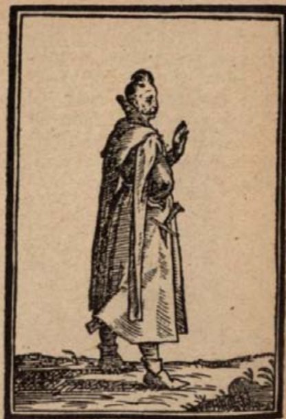
1. Magyar városi polgár. (Fametszet 1600-ból.)

nak, akiknek érdekét képviselte : hevesen növelte a király és az udvari emberek gyűlöletét, nem könnyen tűrték, hogy kicsavarják kezükből a prédát, amelynek ára a hit és szégyenérzet feláldozása volt. A királyt ugyan csak azon egy szempontból érte e gyalázat, mert nem uralkodott méltányosan és királyilag övéin. Ifjúkora ugyan menthetné bűnét, ha nem volnának egyéb példák : kivált Mátyás királyé, aki az atyák emlékezte szerint, ugyane királyságban kora ifjúságában lelki nagyságának jeles példáját mutatta. Pedig a királyhoz, akinek túlzott engedékenysége következtében történtek ezek, a prédából semmi sem jutott, noha az állami számviteli iratok szerint, negyvenezer magyar aranyat meghaladott az elrabolt összeg.