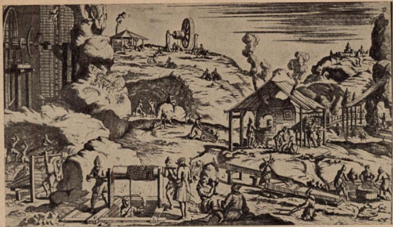
16. Nemesfém-bányászás, kohászat és aranymosás Magyarországon. (Rézmetszet 1673-ból.)