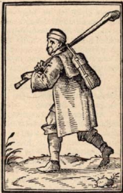
6. Magyar jobbágy. (Fametszet 1600-ból.)

A törökök tudták, mi történik amott. Gyuláról, Temesvárról és egyéb határos vidékekről segítséget vontak össze. Amazok nagy reménységgel és bizakodással mentek Szentmiklósnak; a törökök körül vették őket; ámbár keményen harcoltak, szétverték, majdnem mindnyájukat elfogták vagy levágták.