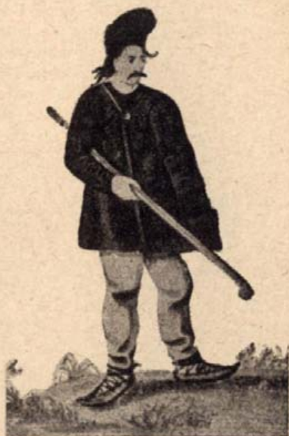
9. Kőszékely. (Vízfestmény a 17. századból.)

Mindkét részről sokáig és sokat vitatkoztak, végül a fejedelem