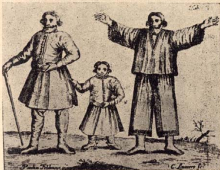
8. Köznemes, fia és jobbágya. (Rézmetszet 1687-ből.)

IV. rész. 1. vers: „Ti urak, a ti szolgálítókkal igazán és egyenlőséggel cselekedjétek, ezt tudván, hogy tinektek is Uratok vagyon mennyégben.”