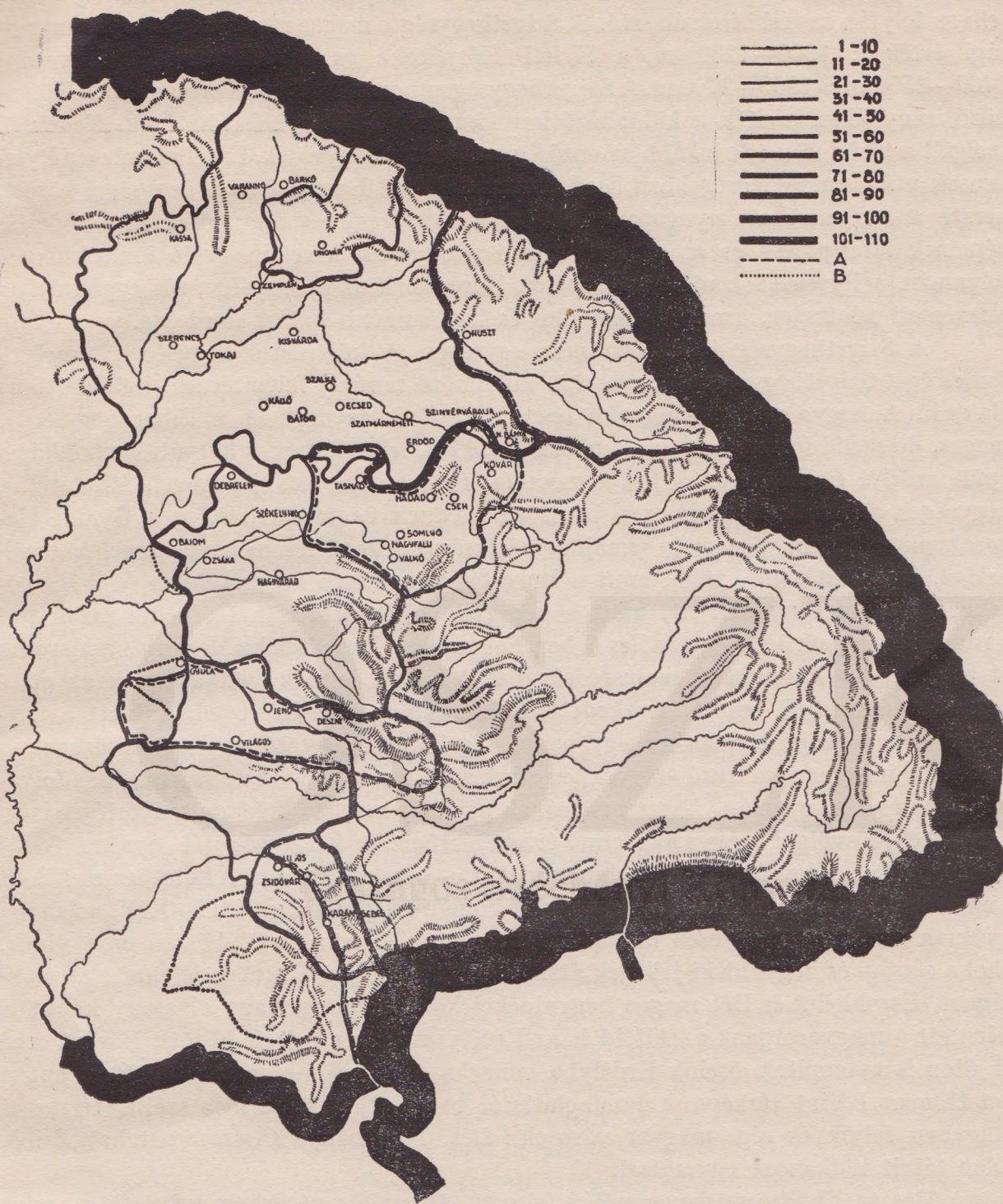
KELETMAGYARORSZÁG ÉS ERDÉLY HATÁRÁLLANDÓSÁGI TÉRKÉPE (1000—1900-ig). RAJZOLTA RÓNAI ANDRÁS.

A szaggatott vonalak a »partium« határai, melyek a tulajdonképpeni Erdélyhez tartoztak jogilag és hosszabb időn át.