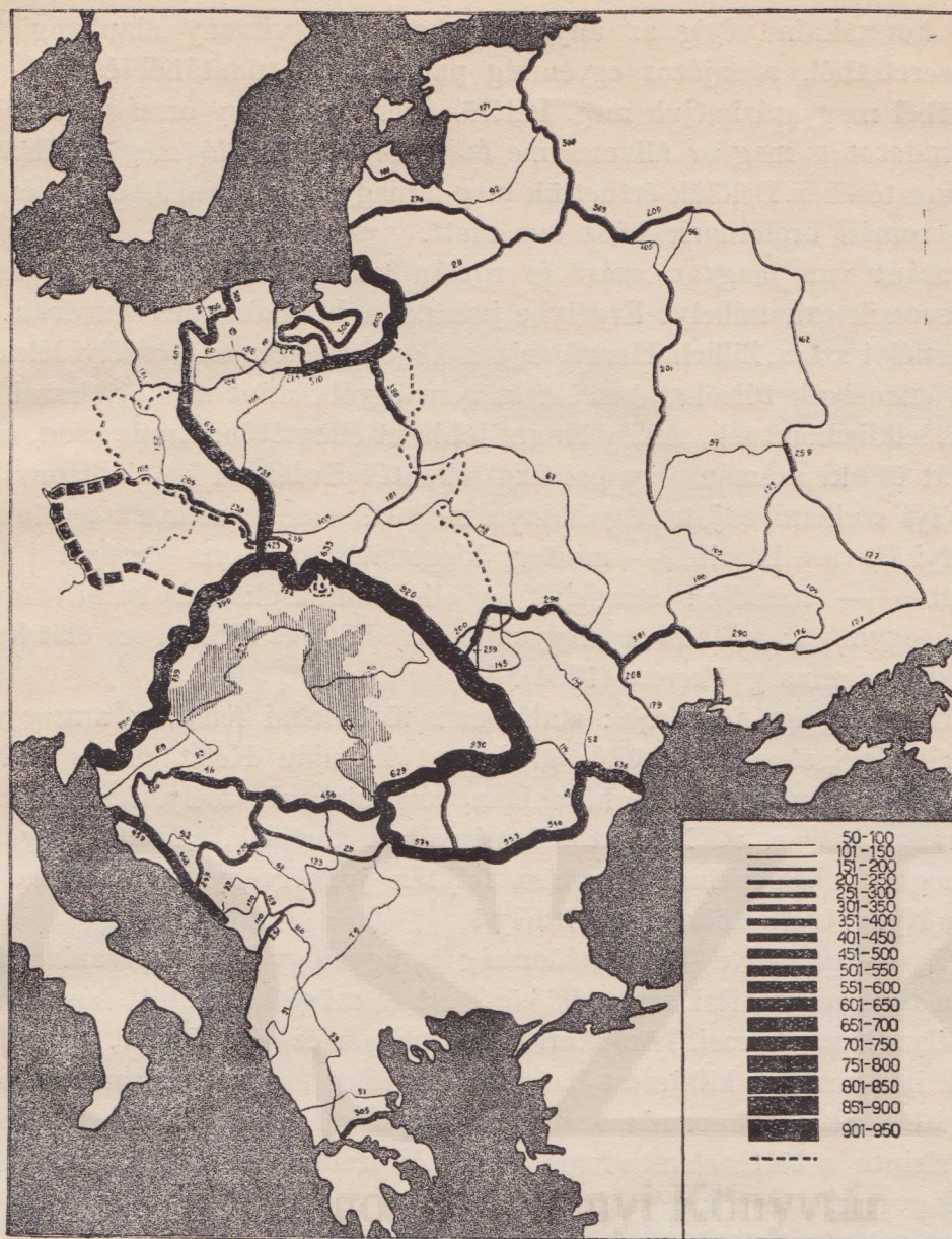
AZ ORSZÁGHATÁROK ÁLLANDÓSÁGÁNAK TÉRKÉPE NYUGAT- ÉS KELET-EURÓPA HATÁRTERÜLETÉN A NÉPVÁNDORLÁS UTÁNI SZÁZADOKBAN (1000— 1920-ig). RÓNAI ANDRÁS RAJZA.

A határvonalak vastagsága a fennállás idejét szemlélteti. A szaggatott vonalak a birodalmakon belüli fontosabb ország-határok. A vonalkázott övezet Magyarország belsejében a török uralom határvidékét jelzi. Itt a török korban pontosan megállapított határ csak rövid ideig állott fenn.