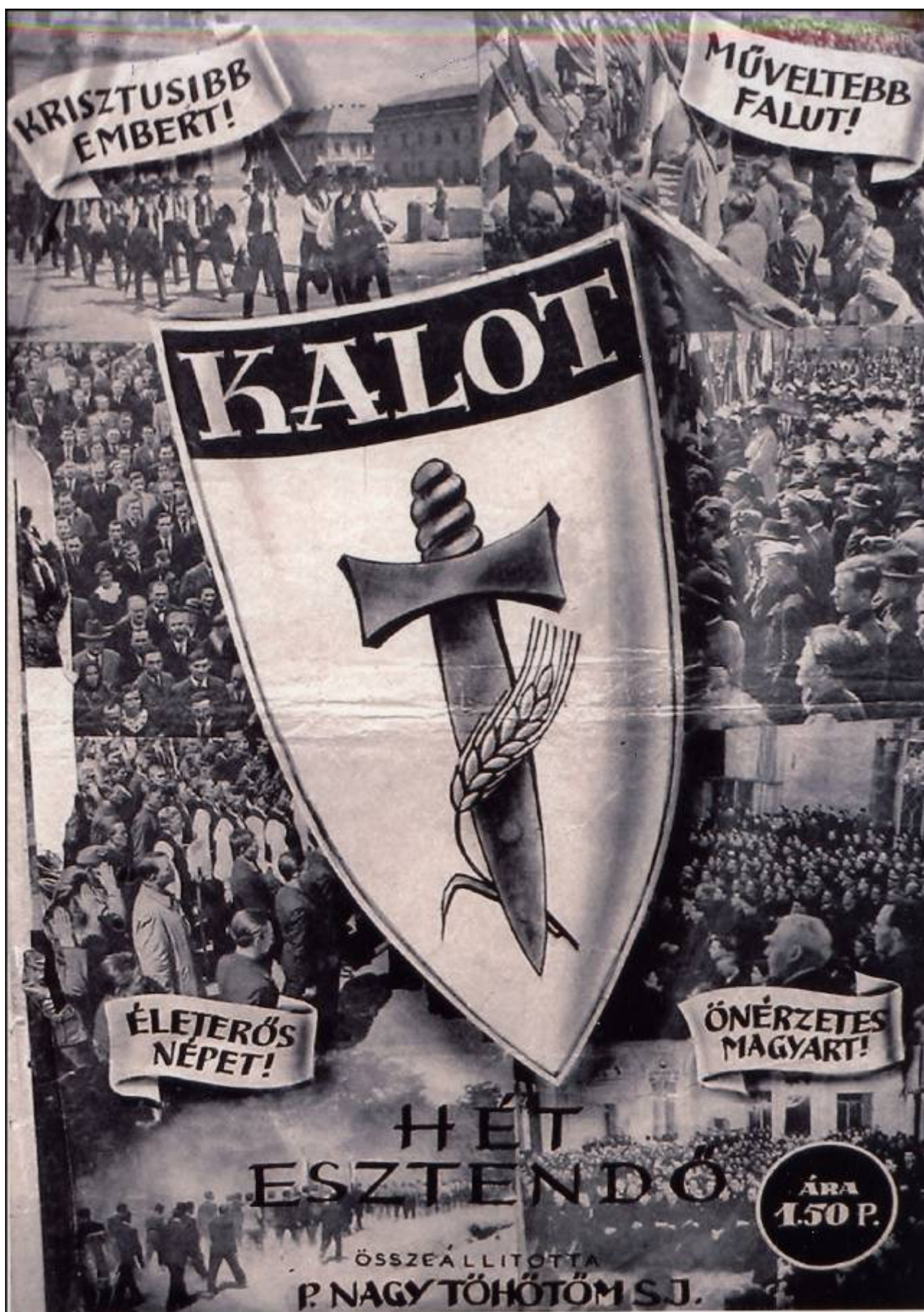
A KALOT négyes karizmája ma is érvényes