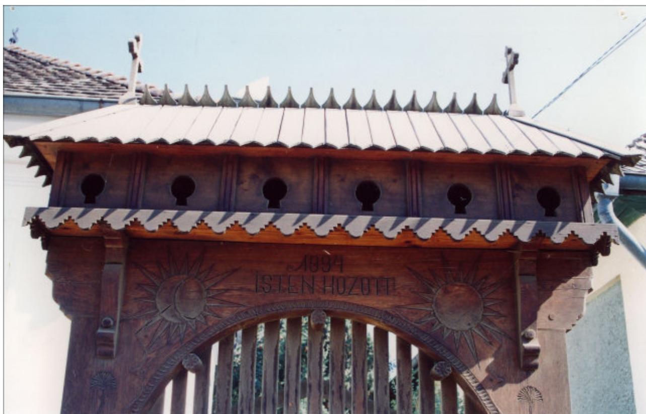
Sass Imre faragta kiskapu Csíkcsekefalván