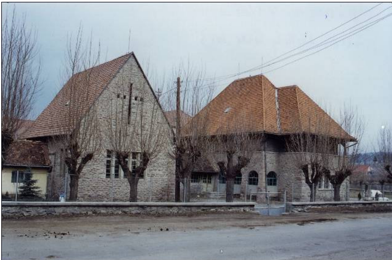
A csíksomlyói KALOT-székház ma