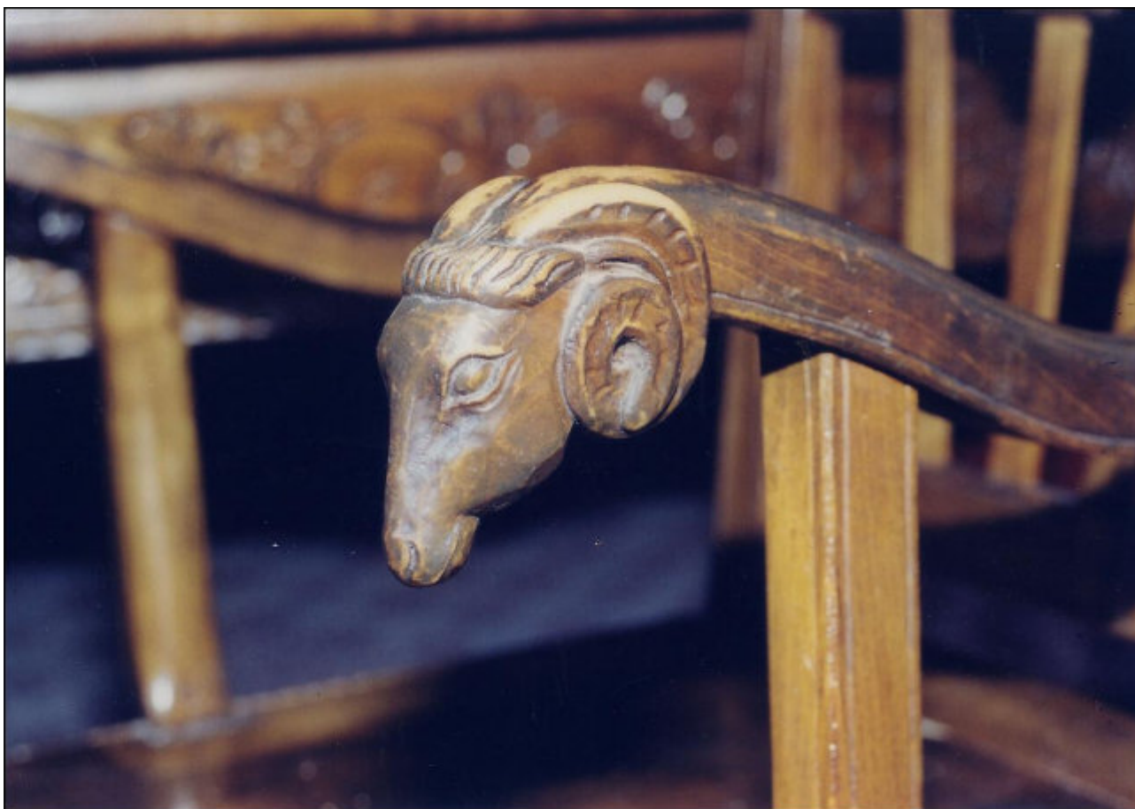
Fábián József berbécsejes fejedelmi széke, Gelence