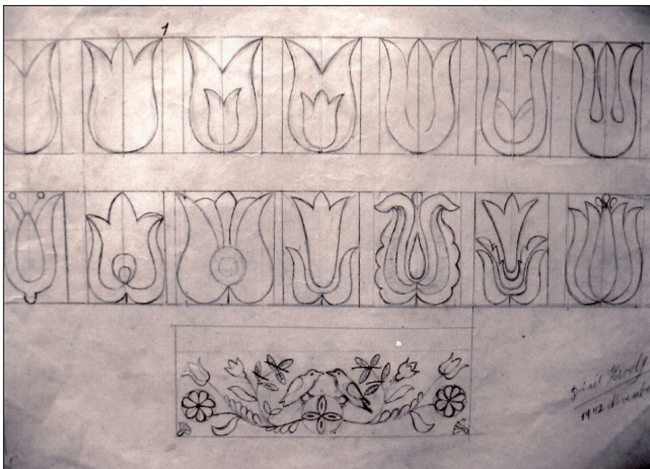
Dániel Károly (Csíkmenaság) KALOT-virágaiból - vázlat