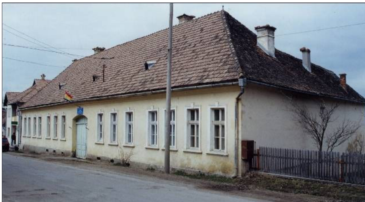
A KALOT-KALÁKA Székely Népfőiskola ideiglenes épülete – ma általános iskola (2003)