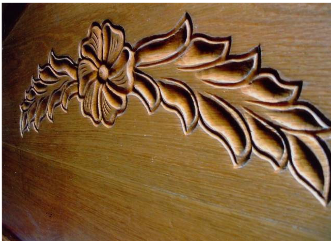
Dánél Károly (Csíkmenaság) KALOT-virágaiból - faragás