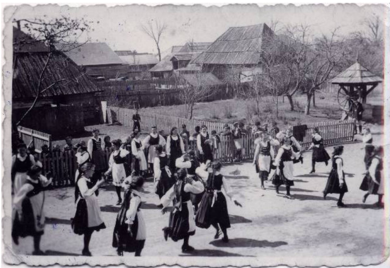
Csíksomlyói KALÁKA-hétféje. A lányok a táncpróba záróvizsgájára készülődnek (1942). Archív felvétel