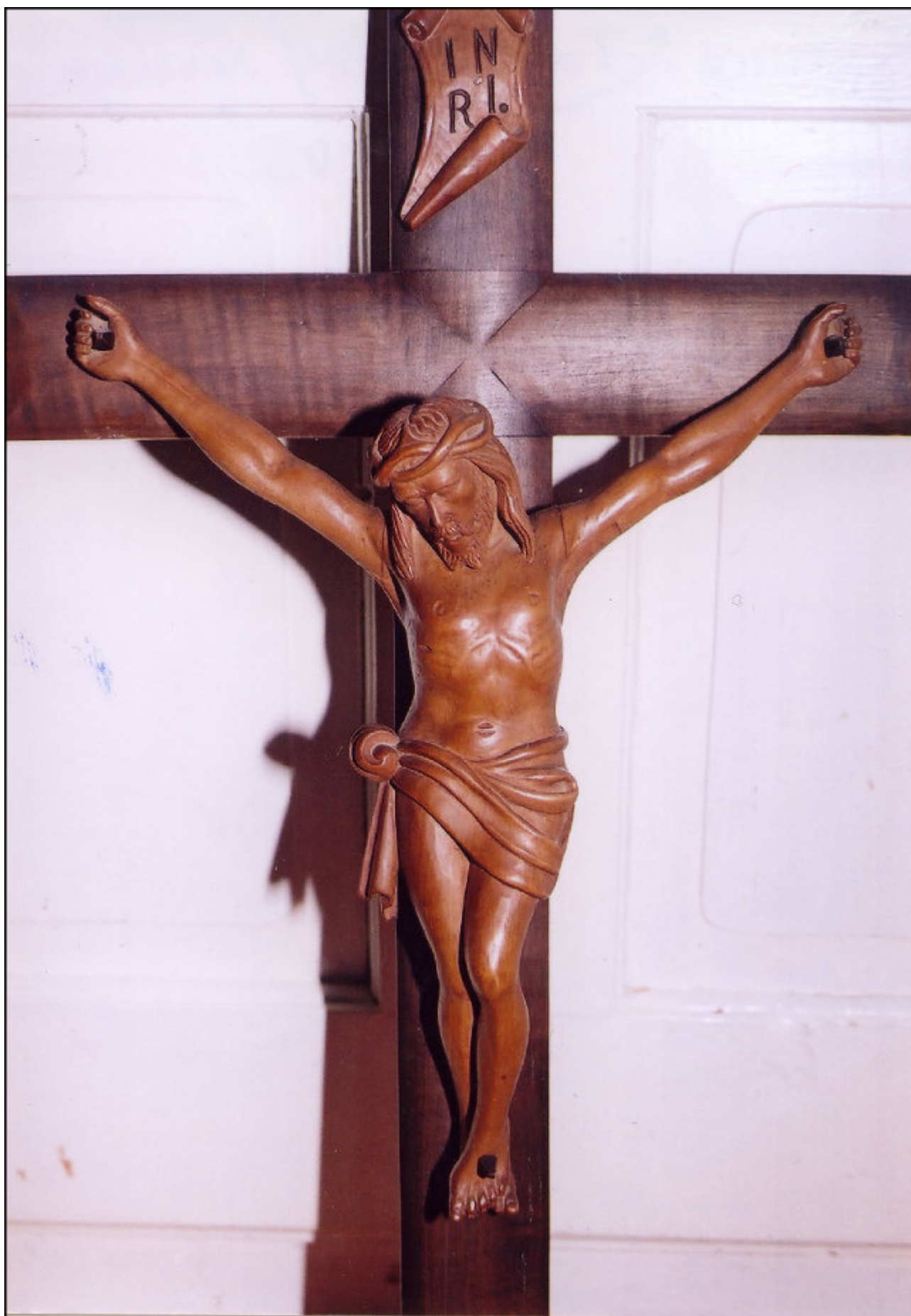
Fábián József munkája, Gelence: Corpus