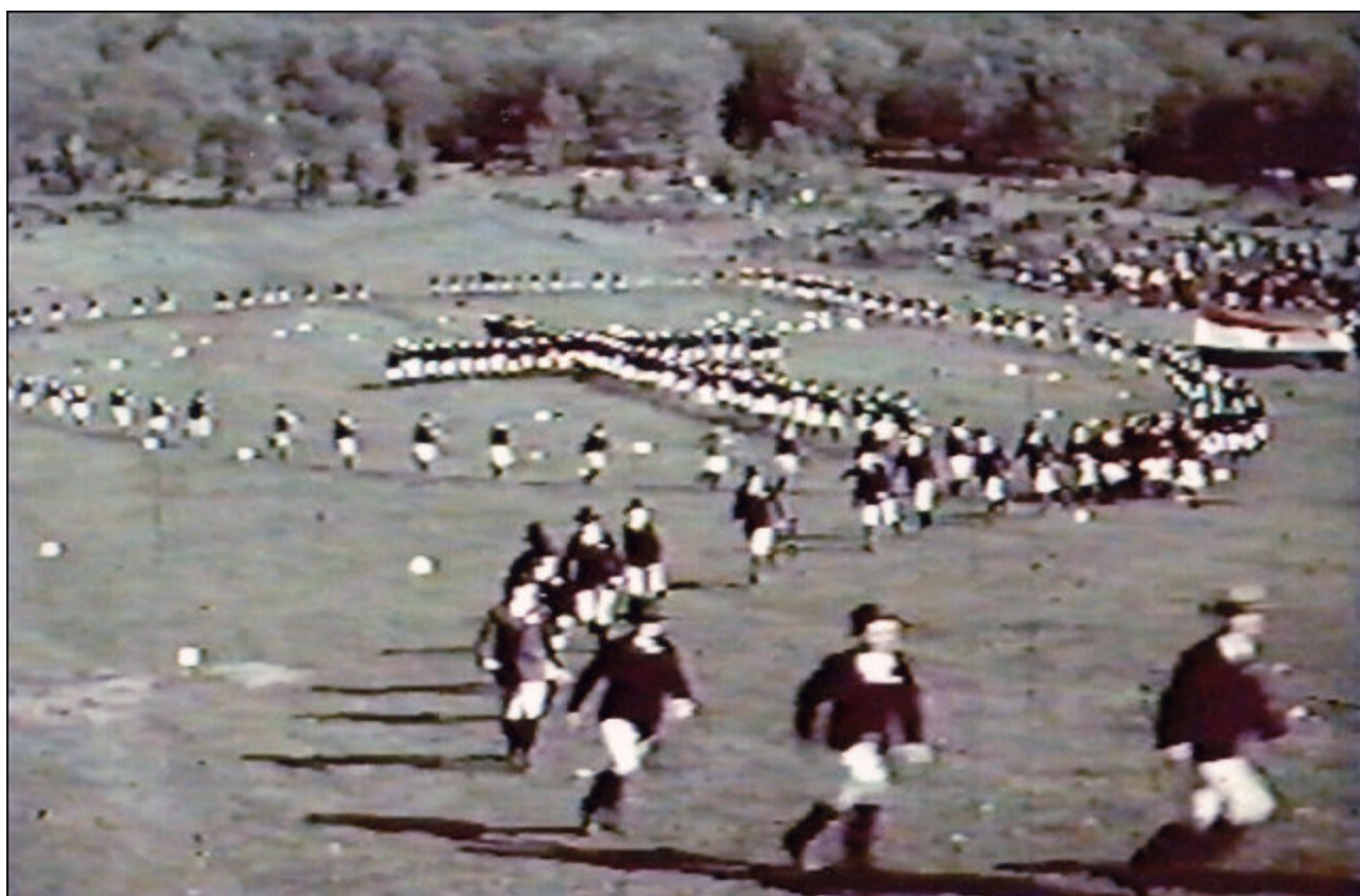
Pünkösdi búcsú Csíksomlyón: KALOT-jelvény „élőben” (1941). Archív felvétel