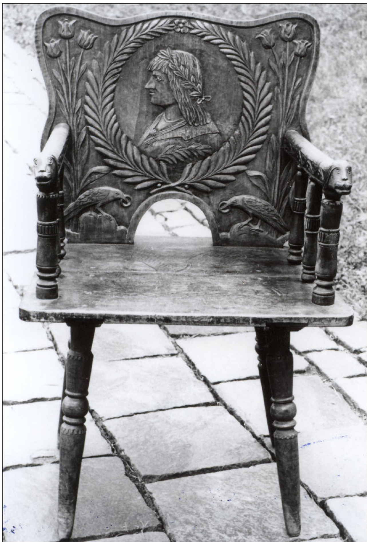
Kristó János munkája, Csíkkozmás. A Csíki Székely Múzeum tulajdona