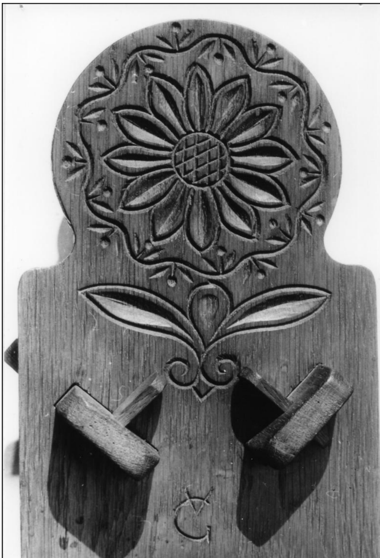
Gál Vilmos csillagfaragó kézjegye