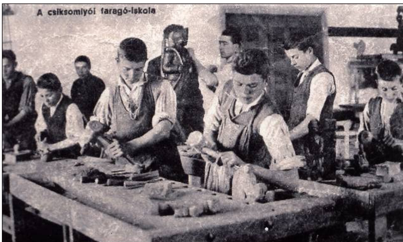
A csíksomlyói KALOT Szervátiusz-féle faragó iskolája (1941-42). Archív felvétel