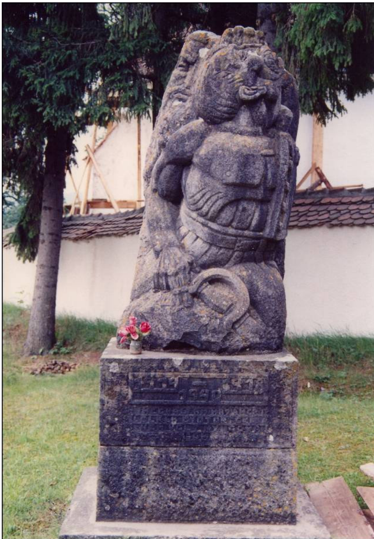
Szervátiusz Jenő Csíkmenaság hősei emlékműve