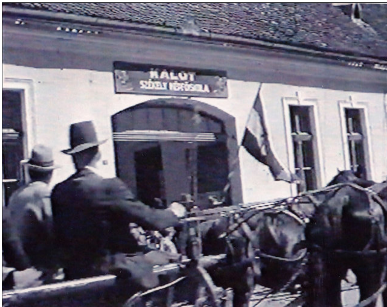
Az ideiglenes KALOT Székely Népfőiskola 1941. május 18-án (Püünkösöd). Archív felvétel