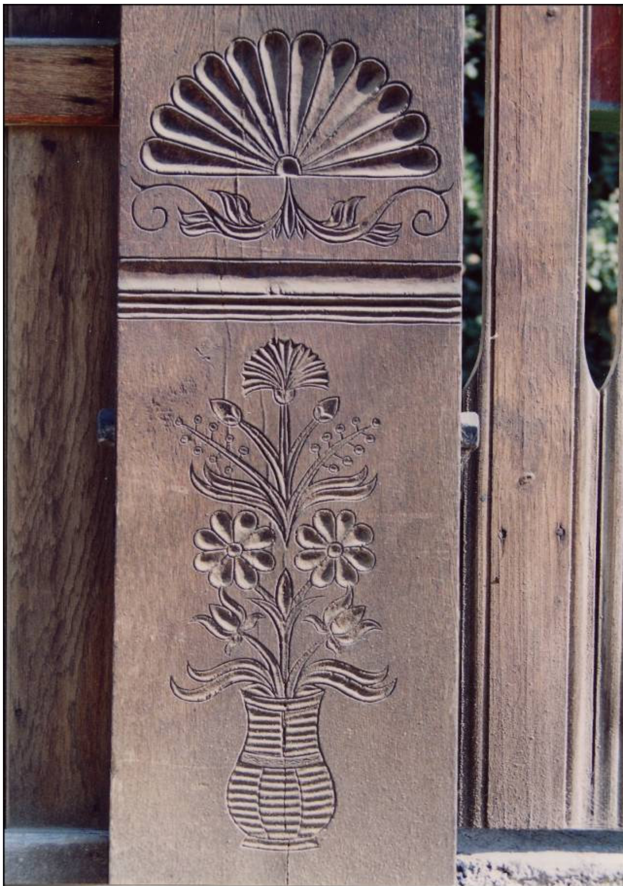
Sass Imre faragott kapuja Csíkkozmánson (részlet)