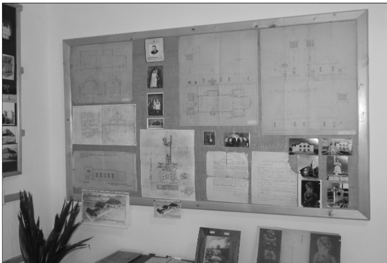
Falrészlet a 2011-es csíkszeredai KALOT-KALÁKA emlékkiállításról