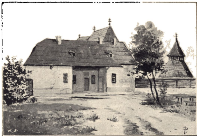
BOLYAI FARKAS LAKÓHÁZA MAROSVÁSÁRHELYT.