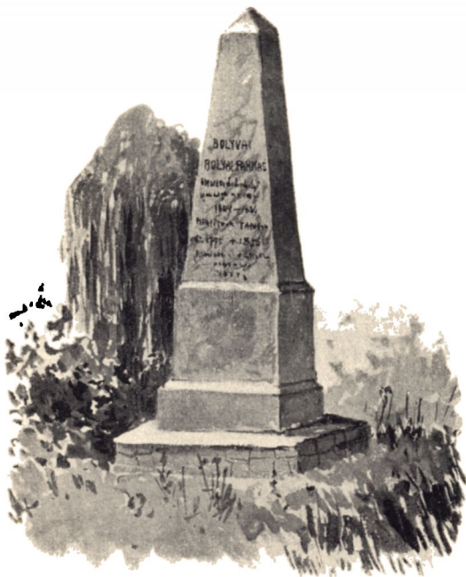
BOLYAI FARKAS SÍRKÖVE A MAROSVÁSÁRHELYI TEMETŐBEN.