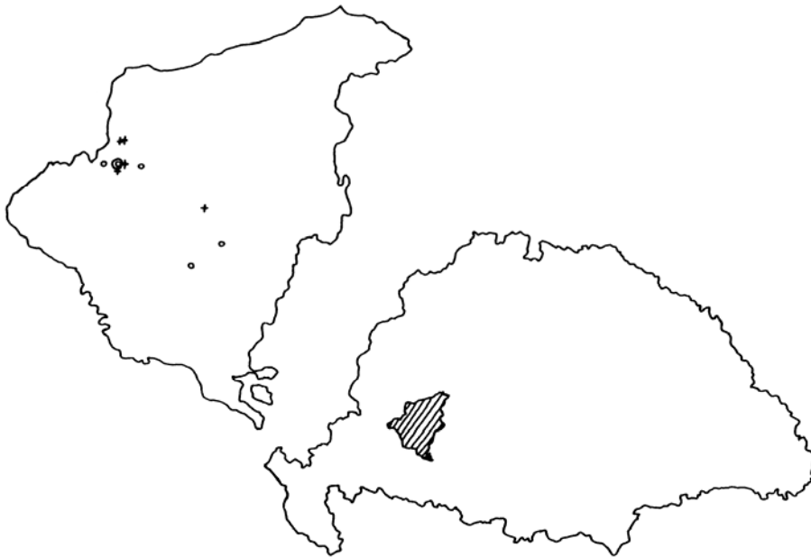
3. térkép A Kulcsár család rokonai és birtokai

A legalsó szinthez tartozó utolsó család, a Kulcsár família tagjai szintén Nemesviden éltek. Kisebb földjeik nekik már a nemesi községen kívül is voltak, a legtávolabbi lakóhelyüktől mintegy 5 mérföldnyire (körülbelül 42 kilométerre). A velük házasság révén rokonságba kerülő családok azonosítása során csak somogyiakkal találkoztam