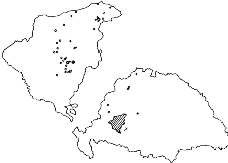
6. térkép A Mérey család rokonai és birtokai

A Méreyek a magyar köznemesség legrégebbi családjai közé tartoztak. A család Árpád-kori gyökerei Somogy földjébe kapaszkodtak, de ágai a 18. századra már az ország területének nagy részét befutták. Korszakunkban a család három ága élt a vármegyében: Bárdon, Szerdahelyen és Tabon. Birtokaik a megye 25 falvának határában feküdtek. Házasság révén szerzett rokonaik jelentős része a megyén kívül élt – valamennyien az ország nyugati felében.