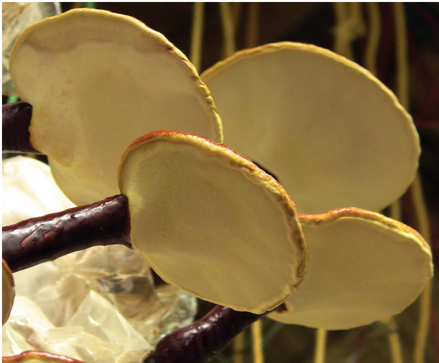
termesztett Ganoderma lucidum

Legtöbb tapasztalatot a Helicobacter pylori által okozott