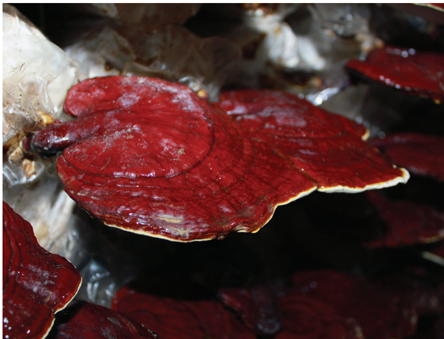
termesztett Ganoderma lucidum

A termőtestből, micéliumból és spórából eddig mintegy 400 bioaktív vegyületet mutattak ki, főleg triterpenoidokat, poliszacharidokat, nukleotidokat, szteroidokat, zsírsavakat, proteineket (peptideket) és nyomelemeket.