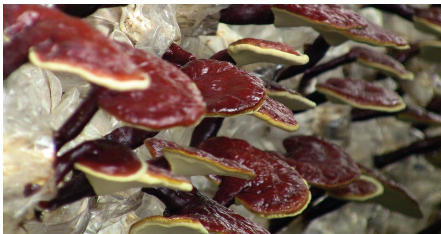
termesztett Ganoderma lucidum

Publikációk sora bizonyítja, hogy alternatív adjuvánsként használják leukémia, karcinóma, hepatitis és diabetes betegségek esetén. A legtöbb esetben azonban hiányoznak az elfogadható bizonyítékként szükséges kontroll vizsgálatok. Az utóbbi évtizedben már egyre több igényes beszámoló közlemény jelenik meg a terápiás alkalmazhatóságról.