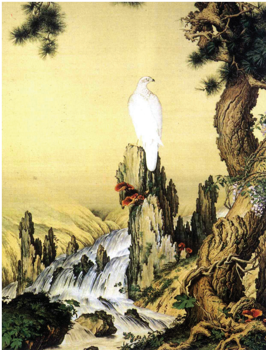
Lang Shi-zhu: A Song-hegy sólyommal és Ganodermával [Qing-kori selyemfestmény, 嵩獻英芝 (清) 郎世宁]. A Tajpei-i Palotamúzeum gyűjteményéből.

segít a leromlott egészségi állapotú betegek gyógyulásában, kiemelt jelentősége van a gyomor-, a vastagbél-, a máj- és a hasnyálmirigyrák kiegészítő kezelésében és a kemoterápia mellékhatásainak kivédésében. A nevek jelentése is a különleges hatásra utal!