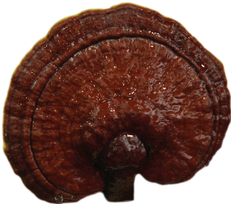
termesztett Ganoderma lucidum

Hasonlóképpen beszédes számadatokkal találkozhatunk akkor is, ha a gyógyhatású gombák gyógyításban való alkalmazhatóságát vizsgáljuk. A Földünkön élő, szabad szemmel látható, ún. nagygombák számát 140 ezerre becsülik, azonban e fajoknak csupán 10–15%-át ismerjük. Ennek ellenére legalább ezerre tehető azon gyógyhatású gombákból előállított hatóanyag-frakciók és vegyületek száma, melyeknek igen értékes terápiás hatásokat tulajdonítanak.