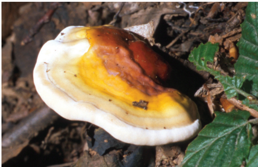
Ganoderma lucidum

ZSIGMOND GY.: Gomba és hagyomány : etnomikológiai tanulmányok. Budapest : Sepsiszentgyörgy : LKG-Pont Kiadó, 2009. 174 p. ISBN 963 8756 74 9