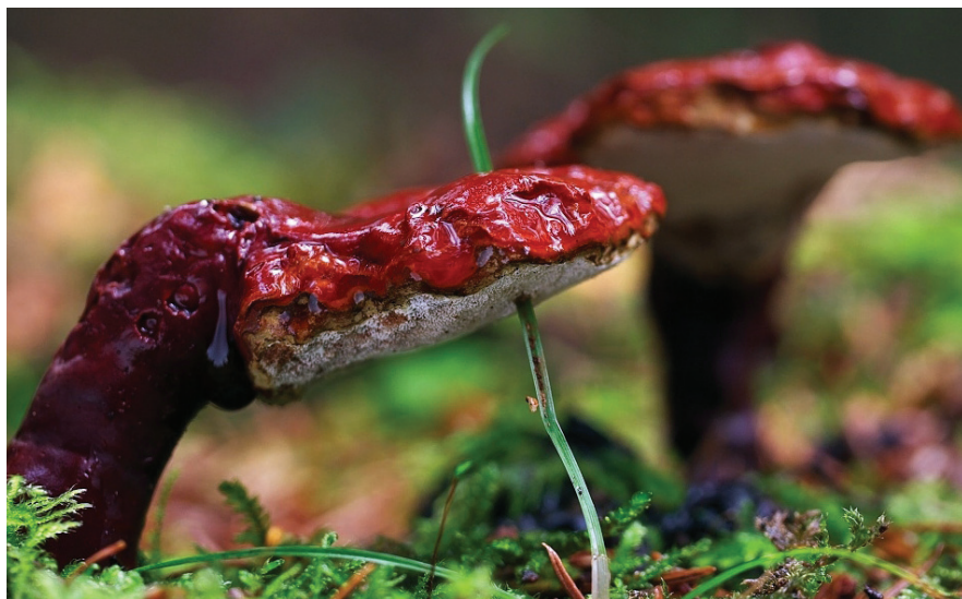
Ganoderma lucidum

Tudományos ismeretterjesztő füzetünk célja az, hogy a pecsétviaszgombáról ( Ganoderma lucidum ) fontos alapadatokat adjunk közre, illetve segítsük a természetes gyógymódok iránt érdeklődőket abban, hogy megérthessék, mit várhatnak és mit nem várhatnak el ettől az Ázsiában évezredek óta használt, majd a múlt század közepétől a nyugati tudományos élet számára is felfedezett gombától