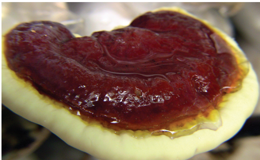
termesztett Ganoderma lucidum

A Ganoderma lucidum ból származó ergoszterolperoxid (5,8-epidioxi-5 \alpha ,8 \beta -ergosta-6,22E-dien-3 \beta -ol) szelektíven erősíti a linolsav DNS-polimeráz- \beta -ra gyakorolt gátló hatását, de e hatása nem érvényesül a DNS-polimeráz- \alpha enzimre. Az ergoszterolperoxid önmagában hatástalannak mutatkozott, de linolsav jelenlétében gátolta a DNS-polimeráz- \beta -át.