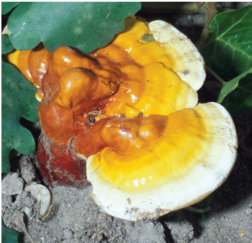
Ganoderma lucidum

Morfindependens (függő) egerekben a G. lucidum -ból származó poliszacharid-peptid kezelés hatására normalizálódott az immunológiai állapot, ami kezelés nélkül nem következett be. A kísérletben a morfinnal kezelt egerek lépsejtjeiben a mRNS-expresszáció (hírvívő ribonukleinsav kifejeződése, ami a speciális fehérjék szintézisét biztosítja) jelentősen csökken. A hatást az említett kezelés ellensúlyozta, azaz a gének kifejeződése helyreállítható volt. Tehát úgy tűnik, hogy az opiáttal előidézett immundeficiencia, a hiányos immunválasz megszüntethető, vagyis a függőség előnyösen befolyásolható.