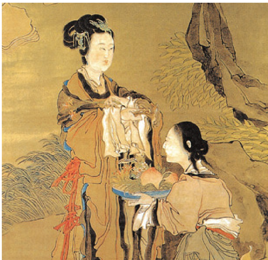
Ren Xun: Magu születésnap ajándéka [Qing-kori selyemfestmény, 麻姑獻壽圖 (清) 任薰]. Changshu város Kulturális Bizottságának gyűjteményéből.

(különösen a lucideninsav O), lucidenin-lakton (utóbbi HIV ellenesnek mutatkozott!) és más triterpenoidok. A spórák éteres frakciójából izolálták a ganosporinsav-A triterpént. A spórából több új lanosztán-típusú triterpént is elkülönítettek, ezek is különböző szerkezetű ganoderinsavak. Több adat utal arra, hogy a spóra többféle triterpénsavat tartalmaz, mint a termőtest. A változékonyság még nagyobb, ha a genotípusok és a termőhelyi adottságok sokféleségét is figyelembe vesszük. Figyelemre méltó tény, hogy a spórák különösen gazdagok triterpénekben, mivel triterpén-laktonokat is tartalmaznak. Általában megállapítható, hogy a pecsétviaszgomba triterpenoidjainak biológiai aktivitása összefügg sajátos és gyakorlati szempontból is lehetséges gyógyászati hatásukkal.