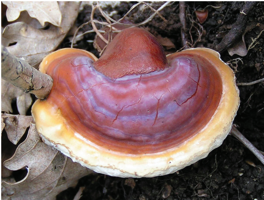
Ganoderma lucidum

Meg kell jegyezni, hogy a hazai, érvényes gombataxonómia külön fajként említi a derestaplót [ Ganoderma applanatum (Pers.) Pat.]. Ez a faj azért fontos, mert kísérleteznek a termesztésével, mivel hasonló hatásairól számolnak be. Termeszthetősége hasonló a shii-take gombáéhoz, szalma táptalajon azonban kevésbé jól terem. 25°C az átszövetési hőoptimum, és 15–20°C körüli a termő állapotban igényelt hőmérséklet. A termőtestképződés idején fényre és 80%-os páratartalomra van szüksége, ezért gyakran alkalmaznak takaróközeget. 2 hullám adja a termés nagy részét, 10–15% kihozatalra képes. A Magyarországon honos két faj megkülönböztető bélyegei, alaptulajdonságai: