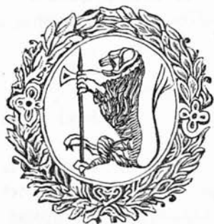
VÁRAD CZÍMERE SZENCZI KERTÉSZ ÁBRAHÁM NYOMTATVÁNYÁN.

† 1651. okt. 8.) jelvényét Carl B. Lorek jellemzi: »Als Druck- zeichen nahm Isaack eine Ulme an, die von einem Rebstock voll Trauben umschlungen wird, daneben steht ein Einsiedler. Die