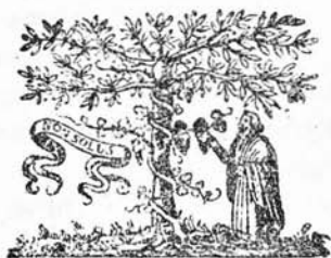
A SZENCZI KERTÉSZ ÁBRAHÁM ÁLTAL HASZNÁLT ELZEVIR- JELVÉNY.

oldalon Minerva áll, keze ott nyugszik a szalagon, míg balról a fa alatt egy bagoly van, nyitott szárnyával. Továbbá a nyomdájá- nak megalapítása első évében megjelent munkán: »Az keresz- tyéni hitnek ágazatiról való prédikációknak tárházá«-n oktáv alakú, csinos rozettákból alkotott ke- retben egy alabárdos oroszlánt hasz- nál nyomtatói jelvénynek. Ez Váradi kertész és itt Szenczi Kertész Ábra- hám a nyomtatás helyét akarta kitün- tetni jelvényével.