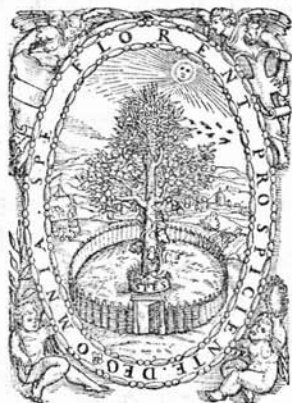
HOFFHALTER KÖNYVNYOMTATÓI JELVÉNYE.

Nemesi címere ezüst paizson szegekkel kivert patkó és ebben kereszt. A sisakon egy vérese ül, szétterjesztett szárnyakkal, csőrében pecsétgyűrű. Ez utóbbit valószínűleg csak Hoffhalter