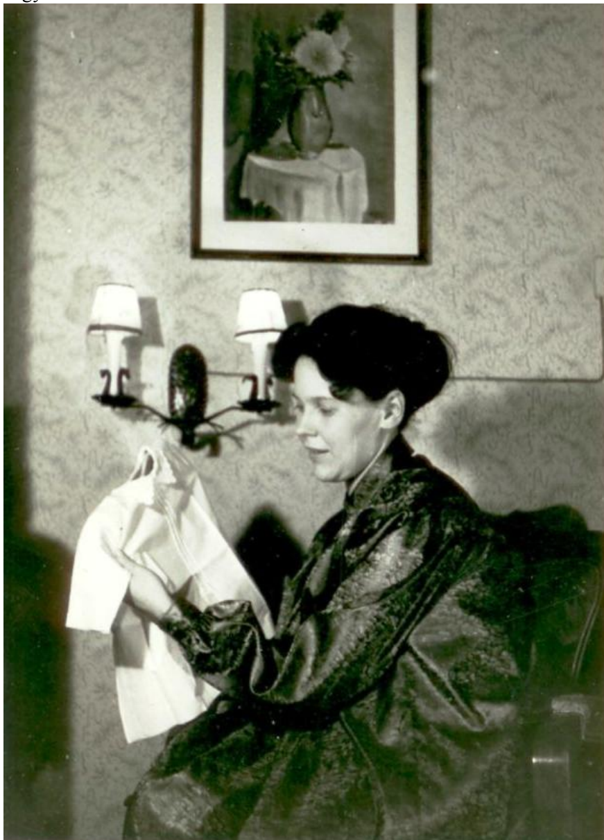
Ezt a képet édesapám készítette édesanyámról a születésem előtt. (1962)