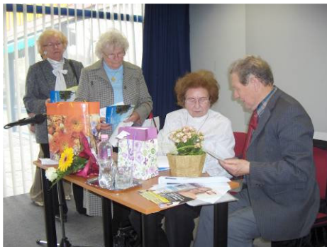
Könyvem dedikálása - és a salgótarjáni költővel

(Salgótarján, 2002. október) A hálás közönség tapssal jutalmazta.