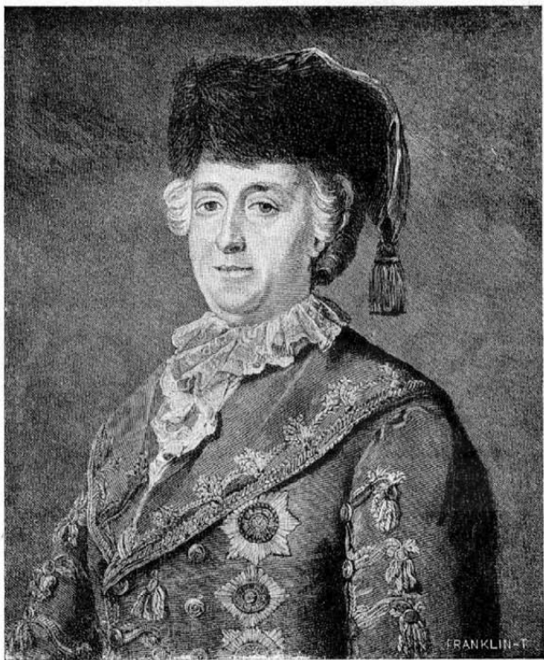
II. Katalin császárné.