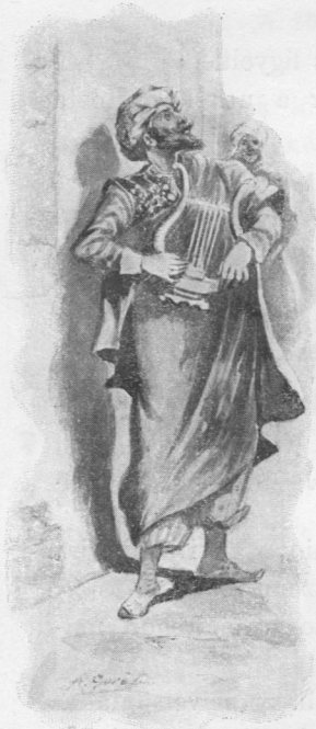
A TÖRÖK ÉNEKES.

Sebők deák ura után kérdezősködött, mit érdekelte őt Firuzi pasa nagy hatalma, Zaira szépsége, csak urát láthassa, vele beszélhessen — aztán újra tovább megy egy — hazával. Ott van a lantosra szükség, hol pihen a kard, pedig harcriadót fújnak; szól a dáridó, pedig rab-