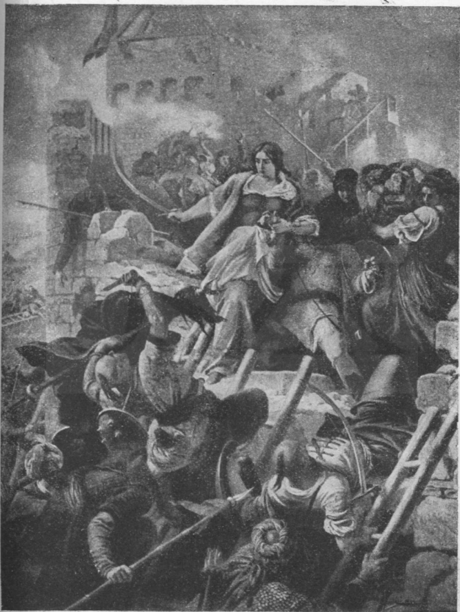
AZ EGRI NŐK.