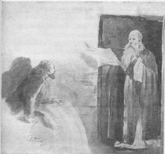
IGNÁC PÁTER VOLT A NEVE.

Zivataros éjjeleken cseng-bong a fegyverterem, mintha viaskodnának hatan egy ember