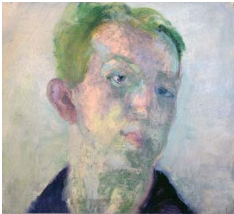
21. Önarckép , 1931 k., olaj-pasztell papír, 300 × 335