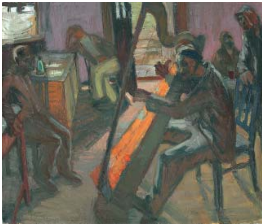
42. Hárfázó (Tihanyi kocsmában másodnapján), 1939., olaj, vászon, 600 × 700