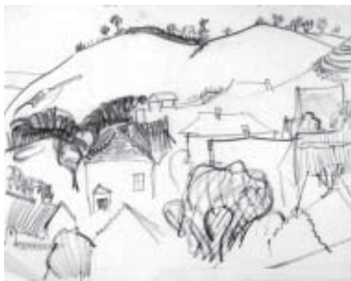
37. Dombos táj Tihanyban , 1939 k., ceruza, papír, 234 × 296