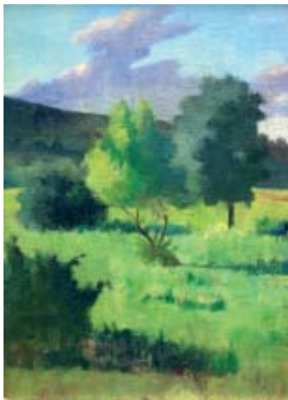
24. Koranyári délelőtt (Miskolc) , 1933 k., olaj, vászon, 570 × 405