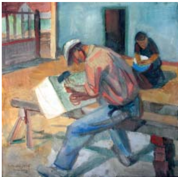
51. Munka (a "Nyár" triptichon középső képe), 1940., táblafreskó, 400 × 395