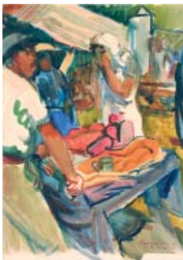
40. Vásár (Paprikaárus a fürdői vásárban) , 1939., akvarell, papír, 300 × 232