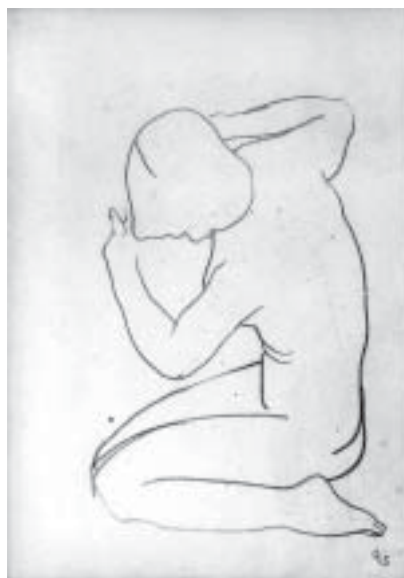
63. Térdeplő akt, 1933., ceruza, papír, 473 × 313