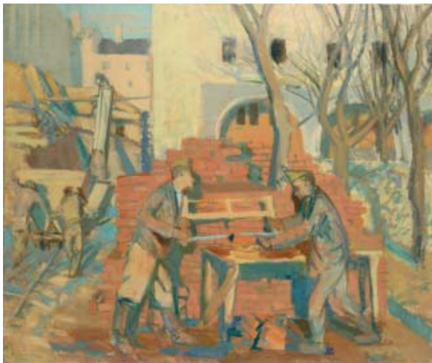
59. Építkező katonák (Fűrészelő katonák, Téglafűrészelők), 1941., olaj, karton, 800 × 940 a Magyar Nemzeti Galéria tulajdona