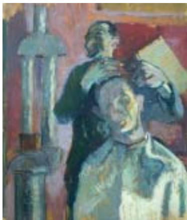
8. Borbélynál, 1937 k., olaj, papír, 470 × 400

A francia posztimpresszionisták közül leginkább Cézanne-t és Van Goghot tartotta nagyra, azonban a modern elvont törekvésektől, a nonfiguratív kísérletektől (Franz Marc, Kandinszkij) idegenkedett, és a futuristák, kubisták sem gyakoroltak rá alkotói értelemben hatást. Tájképein, portréin átgondoltság, mély spiritualitás érződik, de ezt nem a húszas évek újklaszcizista, Árkadia-festészetének heroikus stílusában valósította meg. Tanárain kívül talán a Gresham-kör tagjaival érzett emberi és szemléletbeli rokonságot, a már befu-