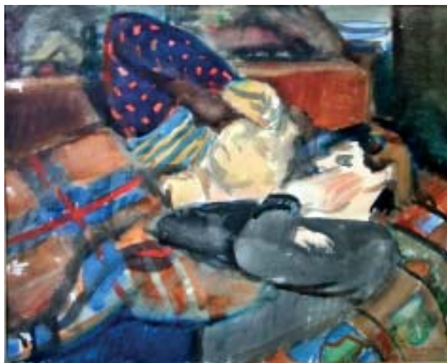
49. Alvók (pihenés) , 1940., akvarell, papír, 230 × 284