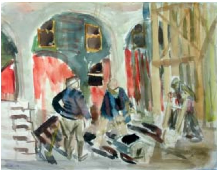
60. Talicskázók Pannonhalmán , 1941., akvarell, papír, 237 × 300