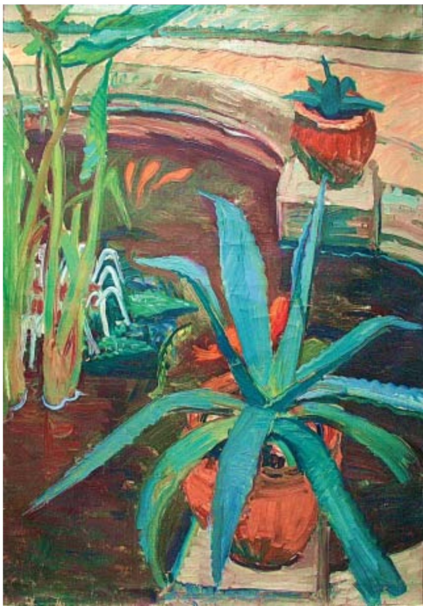
31. Kaktuszok (Agávék) , 1938., olaj, vászon, 865 × 590