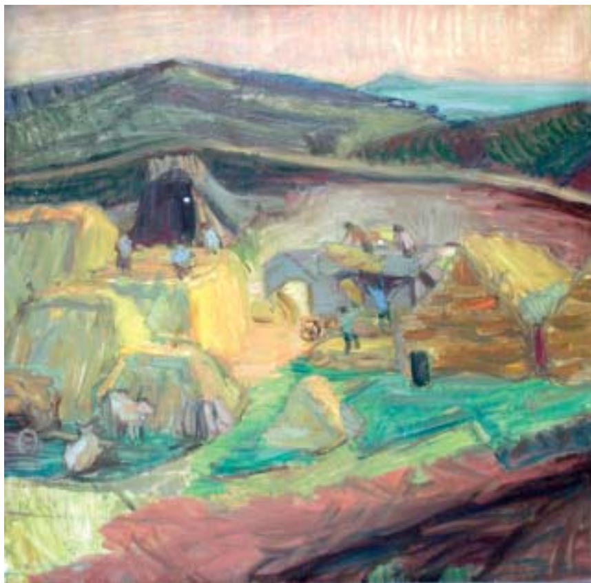
44. Cséplés a mezőn (Szántóföldön, Cséplés), 1939 k., olaj, vászon, 800 × 800 a Magyar Nemzeti Galéria tulajdona