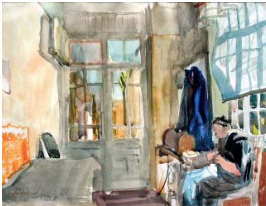
53. Anyám a verandán , 1941., akvarell, papír, 220 × 288