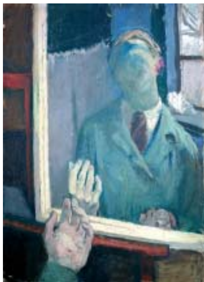
9. Önarckép tükörrel, 1937 k., olaj, karton, 700 × 502

Érdeklődési körének tágulását mutatja, hogy ex libris-terveket és üveglak-terveket is készített ekkoriban. A színpompás gótikus üveglakok később is csodálattal töltötték el, amint arról párizsi naplójegyzetei és vázlatai tanúskodnak.