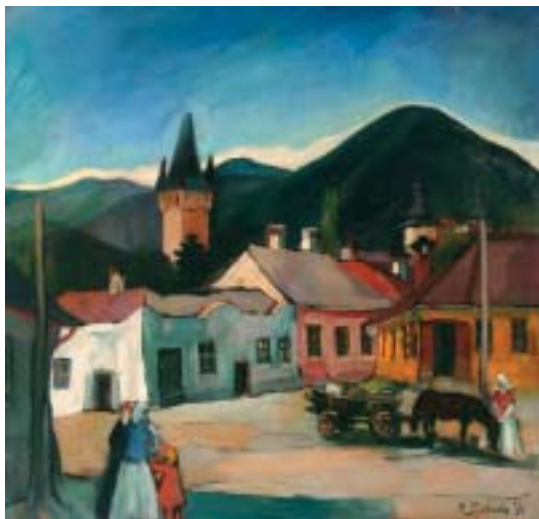
7. Felsőbánya, 1932 k., olaj, vászon, 800 × 880

elején hívták be először tartalékos katonai kiképzésre. A hadseregnél töltött időszak nagy lelki megrázkódtatást jelentett számára, az ott meg tapasztalt durvaság, embertelenség viszolygással töltötte el. A főiskola utolsó hónapjaiban komoly elméleti munkát végzett, szakdolgozatát a „A szín, mint szimbólum a művészetben” címmel írta meg. Ebben nagyfokú tájékozottságot tanúsított az