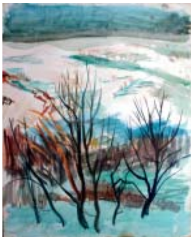
16. Havas táj Pannonhalmi környékén , 1942., akvarell, papír, 570 × 450

lála után (1940 szeptemberében) azonban megváltoztatta álláspontját, és 1941 szeptemberében elfogadta a biztos keresetet jelentő tanári állást. A nyara még az otthoni környezetben telt, a kertről, a faluról remekműveket készített ( Nyár triptichon , Beszélgetők a verandán /20. kép/, Anyám mos /54. kép/). Ezek voltak utol-