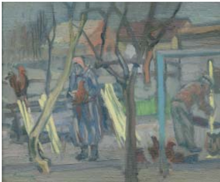
39. Koratavaszi (Baromfiudvar) , 1939., olaj, vászon, falemezre kas., 360 × 435 a Magyar Nemzeti Galéria tulajdona