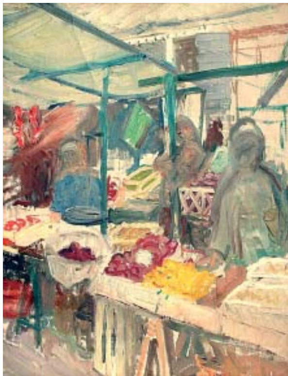
36. Gyümölcs vásár , 1938 k., olaj, vászon, 640 × 490