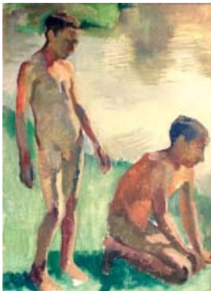
26. Fiúk a vízparton (Miskolci cigánygyerekek) , 1935 k., olaj, vászon, 730 × 610