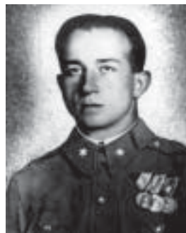
A művész katonaruhában 1941-ben

Nevelői és művészi munkáját azonban drasztikusan félbeszakította a történelmi helyzet: 1942 márciusában újból katonai egyenruhát húzott és április végén a szovjet frontra vezényelték, ahol augusztus 8-án Voronyezstől délre, Sztorozsevoje falu mellett tűzharcban esett el. A közeli Novo Uszpenka temetőjében hantolták el. Földi maradványai ma a Rudkinóban létesített központi hősi temetőben nyugszanak. 8