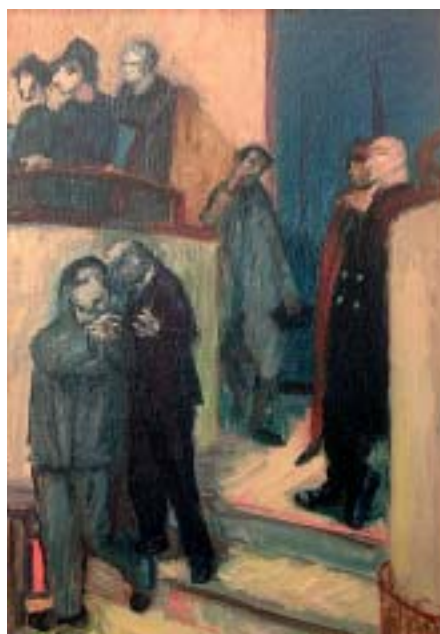
30. Elkészett hangversenylátogatók , 1938 k., olaj, vászon, 670 × 480