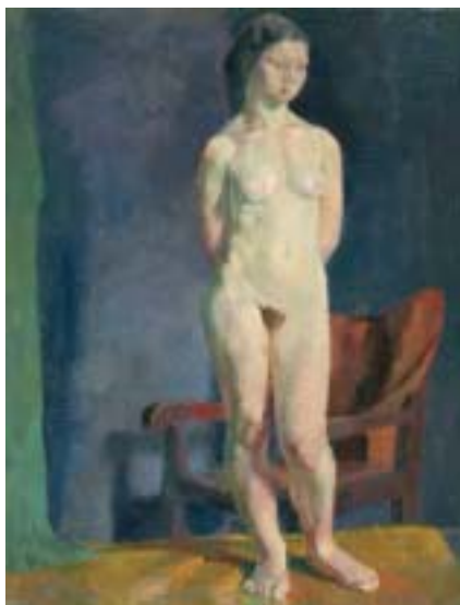
27. Álló akt (Leányakt) , 1937 k., olaj, vászon, 840 × 430