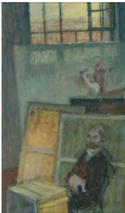
57. Csontváry (a "Festészet" triptichon jobb képe), 1941 k., olaj, karton, 585 × 335 a Magyar Nemzeti Galéria tulajdona