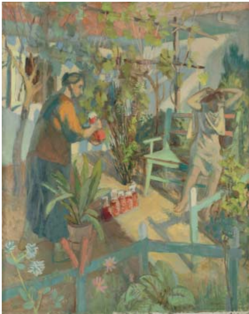
55. Befőzés , 1941., olaj, vászon, 1200 × 960 a Magyar Nemzeti Galéria tulajdona