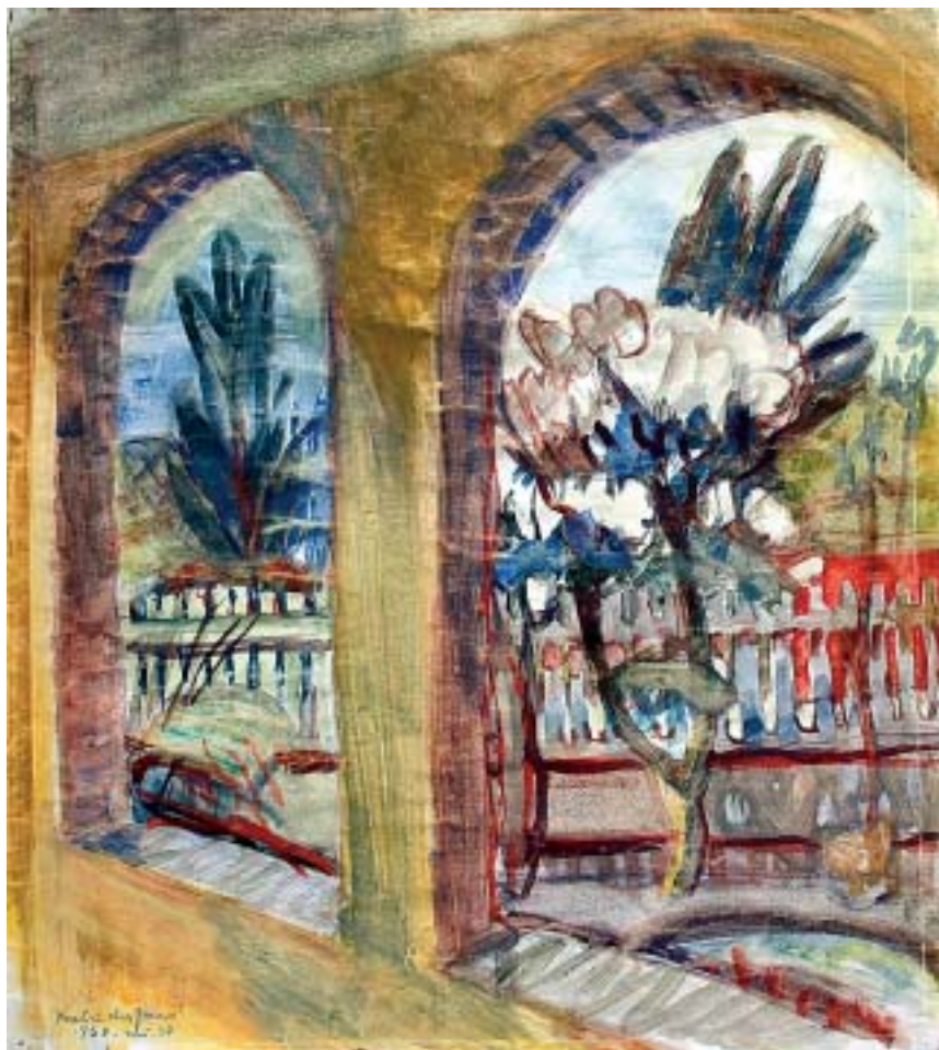
41. Kilátás a verandánkról, 1939., gouache, papír, 395 × 335