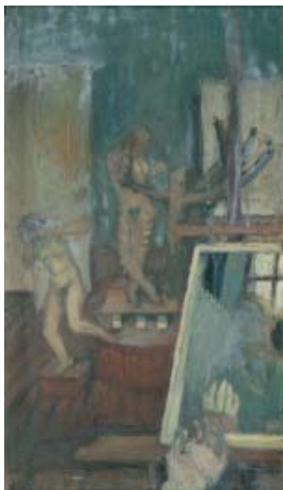
56. Ádám (a "Festészet" triptichon bal képe), 1941 k., olaj, karton, 585 × 335 a Magyar Nemzeti Galéria tulajdona