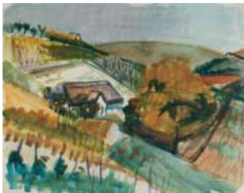
13. Kilátás a Balatonra , 1939., akvarell, papír, 470 × 600 a Magyar Nemzeti Galéria tulajdona

Ezek a legjobb képei közé tartoznak. Lendületes vonalvezetés, nagy foltokban való építkezés, mély érzelmi telítettség, élénk színvilág jellemzi e műveket, s bennük a nagybányai hagyomány feloldódik a Szőnyitől, Rétitől tanult látásformával, s a maga által kidolgozott lírai expresszív stílusformákkal. Cézanne, Van Gogh, a konstruktivisták és kubisták művészi eredményeit is beépítette festményei színvilágába, szerkesztési módjába, alkotói látásmódjába. Nagyra tartotta Csontváryt, egyik triptichon formájú művében ( Festészet – Triptichon 6 ) a jobb oldali képen a nagy festő portréja az előtérben látható. A földműves