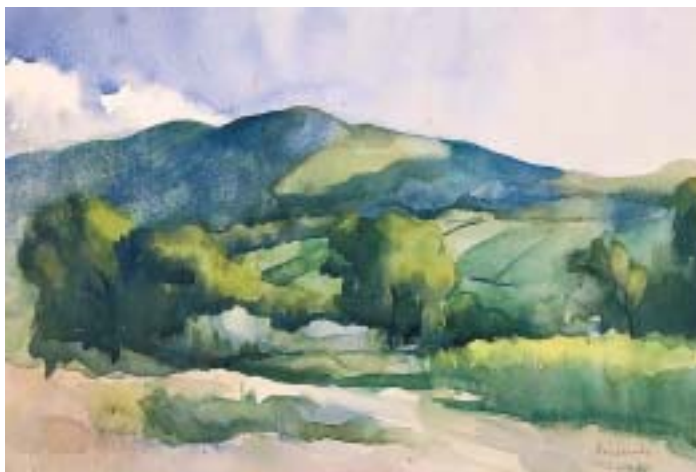
22. Szentendrei táj , 1932., akvarell, papír, 272 × 290