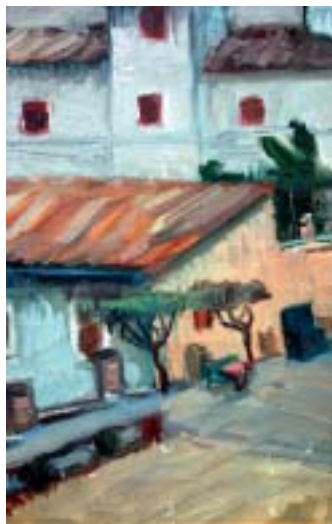
34. Olasz városka, 1938 k., olaj, vászon, 430 × 280