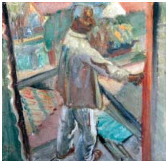
50. Szemlélődés (a "Nyár" triptichon bal képe), 1939., táblafreskó, 395 × 400