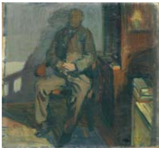
47. Apám , 1939., olaj, vászon, 600 × 650 a Magyar Nemzeti Galéria tulajdona