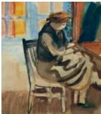
11. Anyám a varrógépnél , 1939., akvarell, papír, 120 × 105

Koratavasz /39. kép/, Anyám a varrógépnél /11. kép/, Édesapám munka közben /12. kép/ ). Lendületes, széles ecsetkezeléssel, élénk színekkel ragadta meg a kert virágzó gyümölcsfáit, a veranda boltívein át kitekintve megkapó kivágásban ( Kilátás a verandánkról /41. kép/ ). Az itáliai falképfestészet remekei lelkesedéssel töltötték el, talán ennek is tudható be, hogy hazatérése után otthon többször kísérletezett freskóval, kisebb méretben. Technikai jártasságát, mesterségbeli tudását azonban sajnos a későbbiekben ezen a területen nem tudta kamatoztatni.