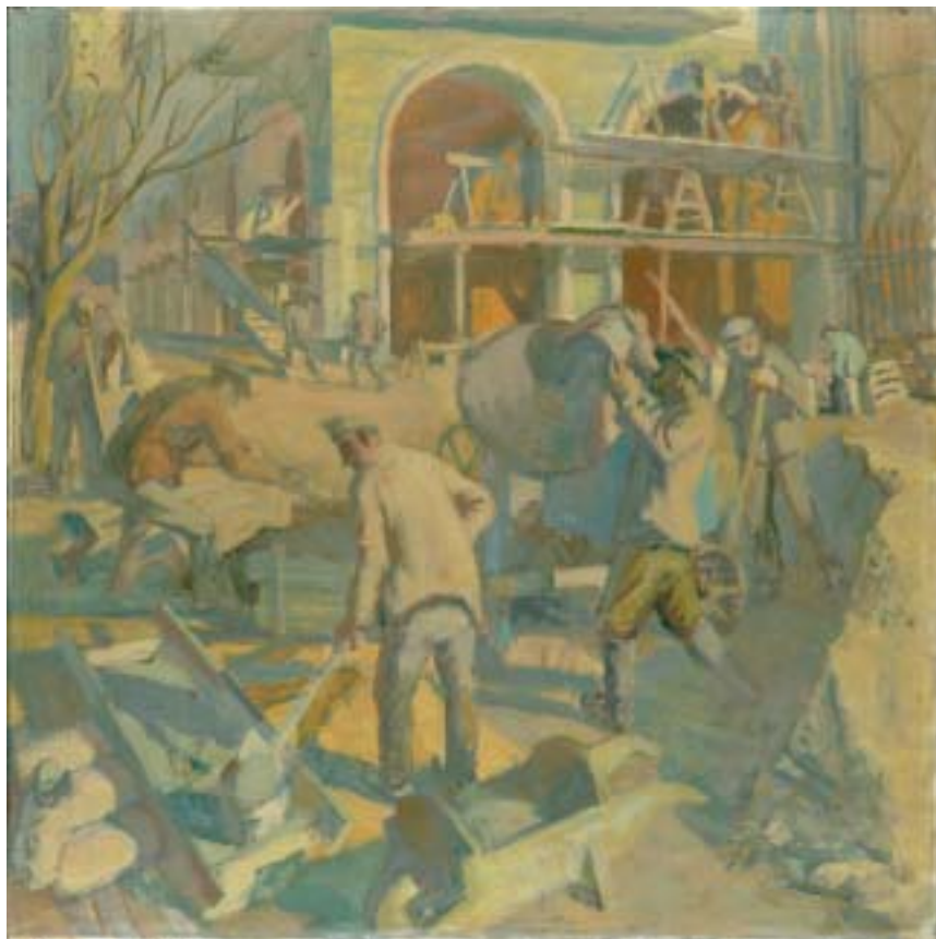
58. Építkezés , 1941 k., olaj, vászon, 800 × 800 a Magyar Nemzeti Galéria tulajdona