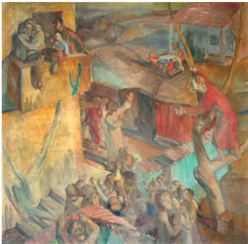
52. Zakeus várja Jézust (Zakeus) , 1940., táblafreskó, 990 × 990