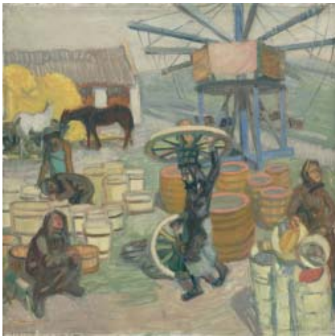
46. Vásár (A füredi vásárból) , 1939., olaj, vászon, 800 × 800 a Magyar Nemzeti Galéria tulajdona