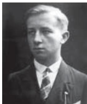
A művész érettségi képe 1930-ból