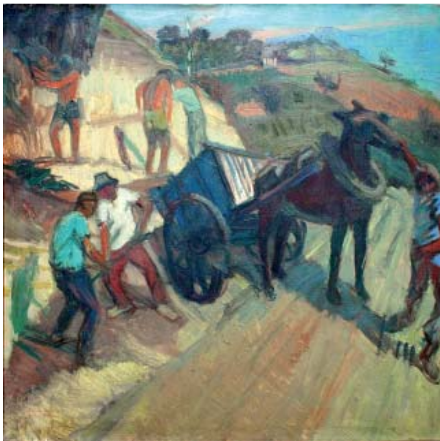
43. Kordély , 1939., olaj, vászon, 800 × 800 a Magyar Nemzeti Galéria tulajdona