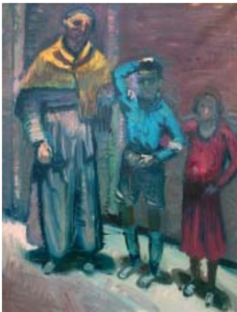
33. Külvárosi emberek, 1938 k., olaj, vászon, 690 × 520