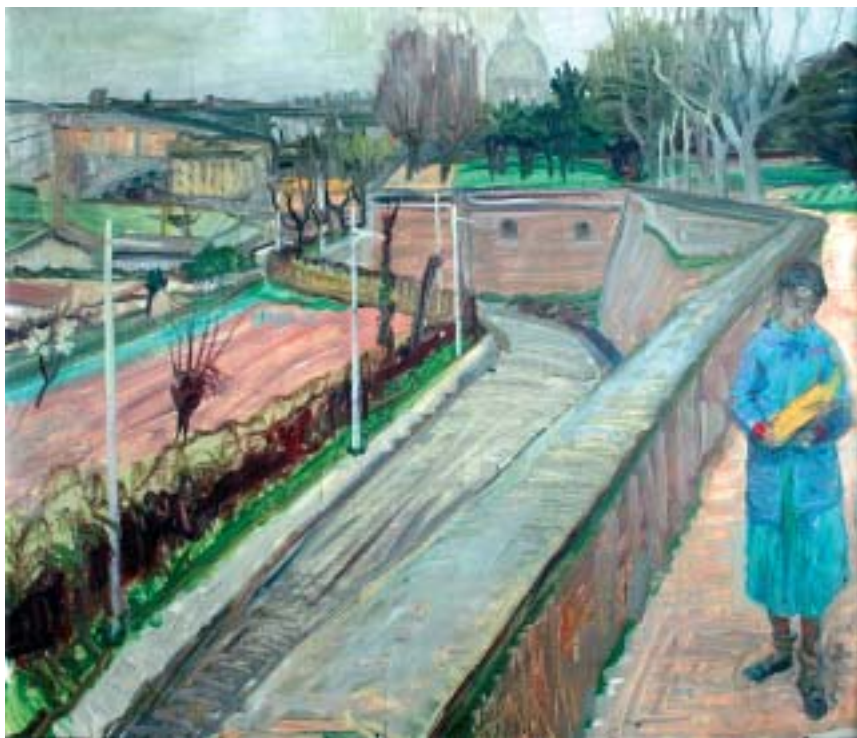
32. Római kertben ( Lány a Gianicolón, Gianicolo ), 1938., olaj, vászon, 590 × 700