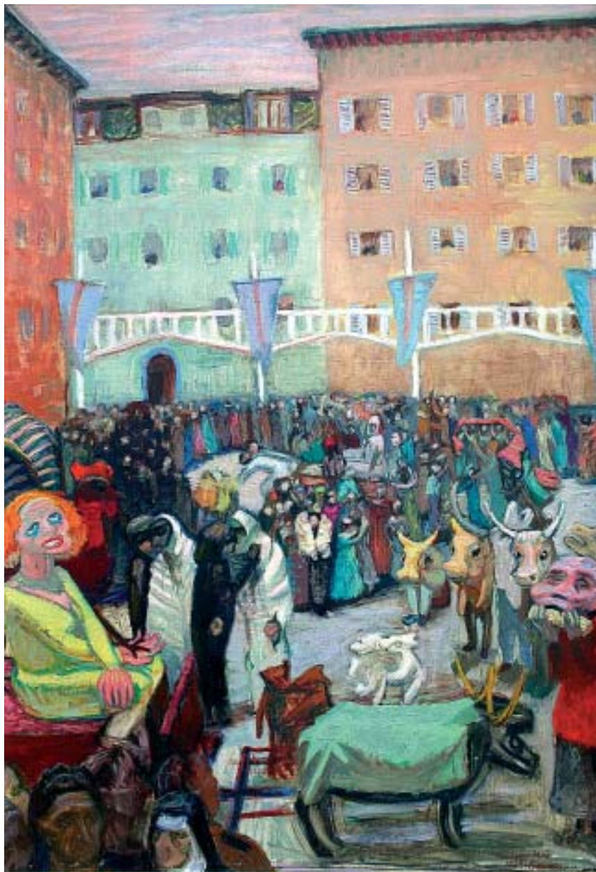
35. Frascatti karnevál (Olasz karnevál), 1938., olaj, vászon, 810 × 555