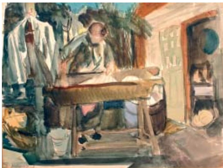
54. Anyám mos (Mosás) , 1941 k., akvarell, papír, 228 × 298