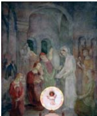
6. A gönci templom freskója a 2001-es állapot szerint

Az 1935. év tavaszán nagy élményt jelentett számára egy bécsi tanulmányút, ahol a múzeumokban eredetiben tanulmányozhatta az antik szobrokat, a cso- dált reneszánsz mesterek festményeit. A gönci plébános megbízásából festette ki a templom apszisát 1935 nyarán, ahol Szent Imre életéből vett jelenet volt a kitűzött téma, a herceg önfelajánlása a veszprémi templomban Szűz Mária szob- ra előtt. Ez az egyetlen murális alkotása, ami szerencsére meg is maradt. Több kompozícióvázlatot készített a freskóhoz, amelyekben a főbb figurák elhelyezését,