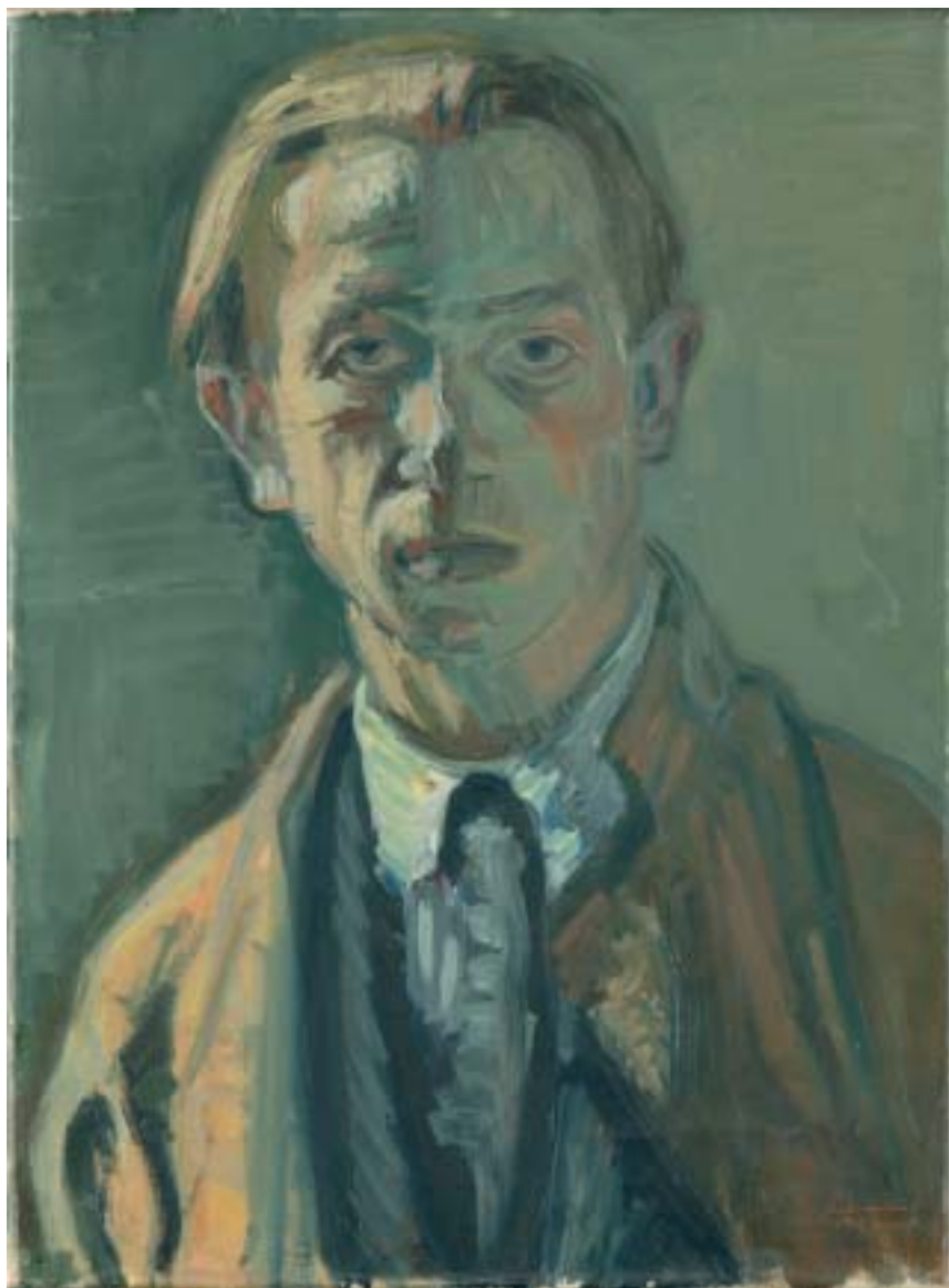
3. Önarckép , 1938., olaj, vászon, 650 × 510 a Magyar Nemzeti Galéria tulajdona