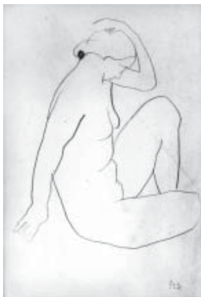
62. Haját igazító akt, 1933., ceruza, papír, 473 × 313

Köszönetet mondunk a fotók közlésének engedélyezéséért.