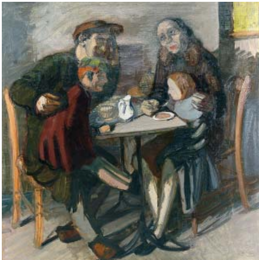
38. Reggeliző család, 1938., olaj, vászon, 940 × 940