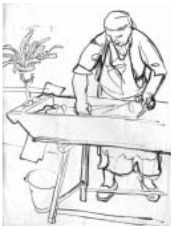
15. Anyám mos (Mosónő) , 1941., tus, papír, 600 × 400

lála után (1940 szeptemberében) azonban megváltoztatta álláspontját, és 1941 szeptemberében elfogadta a biztos keresetet jelentő tanári állást. A nyara még az otthoni környezetben telt, a kertről, a faluról remekműveket készített ( Nyár triptichon , Beszélgetők a verandán /20. kép/, Anyám mos /54. kép/). Ezek voltak utol-