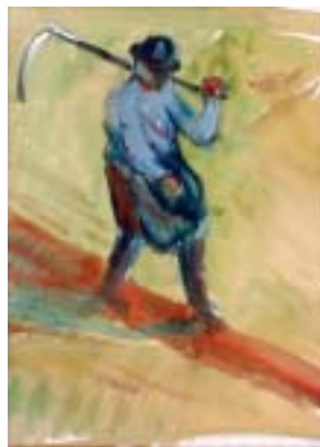
14. Férfi kaszával , 1939 k., akvarell, papír, 300 × 230