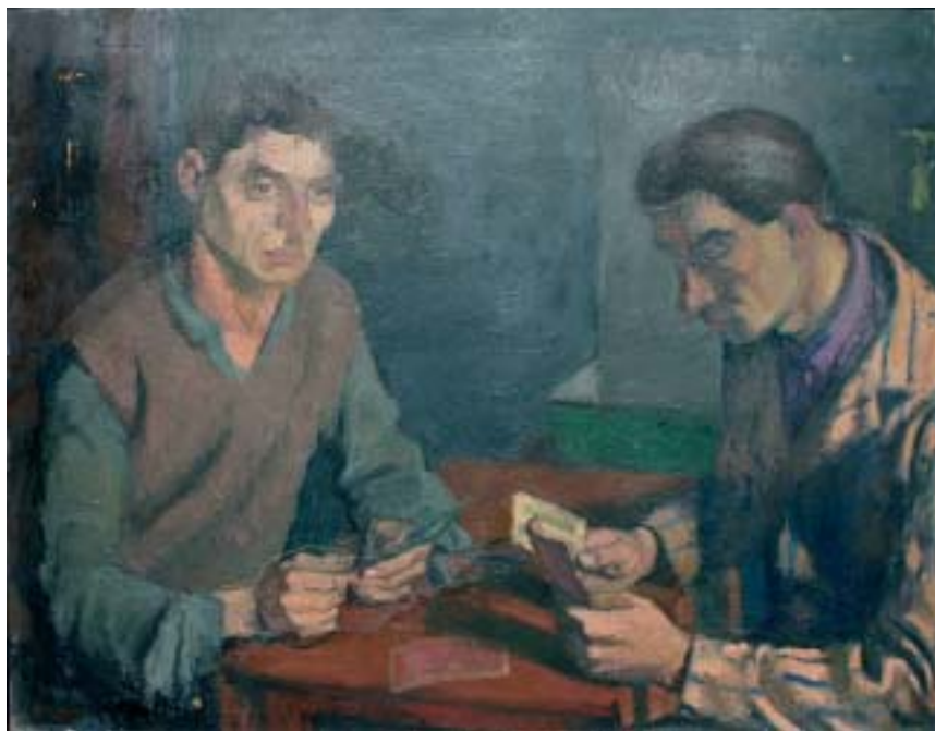
28. Kártyázók , 1936., olaj, karton, 900 × 1130