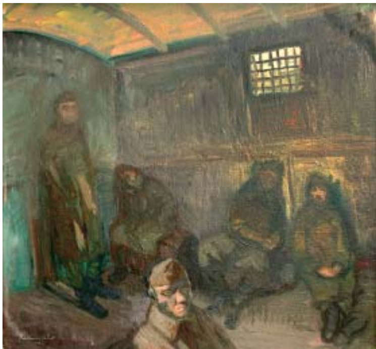
48. Katonák a vagonban (Katonák) , 1939., olaj, karton, 520 × 560