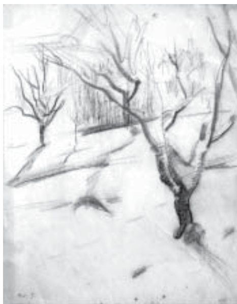
61. Kopár fák , 1942., ceruza, papír, 295 × 230