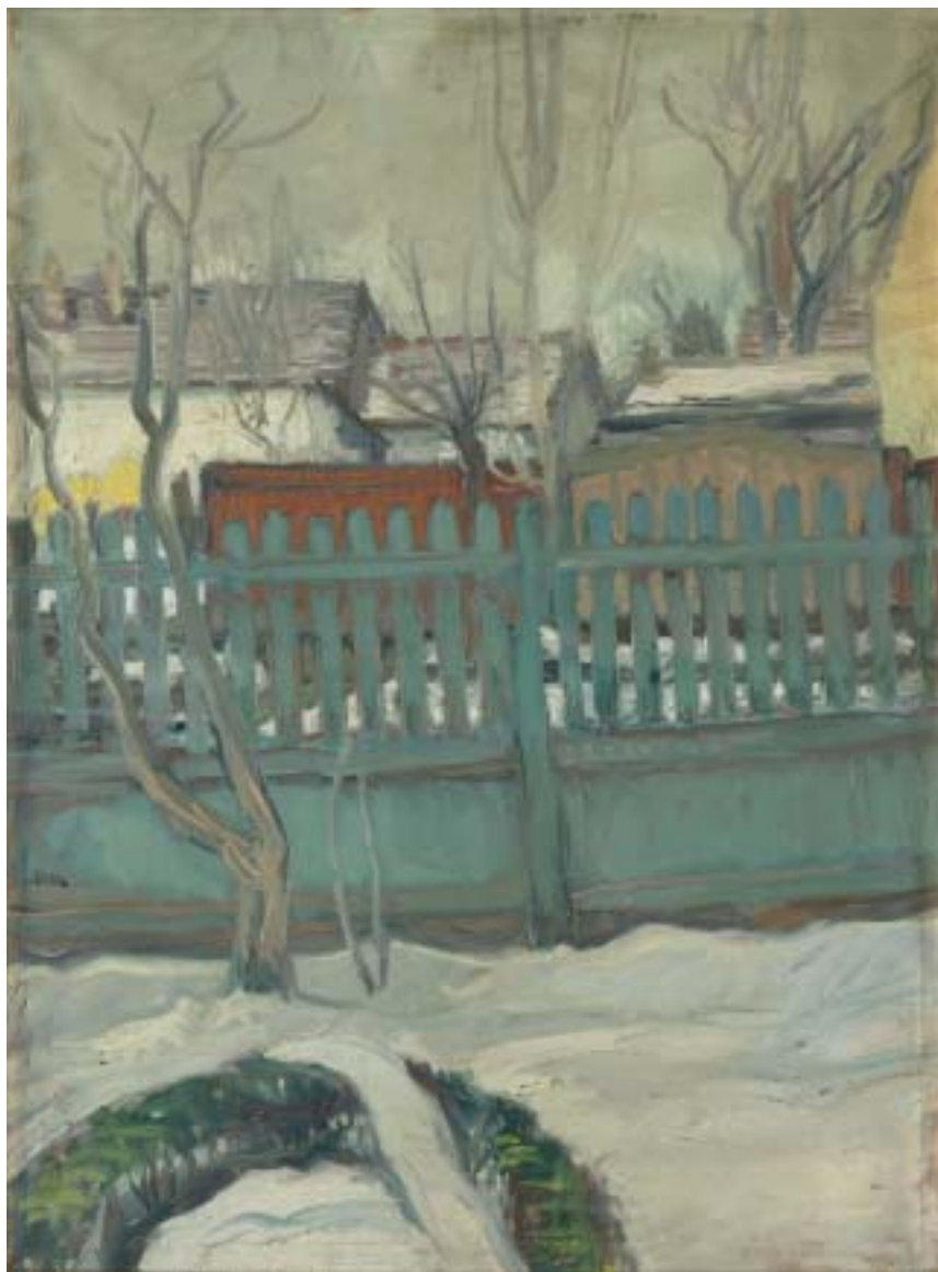
2. Táj ( Vecsési téli táj, Kertünk télen ), 1940 k., olaj, vászon, 650 × 480 a Magyar Nemzeti Galéria tulajdona