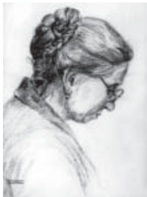
4. Anyám arcképe, 1928., ceruza, papír, 298 × 220