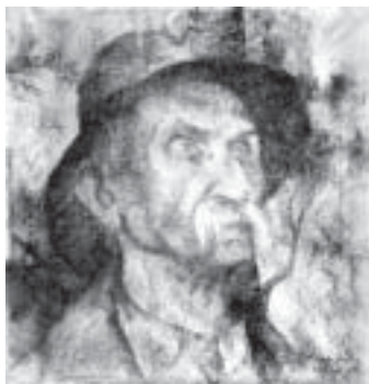
5. Kalapos parasztember, 1933., szén, papír, 230 x 194

ki, többnyire portrékat és tájképeket festett. Utóbbiaknál a vecsési ház, kert, utca- részletek végigkísérik pályafutását, s amerre járt vidéken, mindenhol megöröki-