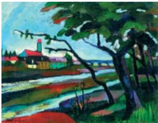
19. Árnyas Nagybányai folyópart (Nagybányai táj), 1932., olaj, vászon, 405 × 510, a Magyar Nemzeti Galéria tulajdona

a Magyar Nemzeti Galériában, Zebegényben pedig a Szőnyi-tanítványok kiállításán. Az összefoglaló művészeti kiadványok sajnálatosan vagy elfeledték munkásságát, vagy csak nevének említéséig jutottak el. Alkotásai megtalálhatók köz- és magángyűjteményekben, továbbá a család leszármazottainál. 13