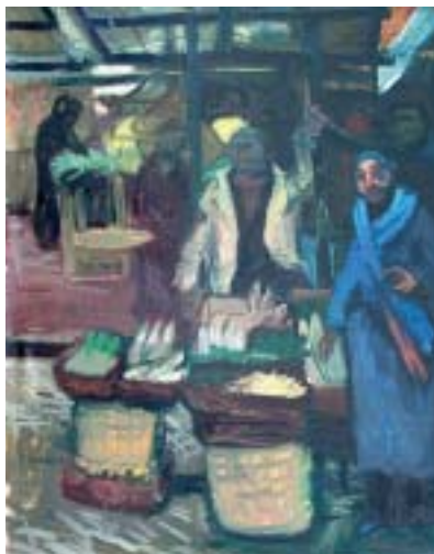
29. Piac (Halpiac) , 1938., olaj, vászon, 490 × 430