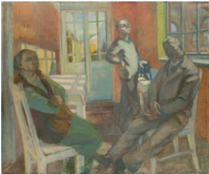
45. Otthon , 1939., olaj, vászon, 1205 × 1455 a Magyar Nemzeti Galéria tulajdona