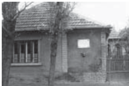
A művész szülőháza, Vecsés, Zöldfa utca 52. szám alatt az 1976-ban elhelyezett emléktáblával