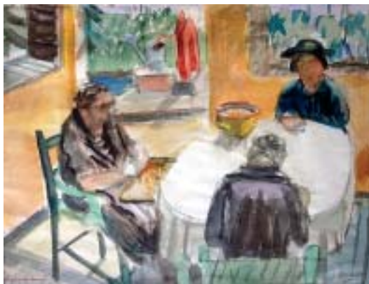
20. Beszélgetők a verandán, 1941., akvarell, papír, 223 × 290

Születésének századik évfordulóján megérett az idő ahhoz, hogy rövid, de ígéretes és kitűnő munkákat eredményező pályafutásáról ismét megemlékezzünk, a feledés homályából előhozzuk, és különösen a fiatalabb nemzedékek számára személyét megismertessük, műveit bemutassuk.