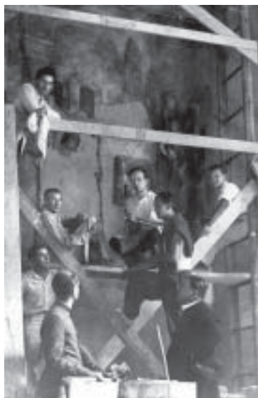
A művész és társai Göncön, a római katolikus plébániatemplom freskójának festésekor 1935-ben