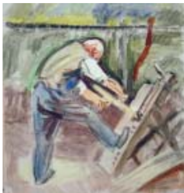
12. Édesapám munka közben (Asztalos) , 1939., akvarell, papír, 300 × 275

A világ zajától, az egyre vészjóslóbbá váló hírektől nem tudott elvonulni, nyugodt alkotói munkáját egyre többször szakította meg a katonai behívás, amelynek nem szívesen, de kötelességszerűen engedelmeskedett. 1938 nyarától részt vett a Felvidék déli részének visszafoglalásában, 1940 júniustól októberig ismét a hadsereg-