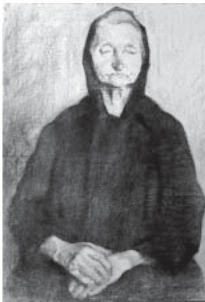
23. Idős nő , 1932., szén, papír, 600 × 417