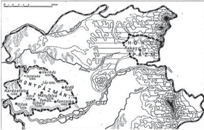
3. A Hontpázmány nemzetség birtokai.