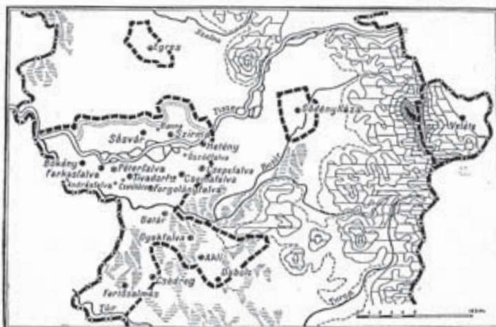
2. A kismenesi vidék falvai