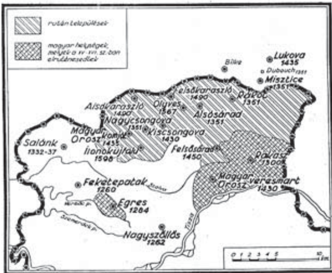
4. A nagyszőlősi hegyvidék a rutén faluk megtelepülése után

Átvétel Szabó István Ugocsa megye c. munkáiból