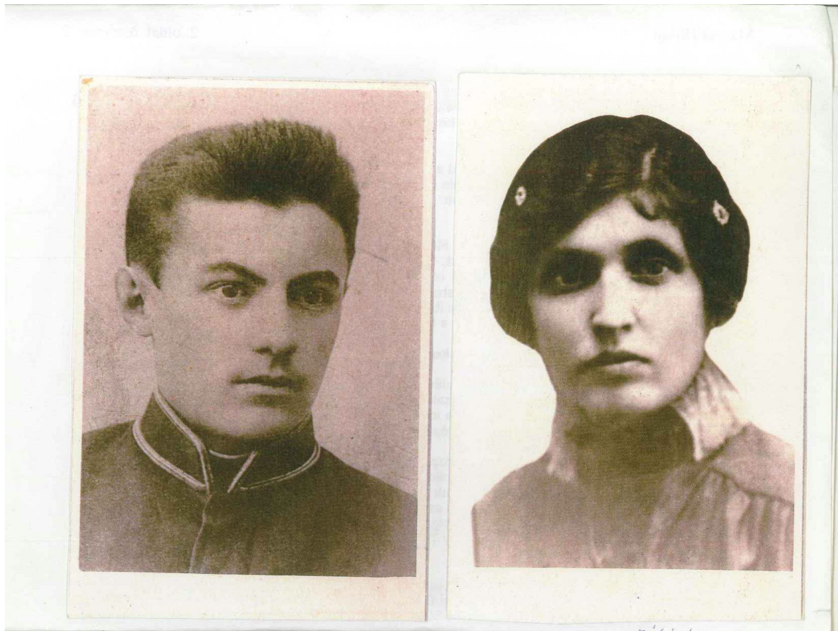
A szülők 1900 körül