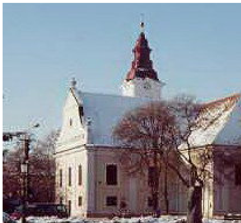
Az orosházi evangélikus templom