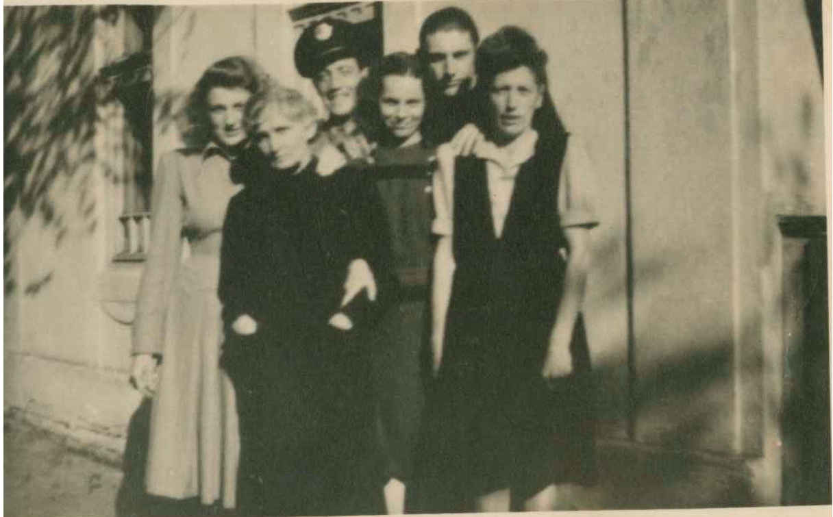
Az édesanya és a testvérek az 50-es években