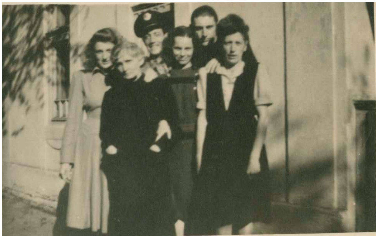
Az édesanya és a testvérek az 50-es években