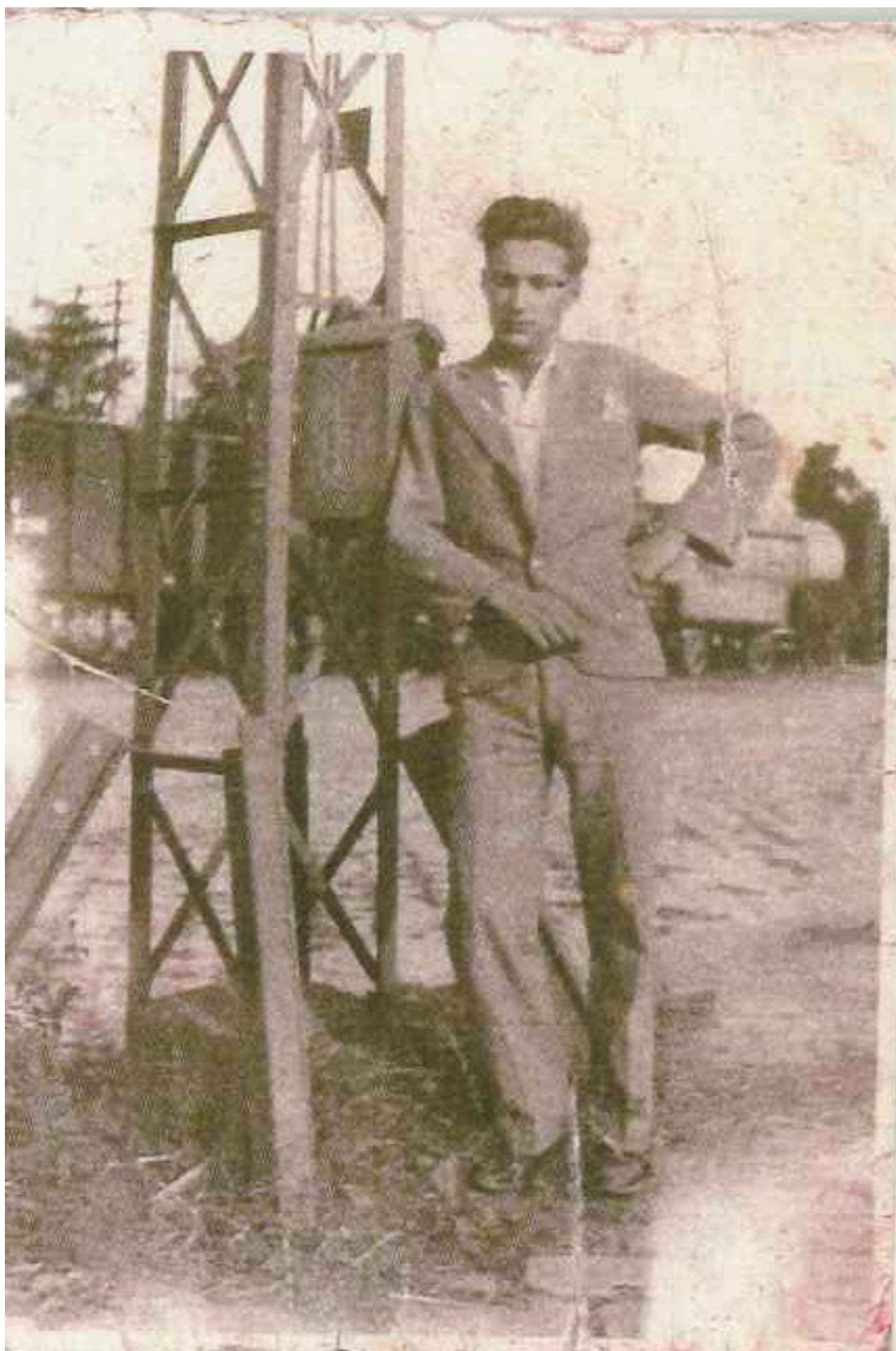
Károlyfalvi Sándor 1935 körül