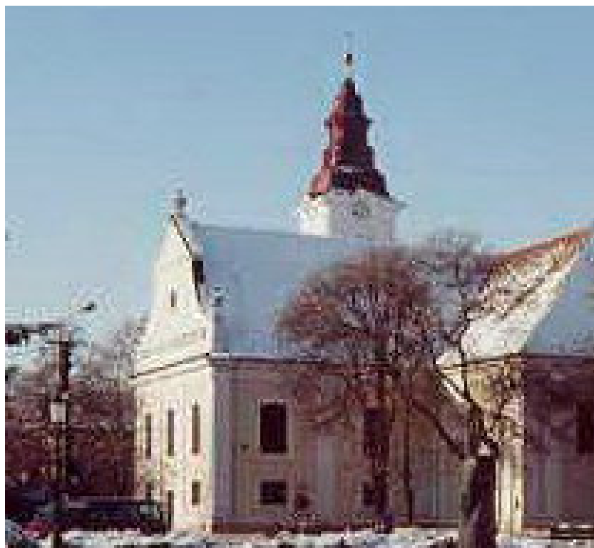
Az orosházi evangélikus templom