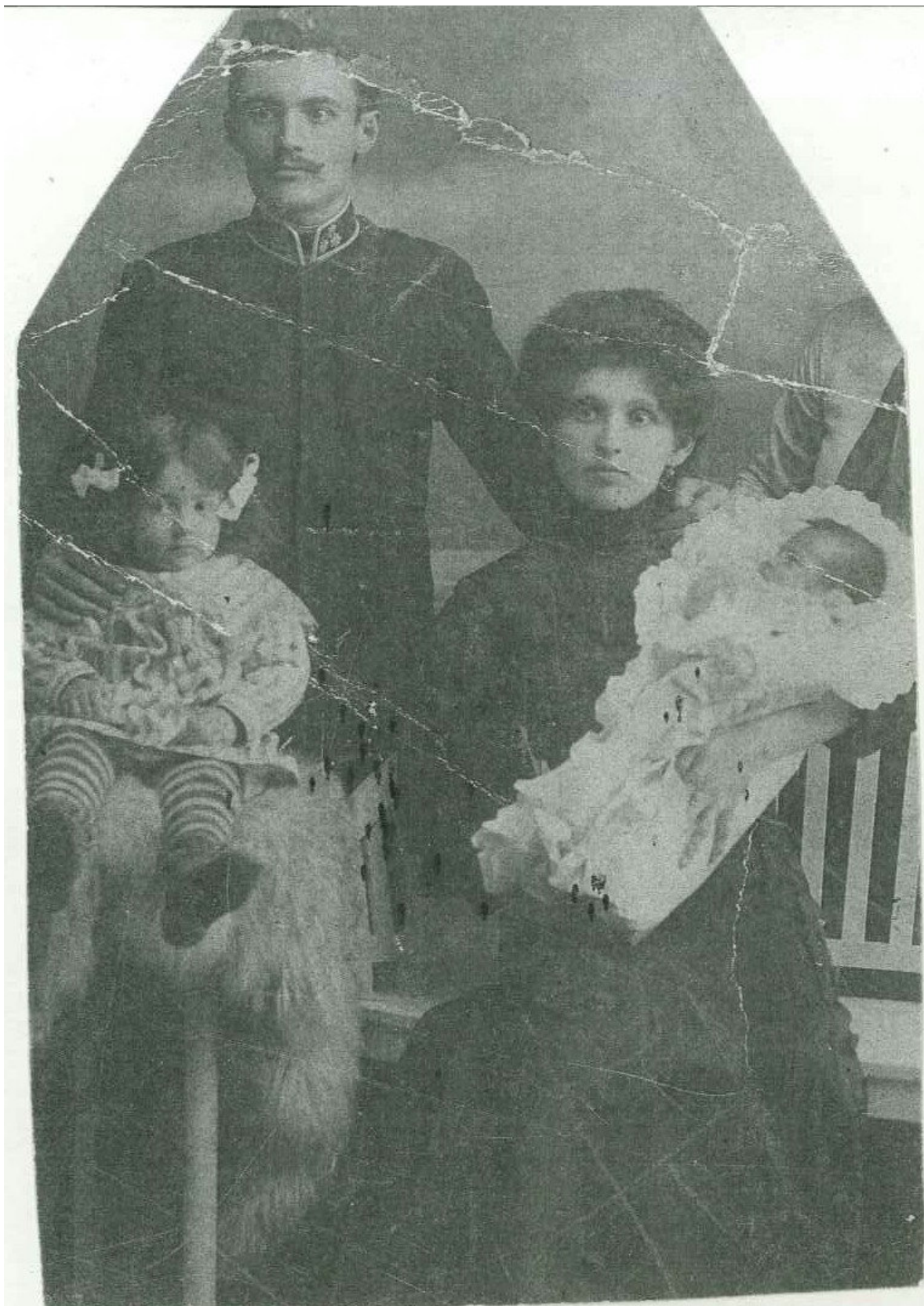
A szülők és gyerekek - 10-es évek