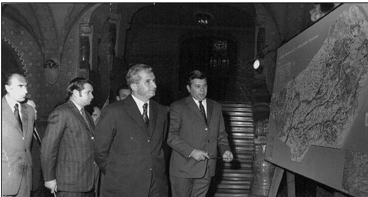
Nicolae Ceaușescu és a csíkszeredai küldöttség a javasolt megyetérkép előtt Bukarestben (1968)