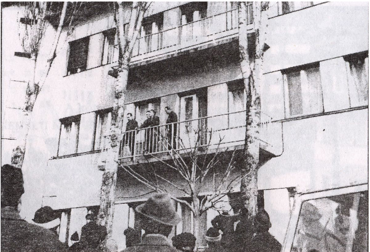
Beszédek a rajoni pártbizottság erkélyén. Archív felvétel