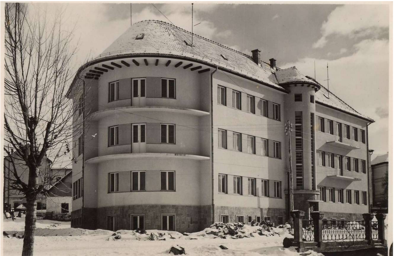
A rajoni pártszékház – a „kis magyar világban” MÁV-székháznak épült.