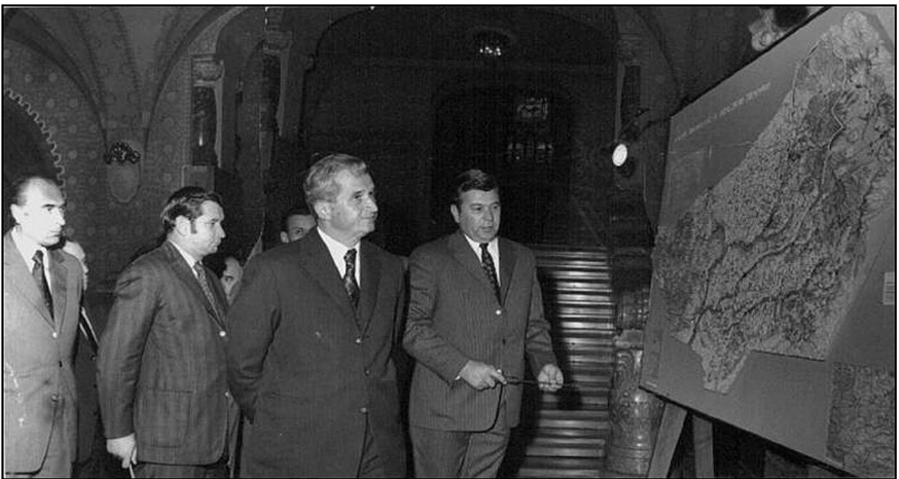
Nicolae Ceaușescu és a csíkszeredai küldöttség a javasolt megyetérkép előtt Bukarestben (1968)