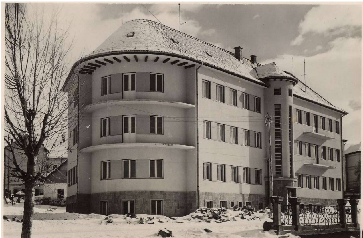
A rajoni pártszékház – a „kis magyar világban” MÁV-székháznak épült.