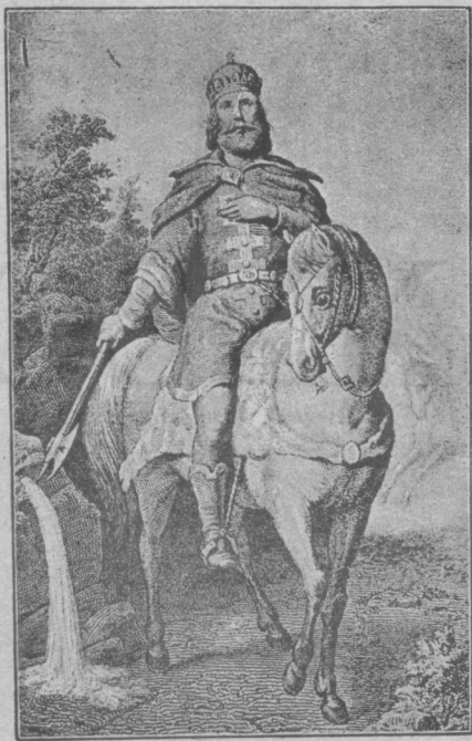
SZENT LÁSZLÓ KIRÁLY.