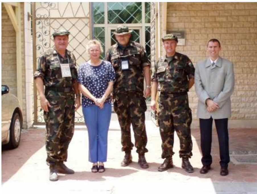
Udvariassági látogatás a kuvaiti nagykövetségen

De ugyanígy az élet fenntartásához szükséges létesítmények is kifogástalanul működnek. Az étkezde több száz fős. A választék egy jobb európai önkiszolgáló étteremhez hasonló. Az étkezéshez záró ételként süti, fagyi, gyümölcs jár, és a végén nem ül ott a pénztáros néni. A már említett katonai kereskedelmi áruházban majdnem minden megtalálható. Mi leginkább szét-nyitható tábori „karosszéket” és a jövőendő tábori élethez szükséges kiegészítő cikkeket vásárolunk. Kifejezetten olcsó áron. Késő délután érünk vissza. A második „váltás” is bemegy. Megint eltelt egy nap. Várjuk az újabb híreket. Reméljük, végre holnapután indulunk.