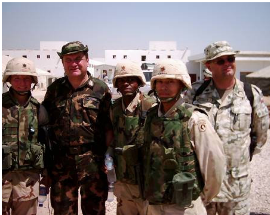
Egy teljes USA ellátó-szállító zászlóaljjal kerülünk megerősítésre. A parancsnok Anita Raines alezredes (balra)

Néhány területen csúszás van, de ez nem veszélyezteti a helyzetüket. Lemaradás tapasztalható a szerződéses feladatok teljesítése területén. Cunliffe százados a szerződéses munkákért felelős amerikai LOGCAP tiszttal megnyugtatta bennünket, hogy mindent megtesz az ellátás zavartalanlásának érdekében. Nem nyugszunk meg. A létkörülmények biztosítása elsőrendű feladatunk. A fő ellátó a Magyarországról is ismert Brown & Root lesz. Azzal a különbséggel, hogy még egy névvel kiegészült a kompánia, Kellogg, Brown and Root-nak hívják őket. Ha kint lennének a tőzsde piacon, bizony vennék néhány részvényt. Biztos nem vesztenék rajta.