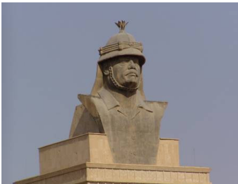
Mára az óriási Szaddam mellszobrokat is eltávolították