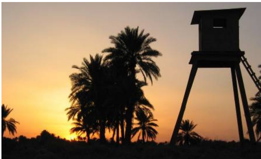
A babiloni tábor még mindig a „béke szigete”

lésére. Ha nem, az esetben az egész ellátási rendszerünk kerülne veszélybe. Nem beszélve arról az erkölcsi kárról, amelyet ez a kedvenc „kiválasztott” cég intézkedése okozna sokak számára. A zászlóaljunk szervezi a hétfői szállításokat. Két helyre is, Najaf-ba, de Diwaniya-ba is szállítania kell. A najafi körlet fontos, az amerikaiak napok óta várják erődítési anyagok szállítását az új táborukhoz. Késő este jön a hír: ezúttal személyesen a törzsfőnök törölte a szállítást. Biztonsági szempontból nem tisztázott a helyzet Najaf körzetében. Ez van.