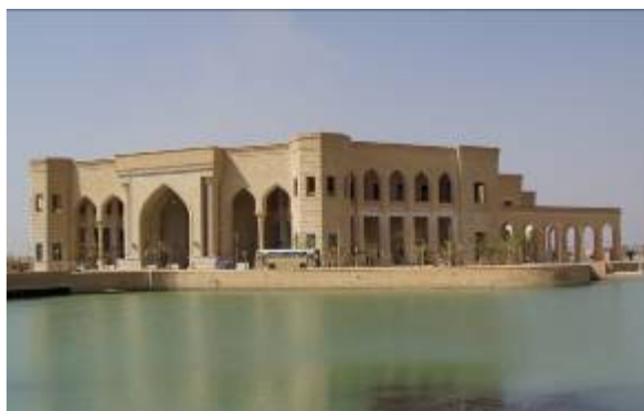
Camp Victory — a CJTF7 főhadiszállása