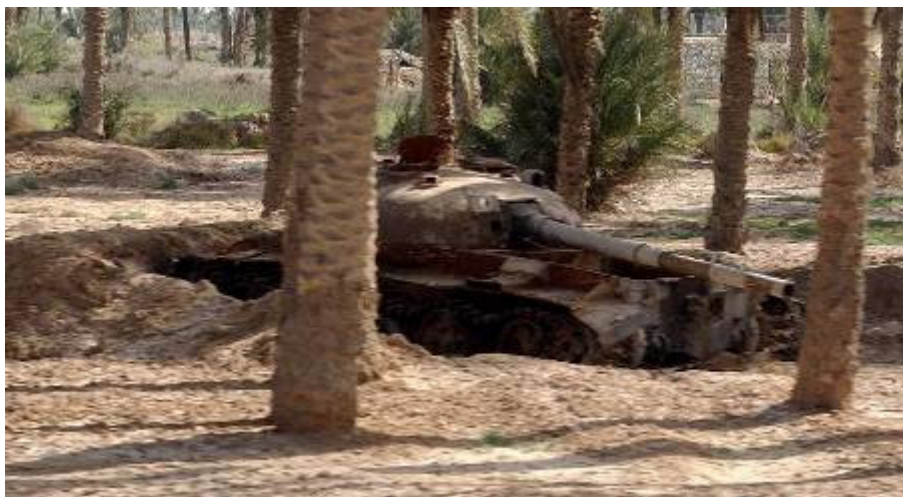
Az út mellett rengeteg a kiégett harci jármű