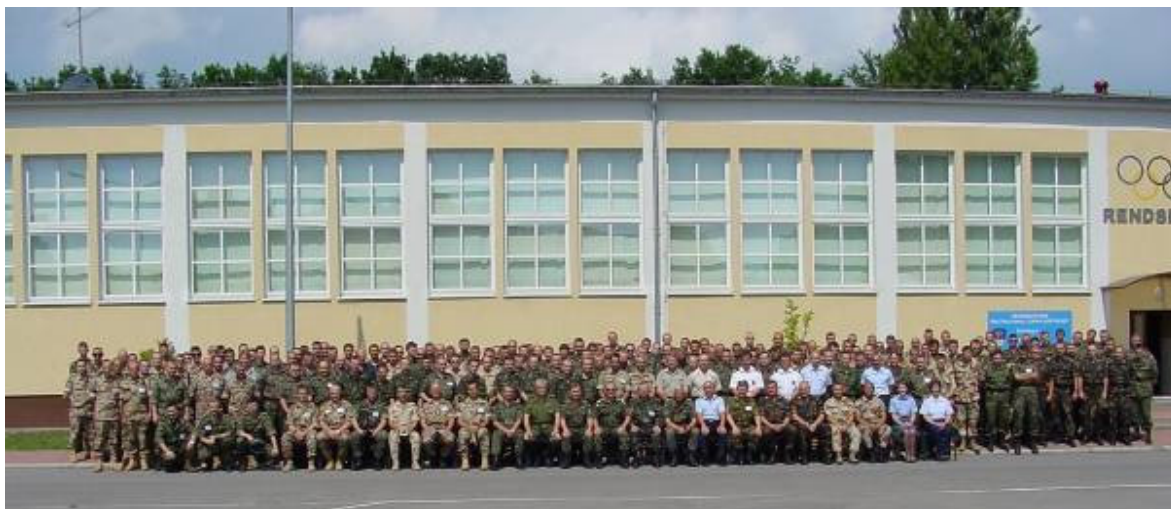
Megalakultak a törzs különféle szervei