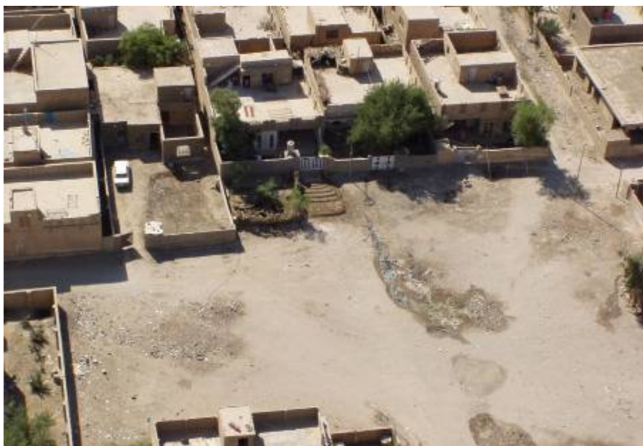
Szennyvíz patakok folynak a lakott területek utcáin

előadást képek kísérik. Mint valamikor a középkor Európájában, szennyvíz patakok folynak a lakott területek utcáin. Nem tisztítják az ivóvizet sem rendesen. Térdig szemétben járnak az emberek. Ez is az egyik eredménye a harminc éves Szaddam diktatúrának. Civil-katonai területen dolgozó kollégáink igyekeznek segíteni ezen az áldatlan állapoton. Különösen említésre méltó az a lengyel szakértői csoport, amely a kitűnően felkészült holland ezredes által vezetett CIMIC törzs tervei alapján igyekezik a polgári lakosság legégetőbb gondjain segíteni. Fontos missziót tölt be ezen a területen a Fülöp-szigeti kontingens is. Hozzá teszem, nehéz dolog az elmaradottságot felszámolni.