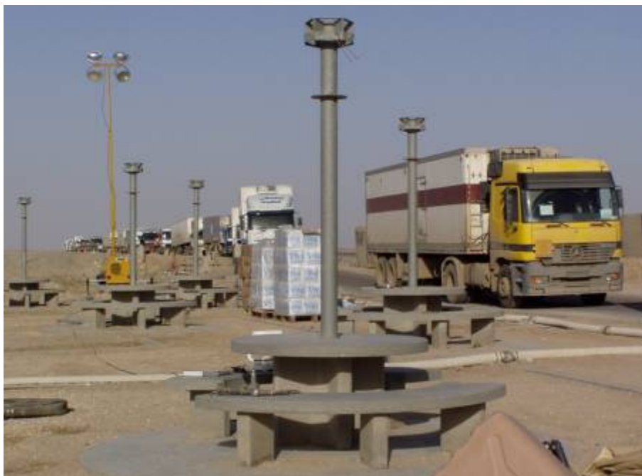
Nagykapacitású üzemanyag feltöltő pont. Egyszerre harminc csatlakozással