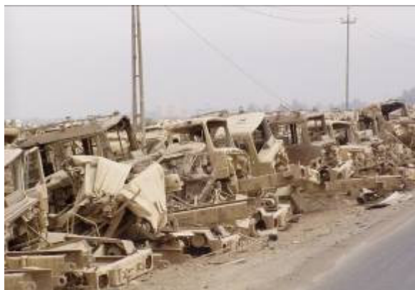
Látjuk a sok zsákmányolt technikát