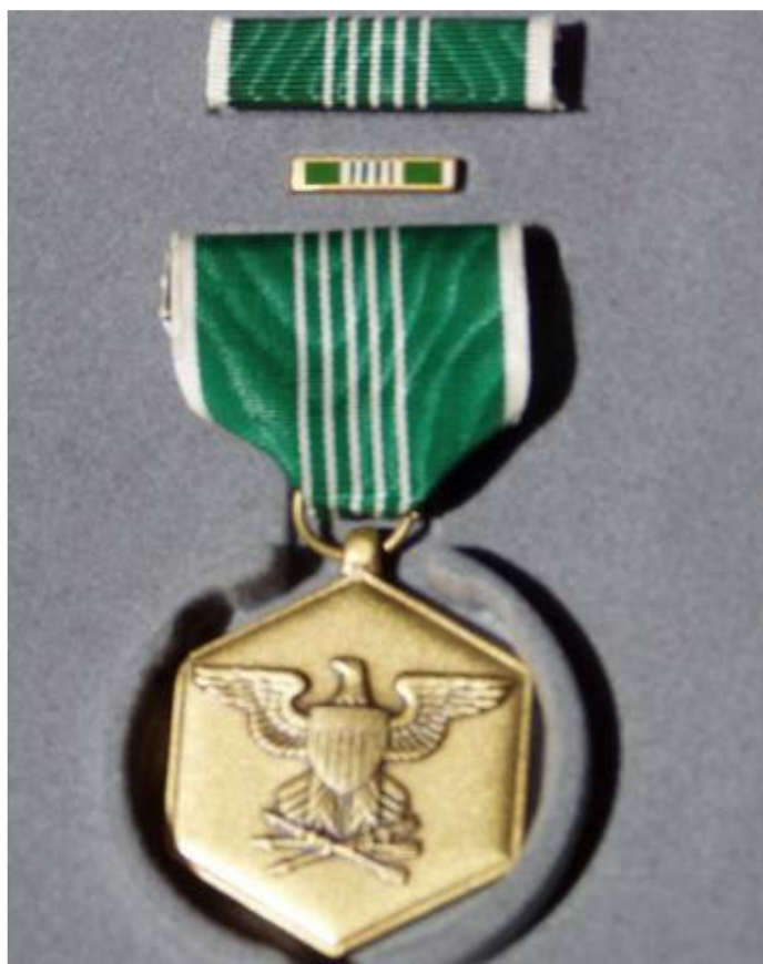
Az Army Commendation Medal háborús érem