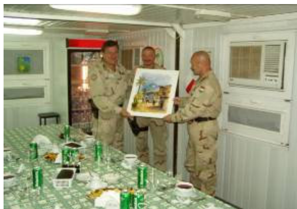
Emlékül egy festményt adunk át neki