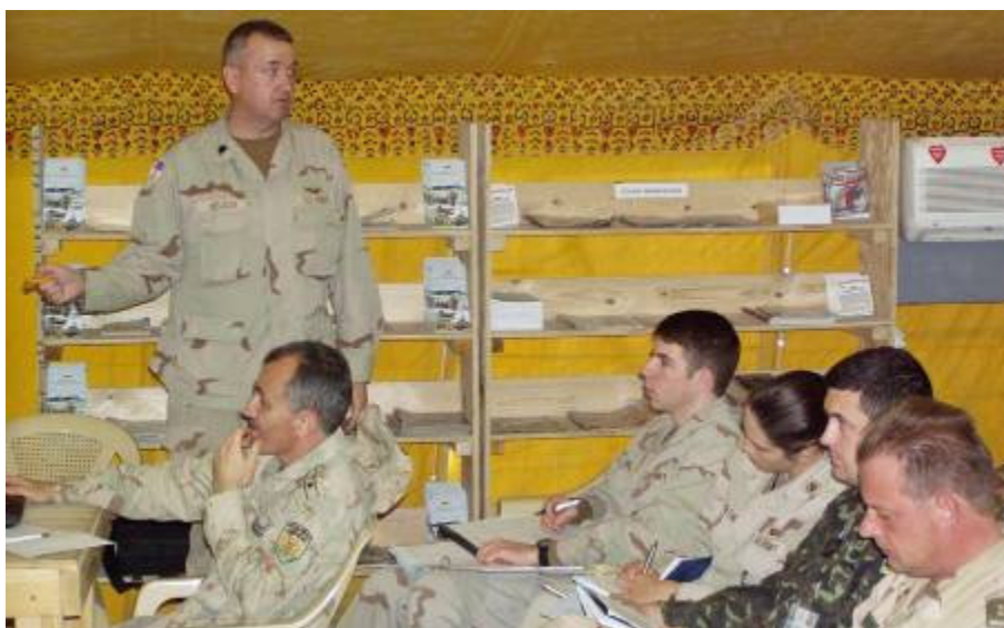
A nap legizgalmasabb kérdése, a január-februárban végrehajtásra kerülő váltás megbeszélése

A nap legizgalmasabb kérdése, a január–februári váltás megbeszélése. Mint az a vasárnapi CJTF7 logisztikusaival történt tárgyalás után egyre világosabb, nagy valószínűséggel Kuvaitból fog a váltás megtörténni. Ez a valószínűség viszont egy sor talányt hordoz magában. A legnagyobb kihívás: hogyan fogunk lemenni Kuvaitba? Emlékszünk még, miként is jöttünk fel onnan. Napokig történő várakozás, kétnapos utazás. A különbség, hogy most tél lesz. Még az sem biztos, hogy buszokat fogunk kapni, mint idefelé. Nem beszélve arról, hogy az elmúlt hónapokban a biztonság is romlott. Egy RPG-vel indított támadás, de egy géppuskával elkövetett busz elleni akció is nagy áldozatokkal járhat. Ugyanakkor nyitott teherautón szállítani az embereket — kényszerűség a platón utazóknak. Nem is beszélve, hogy egy felmérés szerint nincsenek is a nemzetek teherszállító járművei személyszállításra felkészítve. Ez viszont helyileg megoldható. Tény az is: ez a típusú szállítás valamivel biztonságosabb. A repülővel Kuvaitba történő szállítás komolyan fel sem vetődik. Amennyi C-130-as a hadszíntéren van, kell az amerikaiaknak is. Ha Kuvaitba megyünk, szükséges lesz Talilban (Cedar bázis) átmenő tábor is az érdekünkben üzemeltetni. Január–februárban még túl rövidek a nappalok, hogy világos időben megtegyék a konvojok a közel hétszáz kilométeres utat Navistarig, az iraki–kuvaiti határig, mert sötétben a mi konvojaink nem közlekedhetnek. Egy szempontból valószínűleg jobb Kuvait — biztonságos.