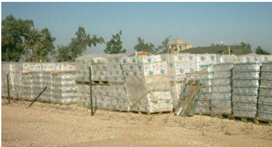
Ivóvíz, MRE, üzemanyag. Kezdetből ez volt az elvem

Más jel is arra utal, hogy rosszabbra készülünk. A bagdadi főnökeim nyomást gyakorolnak rám, halmozzak fel készleteket, arra az esetre, ha „napokig nem tudunk szállítani”. Erre eddig sem kellett különösen ösztönözni. Ivóvíz, MRE, üzemanyag. Kezdetből ez volt az elvem. Ha ezek az alapvető anyagok megvannak, hosszú időre biztosított a túlélésünk.