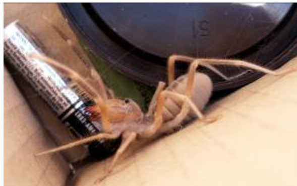
Mindenfajta hívatlan vendégek

nézelődöm a légkondis SUV-ban, kellemes az utazás. A táj éppen olyan elhanyagolt képet mutat, mint bármerre járva tapasztaljuk. Két kocsival utazunk. Mögöttünk egy „Humvee” követ. Amerikai logisztikus kollégáink fedeznek minket. Este szokás szerint e-mailezek. Szinte ez az egyetlen szál a külső világgal. Így legalább azt a kevés szabad időt is agyonütöm. Nem egy nagy élvezet korán a sátorba visszatérni, ahol bizony mindenfajta hívatlan vendég előfordul.