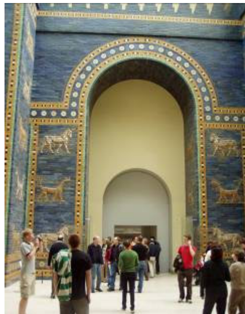
...és az eredeti Istar kapu Berlinben