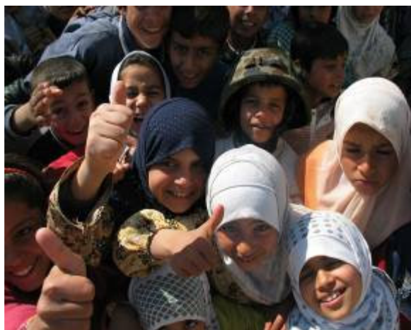
Gyerekek ugrálnak körbe bennünket