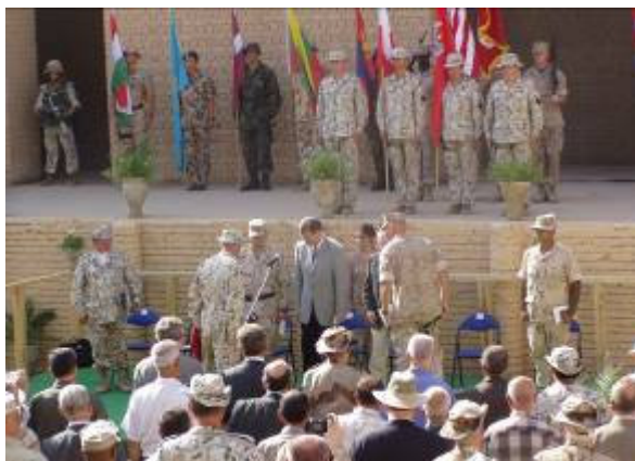
Ma van a felelősségi körzetünk átadás-átvételének az ünnepélyes aktusa