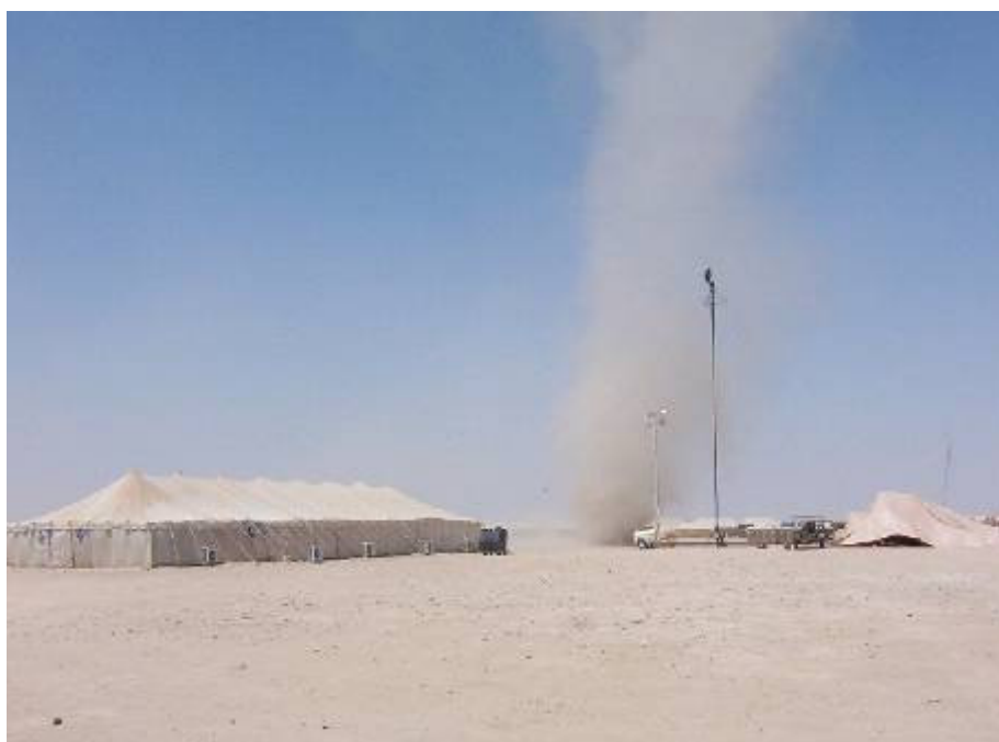
A szabad ég alatt is közel 50 Celsius fok a hőmérséklet

Hirtelen leáll a sátor légkondicionálása. Pillanatok alatt nagyobb a forróság, mint kint, bár a szabad ég alatt is közel 50 Celsius fok a hőmérséklet. Javítják a rendszert. Elindul, majd újból leáll a kondi. Iszonyatos a hőség! Órákig fekszem az ágyon, nem mozdulok, így is szakad rólam a víz. Alattam a hálózsák percek alatt csatakos. Délután végre újból elindul a légkondi, de még órákig tart, mire elviselhetővé válik a hőség. Este a számítógépen a „Valami Amerika” című filmet nézzük. Hát, ez nem Amerika!