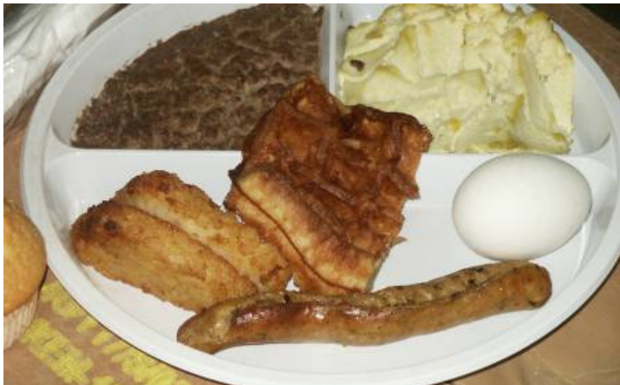
A fiúk közül mindig akad egy-kettő, aki elmegy az ételért

Délután SMS jött a szomszéd táborból a lengyelektől. Újabb 24 órát csúszik az indulásunk. A legközelebbi dátum augusztus 14. hajnali négy óra. Hányadik időpont már ez? Este valamilyen amerikai tengeralattjárós filmet nézünk. Időtöltésnek jó. Norvég szomszédaink a sátrunkban valami szexfilmet nézhetnek, mert közben nagyokat vihognak. Nem tudok elaludni. Ez a tétlen összezártság kezd az idegeinkre menni.