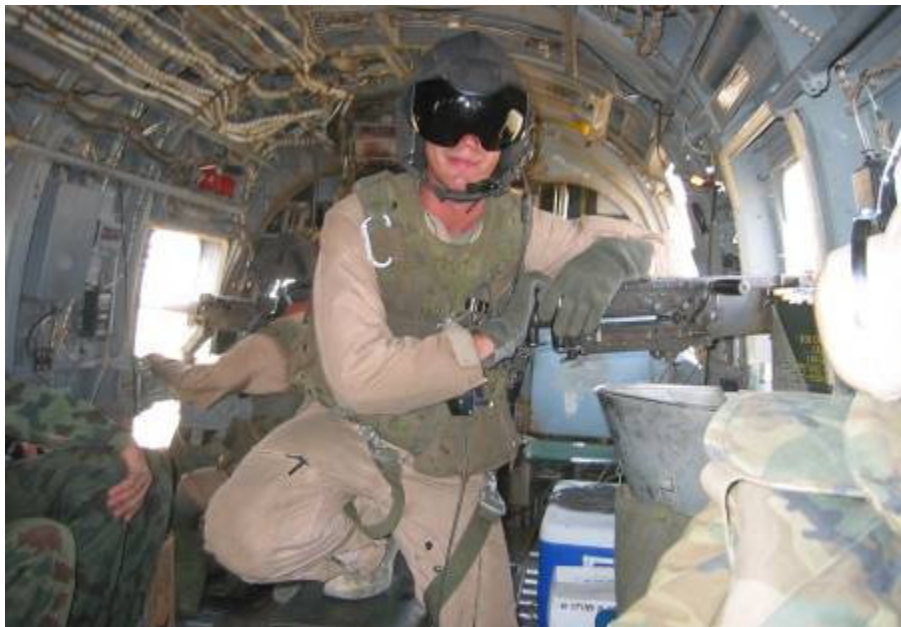
Nagyot csattan a závár

vezetett Humvee pár perc alatt visz be a táborba. Itt, ha lehet, még szigorúbbak a biztonsági rendszabályok, mint Kuvaitban. A táboron kívül mindenki golyóálló mellényben és sisakban jár. A katonáknál gépkarabély, a tisztek oldalán pisztoly. Ez nem gyakorlat. Hadműveleti területen vagyunk. A táborban békésebb a helyzet. Mindemellett a pihenőben levő katonákon is látni a hátukon keresztbevetett karabélyt, ahogy strandpapucsban, sortban, trikóban közlekednek.