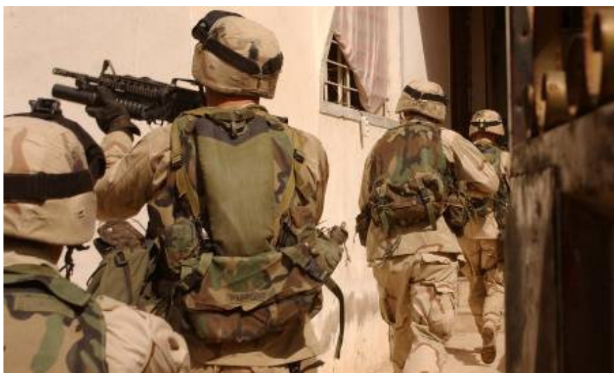
Karbalában nagy az ellenállás, minden nap, minden éjjel áll a harc

És nincs vége. Karbalában nagy az ellenállás minden nap, minden éjjel áll a harc. Sadr lázadói nyilván nem tudnák azt az ellenállást folytatni, ha nem kapnának külföldről támogatást. Szíria, Irán, Libanon. Naponta elhangzik a feltételezett külföldi támogatók felsorolása. A világ napi híreiben mégsem hallunk sok mindent arról, hogy Amerika tenne is valamit ez ellen. Talán a színpalak mögött. Reméljük. Mert ezen az úton haladva még sokáig elhúzódhat ez az egész. Az Al-Kaida, Bin Laden itteni helyettese, Zarkavi is gyakran hallat magáról. Egyre inkább az utakon közlekedő konvojokat is megtámadják. És ez az egész nem teszi irántunk barátságossá a szenvedéseket elviselő lakosságot! Miben javult a helyzetük az elmúlt évben? Hogyan élhetnek visszkapott szabadságukkal, ha állandó félelemben kell lenniük? És itt akarnak hatalomátadást? Kinek? Ki fog állni a kijelölt vezetők mögött? Mennyire lesz az egész szilárd, hiszen láttuk Karbalában, hogyan futott az első puska lövésre szét a mi általunk felszerelt, kiképzett iraki zászlóalj. Mi lesz veled Irak?