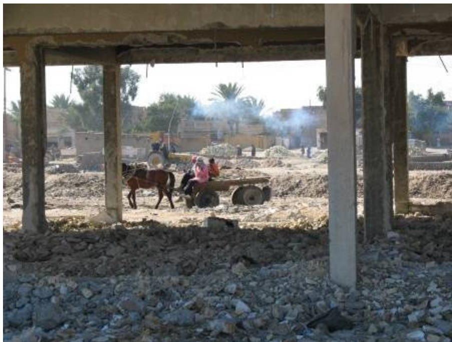
Helybeliek most is rakodják a „bontott téglát”

amely feltehetőleg ugyanezen úriemberek csapata által vélhetően előző éjjel került kitermelésre a most már félig elbontott épületből. „Szaddam, Ali baba” vigyorognak, nem hagyva kétséget a felől, hogy saját, kicsiben hasonlóan végzett tevékenységüket kívánják ezzel a meglepő, hozzánk intézett barátságos kijelentéssel leplezni.