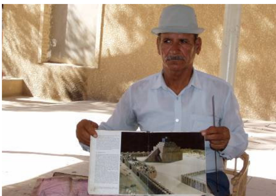
Egy iraki régész tart előadást

Délután az amerikaiak értekezletére kapunk meghívást. Az itteni szektorban működő tengerészgyalogosok felváltásáról, a nemzetközi hadosztály szolgálatba lépéséről van szó. A kezdethez képest kissé felgyorsultak az események. Szeptember 3-án kell a teljes felelősséget átvennünk. Ez valamivel több, mint két hét. Kemény napok várnak ránk. Az ünnepélyes átadás-átvételre magas rangú vezetőket várnak. Lesz dolgunk a következő két hétre!