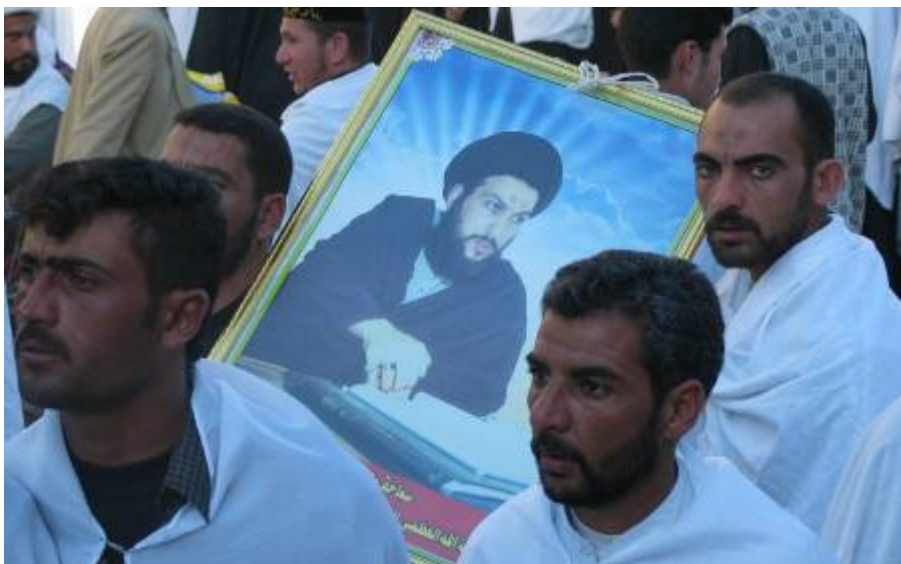
Itt van Mukhtada As Sadr, aki a militáns, agresszív szárny megtestesítője