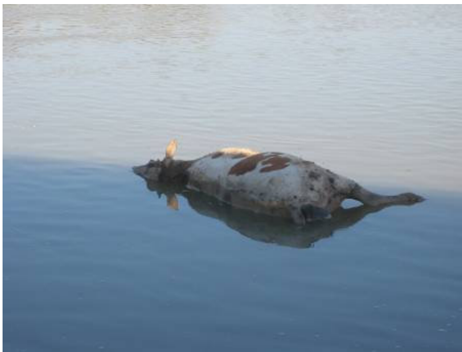
Ha nem úszik éppen le a folyón egy döglött tehén

Mától a HM központon keresztül lehet bennünket hívni, egy HM számot kell tárcsázni, és a végén én veszem fel a telefont.