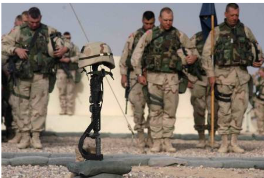
A hadszíntéren jelentősek a veszteségeink

A szállítózászlóaljnak holnap mennie kell. A najafi szállítás csúszik, Al Kutba szállítanak. Megkezdődik az előkészítés. Magam járok el annak érdekében, hogy az útvonalról légi felderítést kapjanak.