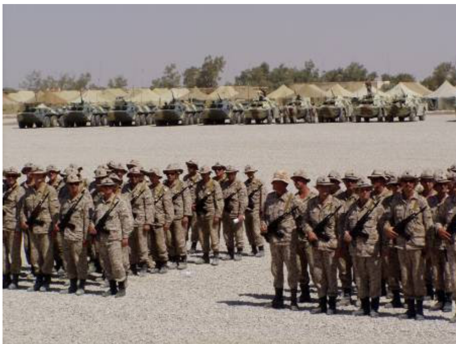
Ma van az Ukrán Függetlenség napja

Reggel tájékoztat a dandár logisztikai főnöke. Bejárom a biztosítási területet. Minden a helyén van. Néhány napja vannak még csak itt, de készen állnak a terület átvételére. Tizenegy órakor hivatalosak vagyunk jövetelünk másik rendezvényére. Ma van az Ukrán Függetlenség Napja. Tizenkét évvel ezelőtt kiáltották ki a független ukrán államot. Az ünnepség katonás, rövid. Meghívást kaptak a terület vezetői is. A megemlékezés díszmenettel ér véget. Utána rögtön fogadás. Természetesen szeszesital nélkül. Indulunk vissza. Légh kondicionálás ide, légh kondicionálás oda, meleg van a kocsiban. Szerencsére ukrán kollégáim betettek néhány ásványvizes flakát. Visszaérkezésem után a régen halogatott mosás vár rám. Késő estig mosok. Hiába, ilyen a „legényélet”!