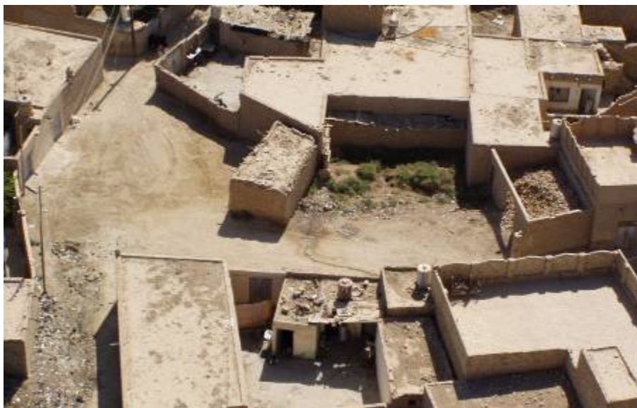
Felülről sem néz ki ez az ország jobban, mint az utakról szemlélve