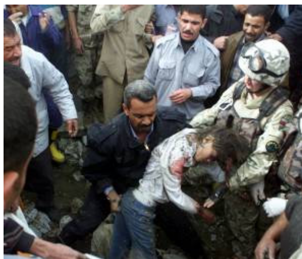
A civilek között sok a halott

Bemegyek a szállítózászlóalj parancsnok vezetési pontjára. A központi ügyelettel van videó kapcsolatban, nyugodtan jelent. Mindenki nyugodt körülötte. Később meglátogatjuk a sérülteket. Van az orvosoknak mit tenniük. Összesen 37 főt részesítenek ellátásban. 2 súlyos, 8 könnyebben sérült, 27 ellátás után végezheti a munkáját. Büszke vagyok az enyéimre, derekasan viselkedtek. A körletek romokban. Lesz mit takarítani. Délután négy után az al-Hillah-i rendőrséget is támadás éri. Rohadt egy nap ez a mai!