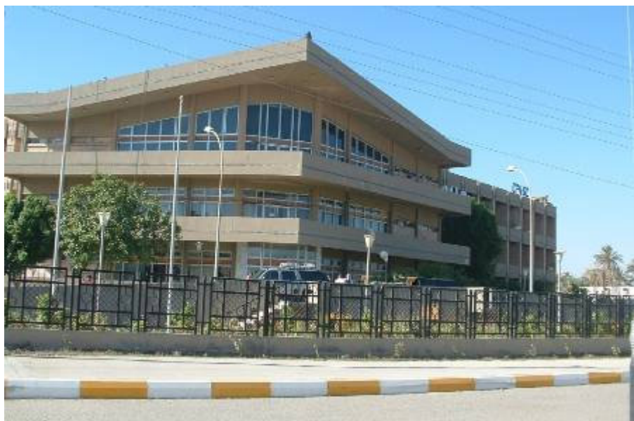
A régió polgári irányító központot, a CPA-t leszerelt gurdák védik

(Coalition Provisional Authority) leszerelt nepáli gurdák védik, akik civil biztonsági őrként (természetesen géppisztollyal a nyakukban) mint a „Global Security” alkalmazottai védik az objektumot. Másfelől — és ez az amerikai hivatalos magyarázat — a civilek a mi érdekünkben mozognak Kuvaitból idáig, és nem csak az érdekünk, de a felelősségünk is, hogy vigyázzunk rájuk. Mindenesetre a cégüknek ez az egész nem fog sokba kerülni. Vacsoránál két fiatal bolgár munkatársammal állunk a vacsorasorban. Bulgáriáról beszélgetünk. Talán egyszer tényleg jó lenne visszatérni az egykor oly kedvelt, akkor egyedül elérhető meleg tenger partjára?