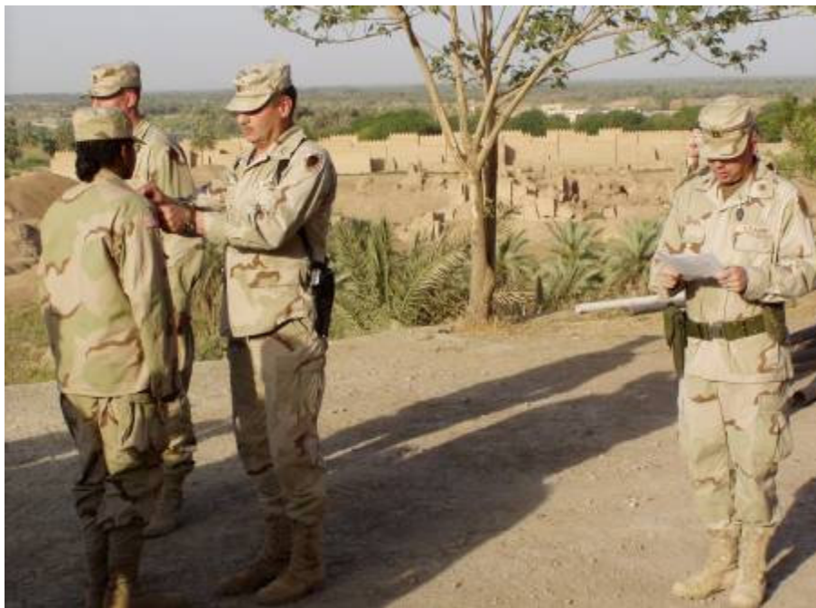
Downen ezredes két amerikai katonát előléptet

Este előléptetésre megyünk, Downen ezredes, mint a tábor amerikai rangidőse két amerikai katonát előléptet. Nem először vagyok hasonló ceremónián, de mindig élvezem az előléptettek számára nagy eseményt: új rendfokozatot kapni a babiloni romoknál. Az előléptetés után kellemes meglepetés: az amerikai logisztikai összekötőink hívnak meg „házavatóra”! Pár napja foglalták el amerikai kollégáink kényelmes új körletüket, egy fémvázaz, előre gyártott elemekből épített irodát. Összeköttetéseknek köszönve, iraki partnereik hozták a fogadáshoz az ételeket: sült bárány, grill csirke, hal és finomabbnál finomabb köretek. Jól bevacsorázunk. Hiába, Irakban is lehet szép az élet.