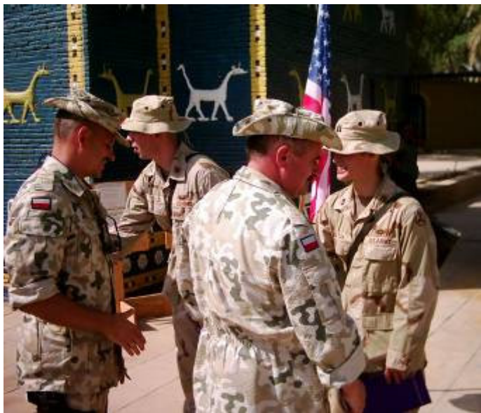
Az ünnepélyes aktusnak hol is találhatnánk méltóbb helyet, mint az Istar kapunál...

Este a parancsnok hív meg néhányunkat az új Casino megnyitójára. Finom lengyel ételeket kínálnak. Ha előbb kapom az értesítést, nem megyek el vacsorázni. A közös vacsora után még egy rendezvény, az előléptetett századosok szerveznek party-t! A „puncsban”, amit iszunk, nem hiszem, hogy egy csöpp alkohol is van, mégis jól érezzük magunkat. Emelkedett a hangulat. Késő estig ontjuk a történeteket. Valaki felveti, két évente jöjjünk össze, mindig máshol. Ha megéljük.