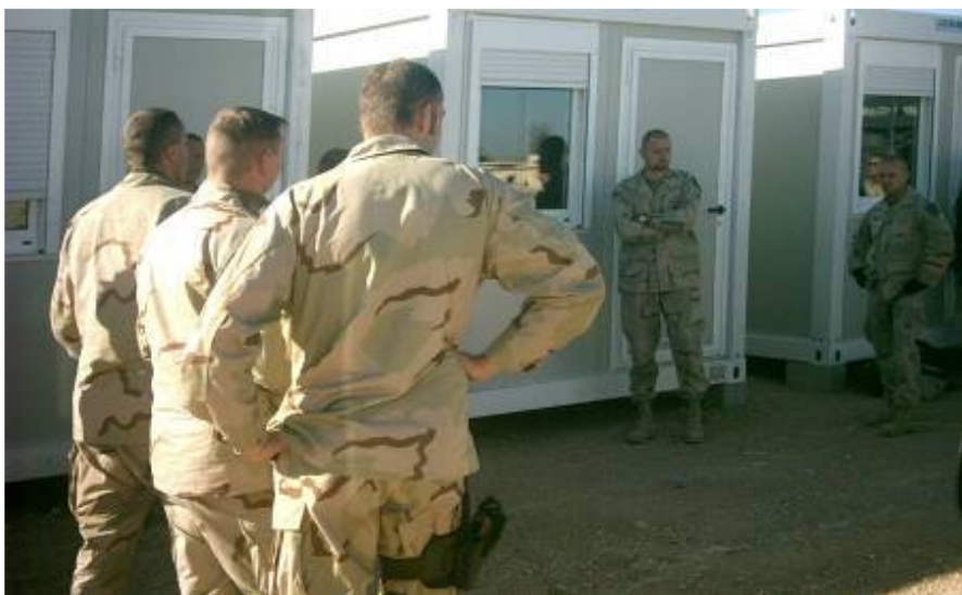
A „Pisztoly Factory” táborból a zászlóalj végre átköltözött

Ma bolond napom van. Megint olyan dolgokkal kezdenek szekálni, amihez édeskevés közöm van. Még a parancsnoknak sem tiszta, hogyan működnek az eltérő logisztikai szervezetek a hadosztályon belül. Kint járok Al-Hillah-ban is a logisztikai táborban. A lengyel parancsnok-helyettes dandártábornok visz ki magával. Biztonsági okokból más vezet, majdnem össze is törtük magunkat. A „Pisztoly Factory” táborból a zászlóalj végre átköltözött a bázisra. Sok problémával küzdenek, és senki sem érti meg, ezért a hibás ellátási szervezet is felelős.