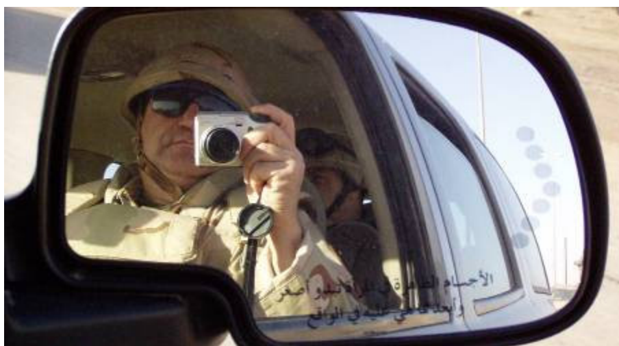
Mindenesetre én az anyósületről fényképezgetek

Az ukrán táborba érve kellemes benyomás ér bennünket. Nagy a rend. Nekem ez nem meglepetés. Biztos voltam benne, hogy ukrán szomszédaink amire képesek a legtöbbet adják. A dandárparancsnok tájékoztat bennünket. Mindez orosz nyelven történik. Jó néven veszik, hogy ha nem is az anyanyelvükön, de egy általuk jól ismert nyelven váltunk szót.