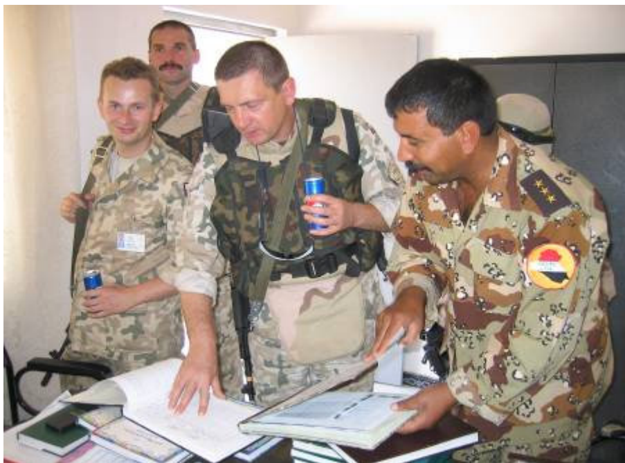
Fontosnak tartom, hogy rendben nyilvántartsák