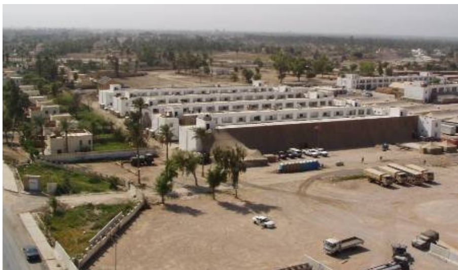
Irány a fő helyszín, a magyar zászlóalj körlete — Al-Hillah