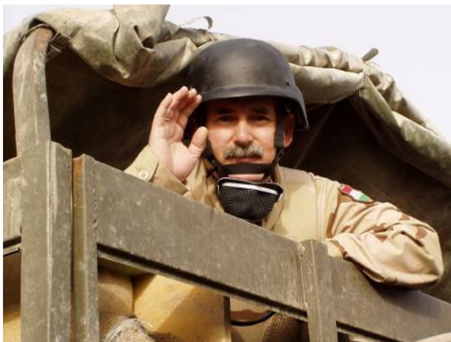
Tóni, ötven nap múlva visszavárlak!

Délfelé azért hazaérkezek, kitakarítok. Délután újból visszamegyek az irodámba, ahol egy újabb rakás üzenet vár. Hiába, hajtani kell a mókuskereket! Este a spanyol kollégáktól búcsúzunk el. A „lengyel konyhán” a törzsfőnök ad vacsorát. Adios Cavalleros!