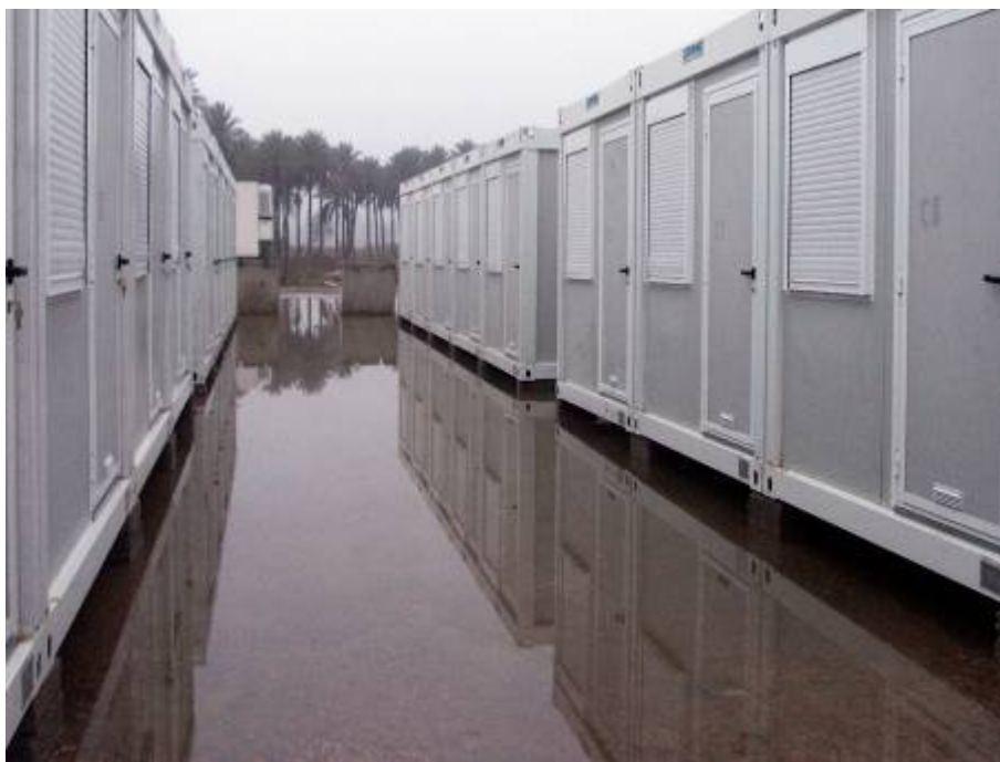
Közben az eső is megjött

Közben az eső is megjött, így dagasztjuk a sarat. Nem valami irigylésre méltó errefelé a klíma. Pedig a valamikori Paradicsom közelében vagyunk. Lehet, hogy egykor a történelem elején valóban „paradicsomi” állapotok voltak errefelé, de most más arcát mutatja a vidék. Biztos nem errefelé fogom tervezni a következő években a szabadságomat.