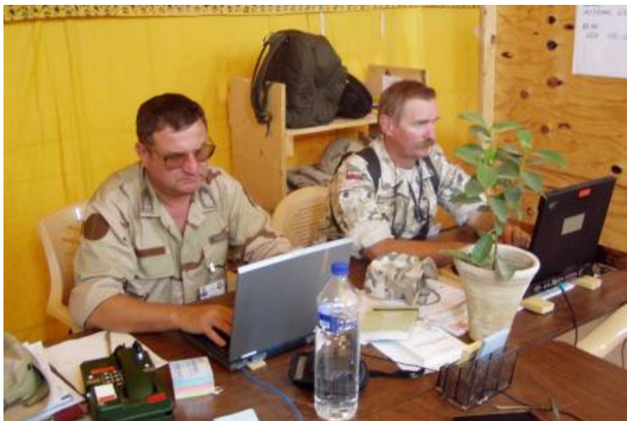
Az egész napom munkával telik