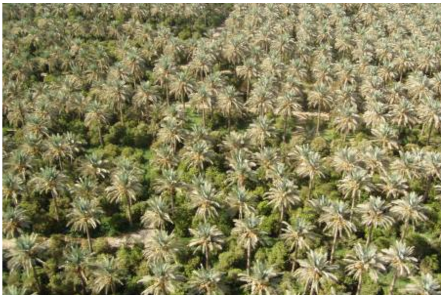
Felülről bámulom a pálmaligeteket

Délelőtt Bieniek tábornokkal Al Kutba repülünk az ukrán parancsnokváltásra. A helikopterekkel manőverezve, végig földközelsben repülünk. Nem egy nagy élvezet. Ráadásul a Daedalonjaimat is elfelejtettem bevenni. Az ünnepség szép, katonás. Metz tábornok az új főparancsnokhelyettes is itt van. Beszéd, díszmenet. Elköszönök, megöleljük egymást Bezlusczenko tábornokkal. Fél éve is elmúlt, hogy először találkoztunk. Bemutakozom az új parancsnoknak, Osztrovskij vezérőrnagynak. Advonin ezredes a logisztikusok új főnöke, holnap ő is eljön a konferenciára. Visszafelé jobban bírom az utat. Két nyugtató is van bennem. Felülről bámulom a pálmaligeteket.