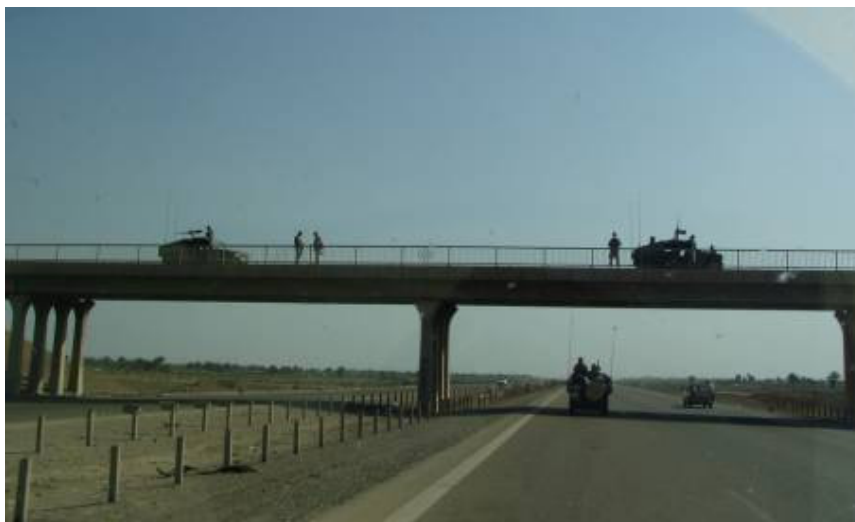
Utunkat időnként felülről is amerikai MP-ek vigyázzák