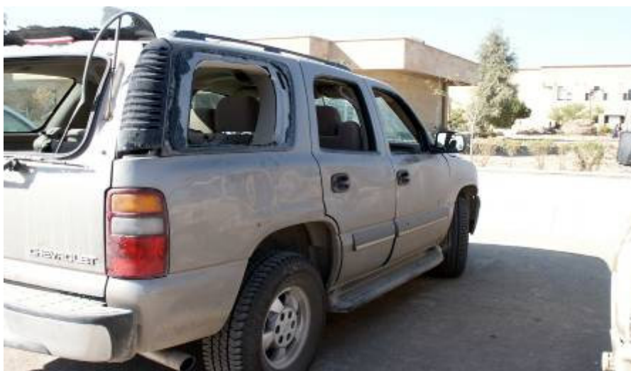
Rossz ránézni az autóra

Bármennyire is szerencsésen alakult, mind a két eset rossz jel.