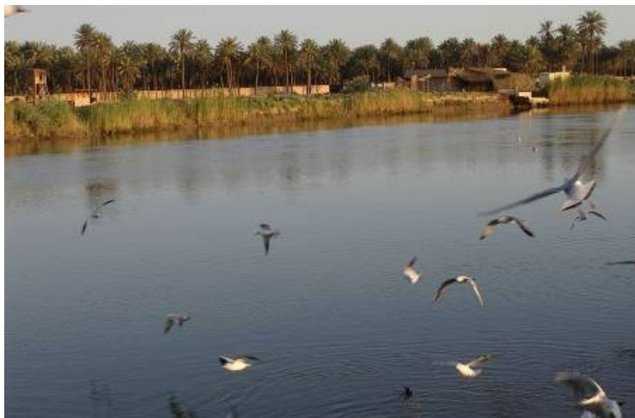
Jó itt kint ülni, a folyó a sok zölddel szemben a túloldalon kellemesen hat

Este a parancsnokkal futok össze, ma már másodszor. A keresztnevemen szólít, megköszöni a reggeli támogatást. Jól esnek a szavai.