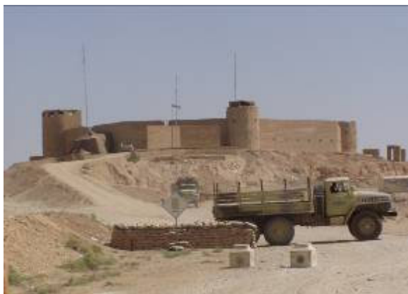
A határőr állomás egy erőd, tornyokkal, lörésekkel

Elindulunk a határ mentén. Egymás után nézzük meg az elhagyott erődöket. Minél előbb iraki határrendőrökkel szeretnénk megerősíteni az objektumokat, mert a határ így nyitott. Az jár át rajta, aki akar. Sobora tábornok személyesen ellenőriz néhány kocsit. Fegyvereket keresünk, de nem találunk. Az egyik erődhöz behajtva a felvezető BTR hirtelen fékez. Kiabálást hallunk a toronyból: aknamező! Figyelmetlenségünkől futottunk a mezőre, szerencsére nem történt baj. A saját nyomunkon hagyjuk el a veszélyes területet. Végigjárva az erődöket, sok munka van hátra, hogy mindent rendbe hozzunk, de mindenekelőtt a környéket kell aknamentesíteni. Visszaindulunk. Kísérteties a táj. Mintha a holdon járnánk. Sajnos nem csak mi. Sok a határsértő. Legtöbbször a 30 dollárt akarják megspórolni. Vagy nem csak ezért jönnek át erre?