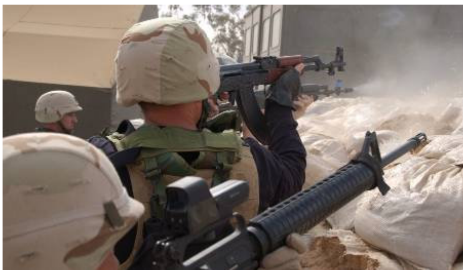
Al Sadr úgy tűnik általános támadást indított ellenünk!

A zavargások oka: pár nappal ezelőtt sikerült elfogni Sadr egyik alvezérét. Most igyekeznek visszaütni Najafban. Megerősítésül, gyakorlatilag a helyzet kezelésére az USA 1. páncélos hadosztálytól is beérkezett egy zászlóalj.