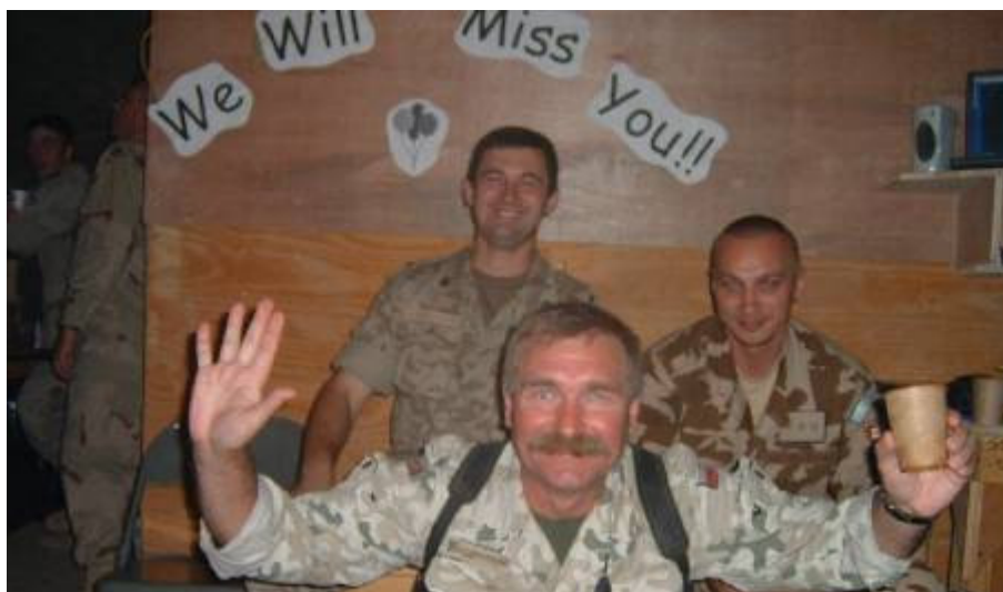
We will miss you! — Hiányozni fogtok!