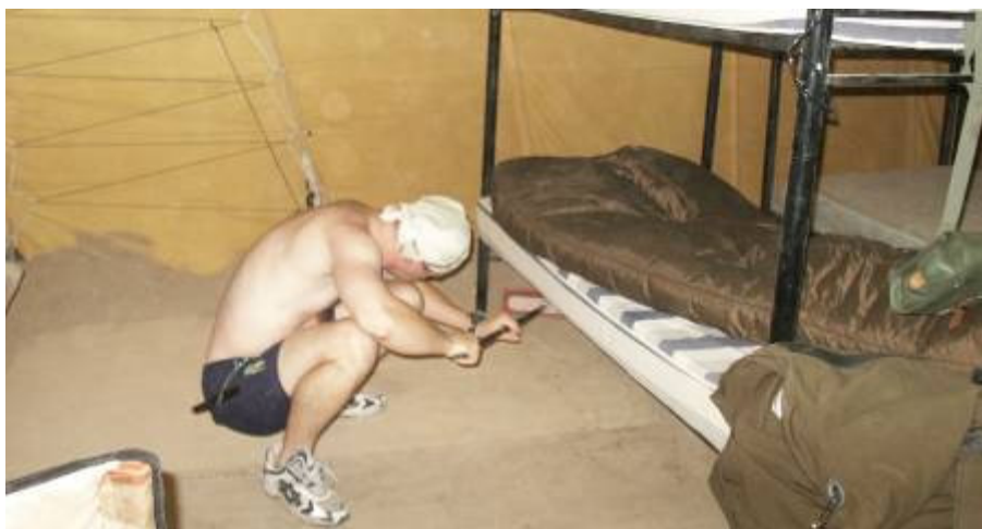
A sátorba is befújja a szél a homokot

Délután az összekötő tisztünk, Baráth alezredes hív Camp Dohából. Babiloni szállítással sikerült helikoptert igényelni 16-án reggelre. A bökkenő, hogy mi a hadosztály törzzsel vagyunk. Nem vennék jó néven, ha önállósodnánk. Ugyanakkor idegesítő ez a semmittevés. Abban maradunk, ha a holnap reggeli utazás is kútba esik, bejelentjük, hogy saját szervezésben holnapután útnak indulunk. Természetesen még egy nappal csúszik az indulás, így szabad a pálya. Saletra alezredessel, a lengyel összekötővel közöljük az igényünket. Nemsokára SMS-en érkezik a válasz: Kwiatkowski dandártábornok, hadosztályparancsnokhelyettes egyetért a szándékunkkal. Kilenc fővel kevesebb helyet foglalunk el az oszlopban. Este ultizunk, zenét hallgatunk. Holnapután reggel elutazunk!