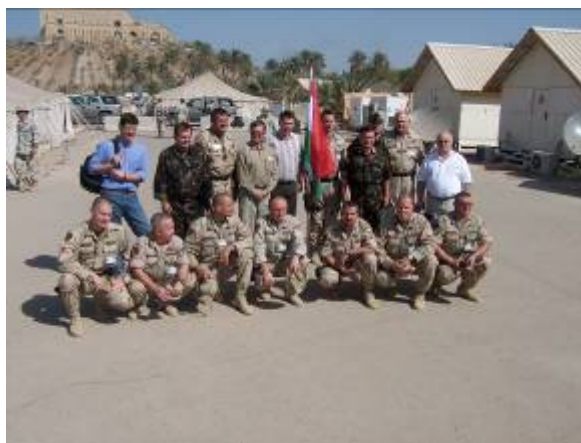
Rövid találkozás a törzstisztekkel