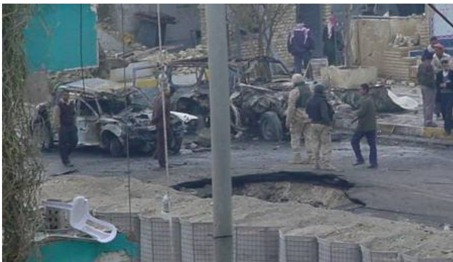
Öngyilkos merénylők által vezetett, robbanóanyaggal megtöltött gépkocsikat használtak

A városházánál a polgári őrség gépkocsiját használták a merénylők. Ott, a civilek között nagyobb a veszteség. A megtámadott bolgár tábort azonnal kiürítették, átvonultak a másik, valamivel jobban védhető, de szintén a városban lévő táborukba. Külső segítséget a végén Karbalába nem kértek, az ellátásuk biztosított.