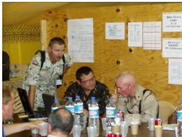
A munkasátramban röviden tájékoztatom West tábornokot

A munkasátramban röviden tájékoztatom West tábornokot. Közben ebédidő következik. A konferenciáról kijövő kollégákkal együtt megyünk ebédelni. Jó tíz percet állunk sorban. Ez is a babiloni hétköznapihoz tartozik. Ebéd közben újból a tegnapi amerikai konvojon történt rajtaütés a téma. „Ránk vadásznak!” — jelenti ki a tábornok. Lehet benne valami, mióta átvettük a körzetet jelentős atrocitás nem történt ellenünk. Ebéd után beülünk a konferenciára. Érdekes témák váltogatják egymást. Látnivalón élvezi a főnökünk is. Tapasztalhatja, komoly munka folyik nálunk. Konferencia után bemutatom a logisztikusokat. Elutazása előtt még egyszer leülünk a munkasátorban. Kiviszem a helikopterhez. Megelégedéssel távozik. Hasznos volt a kétnapos konferencia — emelem ki délután a szokásos munkaértekezleten. Egyben megköszönöm kollégáim munkáját.