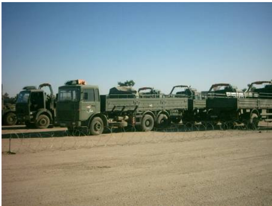
A szállító zászlóaljat kihagyom a kíséresi feladatokból

hogy október 15-ével költöztessük át a lengyel 12. gépesített zászlóaljat a logisztikai bázis (Al-Hillah) területére. Az áttelepülés megszervezésével helyettesemet, Zuchelkowski ezredest bízom meg. A feladatra munkacsoportot szerveznek. Délután újra helyszíni bejárás a parancsnokkal. Közben a latin-amerikai zászlóaljakkal kapcsolatosan is élesedik a helyzet. Az amerikaiak komoly nyomást gyakorolnak ránk, hogy a zászlóaljak megkapják a szükséges felszerelésüket. Talán jobb lett volna már Kuwaitban felszerelni őket. Közben a civil konvojok kísérése területén sincs komoly javulás. Előkészítem a parancsot kiadásra. Heti váltással négy alakulat fogja kíséni KBR konvojait. A szállító zászlóaljat kihagyom a kíséresi feladatokból. Nem erre hoztuk ki a zászlóaljat. Ezért előbb-utóbb részrehajlással fognak vádolni. Néha nem könnyű a helyzetem. Úgy érzem magam, mintha két tűz között lennék. Ebédidőben azért szakítok fél órát, és a főnökömmel kimegyünk a tábor bejáratánál létesített arab bolhapiacra. Hónalj-pisztolytáskát akarok venni, de amilyen nagydarab vagyok, nem találok rám való méretet. Veszek viszont hosszabbítót, kisméretű szőnyeget az asztalra, két arab kendőt az otthoni asszonyokra gondolva. Az egészért fizetek tizenegy dollárt. Itt még mindig értéke van az amerikai dollárnak!