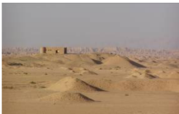
Irány a határ

Ma vasárnap, tehát Al-Kut. Ittlétem óta a harmadik hétvége, amit részben az ukránoknál töltök. Most az indok: a főnököm West tábornok jön meglátogatni a dandárt. Javaslatomra döntött így. Nem lenne jó, ha az ukránok — nagyrészt jogos panaszai, az „égig” nőnének. Helikopterrel repülünk kollégáimmal Al-Kut-ig. Rövid egyeztetés Sobora tábornokkal, és az ukrán dandárparancsnokkal, majd irány vissza, a helikopter leszállóhelyre. Nem kell sokat várnunk, pár perc múlva földet ér a két „Black Hawk”. Megjöttek a „bagdadiak”. Ebéd, majd West tábornok meghallgatja az ukrán parancsnok jelentését, amely — érthetően — a logisztikai ellátásra, azon belül is a problémás területekre utal. Nem áll az ígért étkezde-konyha komplexum, késik a parancsnoki épület és tiszti szállás átadása. A légénységi barakk felújítása még meg sem kezdődött. Figyelmesen jegyzetel a főnököm, közben rövid utasításokkal látja el a kollégáit. Bízom benne, hathatós lesz a segítség. A jelentés után rövid körbenézés a bázison, de csak a kocsikból, mert irány a határ. Átszállunk a Black Hawk-ba, és máris repülünk a sivatag felett. Nekem most nem olyan érdekes az egész. Jó egy héttel ezelőtt jártam itt. Visszafelé kellemes az út, végig fényképezem a tájat. Irak felülről.