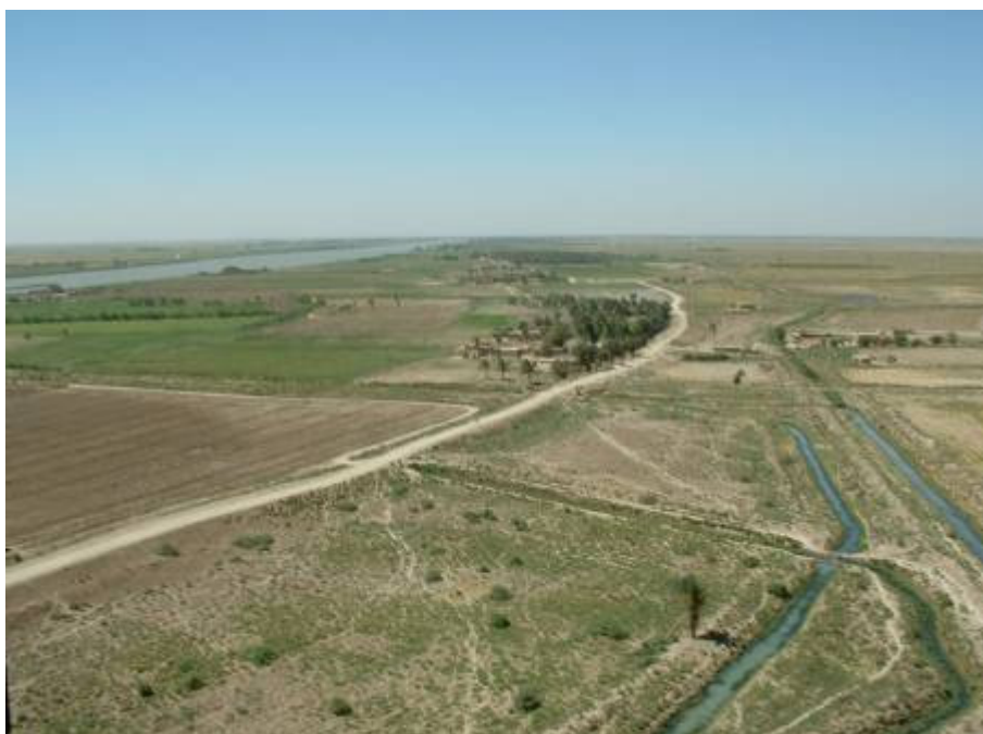
A folyók még mindig kellő vízmennyiséget biztosítanak (a Tigris folyó Al-Kutnál)

Az afro-amerikai őrnagy elismerésre méltó felkészültséggel beszél Babilon kialakulásáról. Az emberiség vélt bölcsőjénél járunk. Mind a vallásosak, mind az ateisták megegyeznek abban, hogy valamikor itt, a Tigris és az Eufrátesz közötti Mezopotámiában kezdődött a történetünk. Valahol az akkori Édenben állt a bűnre csábító almafa, amelyről Ádám gyümölcsöt szakított Évának. De a materialisták is erre a vidékre teszik az emberiség kialakulásának természet biztosította ideális körülményeit. Most semmi esetre sem látszik ez a vidék virágzóknak. Igaz a folyók még mindig kellő vízmennyiséget biztosítanak, hogy öntözéssel mezőgazdasági termelés folyjék, de az elmúlt évezredekben a valamikor paradicsomi táj sivatagossá vált. Ma nehéz itt az élet.