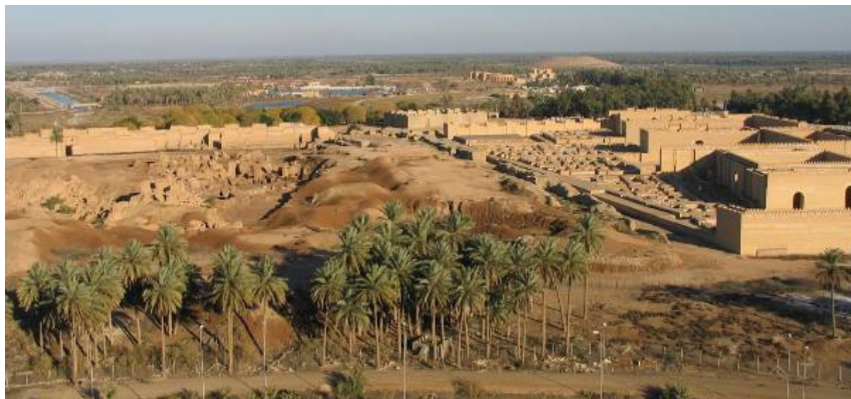
A Bibliából ismert romok

Másnap, mielőtt indulnánk, az amerikaiak kedves meglepetéssel szolgálnak. A tábor lelkészének vezetésével elsétálunk a Bibliából ismert romokhoz.