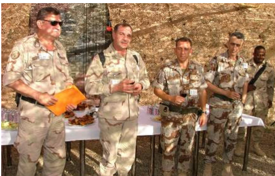
Két spanyol kollégánktól búcsúzunk