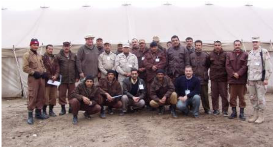
Ma folytatódik a kiképzés

Ma folytatódik a kiképzés. Iraki kollégáink elmondják, hogy az ő logisztikai rendszerük is hasonló az eddig elhangzottakhoz. Gond, hogy nyilvántartásaik arab nyelvűek, így csak bemondás alapján képzelhető el az egyeztetés. De hát az ukránok is cirill nyelvű nyilvántartásokat vezetnek. Szünetekben beszélgetünk. Viszonylag jól érthető az angoljuk. Visszaemlékezem a nálunk tizenöt évvel ezelőtti helyzetre. Úgy tűnik, nyelvtudásban előbbre járnak, mint mi akkor. Pár hét múlva feláll a dandárjuk, és önállóan kell végezniük a dolgukat. Bízom benne, hogy nem lesz különösebb gond az együttműködésben.