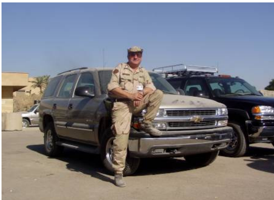
Megkaptam a szolgálati autót

terepjáróval megyünk. Gyönyörű az idő, mivel a kocsi teljesen nyitott, olyan az érzés, mintha sportkocsival száguldanánk. Csak a golyóálló mellény, a sisak meg a töltött fegyver figyelmeztet, nem kényeztetés vagyunk. A gyerekek mindenhol kiszaladnak elénk az útra. Integetnek. Sokszor a felnőttek is viszonozzák az üdvözlésünket. De jó lenne, ha végre béke lenne!