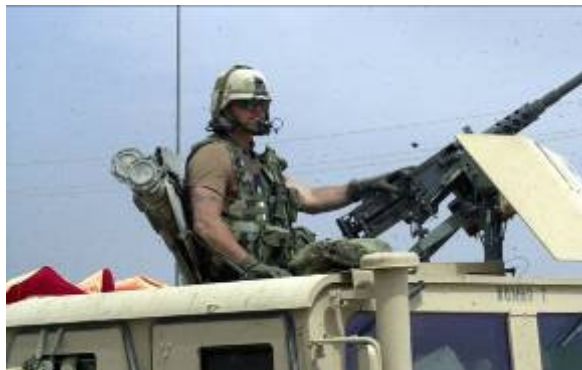
Mögöttünk egy Humvee követ