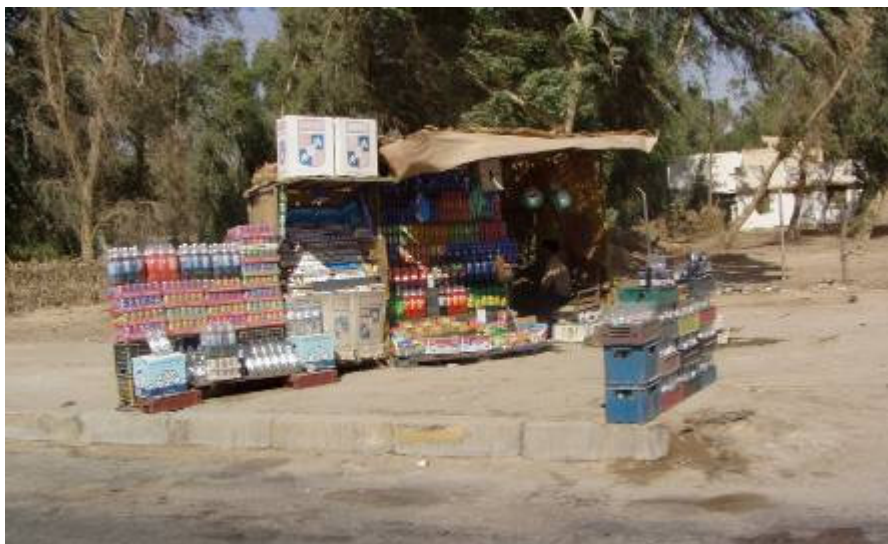
Szokás szerint fényképezek