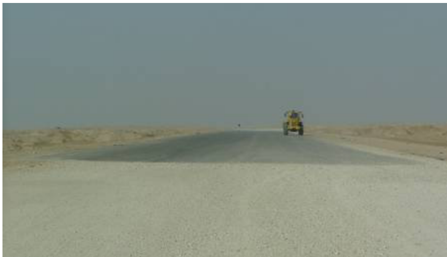
Tallilhoz közel van egy szakasz, amely murvás

nyeljük a port rendesen. Cedar II bázisnál tankolunk. Decemberben itt jártam a szemrevételezésen. Innen jobban is haladunk, az errefelé jó állapotban lévő „Szaddam-autópályán”. Délután fél ötkor Navistar-nál érjük el a kuvaiti határt. Még utoljára ledobáljuk a nekünk integető gyerekek az ebéd után megmaradt élelmiszersomagokat. Átérünk Kuvaitba, Irakot és a háborút magunk mögött tudva, este 7-kor 12 órás út után begördülünk Camp Virginiába!