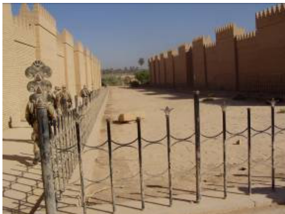
Az ókori istenek dicsőítésére épített felvonulási út