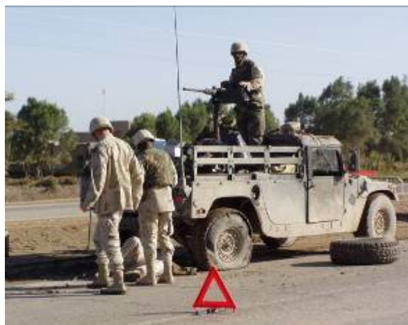
A mögöttünk haladó géppuskás Humvee defektet kap

Este részt veszünk Larsen ezredes napi eligazításán, így részletesen megismerkedünk a logisztikai szervezet sokrétű munkájával. A szállásunkkal nem az a baj, hogy sátorban van, hanem az, hogy fűtetlen. Egész éjjel forgolódom a hálósákomban, amelyről most kiderül: bizony nem téltre készült!