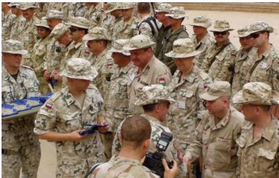
Elismerésekre is sor kerül