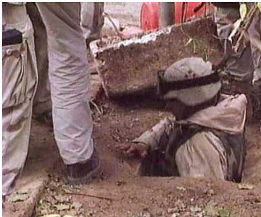
Föld alatti rejtékhelyéről húzták ki az amerikaiak

Délután kapjuk a hírt, szülőföldjén, Tikrit közelében elfogták Szaddam Huszeint. Földalatti rejtékhelyéről húzták ki az amerikaiak. Csak remélni lehet, hogy a korábbi rezsim szimbólumának elfogása legalább azokban csalódást okoz, akik mindeddig a vezérüknek tekintették. Többé azoknak sem kell tartaniuk tőle, akik eddig a véres diktátor visszatérésétől féltek. Talán jobb napok várnak ránk, és erre a sokat szenvedett népre.