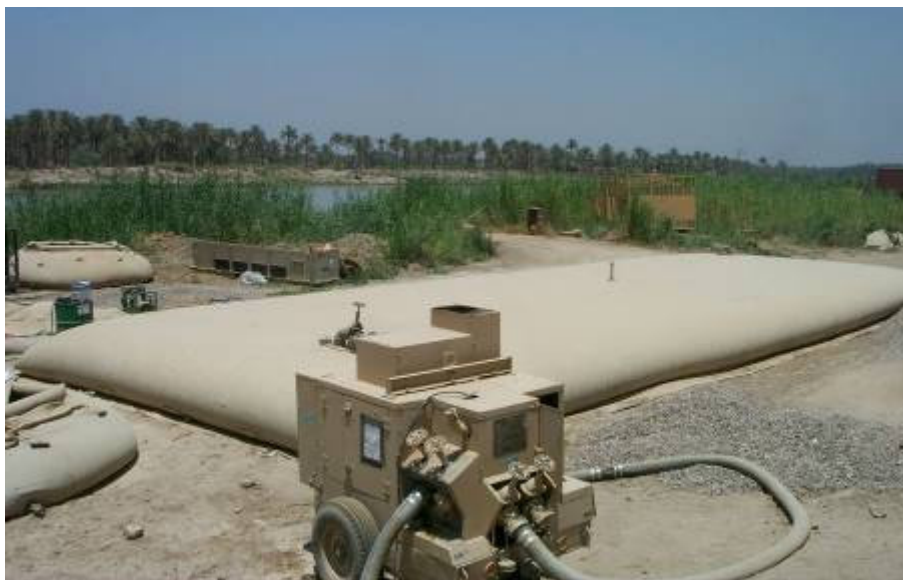
A négy víztisztítóból három működik

Szokásos hételeje. A támadások nem csökkentek, inkább növekedtek. Két tartományt (Quadi-siya, Najaf) átadtunk az amerikaiaknak. Az ötből három maradt. Most már tényleg „hadosztály-mínusszal” vagyunk! Problémát jelentenek a vízellátásnál. Kimegyek a folyópartra. A négy víztisztítóból három működik. Kiderül: egy már hónapok óta rossz. Ennek ellenére nem tűnik a gond súlyosnak. Csak le ne robbanjon még egy. Hamar elszalad a nap. Az éjszakák még hűvösek, de nappal már rendszeresen harminc fok felé kúszik a hőmérő higanyszála. Este mozizással csapom agyon a maradék kis időmet. Éppen elalszom, amikor távoli robbanások zaja ugraszt ki az ágyamból. 5-6 robbanás. A tábor felébred. Nincs folytatás, mindenki megnyugszik. Majd reggel megtudjuk, mi történt. Nehezen alszom vissza, lehet, hogy holnap bennünket fognak löni?