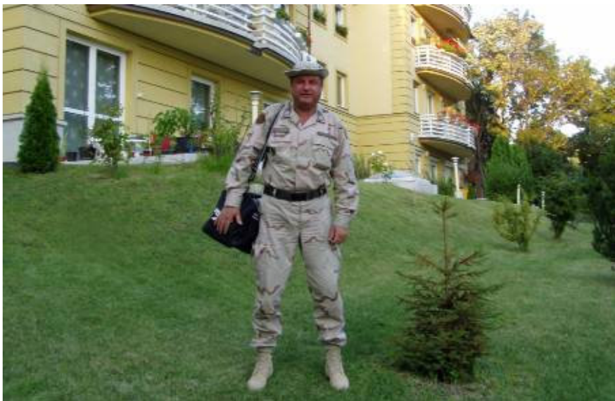
„Mission accomplished” — A küldetés véget ért