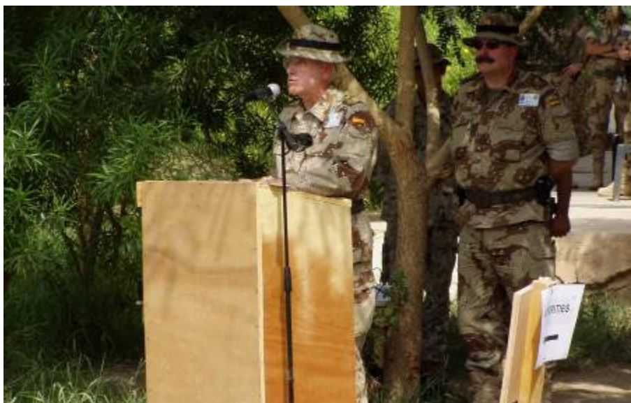
Délben a spanyolok nemzeti ünnepe