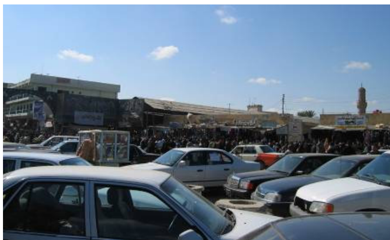
Belegabalyodtunk a délutáni csúcsforgalomba