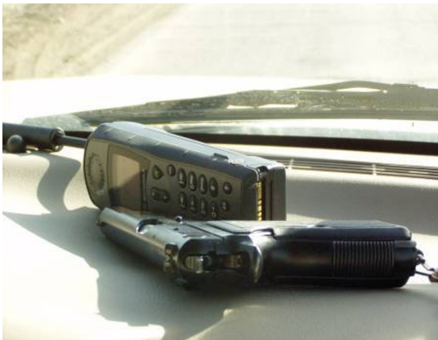
Telefon bekapcsolva, a parabellum csőre töltve