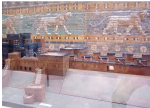
...és az eredeti díszítések Berlinben

Érdekesek a több ezer éves feliratos téglák, és az állat-madárformájú „szent állatok” figurái, amelyből egy másolatot a bejáratnál lévő Souvenir boltban borsos áron magam is vásárolok. Érdeklődéssel mászkálunk, még a forróságot is feledjük, amikor az ókor hét csodájának másik emlékét, Semiramis függőkertjének a „helyét” szemléljük. Az egyetlen épen maradt monументális alkotás a „Babilon oroszlánja” néven ismert kőszobor, amelyet az elmúlt évszázadok alatt (feltehetően a súlya miatt) nem tudtak innen elhurcolni. A jól kivehető oroszlán tömege alatt egy ember fekszik. Számomra a természet győzelme az ember felett szimbolikus ábrázolása. Mint mindig, most is a küzdelem a jellemző, hogy ne a szobor által sugallt igazság győzedelmeskedjen, hanem mi, emberek váljunk úrrá a természeten még akkor is, ha olyan nehezen viselhető el, mint itt.