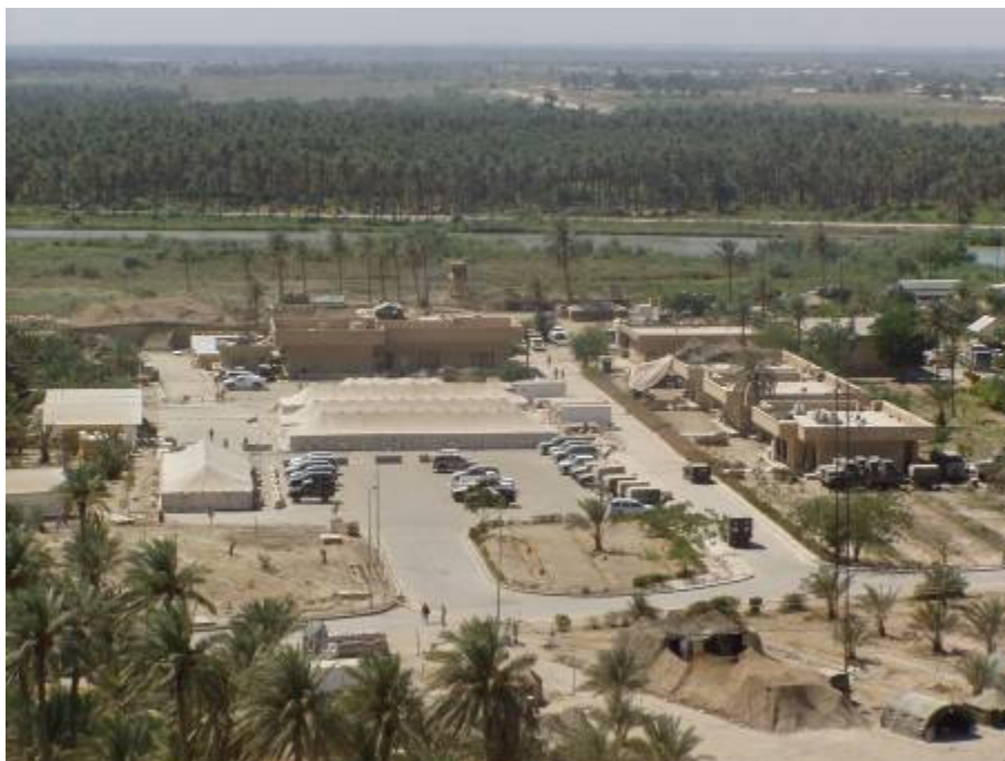
Az információk szerint támadás várható a parancsnokság ellen

A helyzet tovább romlott. A zavargások kiterjedtek Wasit tartományra, az ukránok fellegvására, Al-Kut-ra is. Napközben több támadás érte a várost, a legfontosabb cél: a polgári közigazgatási központ, a CPA elfoglalása. Halálos találat érte az egyik ukrán katonát is, többen megsebesültek. Nálunk a parancsnokságon sem rózsás a helyzet! Kora délután elrendelték a következő készültségi fokot: golyóálló-mellény, sisak, teljes fegyverzet betárazva! Az információk szerint támadás várható a parancsnokság ellen. Az biztos, hogy nálunk egyelőre nagy a csönd. Addig, ameddig máshol támadás támadást ér, nálunk semmi. Lehet, hogy ez a vihar előtti csend?