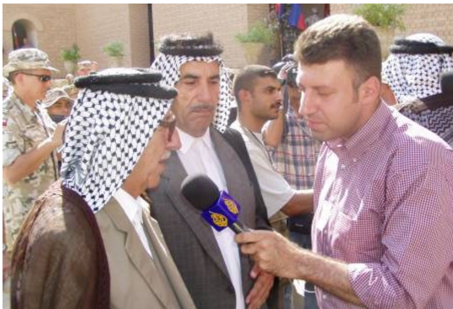
Tisztviselők, Sejkek. Sokan a régi rezsimben is fontos szerepet töltöttek be