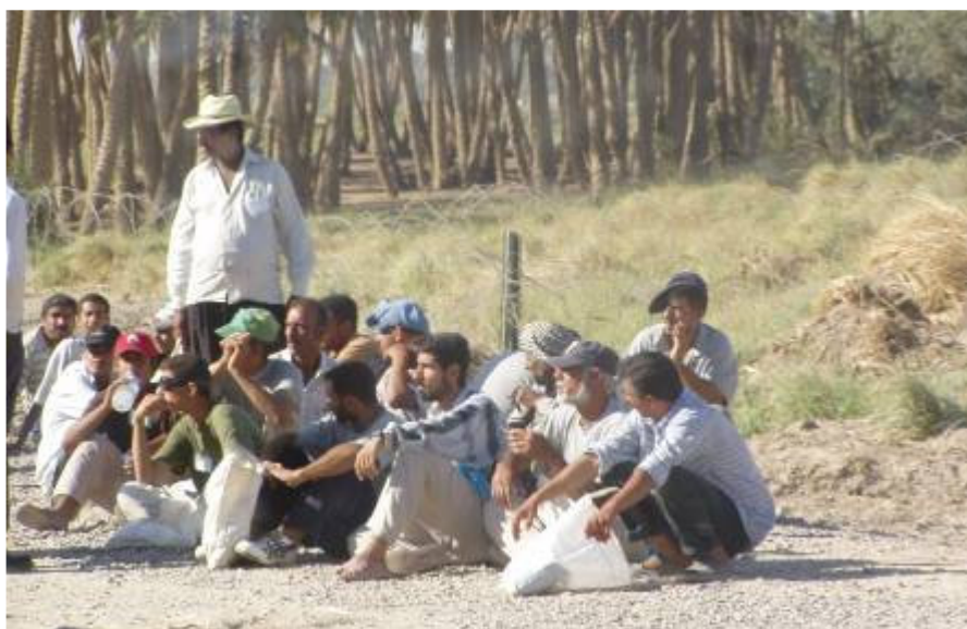
Biztonsági okokból nem engedik be dolgozni az iraki alkalmazottakat

A KBR megtagadja, hogy a dolgozói kellő fegyveres biztosítás nélkül az utakon mozogjanak. A logisztika minden területén folyamatosan jelentkeznek a gondok. Hiába, mi nem háborúra lettünk létrehozva. Pedig itt háború van!