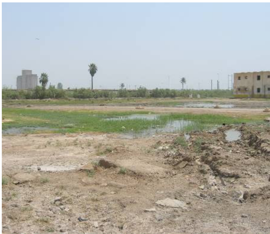
Kisebb tónak is beillő, vízzel elöntött rész

A központon túl kis idő múlva laktanyakerítés tűnik fel. Behajtunk az elhagyott objektumba. Úgy tűnik, mintha a harcok ezt a részt is érintették volna. Az épületek még állnak, de ami könnyen mozgatható volt, elvitték. A hajdani kaszárnya épületei ablaktalanok, hiányosak az ajtók. Némelyik helyiségben korom látható. No, nem tűzérési belövés nyomai, valószínűleg égethettek belül valamit. Az épületek közötti nagy helyen kisebb tónak is beillő vízzel elöntött rész, amelyet a sérült vízvezeték folyamatosan táplál.