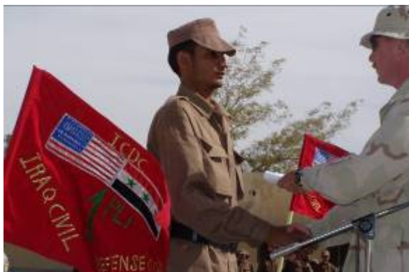
Új iraki védelmi erők