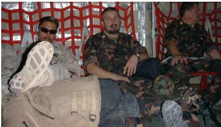
Egy C–130-ra szállunk, a gép dugig van