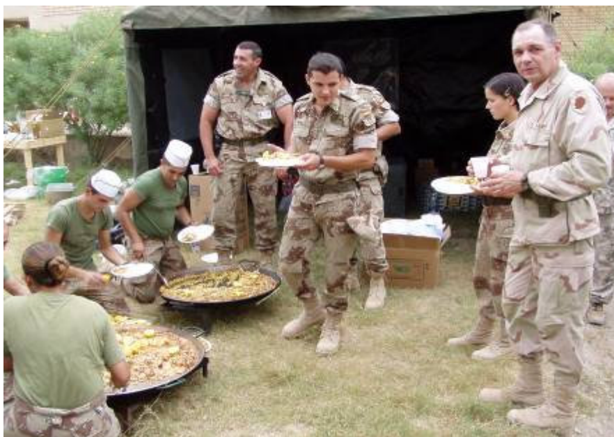
Egyik fő nemzeti eledelükkel kínálnak meg

bennünket, amely hasonló a mi rizses húshoz. Természetesen szesztilalom ide, szesztilalom oda, a finom spanyol vörös bor sem maradhat el. Jobban is megy a jelentésgyártás ebéd után.