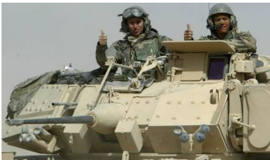
Az amerikai konvoj élén egy Bradley harcjármű

Visszafelé elnézem a sivár vidéket. Szegénység, lepusztult épületek, szemét mindenfelé. De az élet beindult. Mozgás az utakon, a városokban, különösen élénk a forgalom a piacok környékén. Egyre többen integetnek vissza. Úgy látszik, az emberek többsége nem fogad minket ellenséggént. Azért jó lesz vigyázni. Tegnap éjjel a spanyol táborba lőttek be aknavetővel. Szerencsére sérülés nem volt.