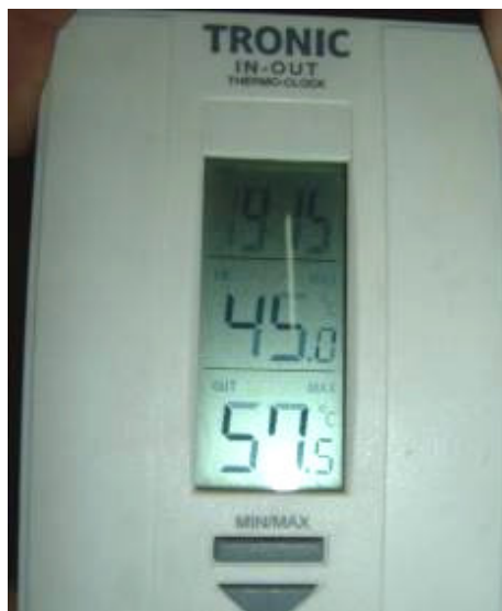
Közben az irodámba beszerelik a légkondit

A nap különben csendben folyik. Kitakarítok. Közben az irodámba beszerelik a légkondit. Ideje volt, mert a nagy nehezen szerzett ventilátor már nemigen bírta.