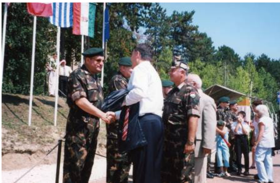
Augusztus 4-én a honvédelmi miniszter búcsúztatott el bennünket

Hazatérve, itthon gyakorlatilag csak a hétvége volt a miénk. Még a repülőtéren, Szolnokon megkaptuk azokat a felszereléseket, amelyek hiányoztak. Sajnos a sivatagi ruha még ránk, kilencünkre sem készült el, így a barna trópusi ruhában vágunk neki a hosszú útnak. Augusztus 4-én a Szilágyi Erzsébet úti HM objektumban a honvédelmi miniszter búcsúztatott el bennünket.