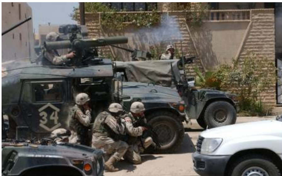
Már napok óta tartanak a zavargások