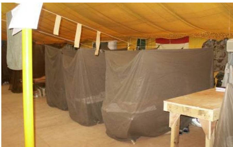
Véget ér a sátor élet