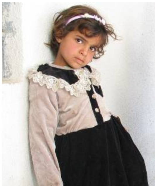
Fehér blúz-fekete formaruha van rajtuk

Visszafelé lassabban jövünk, sok az útlezárás. Amerikai MP-k ellenőriznek. Sok a konvojok elleni támadás. Mi ma megúsztuk. Jó háromórás utazás után érkezünk vissza Al-Hillah-ba.