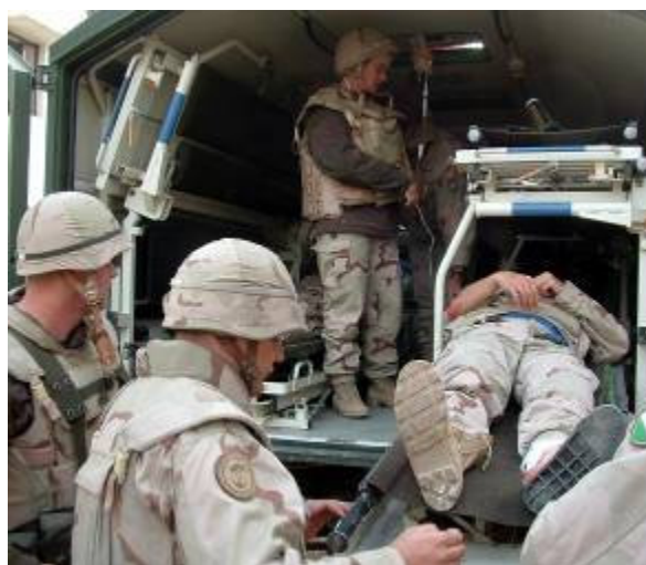
Van az orvosoknak mit tenni