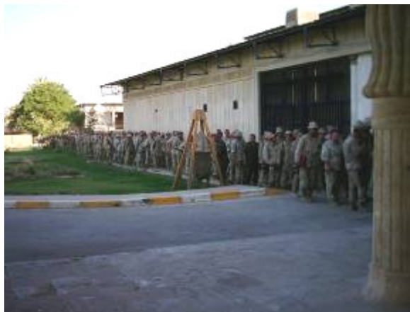
Jó tíz percet állunk sorban