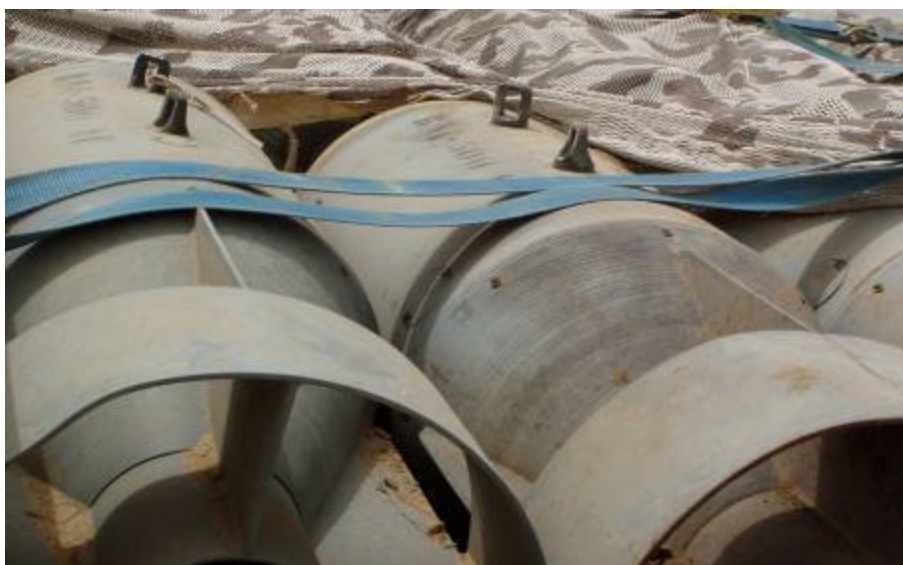
A magyarok egy ideje repülőbombákat szednek össze

A „Zulu-táborba” visszatérve szaunázás, utána tisztességes ukrán vendéglátás. És Babilonba visszatérve még nincs vége: este Richárd napot ünnepelünk. Főnököm, a törzsfőnök Wisniewski ezredes — Richárd. Isten éltesse!