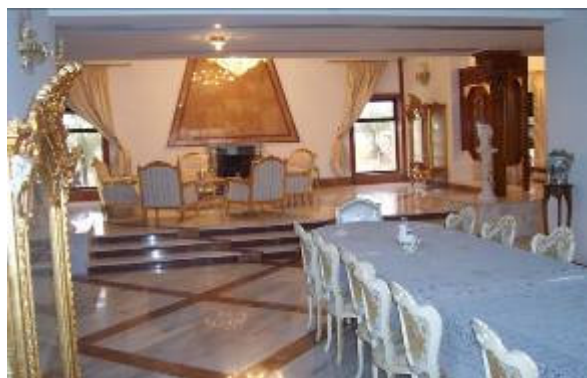
A Victory palota VIP részlegében helyeztek el

De azért a lényeg, amelyért idejöttünk: az új szervezés szerinti MNC-I parancsnoka, Metz altábornagy által elnökölt konferencia jól sikerült. West tábornokkal is sikerült beszélnem. Sokszor úgy tűnik, nem csak rajta múlik mikor és miért (legtöbbször kapcsolható-halasztható anyagszállításról van szó!) küldenek bennünket szállítási feladatokra, a konvojokra különösen veszélyes „szunnita-háromszögbe”!