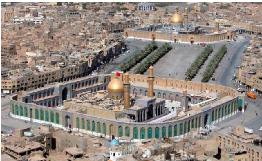
Jön az Ashurah a sííták nagy zarándoklása. A szent helyek Karbalában

Kitakarítom a szállásomat, felmosok. Rendben akarok itt hagyni mindent. Összepakolok. Már ki tudja, hányadszor rakosgatom ki és be a holmijaimat. Egy hátizsákkal megyek, nem sok fér bele. Mivel március 6-ra ígérték a repülőt, mi a zászlóaljjal negyedikén elindulunk Kuvaitba. Remélem, a jövő hét végét már otthon töltöm.