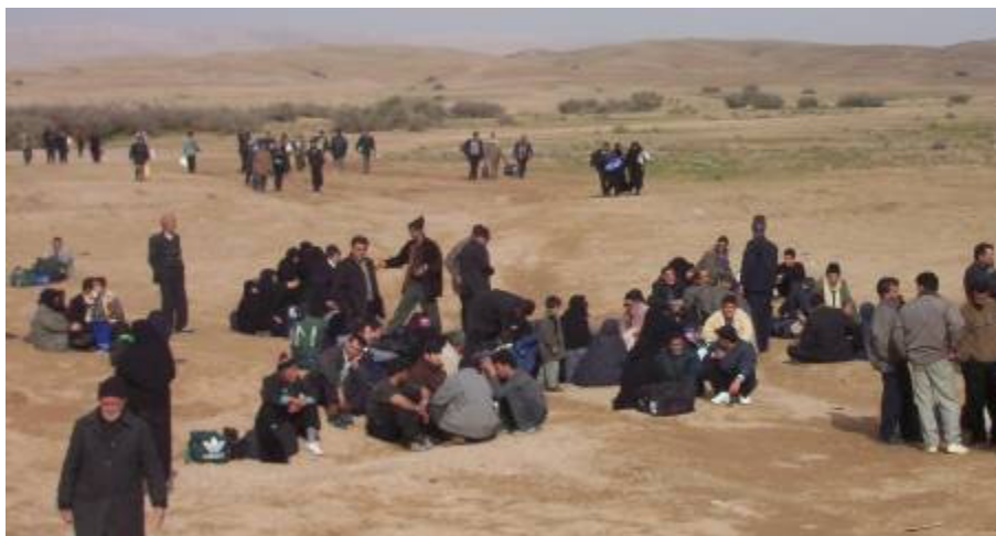
Látnivalóan sokan igyekeznek az iraki–iráni határ ezen oldalára