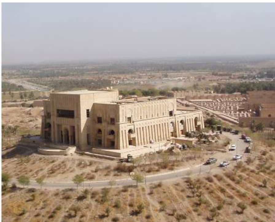
Beülök a kocsimba és felhajtok a Szaddam palotához

A folyó felé nagy terem, mintha trónterem lenne. Amilyen nagyzólos volt Szaddam, tényleg lehet, hogy hasonló alkalmakra tartogatta. Itt fogadhatta a hódolóit. Hamurabi és Nabukonodor után szabadon. Felmegyek a tetőre is. Vigyázok, mert pár hónappal ezelőtt, amikor a tengerészgyalogosok laktak itt, egyikük lezuhant. Halálra zúzta magát. Szép képeket készítek főnről. Belátni az egész környéket. Délután a saját dolgaimmel pizmogok. Már ki tudja hányadszor rakosgatom át a holmijaimat a tengerész-zsákjaimból. Egyet teljesen megtöltenek a felesleges cuccaim. Még gyalogsági ásó tokom is van. Persze gyalogsági ásó nélkül. Miért is kellene az ide a futóhomokba? De akkor meg minek adták a tokot?