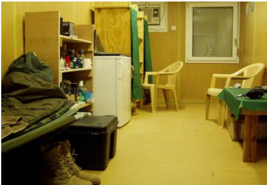
Kitakarítok, felmosok, szeretem a rendet körülöttem

Utána pár órára ellógok a kuckómba. Kitakarítok, felmosok, szeretem a rendet körülöttem. Az ajtómrá ragasztott cédulán betétes ágycserét ajánlanak az összecsukszó tábori ágyamért. Eldöntöttem: nem cserélek. Egész jól érzem magam hetedik hónapja ezen a különben egyszerű tábori ágyon. Valószínű, hogy a felfújható tábori matraccnak is köszönhetően, nem fáj a derekam felkelés után.