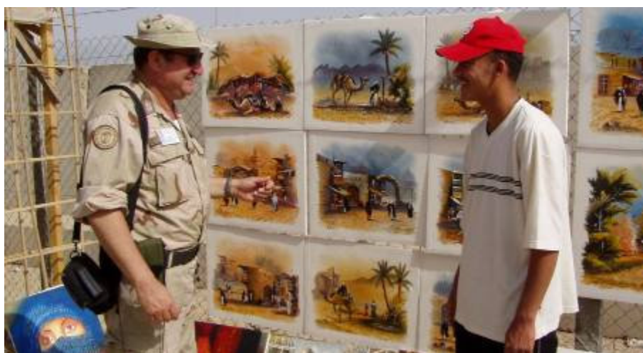
Még utoljára a „Hadji-marketre” is kiszaladok

Tónival délelőtt még utoljára a „Hadji-marketre” is kiszaladok. Ez is valahol az átadás-átvétel része. No és ami a fontos, veszek még utoljára egy szép olajfestményt!