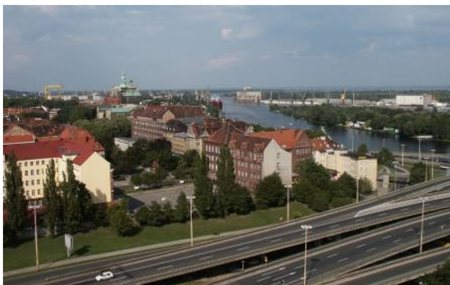
Újból három napot fogunk eltölteni ebben a kedves észak-lengyel kikötővárosban

Jó érzés, hogy a zászlóaljtól elkészönve hozzánk, törzstisztekhez is odajött. Nekem, mint a csoport parancsnokának külön is megköszönte az eddigi tevékenységemet. Szavai jólestek. Még este leutaztunk Szolnokra. Másnap, 5-én kedden, hajnali négykor már kint voltunk a repülőtéren, hogy egy óra múlva felszálljunk és Szczecinen keresztül csatlakozva a többiekhez, terv szerint együtt repülünk 6-án Kuvaitba, ahonnan néhány nap múlva „lábon” megyünk fel Irakba, Babilonba. Az Afganisztánba készülő váltással együtt repülünk. Ők Bonnba repülnek, majd onnan tovább a német légierő gépével. Reggel nyolckor szállunk le a már ismert szzczecini repülőtéren. Akkor még nem tudtuk, hogy különböző időpontcsúszások miatt újból három napot fogunk eltölteni ebben a kedves, észak-lengyel kikötővárosban.