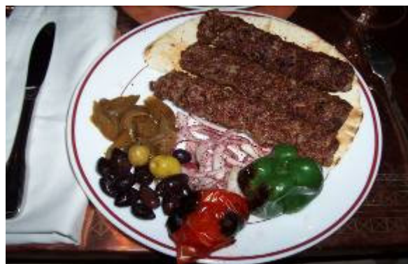
Ebéd a „zöld zónában”, az Al Rashid szállodában