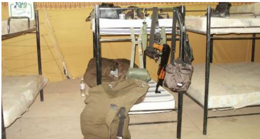
Jó, ha tizenöten foglalunk el egy sátrat