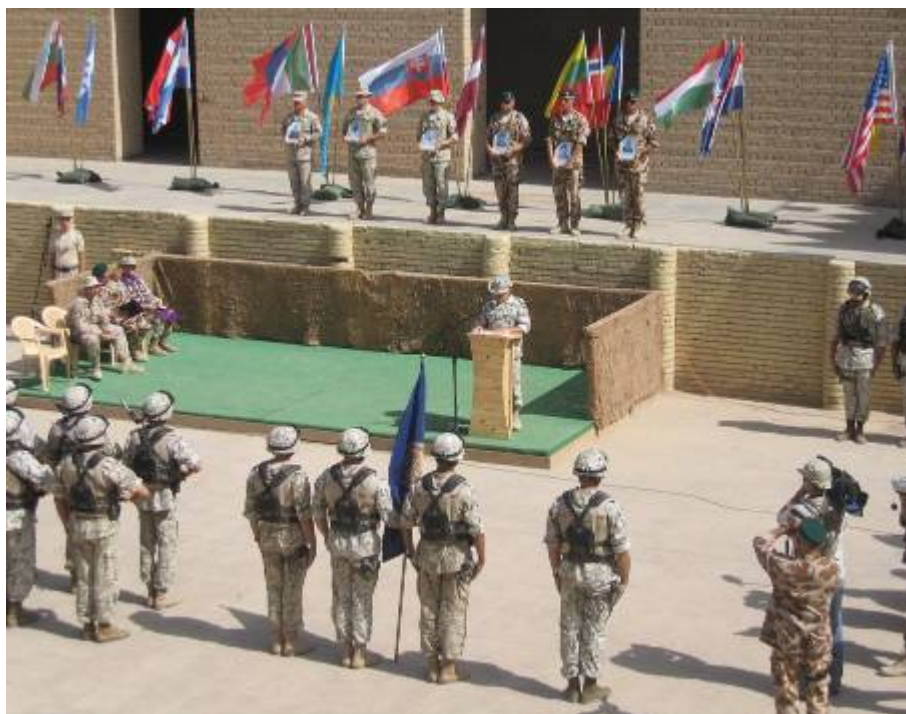
Délután négykor gyászemlékezés az amfiteátrumban

Délután négykor gyászemlékezés az Amfiteátrumban. Könnyesen búcsúzunk a tegnapelőtt meghalt hat katonánktól. Fáj a szívem. Fiatalok voltak, huszonévesek. Az egész élet előttük állt. Ezer és ezer kilométerre a hazájuktól vették életüket. Bízunk benne, nem hiába!