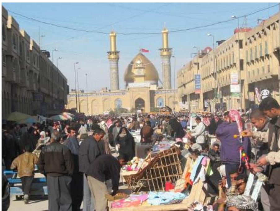
Holnap Karbalába megyünk

Délután a város másik végében lévő úgynevezett „Pisztoly-gyárba” megyünk. Az elmúlt hetekben kétszer is jártam itt. Sajnos az amerikaiak távozása után sem javult a helyzet. Igaz, most több a fürdő konténer, higiéniai lehetőség, de napok óta nincs meleg étel ellátás, a katonák légkondicionáló nélküli munkacsarnokokban laknak. A belső környezet is elhanyagolt, szemét van mindenfelé. Lesújtó a kép. Félek, a zászlóaljparancsnok igénytelensége is közrejátszik. Várnak, hátha mégis elmehetnének innen. Na, és addig? Kicsit lehangolódva megyek el. Holnap Karbalába megyünk. Ma egy hónapja indultam el erre az izgalmas, minden nap új kihívásokat jelentő hosszú útra.