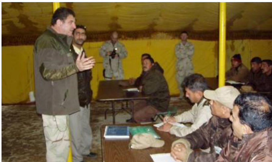
Huszonhárom iraki tiszt ül a padokban

A bevezető után munkatársaim és a törzsemnél dolgozó amerikai összekötők tartanak előadásokat. Közben új kollégáimat figyelem. Nagyonbbrészt fiatalok. Főhadnagyok, századosok. Érdeklődő, nyílt arccal figyelnek. Szívből kívánom, hogy egy alakuló új ország jó katonái legyenek.