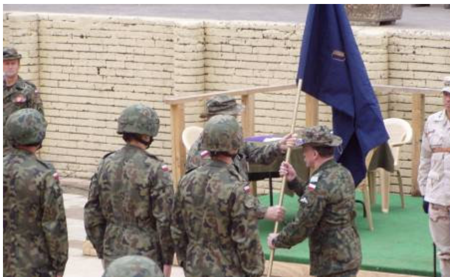
A nap kiemelkedő eseménye a délben történő parancsnokváltás

Este a törzsfőnök ad búcsúvacsorát. A vezető kollégák közül is alig-alig marad régi.