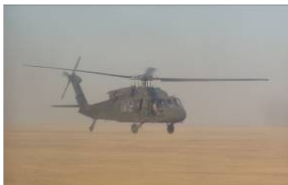
Repülünk a sivatag felett