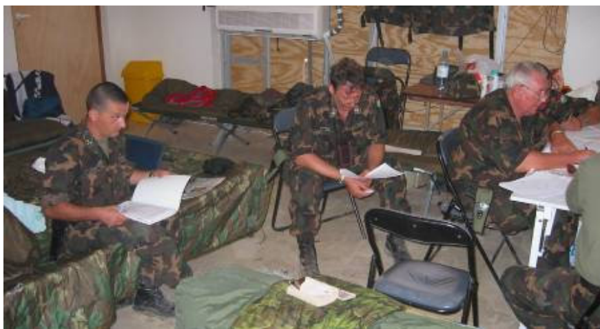
Kijelöltünk, lemértünk, lerajzoltunk mindent

A következő két nap a jövőbeni települési körlet bejárásával, és minden részletre kiterjedő felméréssel telt el. Közben haza is jelentettünk a biztosított szatellit-telefon készüléken, annál is inkább, mivel otthonról olyan, mint a helyszínen kiderült hamis értesülést kaptunk, hogy a zászlóalj telepítésére a lengyelek egy jobb helyszínt találtak! Minden maradt a régiben, így otthon is bátrabban folytatható a párhuzamos munka. Mi is kijelöltünk, lemértünk, lerajzoltunk mindent, hogy hazaérkezve minél részletesebb jelentést tudjunk tenni. Pénteken a tapasztalatok összegzése után, most már a többi nemzet képviselőivel együtt repültünk Kuvaitba.