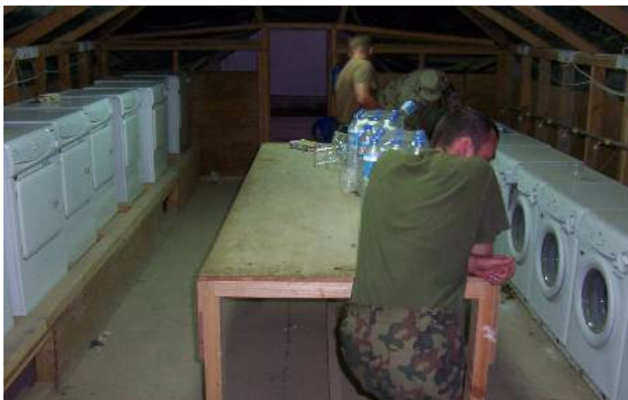
Kihasználom az itteni kevésbé zsúfolt önkiszolgáló mosodát és kimosom

Mind közben kihasználom az itteni kevésbé zsúfolt önkiszolgáló mosodát és a ruháimat is kimosom. Bevásárolok a most megnyílt „magyar” kázinóban. Tizenkétezer forintos havi keretet kaptunk. Igazán gáláns. Bár az ellátás minden területén ezt tapasztalhatnám! Délután bent Babilonban a várható nagymennyiségű szállító technika átvételét az arra kiadandó intézkedést, a FRAGO-t beszéljük át. Van mit tenni!