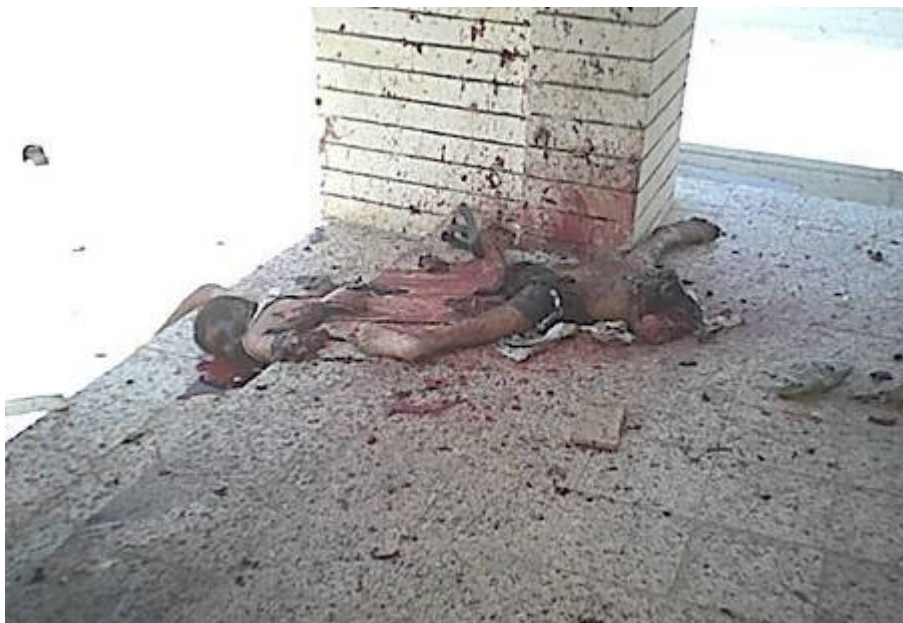
Ez is a háborúval együtt jár