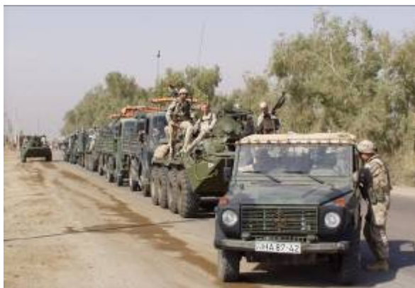
Elöl-hátul BTR, van belőlük három is