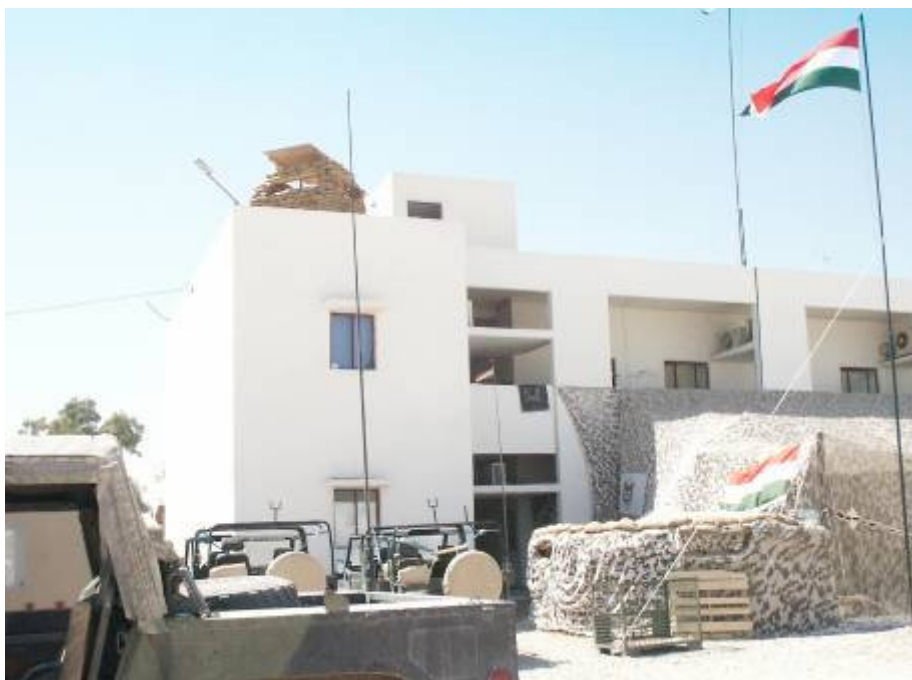
Nem ismerek a két hónappal ezelőtt látott helyszínrre

Al-Hillah-ban a logisztikai zászlóalj és a már kint lévő magyar erők megbízott parancsnoka vár. Nem ismerek rá a két hónappal ezelőtt látott helyszínrre. A lakóhelynek kijelölt épületek tökéletesen rendbe hozva, kimeszelve, az ablakok behelyezve. Mindent a Taszárról is jól ismert Brown & Root Co végez. Ez a „civil” társaság az amerikai fegyveres erők legnagyobb ellátó partnere. Az iraki küldetésen azért van, aki jól jár! Nem is kevésbé! Igaz, a munka eredménye is látható. Hallom, az étkeztetést is Brown & Root-ék veszik át szeptembertől.