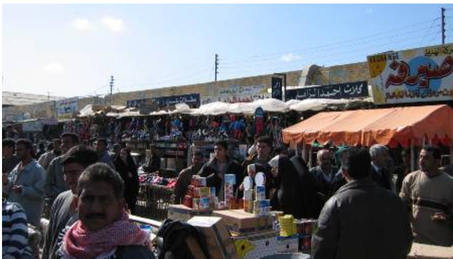
Ha nem is ellenségesek, de közömbösek