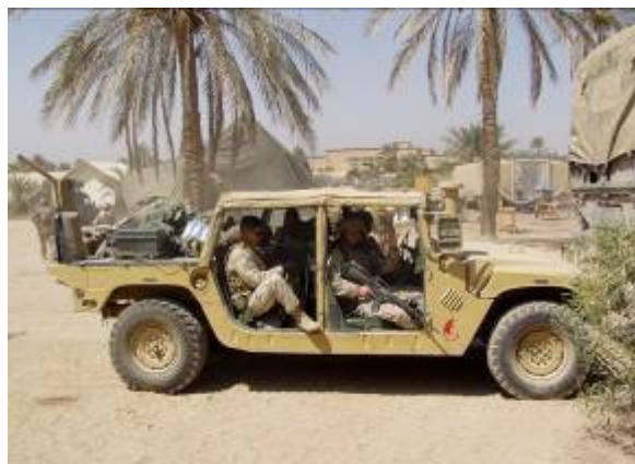
És elmentek a tengerészgyalogosok is!