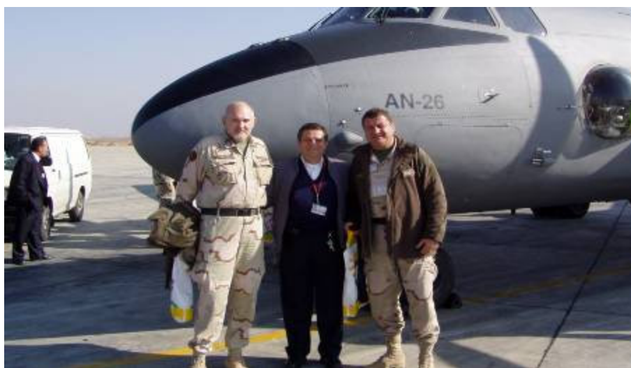
Damaszkuszban arab ismerősünk fogad