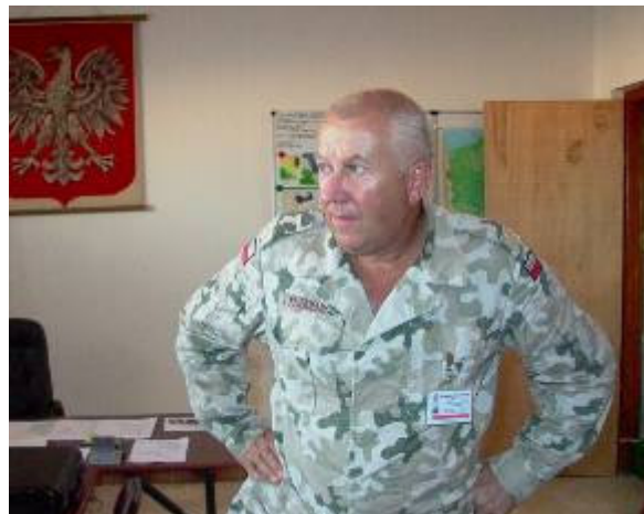
Délután Tyszkiewicz tábornok tartott értekezletet