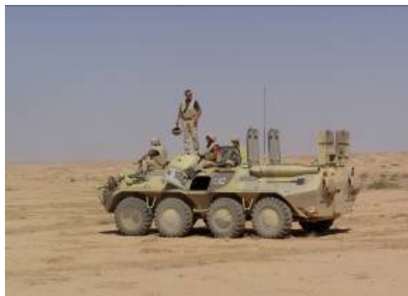
Kiabálást hallunk a toronyból - aknamező!