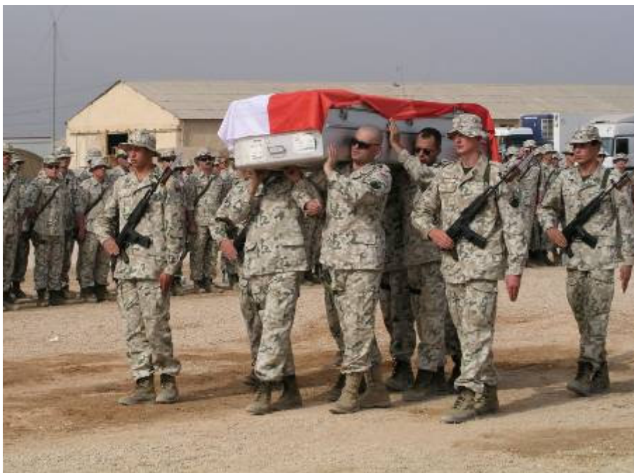
Van ebben az összekapaszkodásban valami üzenet is felénk