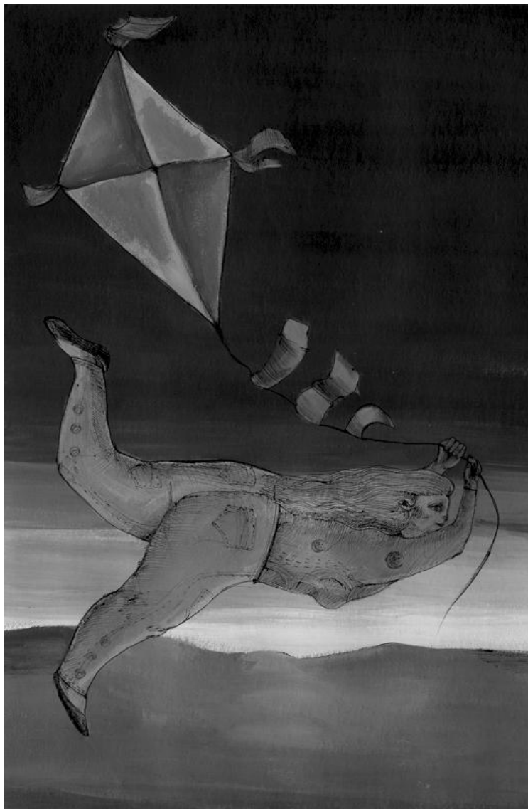
MÁRVÁNY BERTA: SODRÁSBAN