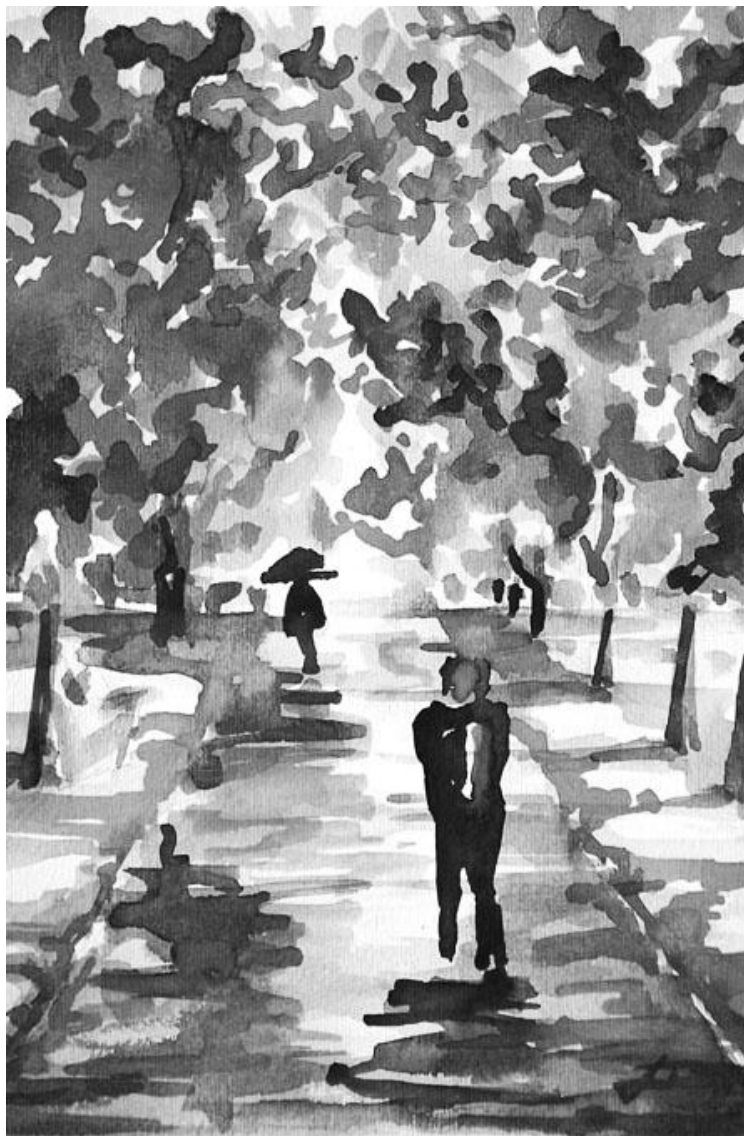
FENYVESI EDIT: MAGÁNYOSAN