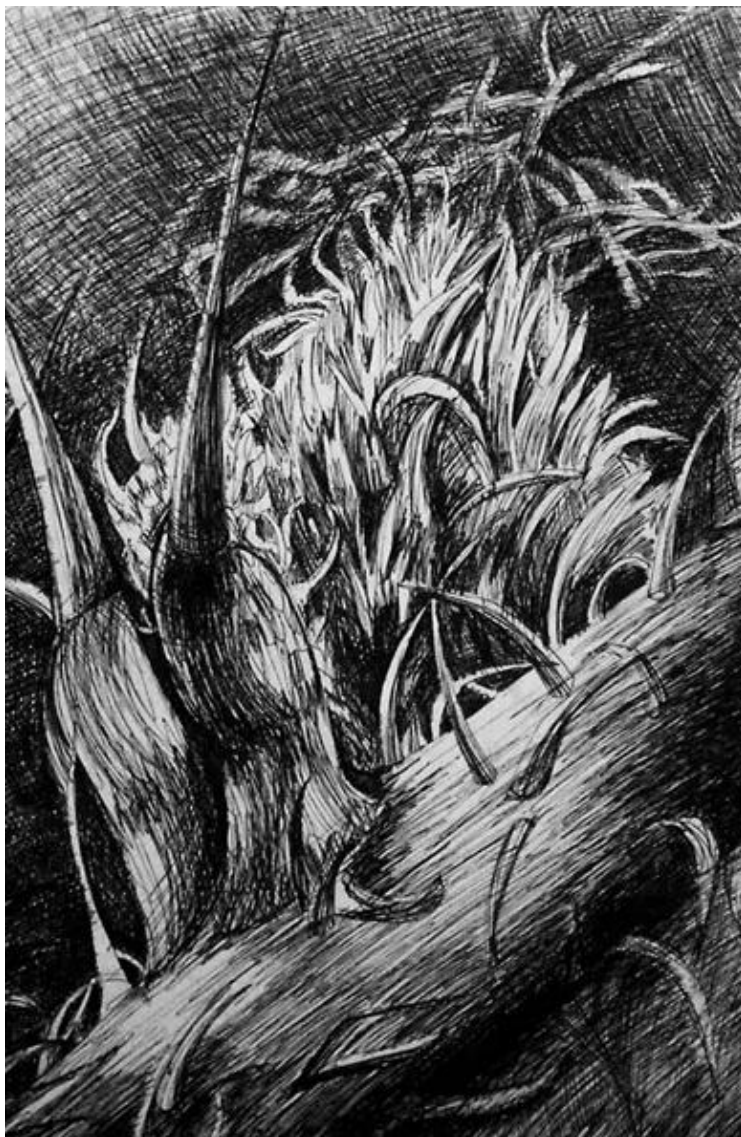
FENYVESI EDIT: A VÉGTÉLEN