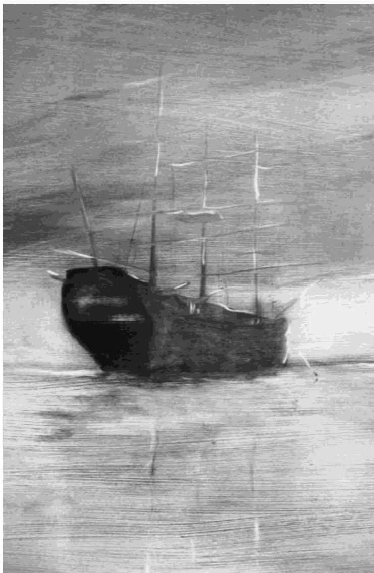
OLÁH JÁNOS: HMS VICTORY