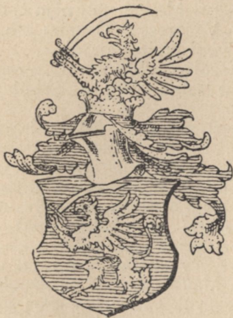
Szunyogszegi Mayláth cimerek változatai.

szlávban pedig lécet, vagy deszkát, tehát házvédő eszközt jelent. Majlát tehát az ő szlávban annyit tett, mint „páncéлом“ „védőm“.