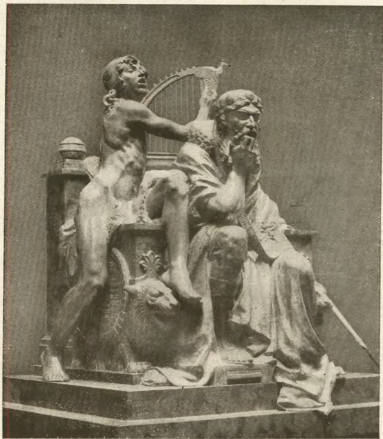
RÓNA JÓZSEF SZOBRA