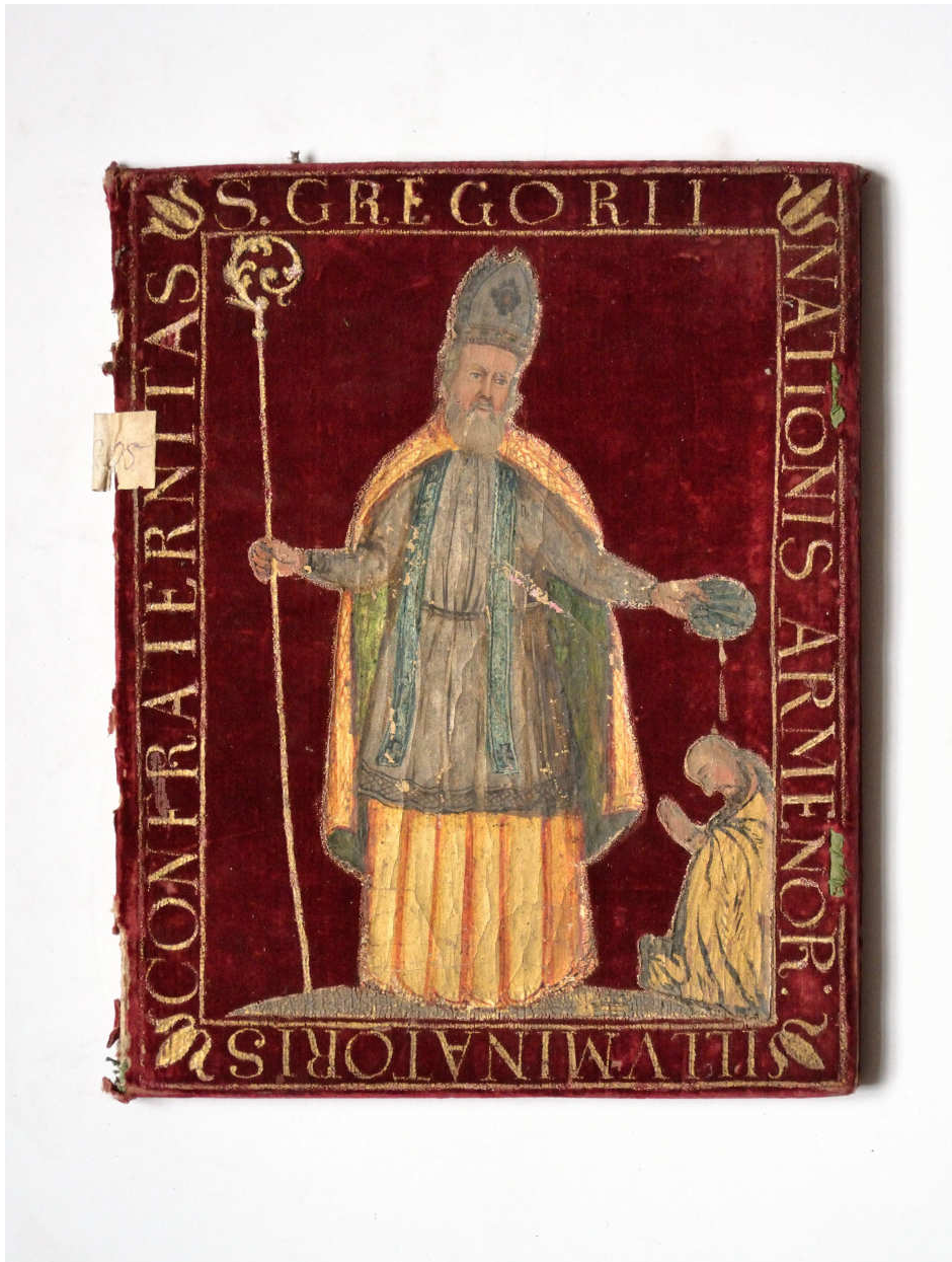
4. Deed of foundation of the Congregation of Saint Gregory the Illuminator (1729)