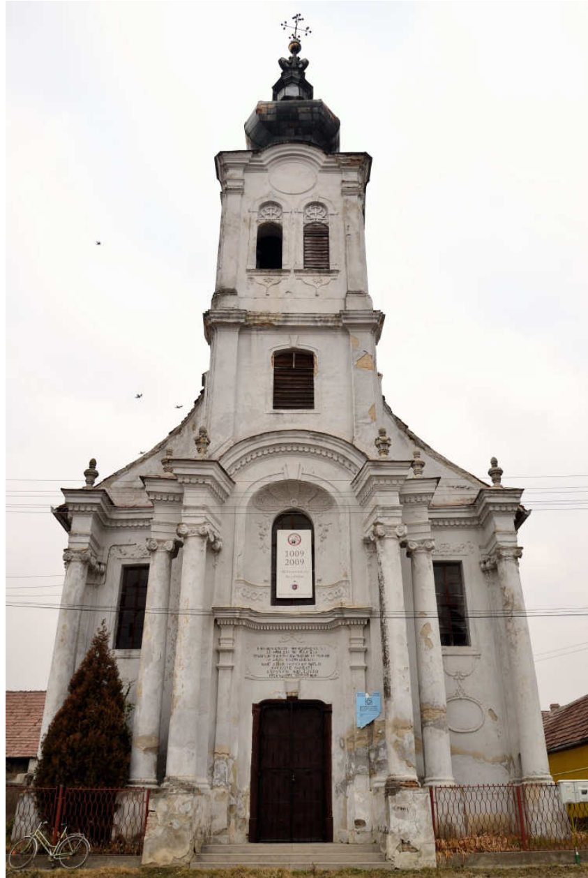
5. The former Mechitarist church