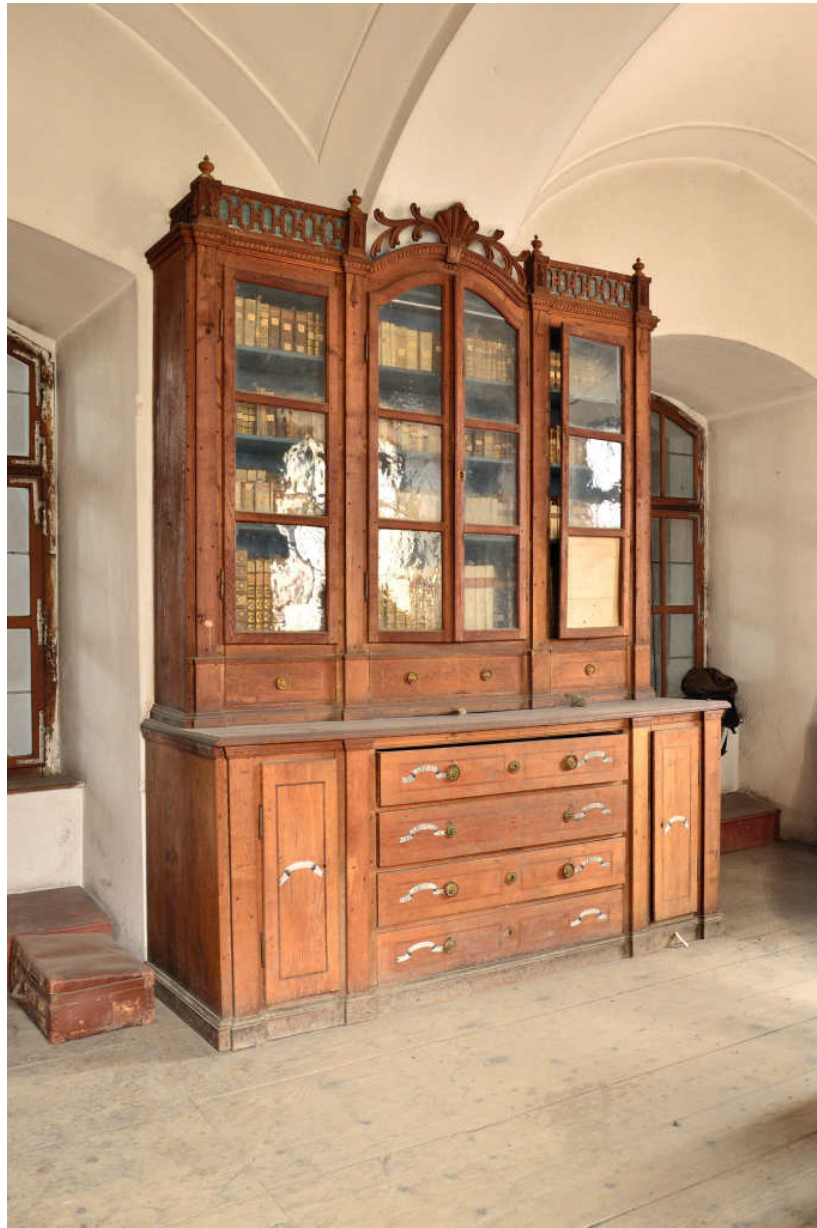
3. Book cabinet in the Armenian library