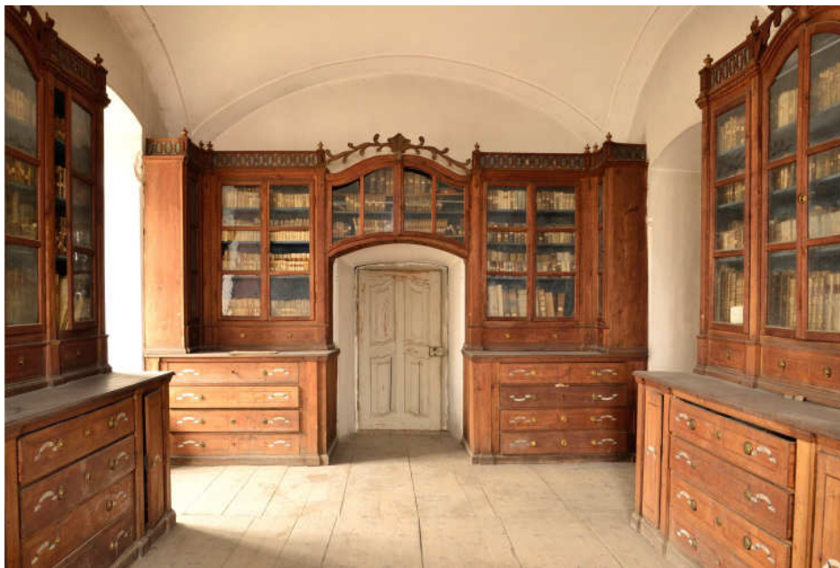
2. The Armenian library of Elisabethopolis