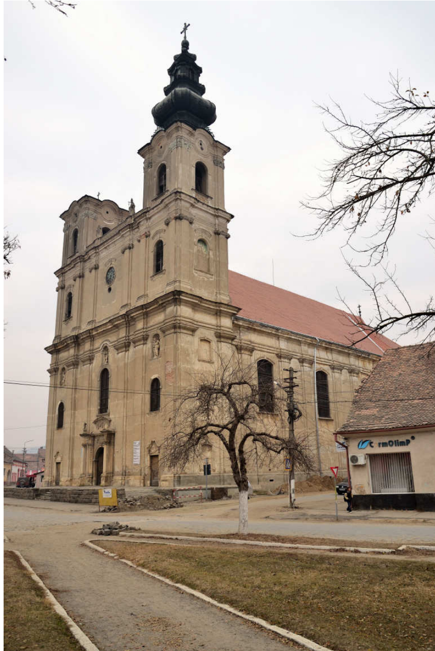
1. Armenian Catholic parish church – Elisabethopolis