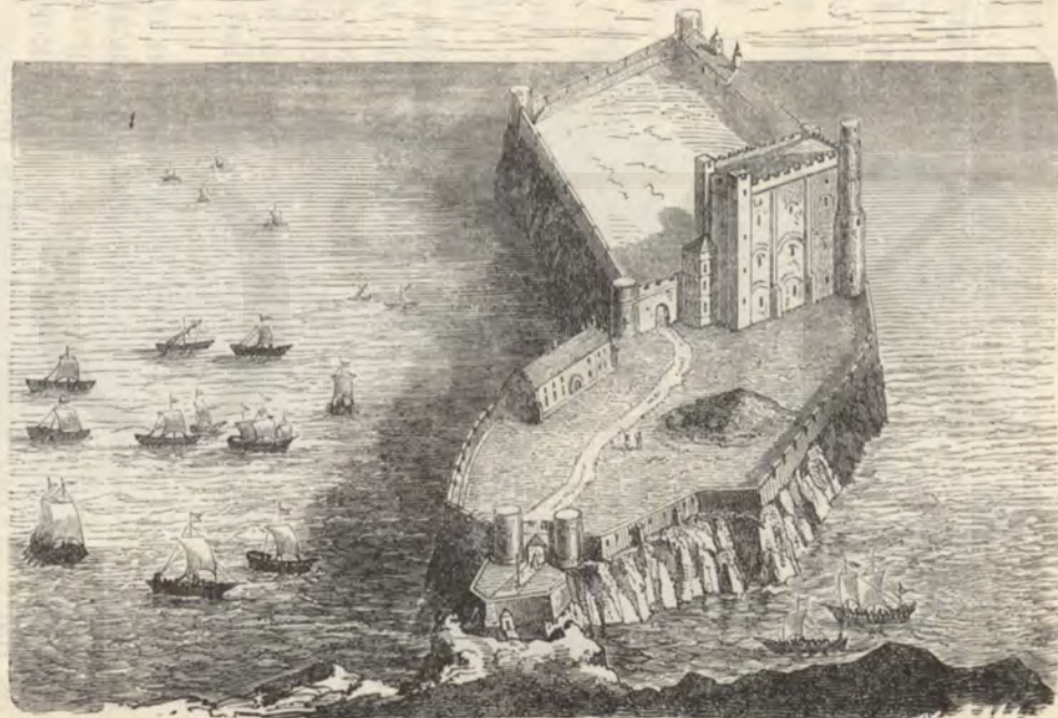
Normann tengerparti vár.