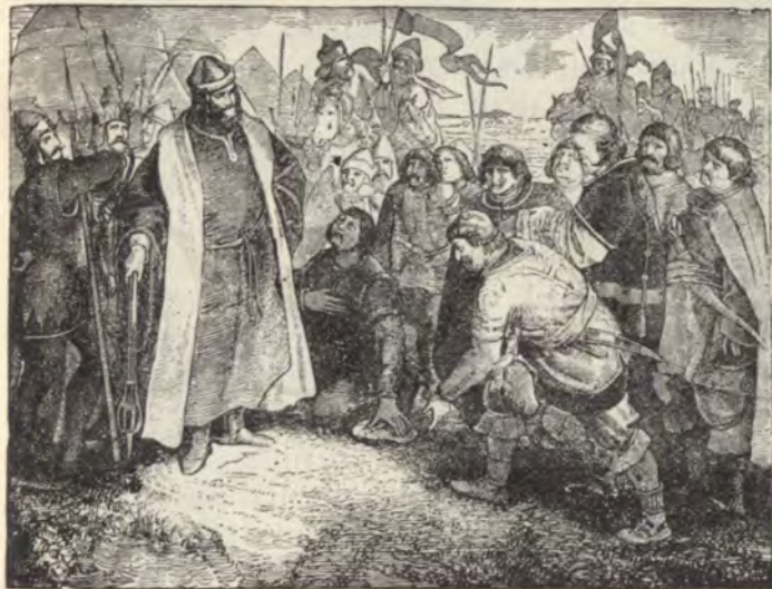
A horvátok meghódolnak Kálmán királynak.

városokat is megszerezze, de a terv nem volt eléggé érett, s Kálmán tudott várni. Egyelőre szövetséget kötött Velenczével, melynek a dogeja a dalmát városok felett a főhatóságot gyakorolta, de kikötötte, hogy a doge a «dal-