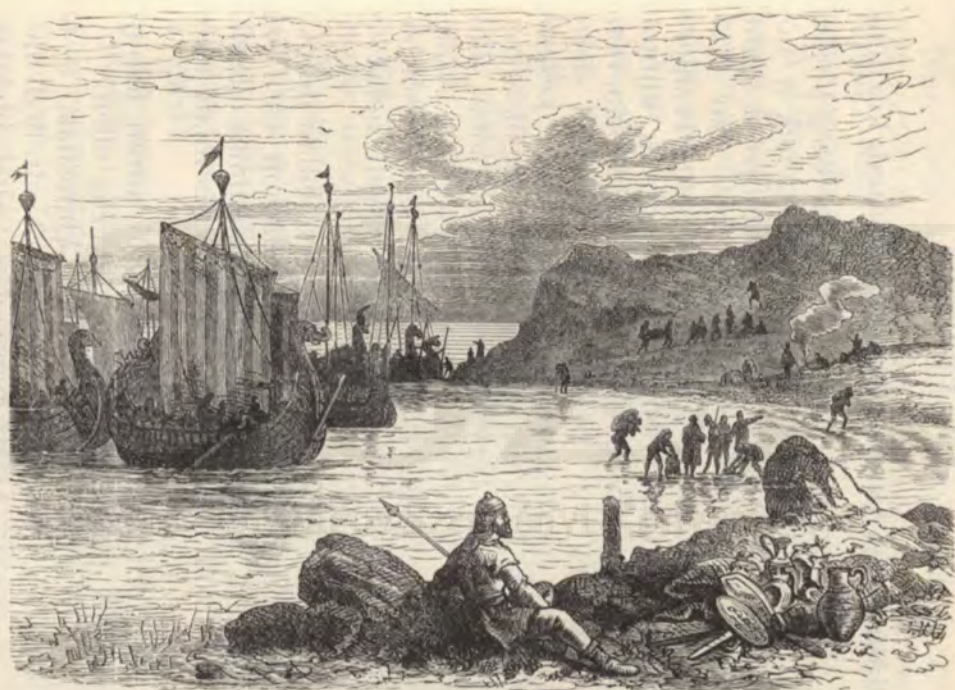
Normann hajók megjelenése az olasz partokon.