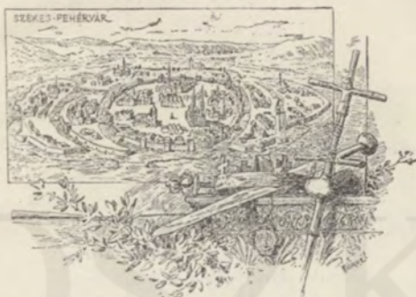
A régi Székesfehérvár.