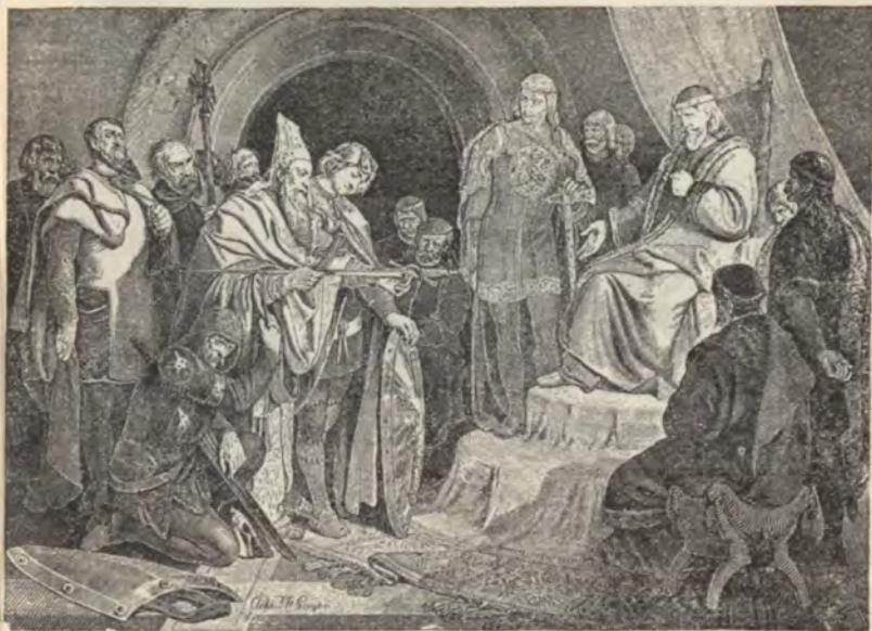
A keresztések felajánlják Sz. Lászlónak a fővezéri kardot.

len horvátokat tovább izgassa. A magyar királynak ez az erélyes fellépése tiszteletre és hódolatra készítette a horvát rendeket, s midőn megtudták, hogy Kálmán Álmos herceget visszaküldötte Magyarországba, megígér-