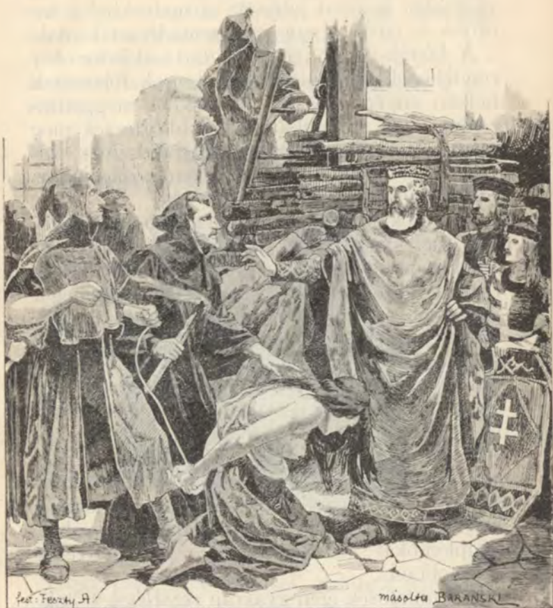
Kálmán király eltiltja a boszorkányégetést.