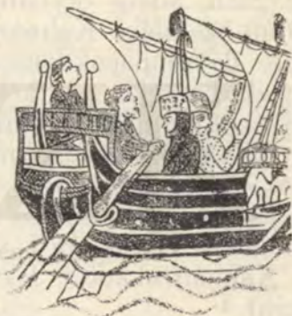
Szentföldre utazó keresztes lovagok.

Kálmán elment a kegyes ünnepségre, de erős kísérettel s azokat rendelte személye körül, a kiknek a hűségében leginkább megbí-