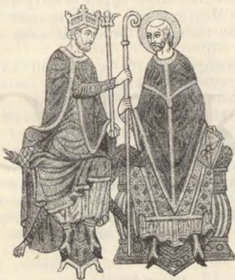
Püspöki investitura a király által.

A szerint, a minő természetű volt a bűn: — negyven naptól hét esztendeig tarthatott a vezeklés.