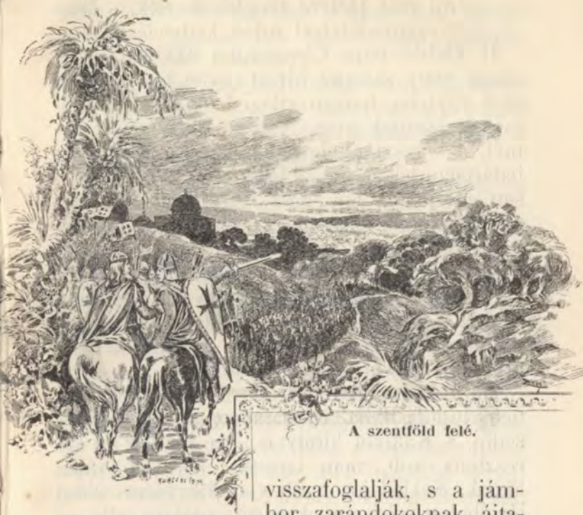
A szentföld felé.

visszafoglalják, s a jámbor zarándokoknak ajtatos ott tartózkodását biztosabbá tegyék.