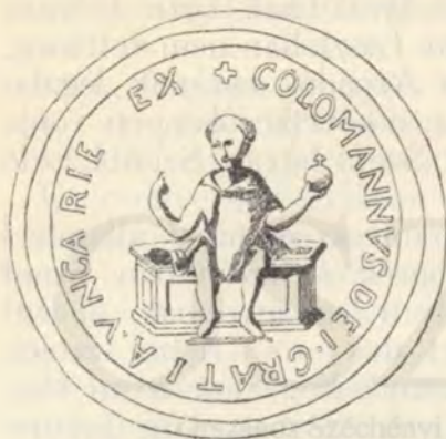
Kálmán király pecsétje.

Ez az elv nyilatkozott Kálmán törvényeiben, s e tekintetben járt Kálmán mintegy úttörő korának összes uralkodói előtt.