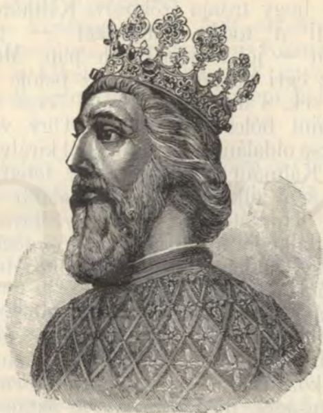
Szent László. (Ereklyetartó.)

megüli a lovat, hogy el tudja röpíteni a nyilat nyargaltában is: erős izmú gyerek, a ki a telt serlegtől sem ijed meg, s vidám czimbora tud lenni bajtársai körében. Igaz magyar vér