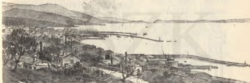
Fiume, mai főikötő városunk az Adriai tengernél.

A przymysli gyalázat emléke még ekkor is bántotta Kálmánt, gondolt is arra, hogy újra hadat vezet Oroszországba, s boszút vesz a kúnokon, de nem tehetette, mert meggyült otthon a baja öcsésével, Álmos herczeggel.