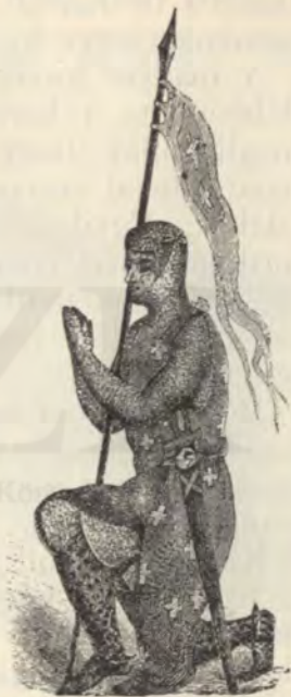
Lovag az első keresztetes hadjáratokban.

Őket nem fogadták Németországban gúny-hahotával, mint ez előbbi szerdék tömegeket, mert minden tekintetben jól felszerelt hadat láttak, ékes ruhájú büszke keresztény lovagokat, akik nyers fenyegetés helyett méltányos kéréssel járultak az útba ejtett országok uralkodóihoz.