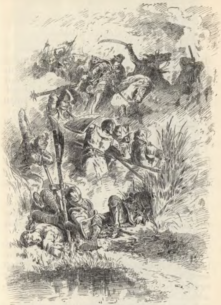
Irtózatos mészárlás kezdődött.