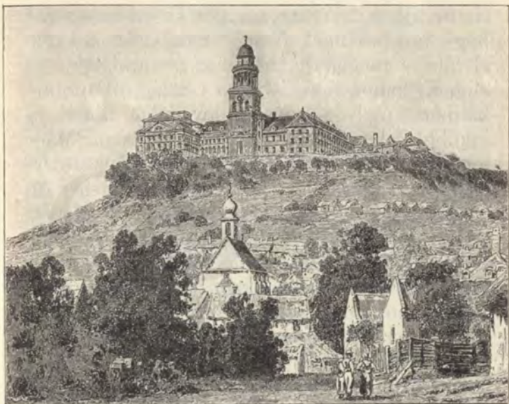
A pannonhalmi apátság.

hogy Kálmán király szerette volna a személyes benyomásból, melyet reá a gróf tesz, kitanulni: vajjon szavában megbízhatik-e? Vajjon nem olyan vezérrel van-e dolga, mint az eddigiek voltak?