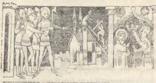
Kálmánt királylyá koronázzák. (A turniesei templom fallfestménye.)

A bölcs király megütközött, midőn híret vette a dolognak, de sokkal igazságosabb volt,