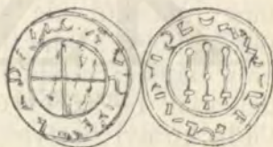
Szent László pénzei.

szágnak is nagy szüksége van, a szarvasmarha-kivitelt szintén korlátozta, de általában megengedte. Igaz, hogy Magyarországon számos ménes volt, de a harcias időkben lóra nálunk is nagy szükség volt, így hát helyes érzék nyilatkozott ebben az intézkedésben is.