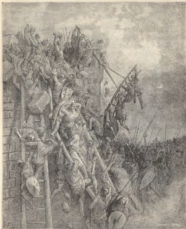
A keresztések Mosony várát vívják.