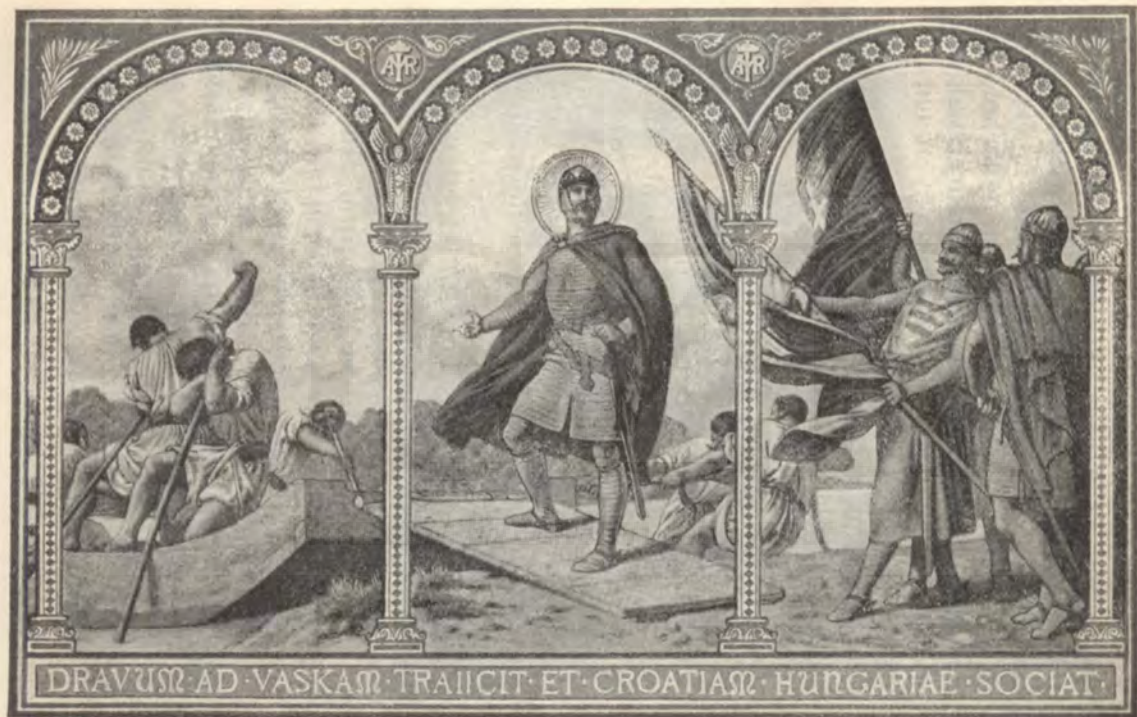
Szent László átkel a Dráván.