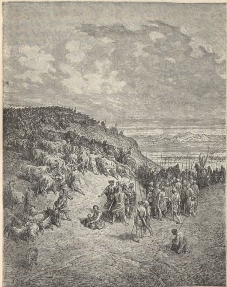
Táborbaszállás a keresztesek ellen.