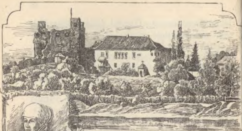
A sárospataki vár és Lorántffy Zsuzsánna.