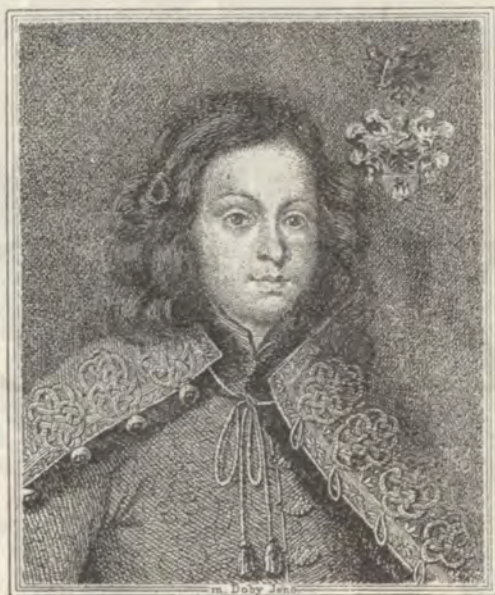
II. Rákóczy Ferencz hét éves korában.

Thököli neszét vette annak, hogy a szultán haragszik reá, s ezért igyekezett, hogy kien-