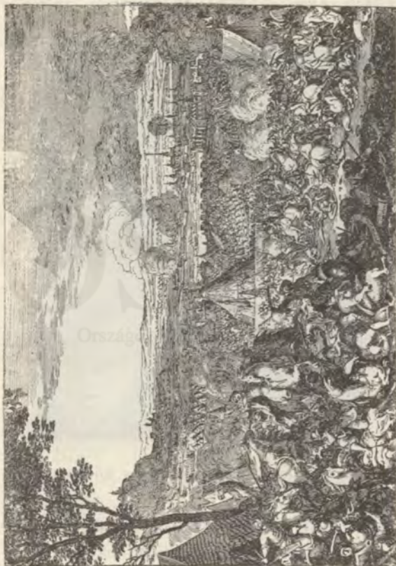
A törökök Bécs alatt.

tekintették a tanácsadó basák a kuruczvezért, a ki az ostromban nem vett részt. Hogy miért