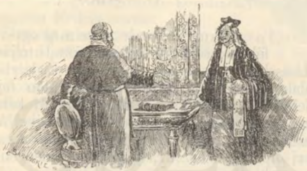
Kollonics bíboros Széchenyi érsekkel.

Hogy mi történt férjével — arról sokáig nem hallott hirt. A napok komor egyhangúsággal teltek. Nem volt rab, kinek kezére bilincset raktak, és mégis rab volt, mert lelkét, szívét nehéz bilincsekbe verték.