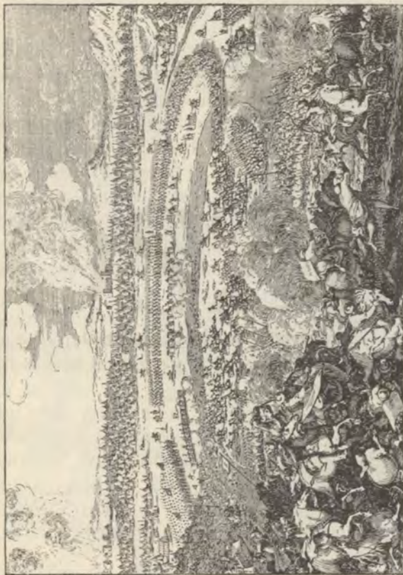
A szentgotthardi csata.

ten nyögték a várakban basáskodó törökök önkényét, az ország többi része nyögött a