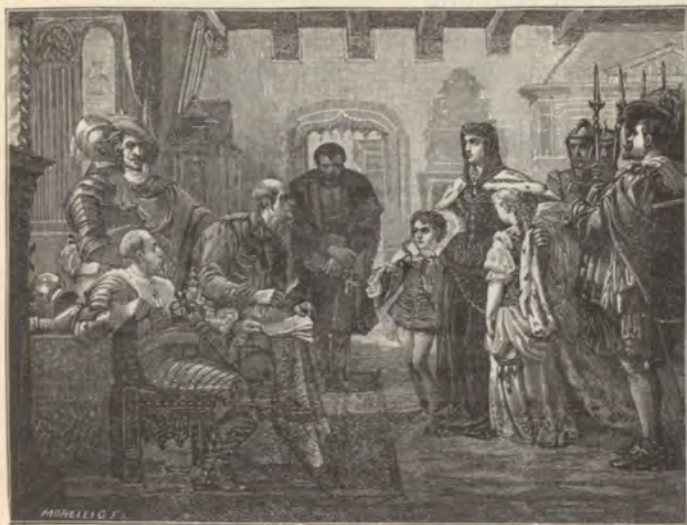
Zrinyi Ilona Bécsben.

den neszre felriadt, s minden pillanatban attól félt, hogy megfosztják őt gyermekeitől. Holmi hiú, lelketlen asszonyt kinosabban érintett volna a megalázás, de Zrinyi Ilona nem volt soha hiú. Láttuk anyai szeretetének nagyságát,