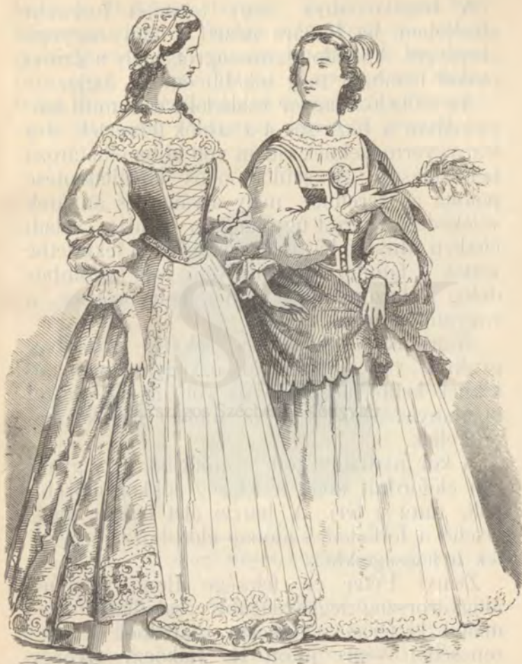
Magyar női viselet a XVII. század végén.