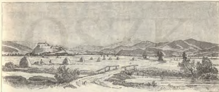
A munkácsi róna.

Élvégre minden simán folyt le, s az udvari