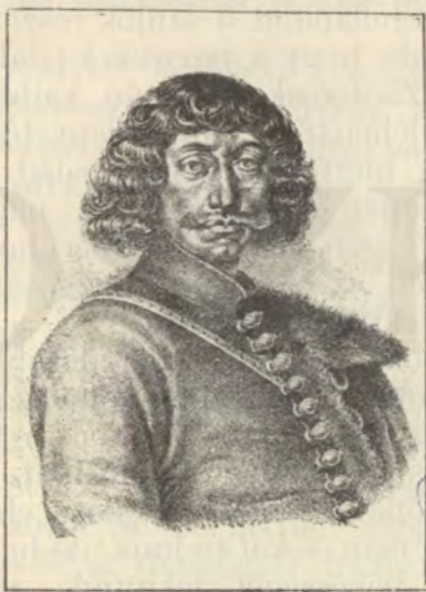
Zrinyi Miklós, a költő.

tudó I. Rákóczy György erdélyi fejedelem házassággal és a maga vagyonszerző rátermettségével nagy anyagi és erkölcsi hatalmat biztosított a családjának. Természetes dolog tehát, hogy a Zrinyi család rokonsága a Rákóczy családhoz igen kívánatos dolognak tetszett.