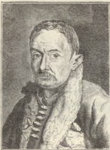
Nádasdy Ferencz országbíró.

Ha eddig nehéz gondokkal kellett is küzdenie, de meg volt lelkének a nyugalma, meg volt zavartalan öröme, látván leánykájá-