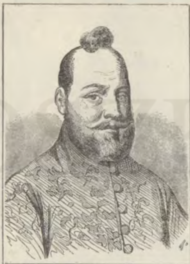
Wesselényi Ferencz nádor.

Péter nem volt alkalmas ember arra, hogy ilyen fontos és kényes vállalatnak az élén álljon. Nádasdy nagyravágyása, Frangepán Katalin hatása férjére Zrinyi Péterre, lassankint hamis ösvényre terelték az összeesküvőket.