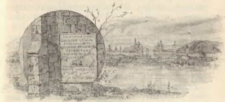
Zrinyi és Frangepán sírköve Bécsujhelyt.

Zrinyi Pétert és Frangepánt Bécsujhelyt, Nádasdyt Bécsben fejezték le. Zrinyi Péter fiát, Boldizsárt, kivitték Bécsbe, hogy ott «egészségesebb» szellemben nevedjék, leányát