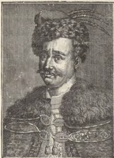
Késmárki Thököli Imre.

— A felkelő kuruczok vezére titkos levelet irt hozzám, s kérte, hogy hallgassam meg emberét,