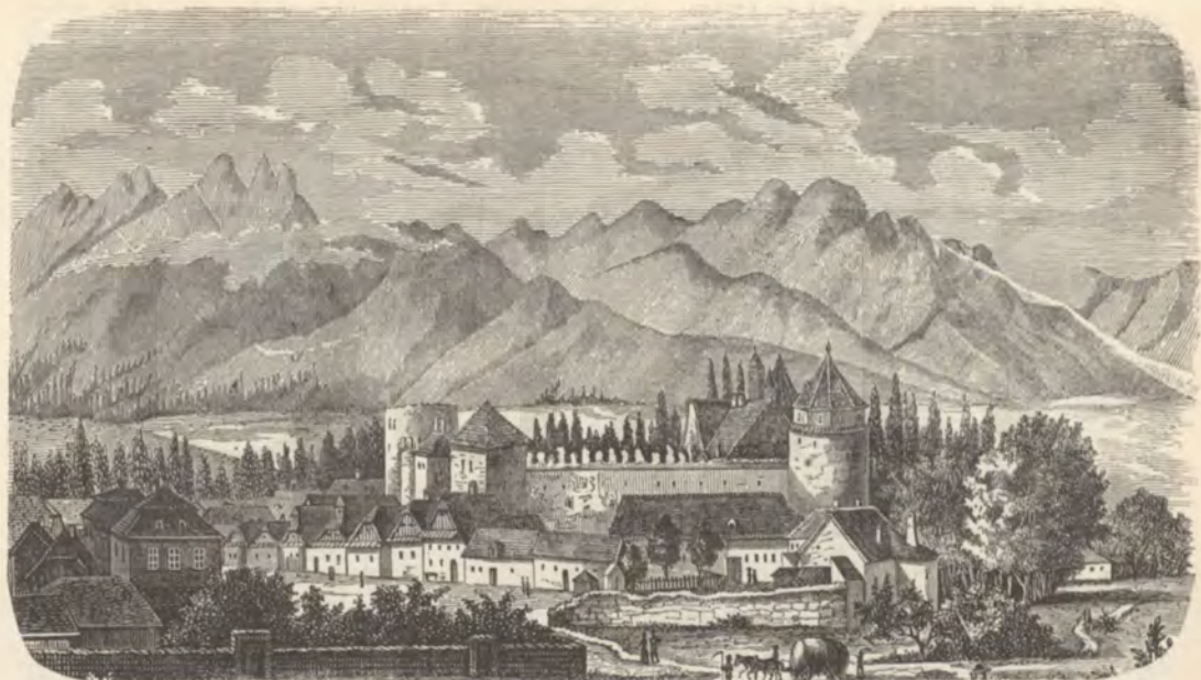
A késmarki Tököly-vár.