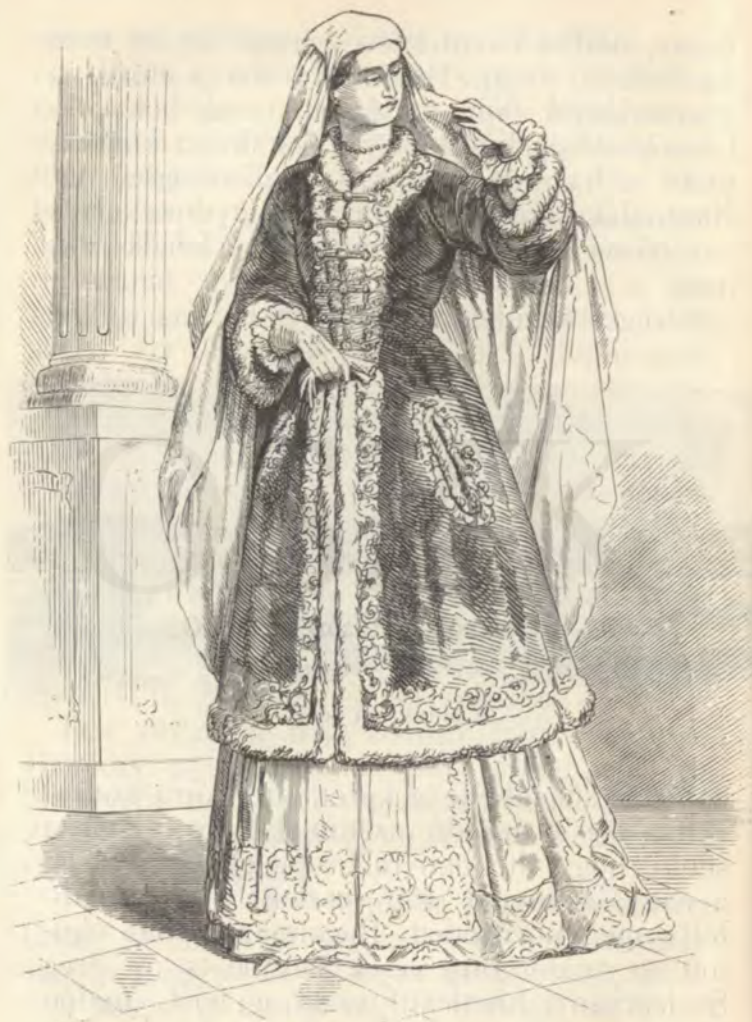
Magyar urasszony Zrinyi Ilona korában.