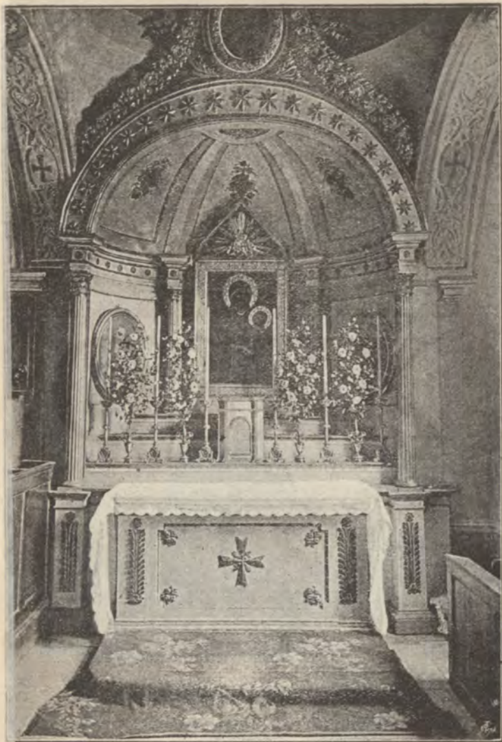
A galatai S. Benoit-egyház oltára. (Alatta a kriptában II. Rákóczy Ferencz és Zrínyi Ilona nyugszik.)