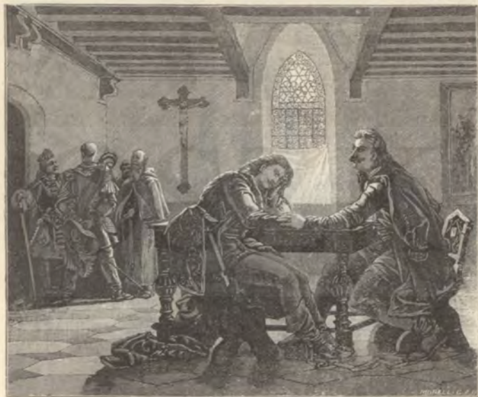
Zrinyi és Frangepán a siralomházban.

Nádasdy és Frangepánnak a tanyája. A nádor özvegye, a hajdan országszerte híres szép Széchy Mária szintén bűnvallomást tett Pozsonyban, s átadta az összes titkos iratokat, a melyek birtokában voltak.