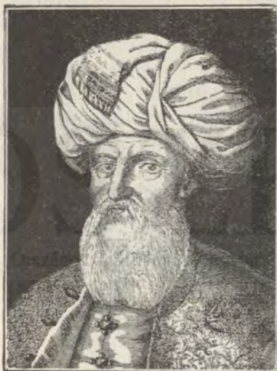
Kara Musztafa nagyvezér.

Ki hitte volna, hogy néhány hónap múlva a hírkoszorúzza Thököli Imrét hallatlan gyátlázat fogja érni? A harczok sikere nem mindig