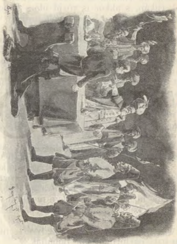
Thököli a nagyváradi basa elfogatta.

A kurucz vezért a nagyváradi basa elfogatta és evvel megkezdődött a Zrínyi Ilona boldogtalanságának időszaka.