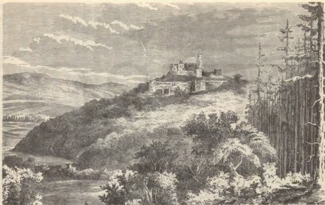
Rákóczy vár romjai Makoviezán.