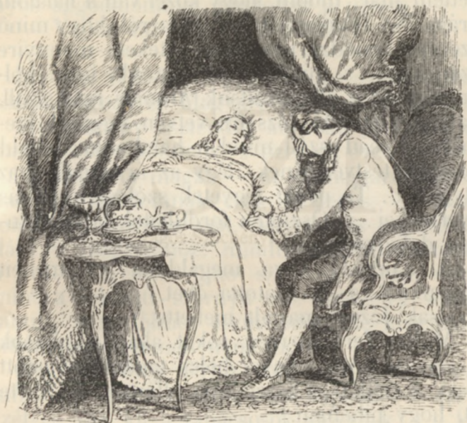
Anyja kezét fogva sirt.

Mária Terézia 1780 nyarán kezdett betegeskedni. Hatvannégy éves volt csak, ámde túlsá-