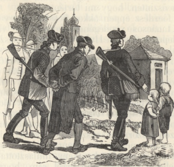
A «felségsértő» parasztot elfogatta.

És mindenki azt várta, hogy József császár szörnyü haragját éreztetni fogja a főerdészszel, annál is inkább, mert már minden előkészület meg volt téve az udvarnál a nagy