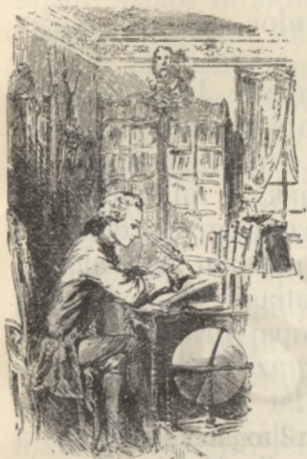
József az íróasztal előtt.

Midőn József tizenegyedik évében járt, új nevelő felügyeletére bízta az anyja. Ez az új szellemi mentor, kinek József uralkodói jellemére a legnagyobb hatása volt: Bartenstein Kristóf , hosszú ideig államkancellár, s Mária Teréziának legbizalmasabb tanácsadója.