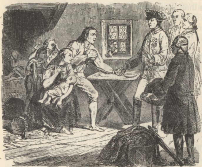
A csehországi inségesek között.

feléje nyujtott kezek mind igazolták a hivatalos tudósításokat. József császár úgy jelent meg az inségesek között, mintha a jó Isten küldötte volna. A legnyomorultabb kunyhó ajtaján is bekopogtatott, hogy szemtől-szem-