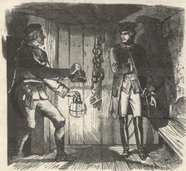
Alacsony szikla-odú volt.

— A rabot lánczoljuk oda, hogy ne mozoghasson.