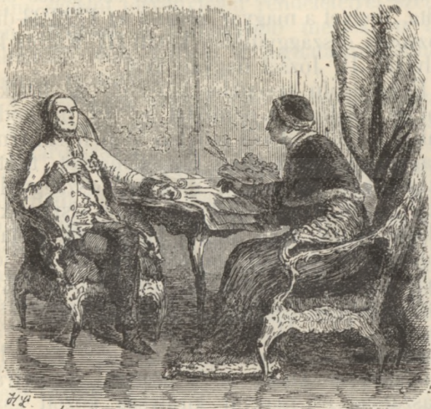
József és VI. Pius pápa.

és méltányos volt, azzal nem kárát, hanem csak hasznát czélozta úgy az egyháznak, mint a birodalomnak. Egy és más lényegtelen, jobbra formai módosításba beleegyezett, de lé-