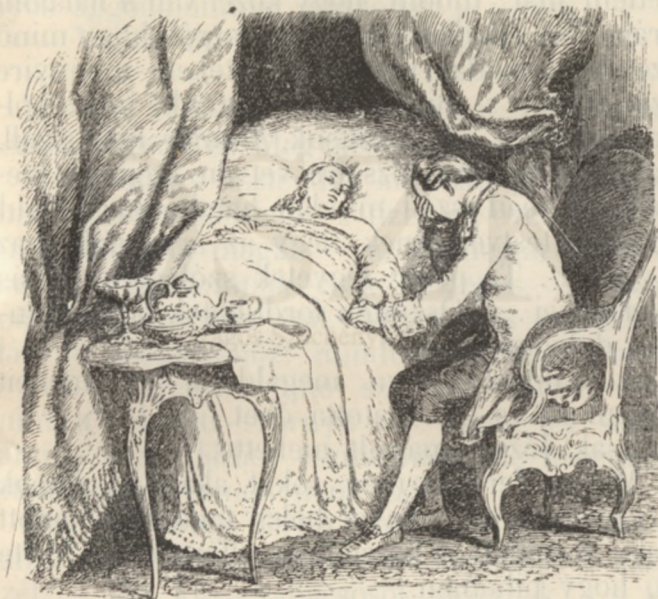
Anyja kezét fogva sirt.

Mária Terézia 1780 nyarán kezdett betegeskedni. Hatvannégy éves volt csak, ámde túlsá-