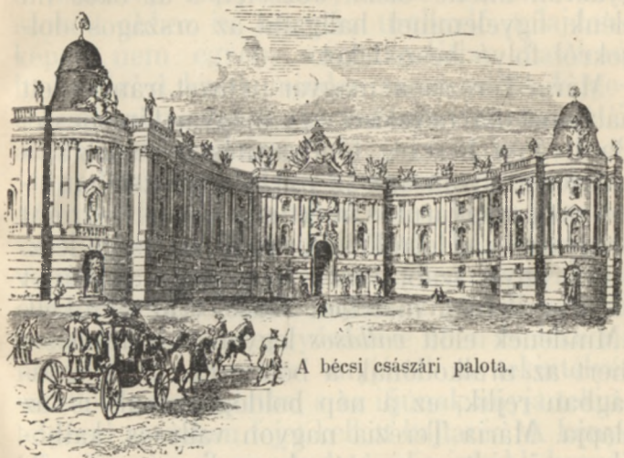
A bécsi császári palota.

A kis gyermek nem is sejthette azt, hogy midőn aranyos bölcsőjében álomba ringatták, a harcz lángja lobogott mindenfelé, s anyja örömkönyvei közé a fájdalom és halálos remegés könyvei is vegyültek a bizonytalan jövő miatt.