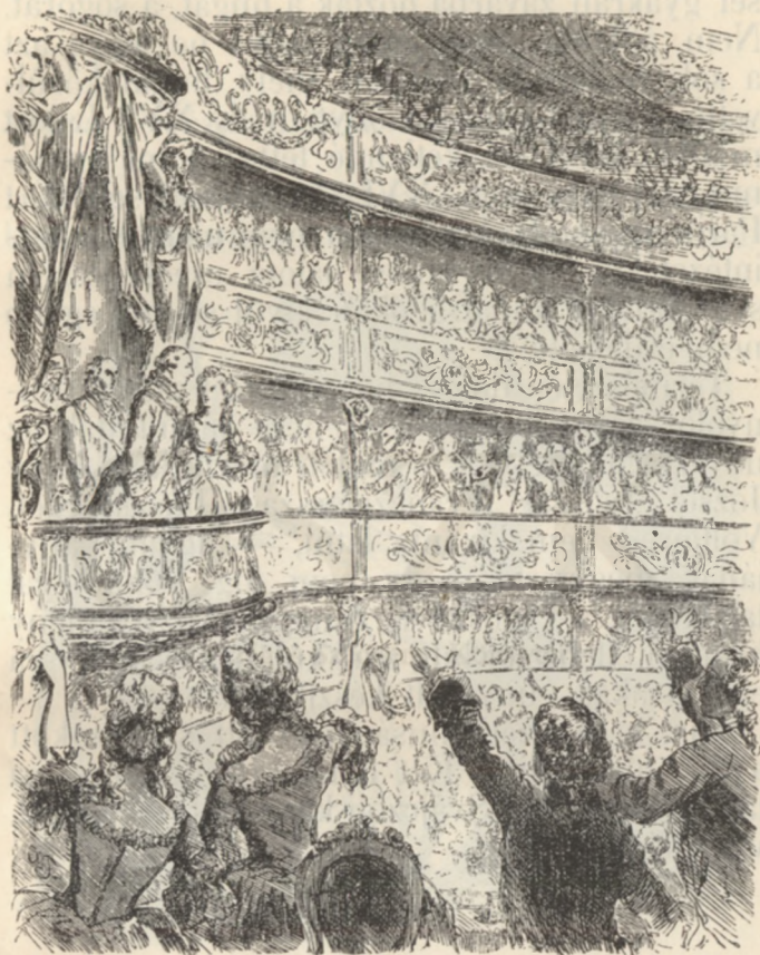
A francziák lelkesedése.

nütt, ámde a kényes királyi udvar, a főnemes- ség még sem tudta őt megszeretni. Egyszerü- sége, igénytelensége szemet szúrt, megjegyzé-