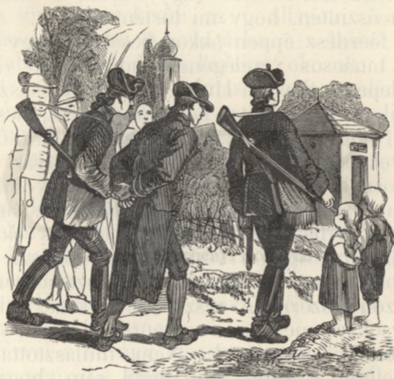
A «felségsértő» parasztot elfogatta.

És mindenki azt várta, hogy József császár szörnyü haragját éreztetni fogja a főerdész-szel, annál is inkább, mert már minden elő-készület meg volt téve az udvarnál a nagy