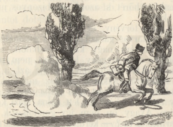
Vitte a lovaslegény a levelet.

A gyászhirot tartalmazó levél végre József császár kezébe került.