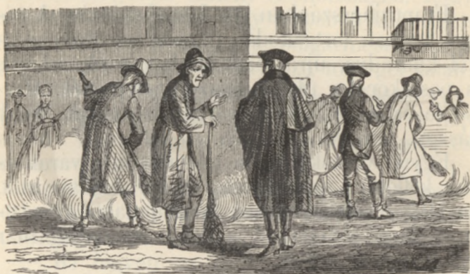
Durva daróc ruhában seberték az utcát.

Mielőtt még császárrá lett volna József, gyakran nyakába vette Bécs utczáit, hogy megfigyelje a népet. Bő fekete köpenyt akasztott a nyakába, s a ki őt nem ismerte, bizony nem tudta, hogy a halvány arczú ifjú, a ki