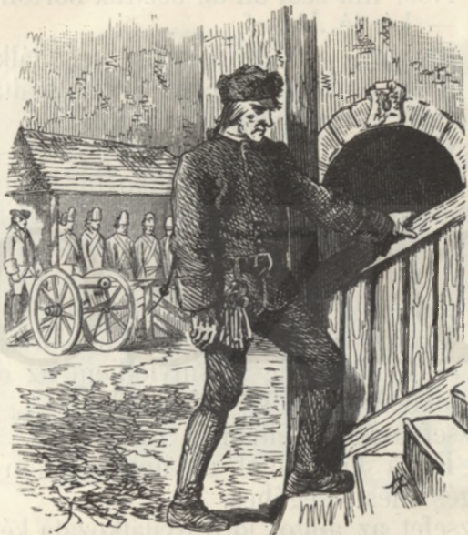
A porkoláb engedelmeskedett.

jött a nehéz kulcsesomóval, s bámulva nézett a ritka vendégre.