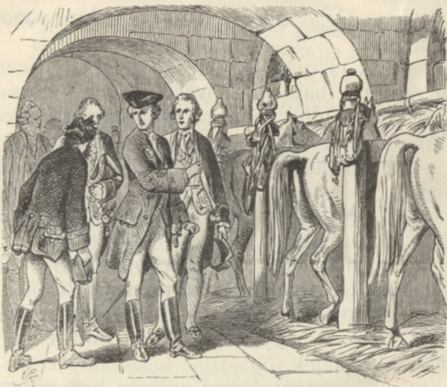
Szemébe ötlött a két gyönyörű állat.

— Add el nekem a lovaiddat! Adok értök háromszáz tallért.