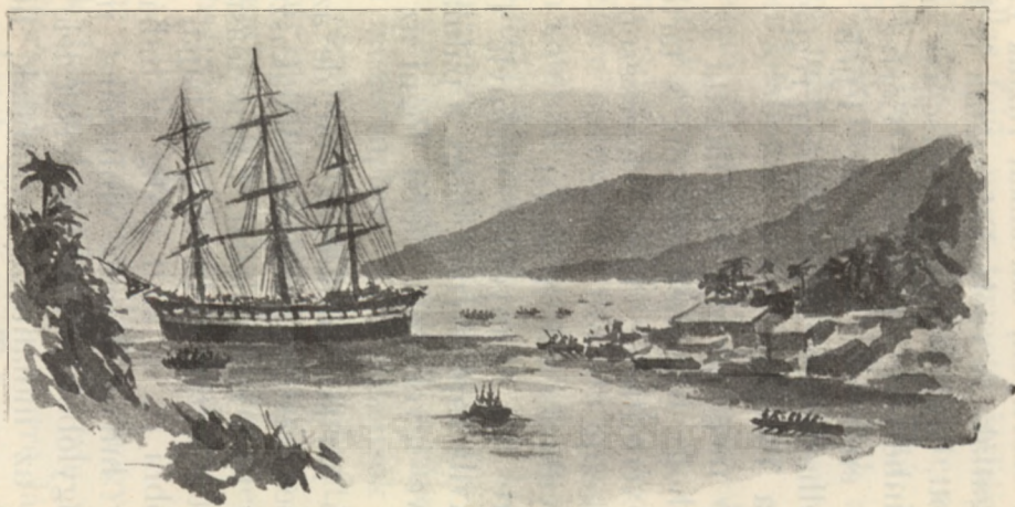
Tömerdek csolnak vette őket körül.