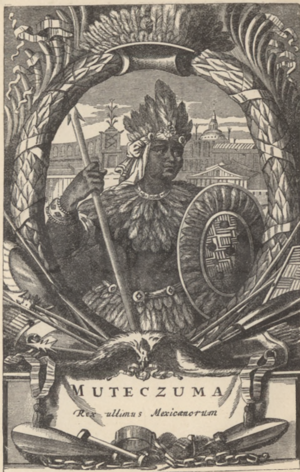
MONTECUZUMA, MEXICO UTOLSÓ KIRÁLYA.