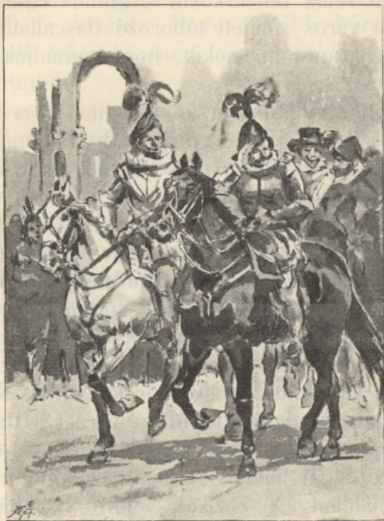
Bevezették Cortezt és seregét a városba.

a spanyolok hiába várták az élelmiszert, a városbeliek megteledeztek róluk. Cortez valatóra fogta a kazikákat, a papokat, s a papok