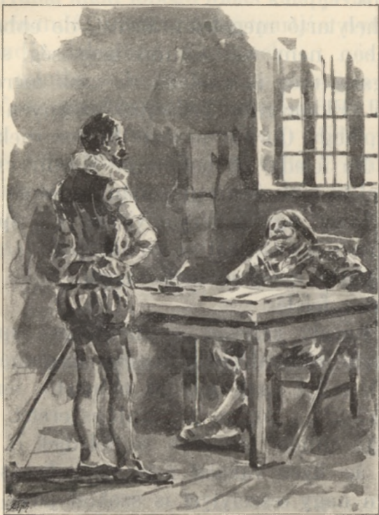
Cortez a helytartónál.

vetek. Volt elegendő támadó és védő fegyver, lőpor, kard, lándzsa.