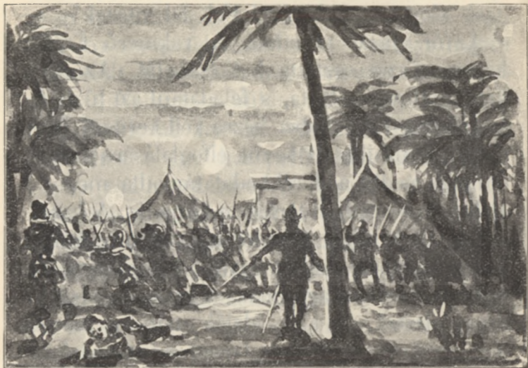
Koromsötét éjjel történt a támadás.

Ekkor a vezér a hajókat kerítette hatalmába. Narvaezt biztos fedezet alatt Vera-Cruzba küldötte és ápoltatta, a meghódolt spanyolokkal