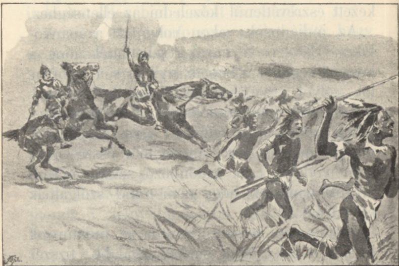
A kis csapat a pálmafák közül előrobogott.

A jámborok a lovast és a lovat egy embernek, még pedig csoda-embernek tartották. A vakmerő Cortez útat tört magának és kis-