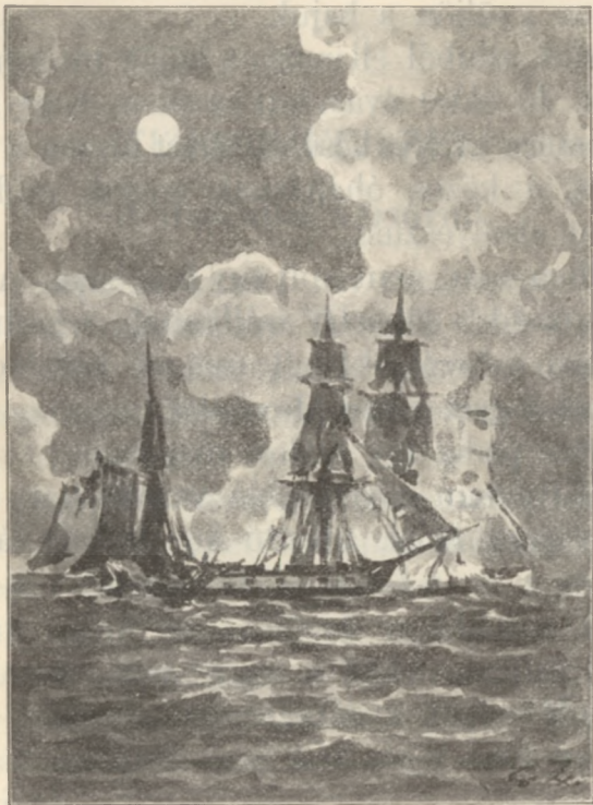
Meggyújtották a hajókat.

Másnap a sereg nagy része sürgősen követelte a vezértől, hogy a hajókat semmisíttesse