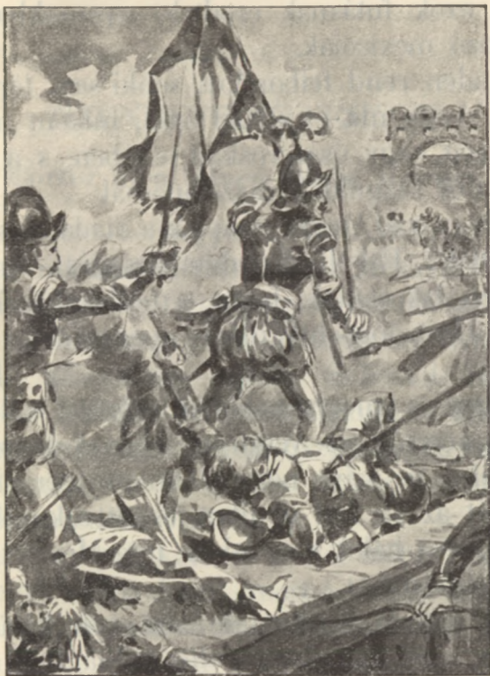
A híd megrohanták a mexicóiak.

talom, mely őket visszaszoríthatta volna. Sokan hullottak be a tóba, s hallatszott rémült kiál-