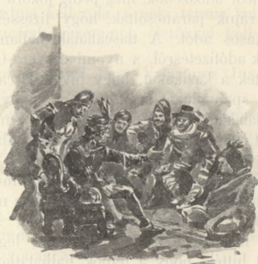
Ötödmagával elment Montecuzumához.

Ötödmagával elment Montecuzumához, mint-ha csak tiszteletteljes látogatást akart volna nála tenni. Szemére lobbantotta, hogy minő ellensége ő a spanyoloknak, holott színből a barátságát mutatja. Kérte, hogy menjen velök