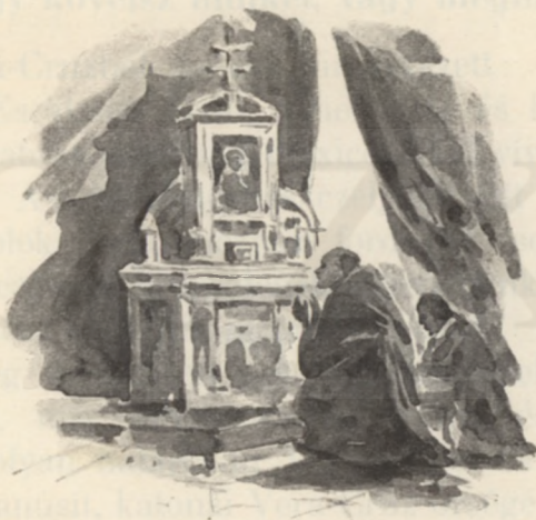
Térdre borulva adtak hálát Istennek.

Cortez óvatos volt. Világért sem akarta elárulni, hogy mi a titkos szándéka. Montecuzumától csak azt az egyet kérte, hogy a spanyolok számára is építhessen oltárt abban a