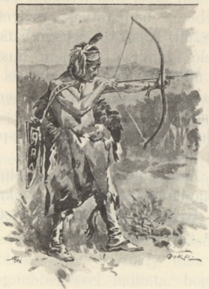
Tanította a harczolás mesterségében.

nákat tanította a harczolás mesterségében, fegyelemhez szoktatta; az új hajók felszereléséről gondoskodott, a vera-cruzi őrseget szemmel tartotta, s tele volt reménykedéssel. Egy