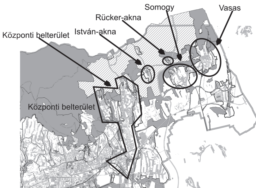
1. térkép: Pécs – Kelet veszélyeztetett területei

Pécs Megyei Jogú Városa 2008-ban Integrált Városfejlesztési Stratégiát készített. A Stratégia egyebek mellett lehatárolja a szociális városrehabilitációs akcióterületet is; az akcióterület pontosított lehatárolását ábrázolja a fenti térkép.