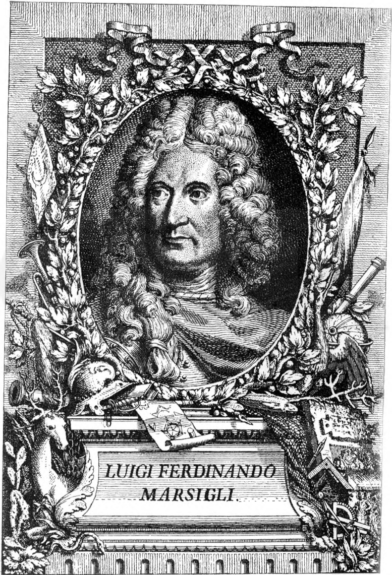
LUIGI FERDINANDO MARSIGLI.